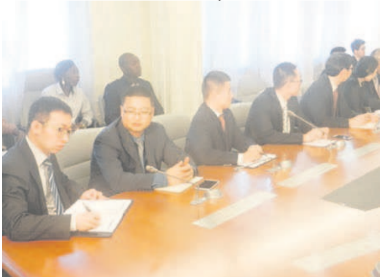
Les experts chinois lors de la séance de travail avec le ministre de l'aménagement du territoire

« Nous sommes plus confiants à la faisabilité des études de la zone économique de Pointe-Noire. Nous avons passé en revue les problèmes liés à la réalisation de ce projet, notamment la fiscalité, l'environnement... », a déclaré le chef de cette délégation, le Pr. Qu Jian. S'adressant au cours d'un