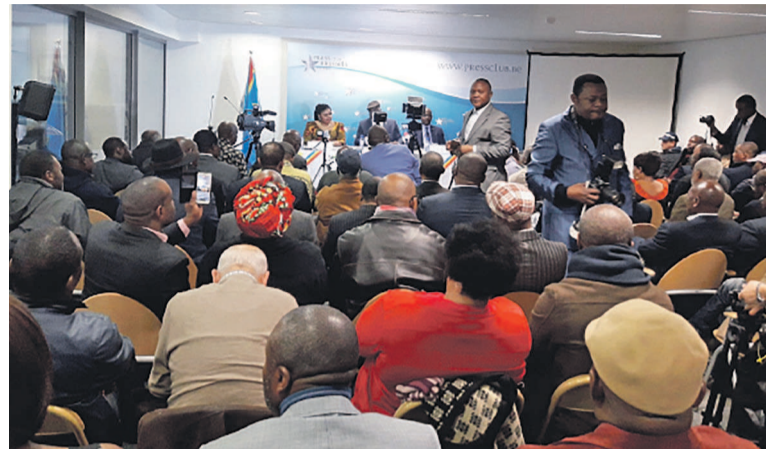
Une vue du public présent

Pour ce qui est du dialogue réclamé par l'UDPS, il a fait savoir que ce dernier est déjà en cours, ou du moins qu'on est dans les prémisses de ce dialogue, dans la mesure où la Conférence épiscopale nationale du Congo a pris