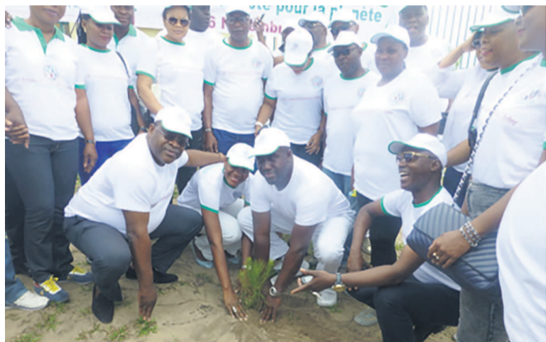
Les membres de l'AINV en plein planting

Le 6 novembre de chaque année, les Congolais plantent les espèces variées d'arbres dans le but de lutter contre la déforestation.