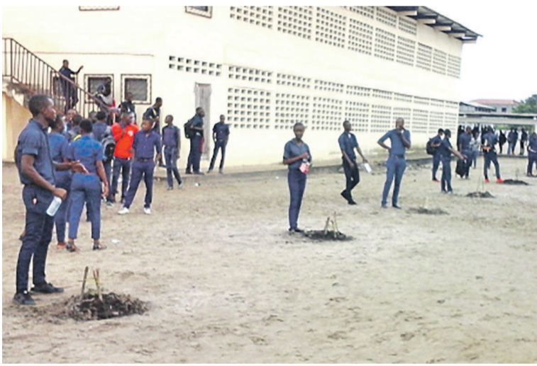
Les élèves pendant le planting

autres le bien fondé de genre de geste », a indiqué le proviseur. Et pour plus de respect du geste accompli, chaque arbre a été baptisé du nom de l'élève qui l'a planté. Un fait que le proviseur du lycée espère qu'il suscitera plus de considération des élèves pour ces