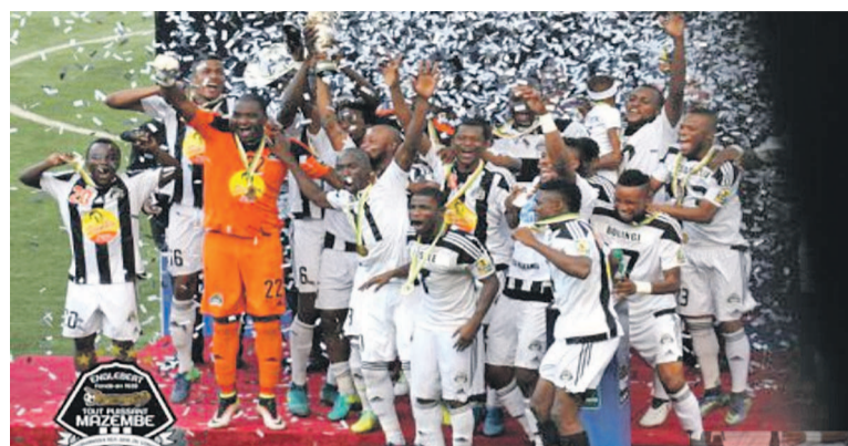
TP Mazembe, vainqueur de la 13 e Coupe de la Confédération