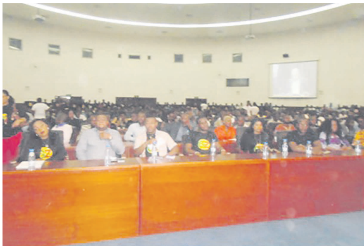
Une vue des jeunes lors de l'assemblée générale de GZ

L'association Génération Z (GZ) a tenu, le 6 novembre à Brazzaville, une assemblée générale avec les jeunes brazzavillois. Objectif : écouter les jeunes, recueillir leurs doléances, mais aussi et surtout les inciter à la créativité afin que leur vie future soit meilleure.