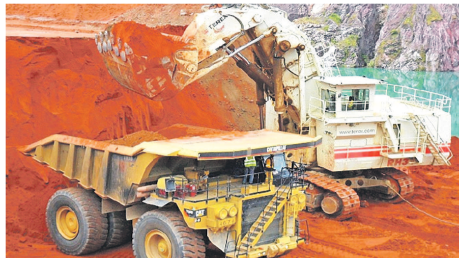
Les engins travaillant dans une mine.

Dans une étude sur les obligations sociales en rapport avec les infrastructures de base, cette organisation évalue la contrepartie pour les communautés locales impactées par les activités des entreprises minières Kamoto Copper Company (KCC) et Sino R Congolaise des mines (Sicomines).