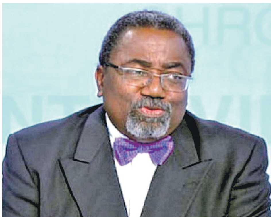
Ambassadeur extraordinaire et plénipotentiaire du Congo en France, Rodolphe Adada