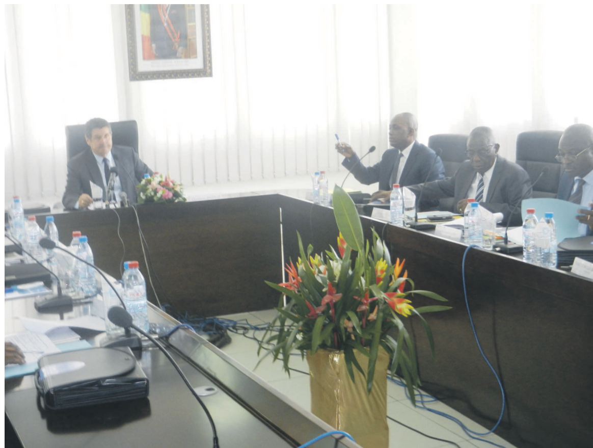
Une vue des membres du Conseil d'administration de la CNSS

Il y a également des créances immobilières (3.912.513.616 francs de CFA) et financières (81.446.963.563 de francs CFA), ainsi que des arriérés de prestations sociales de plus de 123 milliards de francs CFA. Le conseil d'administration de la CNSS a aussi relevé un déficit de la branche des pensions entre 2012 et 2015 de l'ordre de 14.297.561.628 de francs