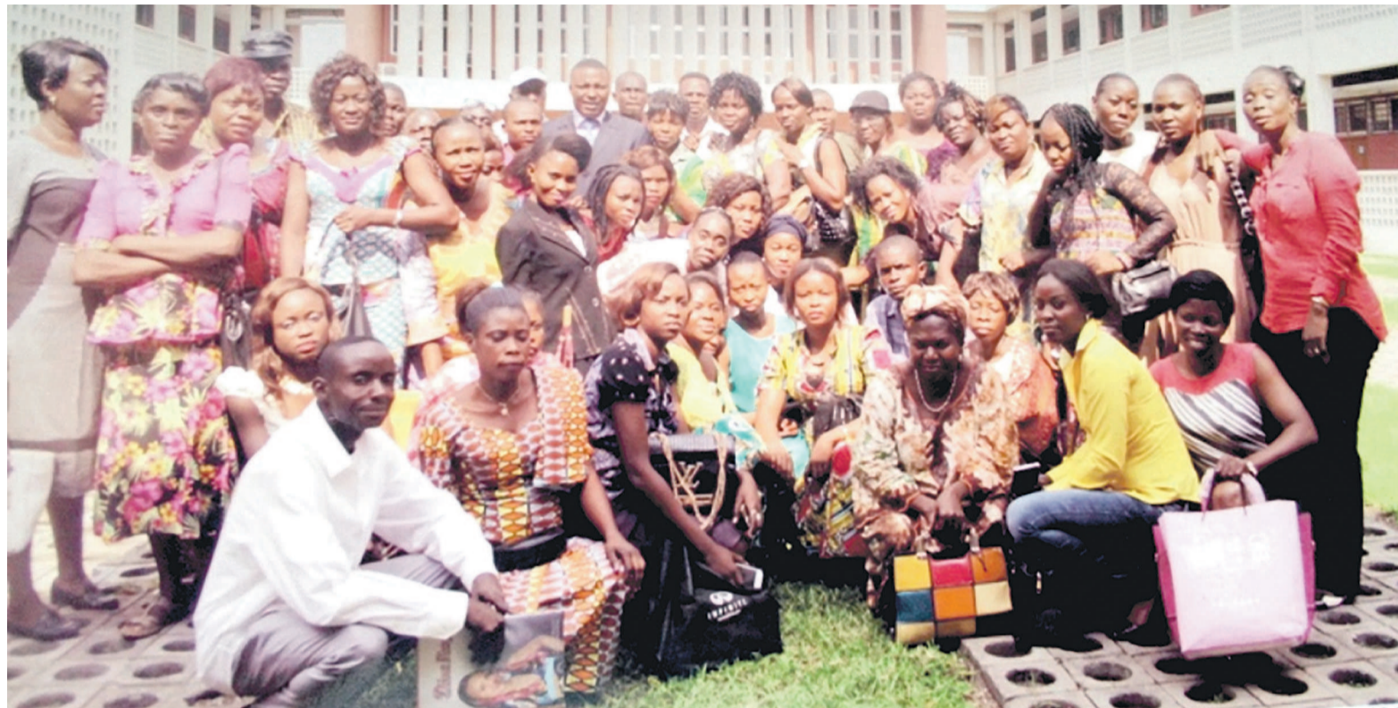
Photo de famille des membres de l'AIV/RDC