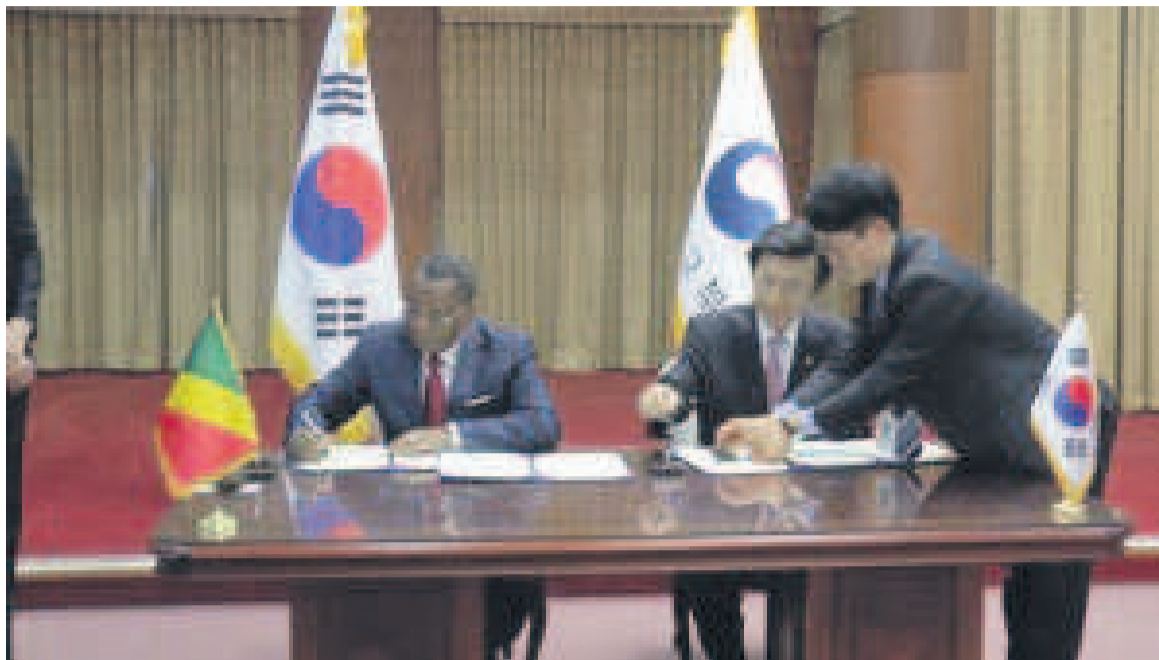
Signature du mémorandum par les deux ministres

Au Congo, et ailleurs en Afrique, la Corée du Sud est présente à travers Koïca, son Agence de coopération internationale. Ses actions sont visibles telles : les bourses de formation qu'elle a offertes au gouvernement congolais au titre de l'année académique 2016. L'équipement du laboratoire de langues du ministère des Affaires étrangères à Brazzaville est l'œuvre de Koïca qui, récemment,