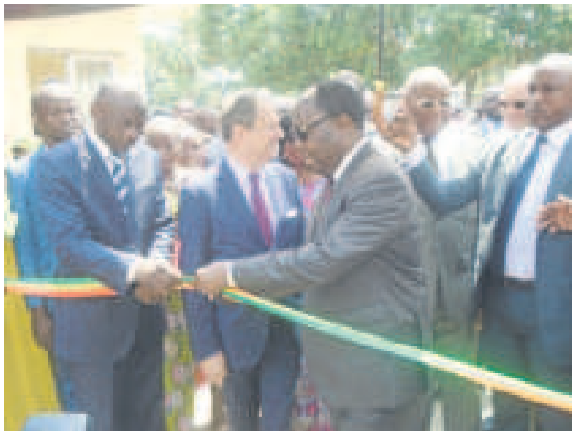
Le Premier ministre coupant le ruban symbolique

Celui de Pointe-Noire forme aux métiers de la maintenance industrielle à savoir, les systèmes métalliques et hydrauliques ; les ouvrages métalliques et soudure ; les équipements Froid et climati-