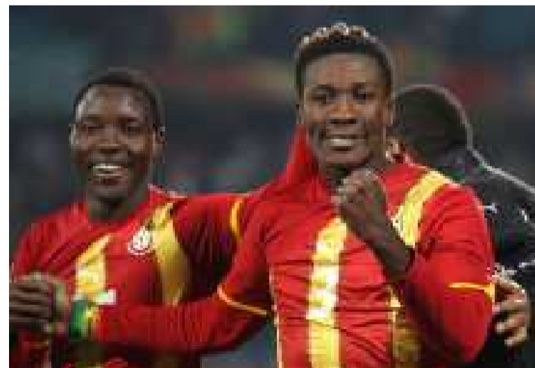
Pour son déplacement en Egypte, le Ghana sera privé de Kwadwo et Gyan Asamoah, deux de ses stars

Défenseurs : Harrison Afful (Columbus Crew/Etats-Unis), Andy Yiadom (Barnsley/Angleterre/2 e division), Baba Rahman (Schalke 04/Allemagne), Jeffrey Schlupp (Leicester City/Angleterre), John Boye (Sivasspor/Turquie), Jonathan Mensah (Anzhi Makhachkala/Russie), Daniel Amartey (Leicester City/Angleterre),