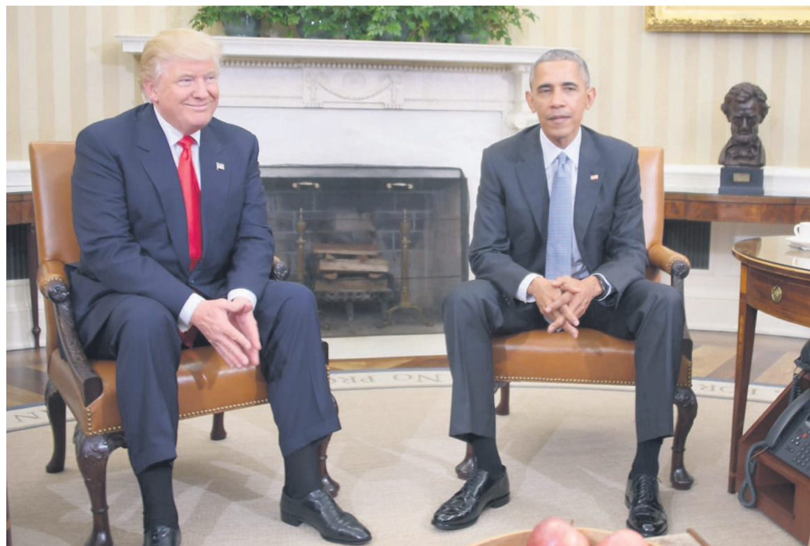
Donald Trump et Barack Obama

Insistant sur l'importance « du respect des institutions, de la loi » et « du respect les uns pour les autres », il a dit espérer que le milliardaire populiste soit fidèle à l'esprit de ses premiers mots - rassembleurs et apaisés - après la victoire. L'élection surprise de Donald Trump, portée par la colère d'un électoral se sentant ignoré des élites et menacé par la mondialisation, a brisé les rêves de la démocrate Hillary Clinton, que tous les sondages donnaient gagnante, de devenir la première femme à accéder à la présidence. Mais elle menace aussi le bilan de Barack Obama (climat, assurance-santé, libre-échange...) dont la cote de popularité est, cruel paradoxe pour lui, au