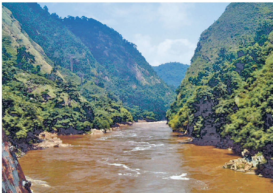
Une vue du paysage non loin du site du barrage de Sounda