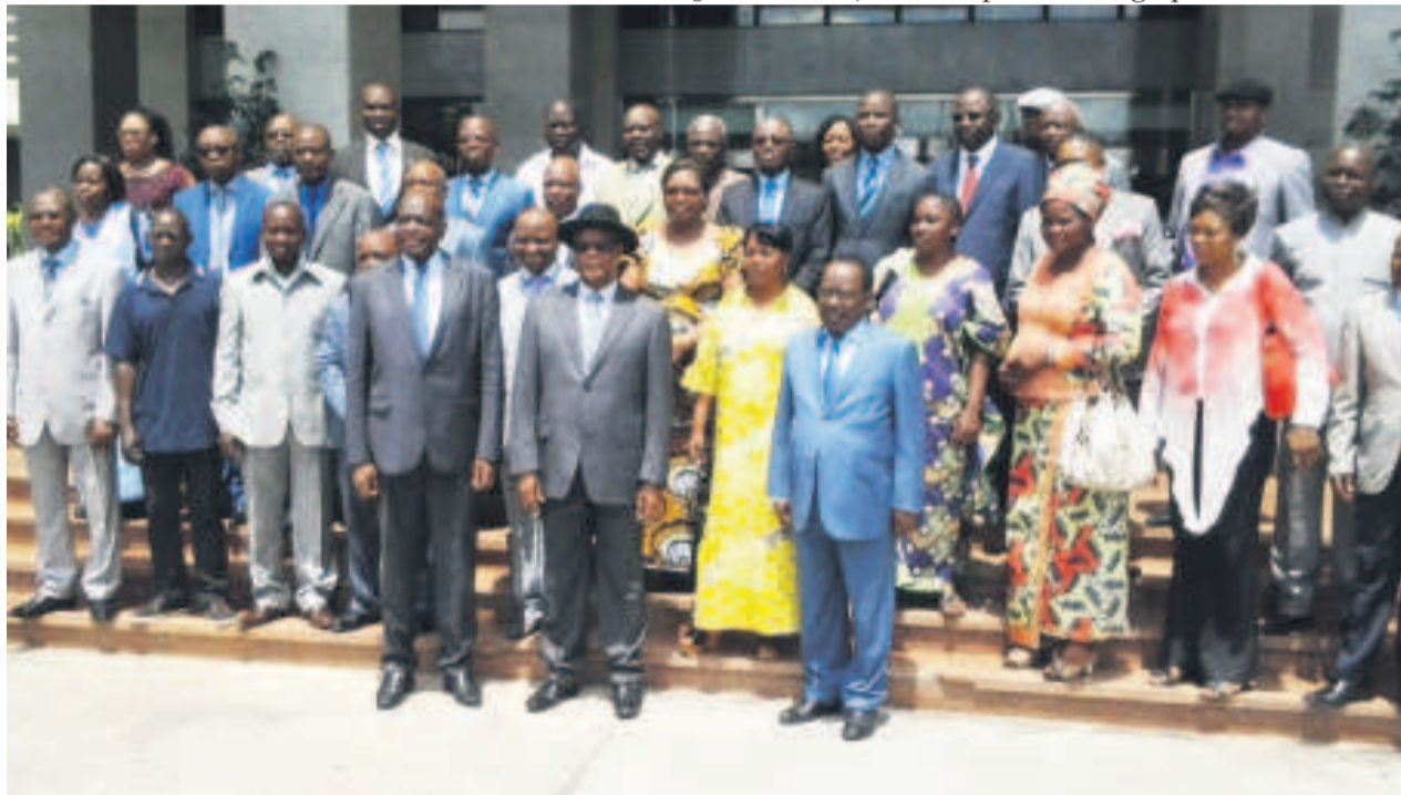
Le ministre Henri Djombo posant avec les membres du comité de pilotage

Signalons qu'un nouveau projet de développement agricole est en préparation entre le gouvernement congolais et la Banque mondiale. Plus spécifique, ce programme aura pour objectif d'apporter une assistance financière notamment aux opérateurs agropastoraux afin de