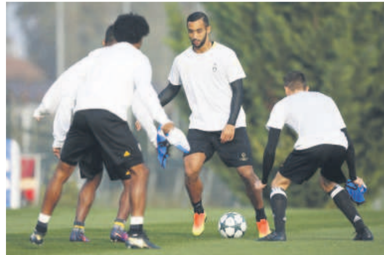
Le Turinois Mehdi Benatia, absent contre le Gabon, est de retour pour recevoir le champion d'Afrique ivoirien