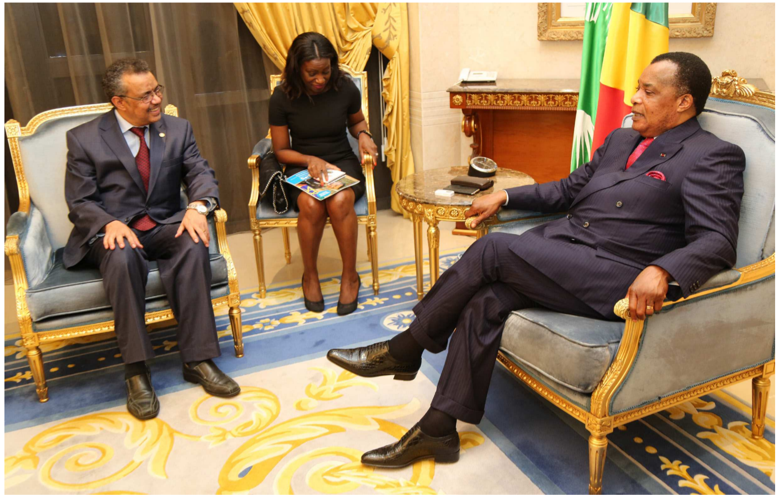
Tedros Adhanom Ghebreyesus reçoit le président Denis Sassou N'Gusso

capacité des autorités nationales à détecter, prévenir et gérer les