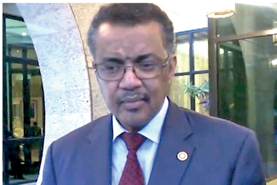
Tedros Adhanom Ghebreyesus