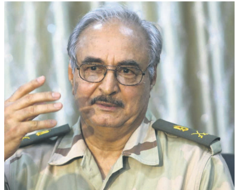
Le général libyen Khalifa Haftar

avait pour but de chercher le soutien militaire de la Russie, pays dont les instructeurs sont présents en Libye en sa faveur. « Il est venu demander que la Russie s'engage dans une opération militaire similaire à celle menée en Syrie », précise une source. Pour certains observateurs, cette requête du général sera difficile à satisfaire sur le plan diplomatique, puisqu'un em-