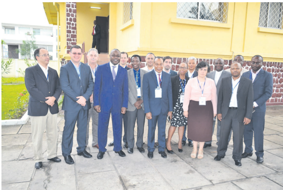
La photo de famille

« L'ambition du président de la République est de faire du Congo une société de technologie de l'information et de la communication. Heureusement, nous avons déjà des infrastructures. La réunion permet d'optimiser le travail qui se fait en ce mo-