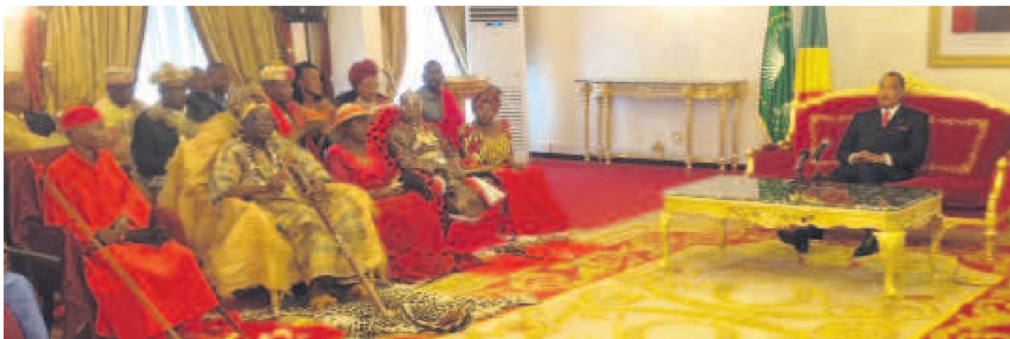
Le président Denis Sassou N'Guesso et ses hôtes

Les rois Makoko (Mbé), Mâ Loango (Diosso), Ngambom' (Mbaya), la reine Ngalifourou (Ngabé) ainsi que les sages du Congo étaient, lundi 28 novembre, au Palais du peuple, pour des entretiens avec le président Denis Sassou N'Guesso, en marge de la célébration du 58e anniversaire