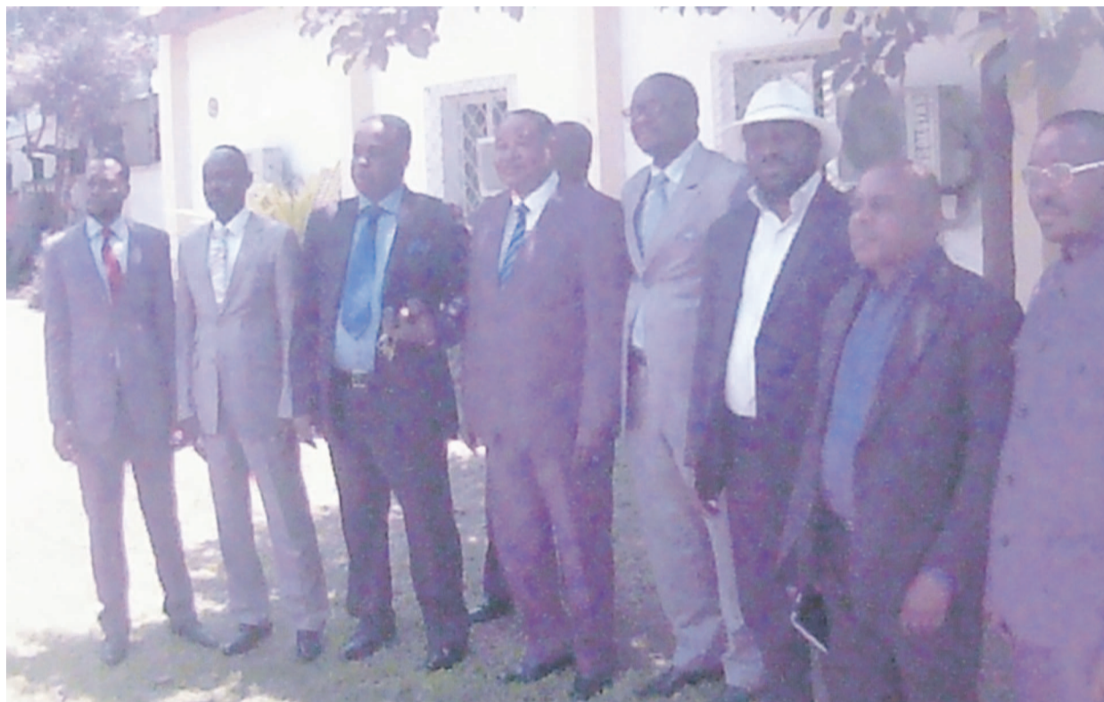
Les présidents des partis ayant signé l'accord

Et d'ajouter, « Durant un an, nous avons mené notre action politique dans le cadre de l'Alliance de l'opposition démocratique. La constance de nos prises de position nous a placés à un niveau appréciable qui a permis de rehausser l'image d'un groupement politique responsable et clairvoyant. Comme membre du pôle du