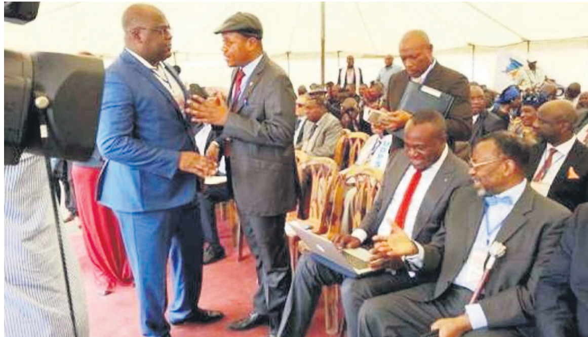
Des participants au conclave du Rassemblement à Limete

Un document attribué à ce regroupement politique mis récemment en ligne et relayé par divers sites sur le Net confirmerait l'acceptation par Étienne Tshisekedi et ses pairs d'une probable cohabitation avec Joseph Kabila pendant la transition. Deux cadres