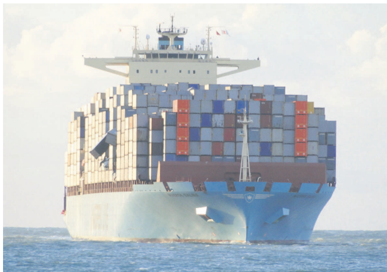
Un navire en mer

« En dépit de son impact indéniable dans l'organisation de l'économie maritime d'un pays, cette innovation ma-