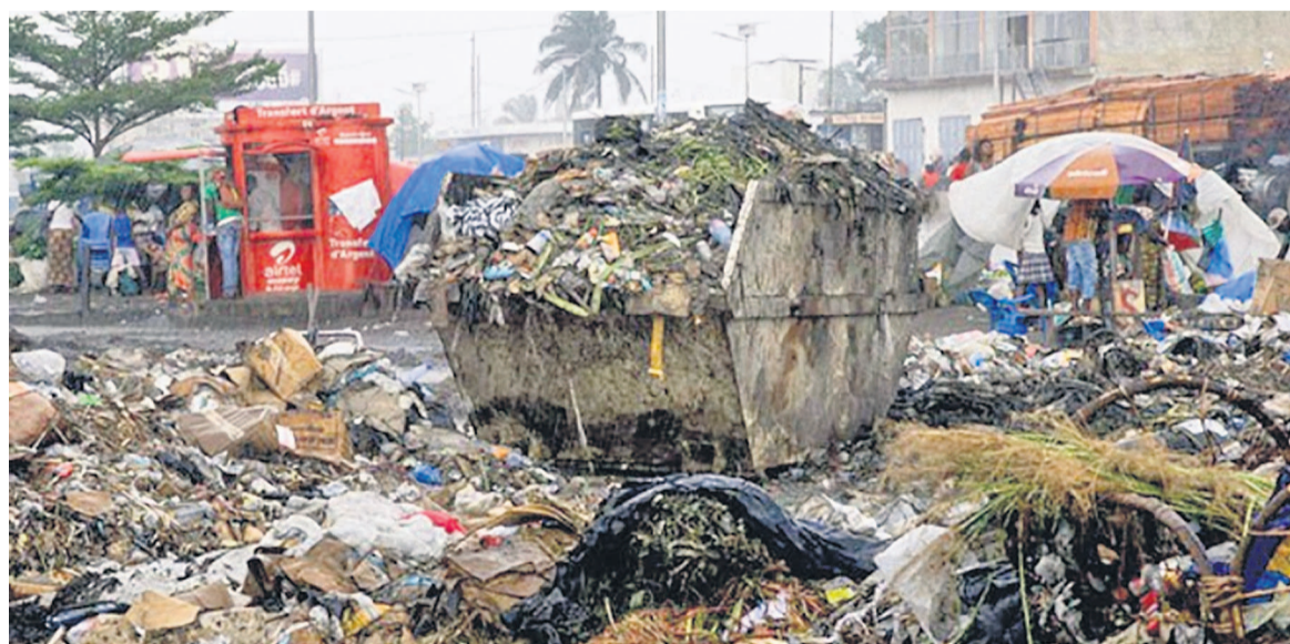
Les immondices à Kinshasa, agent de réchauffement climatique dans la capitale de la RDC

Plusieurs études révèlent que les pays africains devraient être