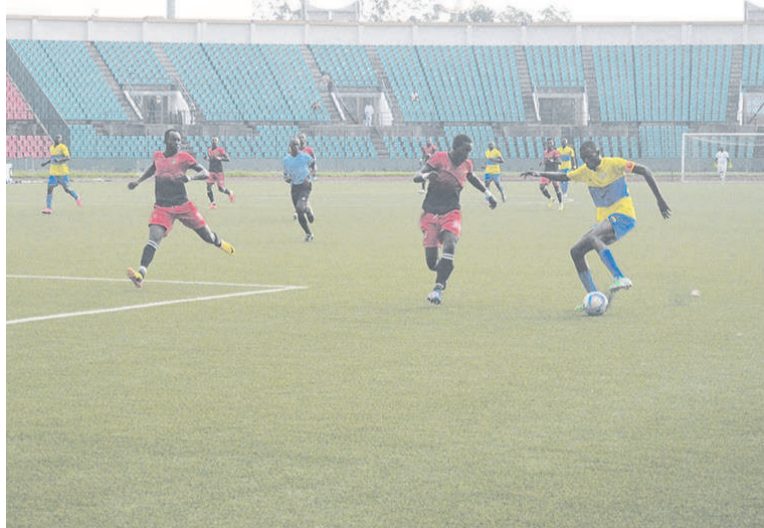
Une offensive de JST

Après deux jours de pause, les joueurs remettront leurs crampons le mercredi 25 janvier. A Massamba-Débat, SMO et Etoile du Congo seront aux prises. Ensuite, Diables noirs et JST en découdront tandis que Les Jeunes fauves feront le déplacement de Pointe-Noire où ils seront reçus