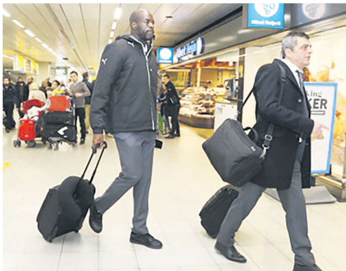
Christopher Samba quitte la Grèce en attendant un éventuel retour en Angleterre