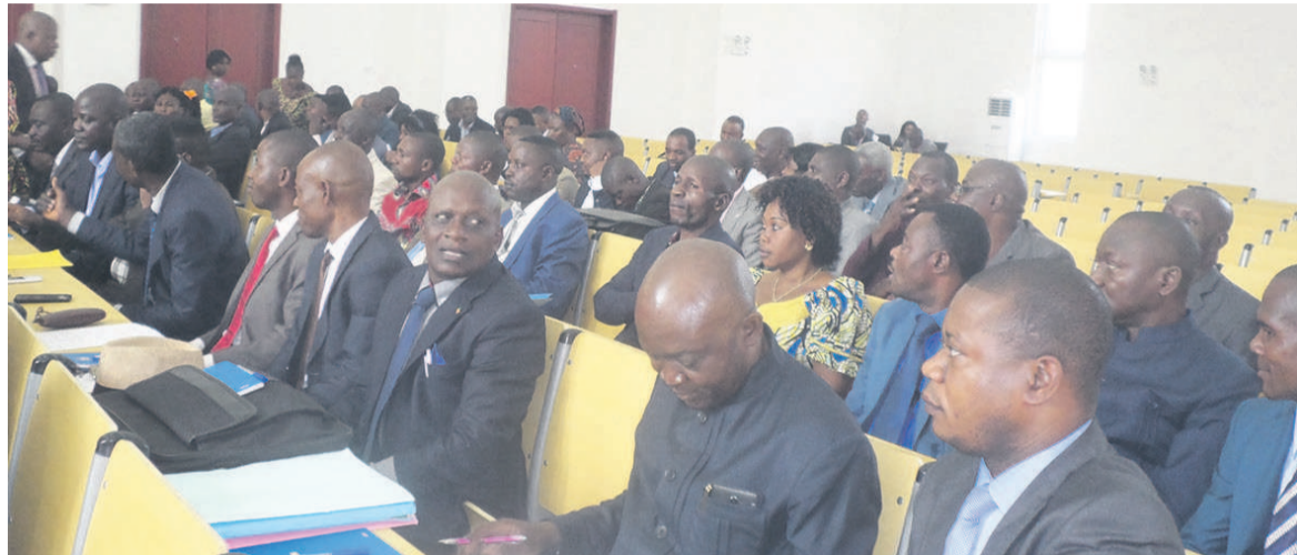
Les participants

Placée sur le thème : « La responsabilité du chef d'établissement et le redressement du système éducatif dans un contexte de rigueur et de vérité », cette conférence a été marquée par des débats ayant permis aux participants de souligner des questions d'intérêt et de faire des suggestions. Ainsi, six exposés ont été développés au cours des deux jours des travaux. Ils portaient tous sur la