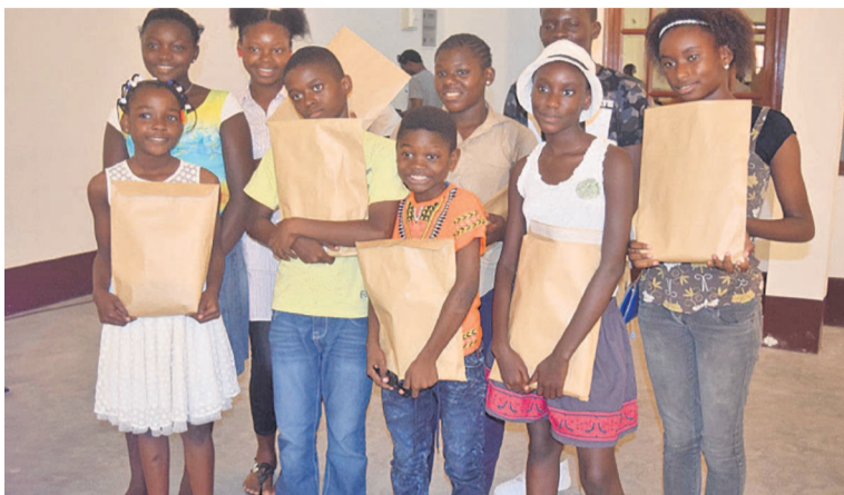
Les enfants récompensés après le jeu concours