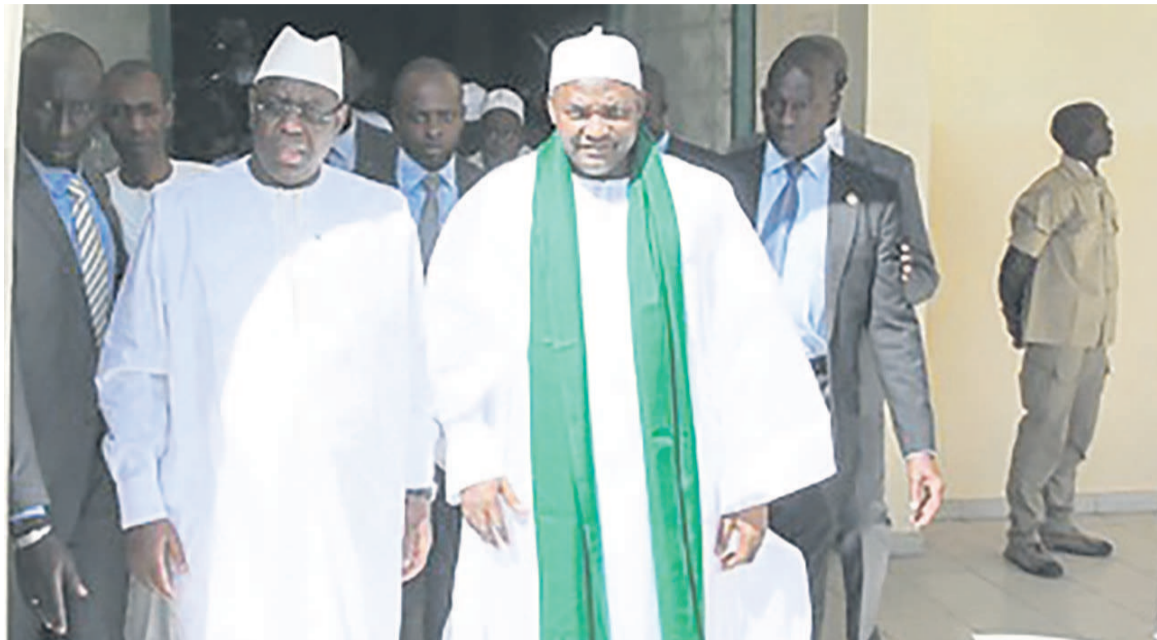
Adama Barrow, aux côtés du président sénégalais Macky Sall, est attendu à Banjul

Après six semaines de crise et sous d'intenses pressions diplomatiques, notamment des 15 pays de la Communauté économique des Etats de l'Afrique de l'Ouest, l'ex-président gambien battu à l'élection présidentielle du 1er décembre mais qui refusait de reconnaître sa défaite, a finalement accepté de se retirer, après 22 ans de pouvoir, et s'est envolé de Banjul pour