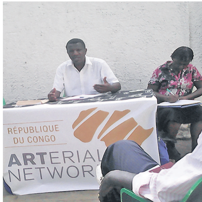
Le président Félicien Balendé dirigeant la réunion

La présentation du plan d'action 2017 d'Arterial Network Congo a été le principal point examiné lors de la réunion de ce réseau tenue le 22 janvier à l'Espace culturel Yaro de Loandjili à Pointe-Noire sous la présidence de Félicien Guelbault Balendé.