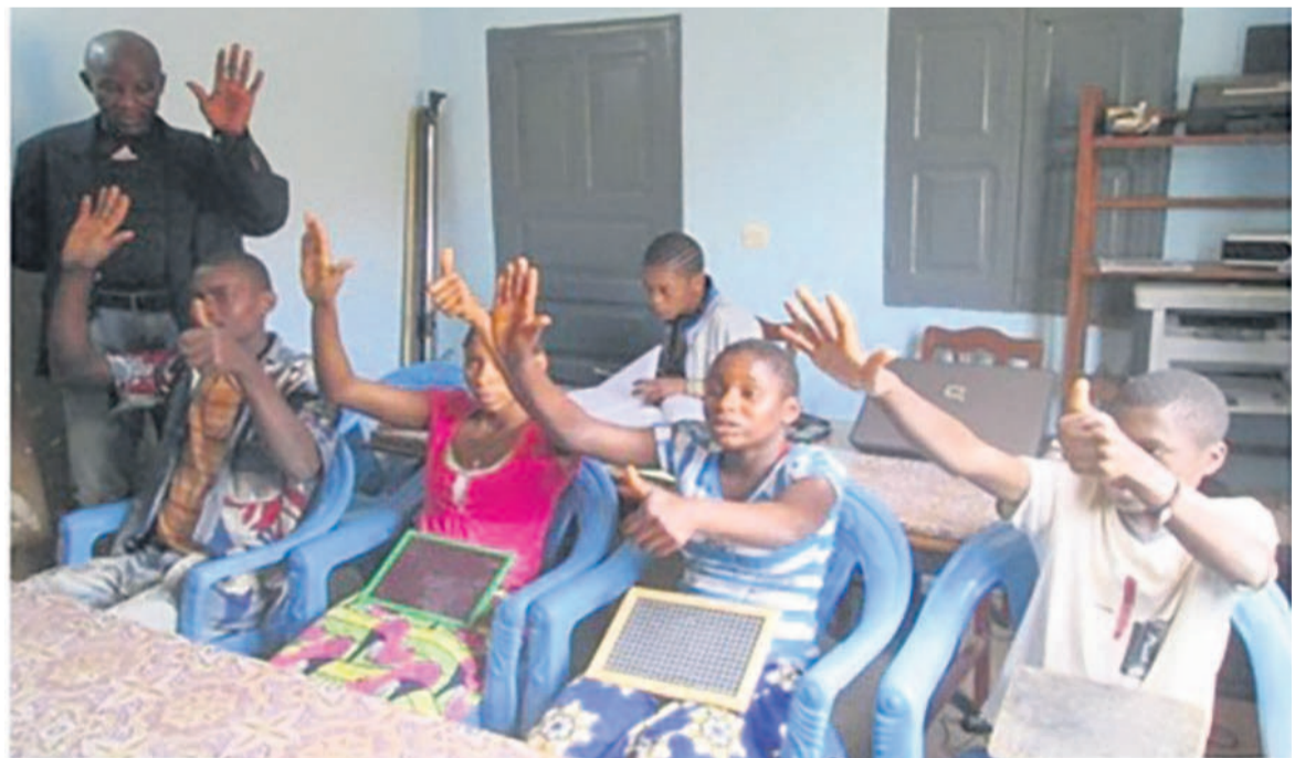
Séance de formation au Centre

À l'intention des donateurs, Sadema propose, entre autres, des activités socio-culturelles autour de la solidarité internationale. Au programme : exposition de peinture ; tables rondes littéraires ; défilé de mode et surtout, une collecte de fournitures scolaires et culturelles. Tout ce matériel sera acheminé au Centre d'accueil de formation professionnelle par apprentissage de métiers adaptés -CAFPAMA- créé en 2014 en faveur des enfants : sourds-muets, orphelins et ceux qui sont déscolarisés. Depuis deux ans, « nous