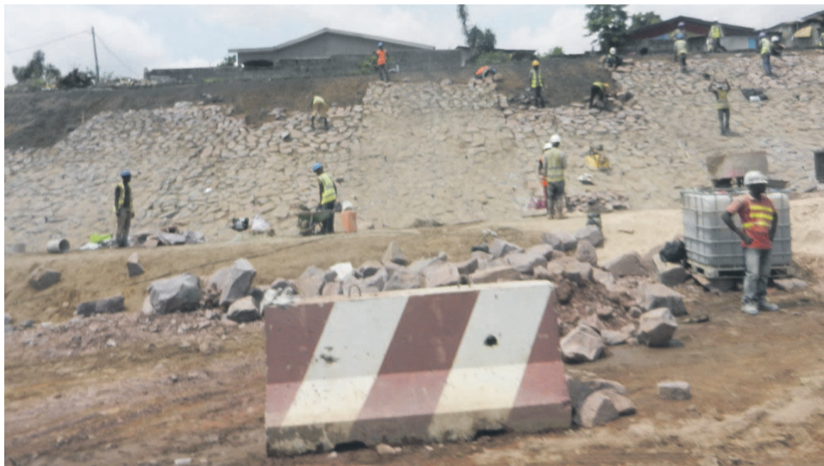
Les techniciens oeuvrant sur le chantier de la corniche