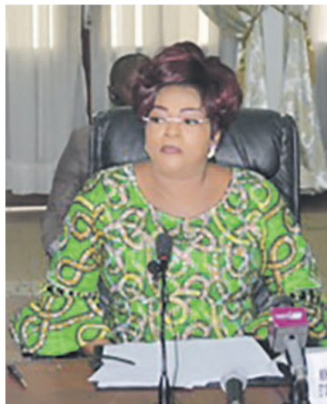
Ines Bertille Nefer Ingani

Dans son mot de circonstance, la ministre de tutelle, Ines Bertille Nefer Ingani a tout d'abord rappelé l'importance et la signification de la journée du 8 mars, avant d'inviter tout le monde à mettre la main dans la pâte pour faire en sorte que cette fête soit une réussite. Elle n'a pas manqué de souligner la nécessité de faire adopter des textes d'application de la loi sur la parité. « Nous sommes donc appelés à nous retrouver, nous, femmes du Congo, pour voir ensemble, comment mener les différentes activités de réflexion sur l'avenir de nos filles et femmes de demain en tenant compte des défis actuels, à savoir notre ferme détermination à faire adopter la loi sur la parité et à nous positionner aux prochaines échéances électorales », a-t-elle déclaré. Elle estime que la parité, dès qu'elle est acquise, contri-