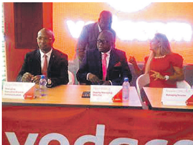
L'équipe dirigeante de vodacom-Congo

Leader dans le monde cellulaire, Vodacom-Congo a au-