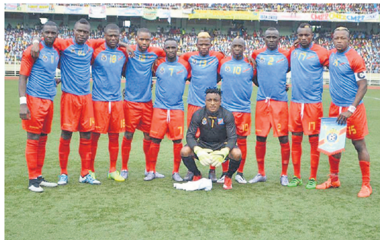
Les Léopards de la RDC