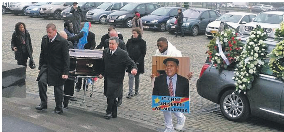
La dépouille d'Étienne Tshisekedi en Belgique