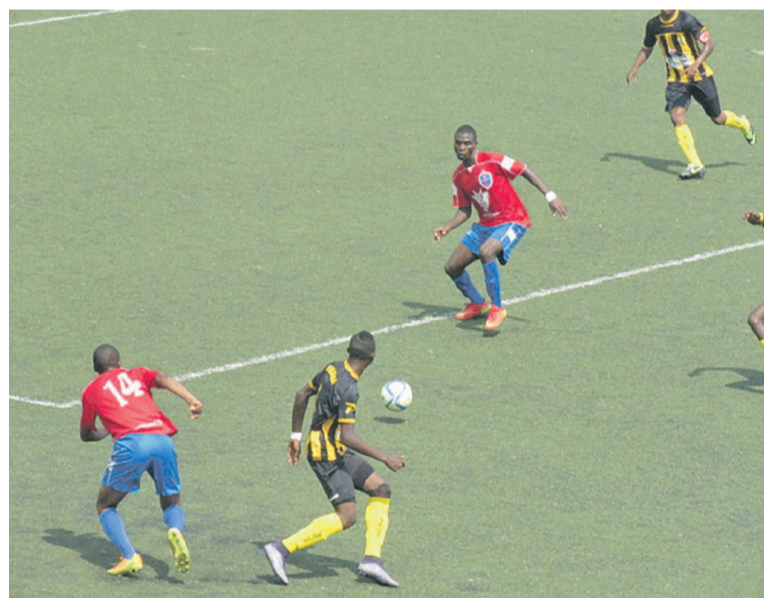
Un extrait du match FC Nathaly's contre la Mancha «Adiac»

Aucune équipe de la ligue du Kouilou sur les quatre représentants ne figure dans le top dix du championnat national après le démarrage de la 6 e journée, le 8 février à Pointe-Noire et Dolisie.