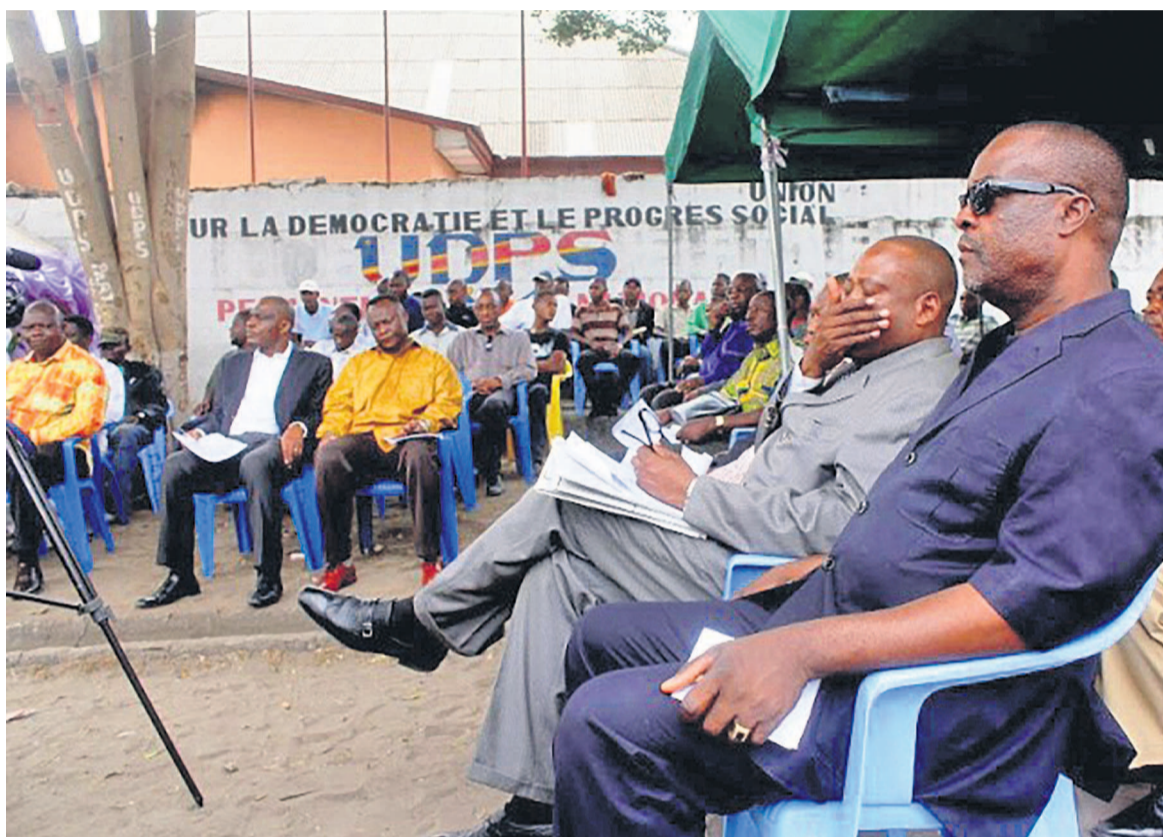
Une réunion de la Ligue des jeunes de l'UDPS