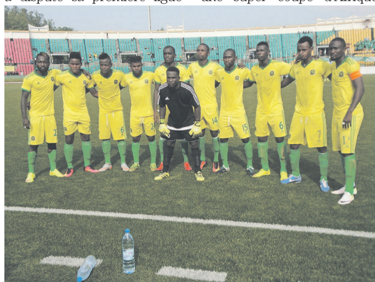
Etoile du Congo/Adiac

En 2015, cette formation a déjà gagné cette coupe de remporté le titre national puis la Confédération en 2011 plus a disputé sa première ligue une super coupe d'Afrique