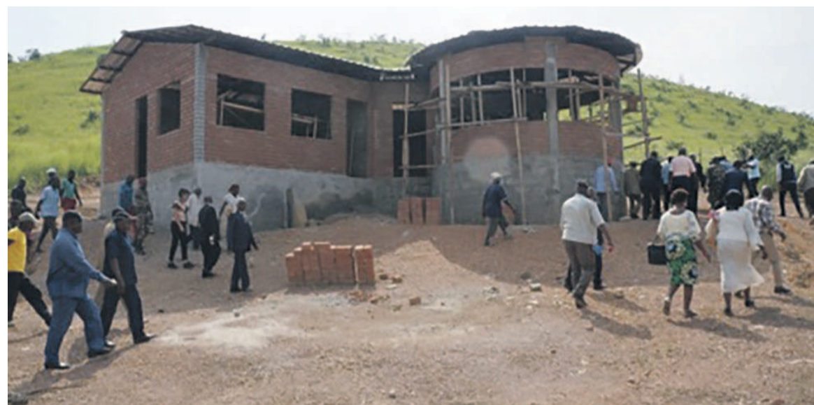
Le gîte de Sossi en construction

La réalisation du gîte de Sossi est un projet pilote car, il est le premier d'un vaste programme