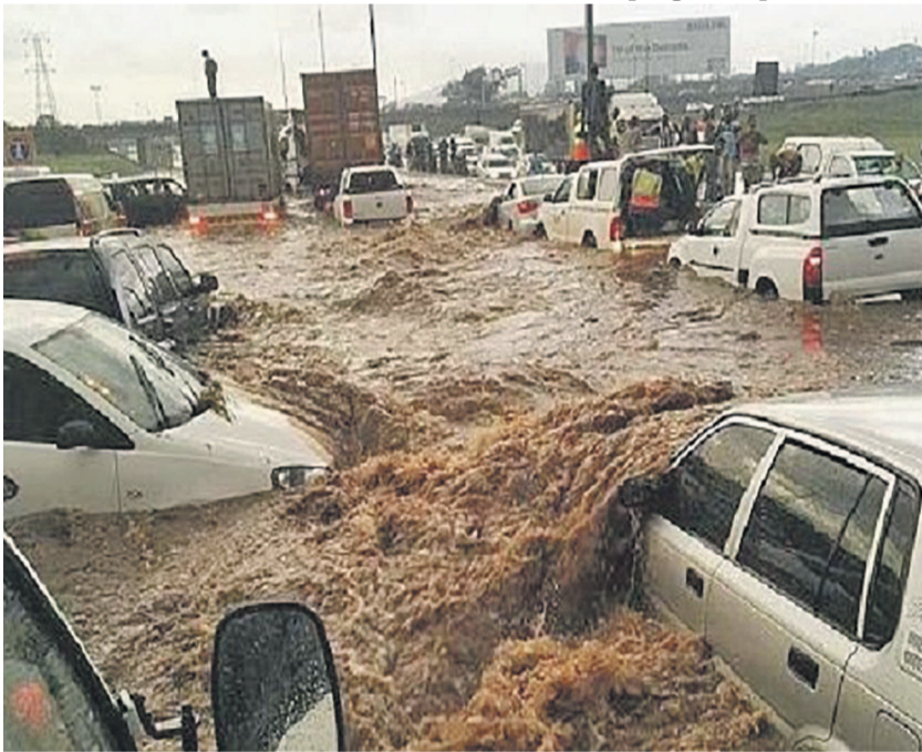
La pluie diluvienne a provoqué inondations et deuils à Kinshasa

noncent dans les prochains jours. Après l'enterrement prioritaire des victimes de ces inondations, l'autorité urbaine envisage quelques actions à mener à grande échelle. Il s'agit notamment du curage des rivières qui traversent Kinshasa dont le débordement du lit à chaque grande pluie crée des