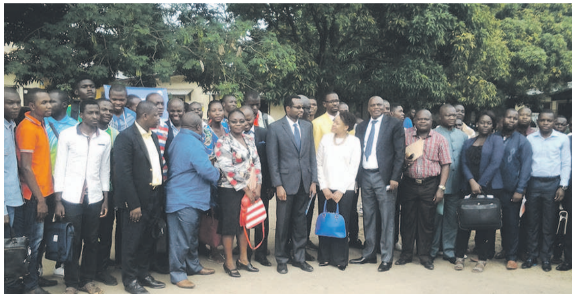
Photo de famille des agents de la Banque Mondiale et du Pdarp face à l'Ensaf

Le corps enseignant ainsi que les étudiants de l'Ecole nationale supérieure d'agronomie et de foresterie (Ensaf) ont lors d'un échange avec une délégation de la Banque mondiale (BM) et du Pdarp, exprimé plusieurs doléances.