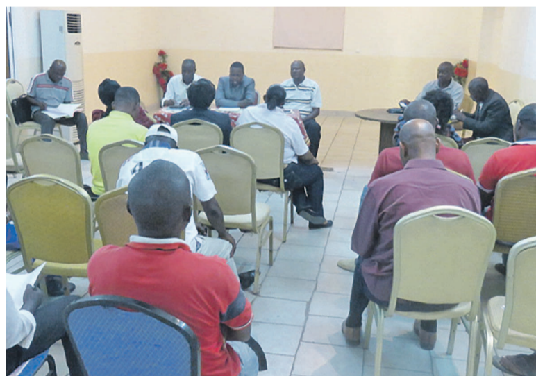
Une vue des conseillers pendant la clôture des travaux «Adiac»

Des débats constructifs ont caractérisé ce conseil inaugural dans le seul objectif de redorer le blason du handball dans la ligue de Pointe-Noire, creuset de l'élite nationale. Après ses échanges qui ont duré plus de 4 heures, les conseillers départementaux ont adopté à l'unanimité avec amendement le règlement intérieur du Conseil, le budget prévisionnel de la ligue, le planning des activités, le règlement particulier du championnat départemental... S'agissant du planning des activités, le championnat départemental aura