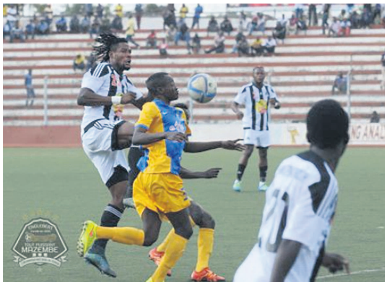
Vue d'un match entre Lupopo et Mazembe au stade Frédéric-Kibassa de Lubumbashi