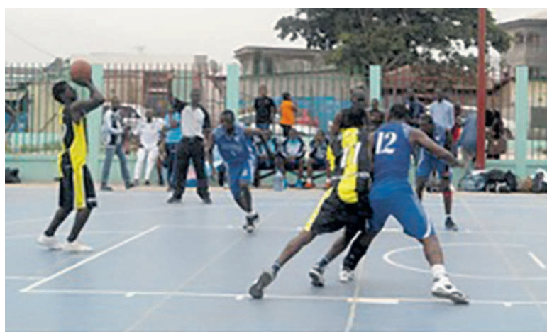
Une rencontre de basketball