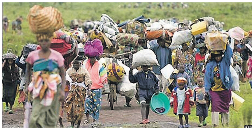
Les réfugiés doivent être protégés

Le financement servira à la protection et l'assistance en faveur des réfugiés centrafricains en République démocratique du Congo (RDC). Cette contribution permettra au HCR et à ses partenaires d'intervenir dans plusieurs domaines, y compris les soins de santé, les mesures contre la malnutrition, l'éducation et l'accès à l'eau. Selon le HCR, le soutien du Japon est d'autant plus important que le soutien aux réfugiés centrafricains se heurte à de grandes difficultés financières. En 2016, le HCR n'a reçu que 9% des cinquante-sept millions de dollars recherchés pour assister ces réfugiés et leurs communautés hôtes. Il y a actuellement près de cent trois mille réfugiés centrafricains dans le nord de la RDC. Ils vivent en majorité dans cinq camps, d'autres vivent avec les populations autochtones. Les besoins humanitaires