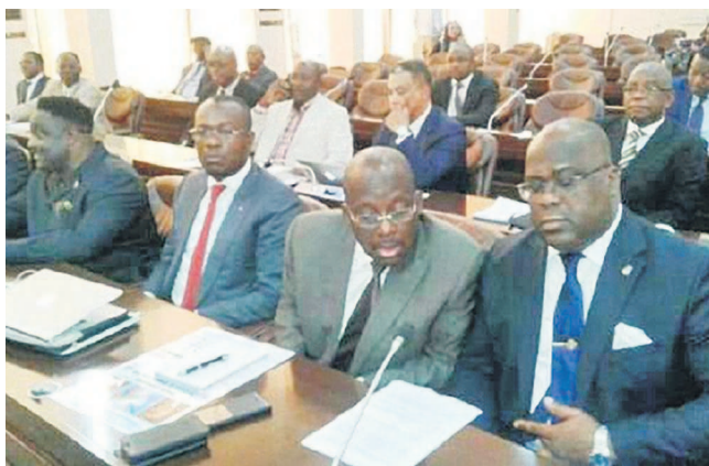
Les délégués du Rassemblement aux négociations du Centre interdiocésain

Des réunions d'harmonisation de vues et de réajustement des ambitions politiques se succèdent pour départager les cinq candidats déclarés de la plate-forme à la présidence du CNSA alors que l'UDPS allègue que ce poste lui revient de plein droit.