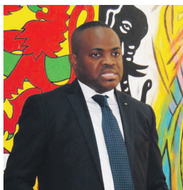
Leonidas Carel Mottom Mamoni

À cinq mois de la 11 e édition du Festival panafricain de musique, prévue du 8 au 15 juillet à Brazzaville, le ministre de la Culture et des arts, Léonidas Carel Mottom Mamoni, promet des innovations pour placer l'événement à la hauteur des attentes et faire de celui-ci une vitrine culturelle. « Il n'y a aucune raison que la fête ne soit pas belle. Nous travaillons depuis pour faire en sorte que nous puissions tirer profit de ce qui a été bien fait hier. Pour ce faire, nous y avons apporté quelques innovations tels que le code artistique et scientifique », a précisé le ministre dans une interview aux Dépêches de Brazzaville .