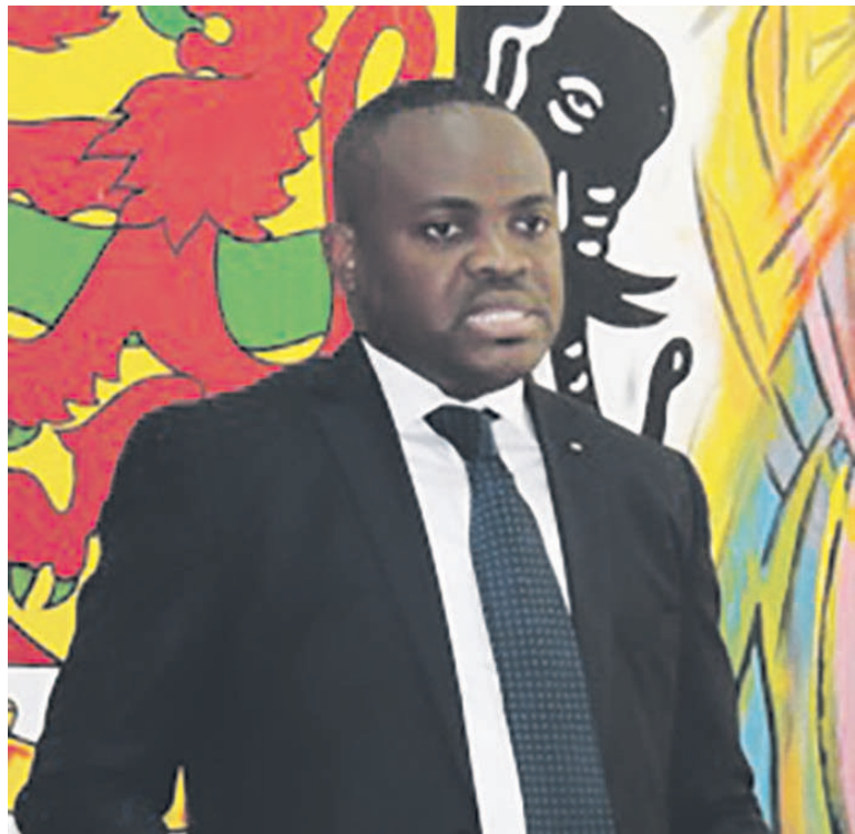
Leonidas Carel Mottom Mamoni (DR)

De retour à Brazzaville après avoir pris part à la 23 e édition du Salon international de l'édition et du livre (Siel) qui s'est tenue à Casablanca au Maroc, du 09 au 19 février ; le ministre de la Culture et des arts, a dans une interview accordée aux Dépêches de Brazzaville, restitué la participation des écrivains et éditeurs Congolais à ce salon, parlé de la rencontre de haut niveau entre les ministres de la Communauté économique des états de l'Afrique centrale (CEEAC) qui a porté sur les industries culturelles ainsi que sur le plaidoyer fait au cours de ces assises sur le Festival panafricain de musique (Fespam) qui aura lieu dans cinq mois au Congo.