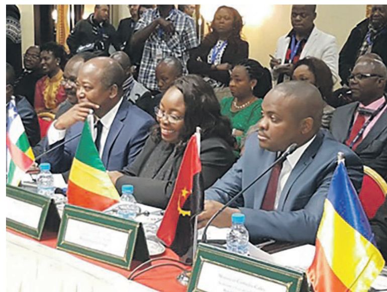
...Lors de la réunion de haut niveau des ministres de la Culture de la CEEAC et du Maroc

LCMM : La vérité c'est que l'organisation du Fespam est l'un des seuls moments où le ministère de la Culture et des arts, dispose d'un budget pouvons-nous permettre de réaliser un certain nombre des projets. J'assume l'idée d'utiliser une petite partie