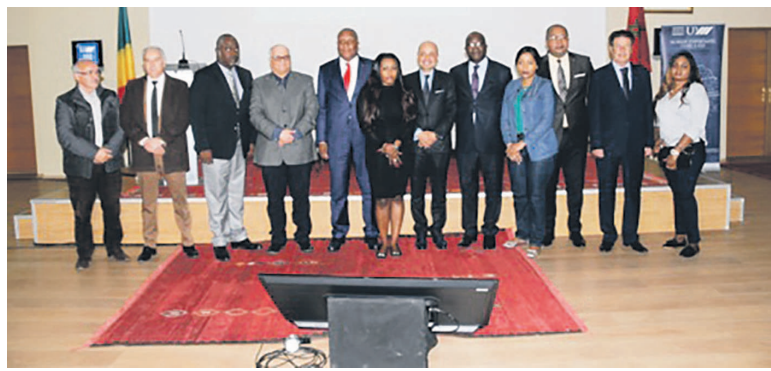
Photo de famille des deux parties