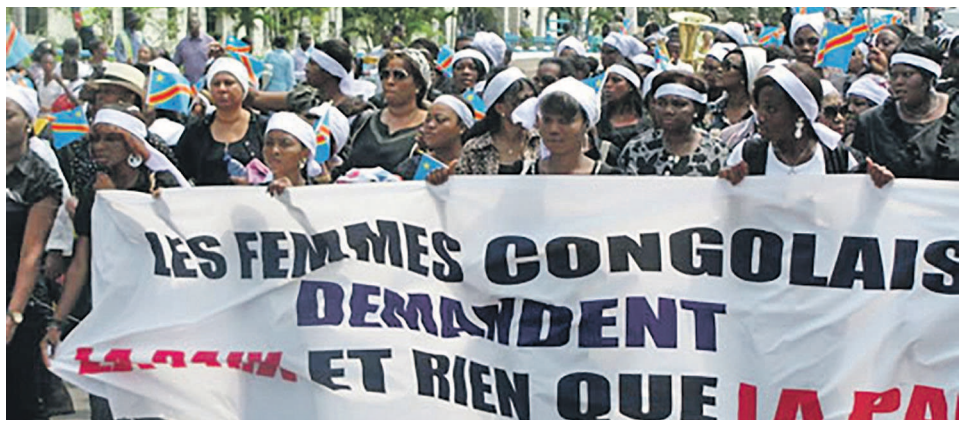
Une marche des femmes congolaises