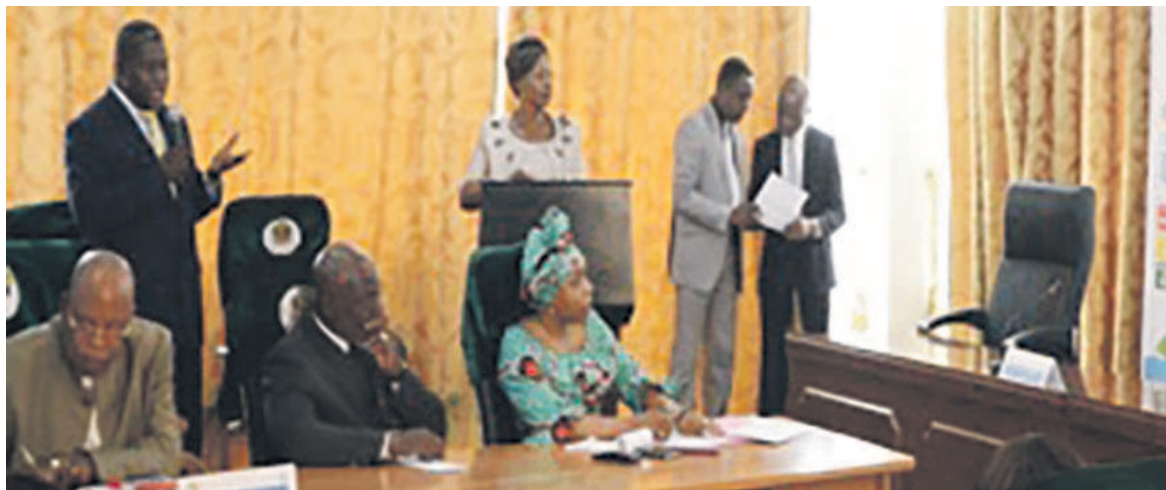
Les officiels pendant la présentation des rapports

Le recensement général de l'agriculture a eu lieu et les premiers résultats ont été annoncés, grâce au soutien de l'Undaf. C'est le même cas dans le domaine de