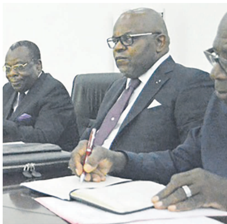
Le président de la Fécoket avec les conciliateurs