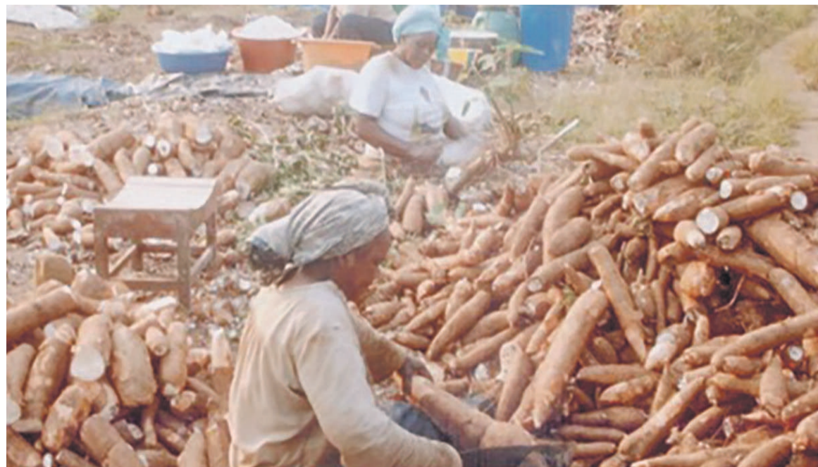
La production du manioc