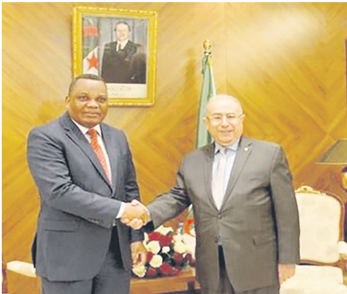
Jean-Claude Gakosso et son homologue algérien, Ramtane Lamamra multiplient les échanges

Comme on peut le constater, cette année, la Congo et l'Algérie multiplient des signaux d'un engagement mutuel à consolider leurs relations de coopération vieilles de plus de 50 ans. « Nous avons reçu instruction de nos deux chefs d'Etat de raviver cette relation ancienne et précieuse entre Alger et Brazzaville. Nous allons ainsi, redonner de l'impulsion à notre coopération », confiait