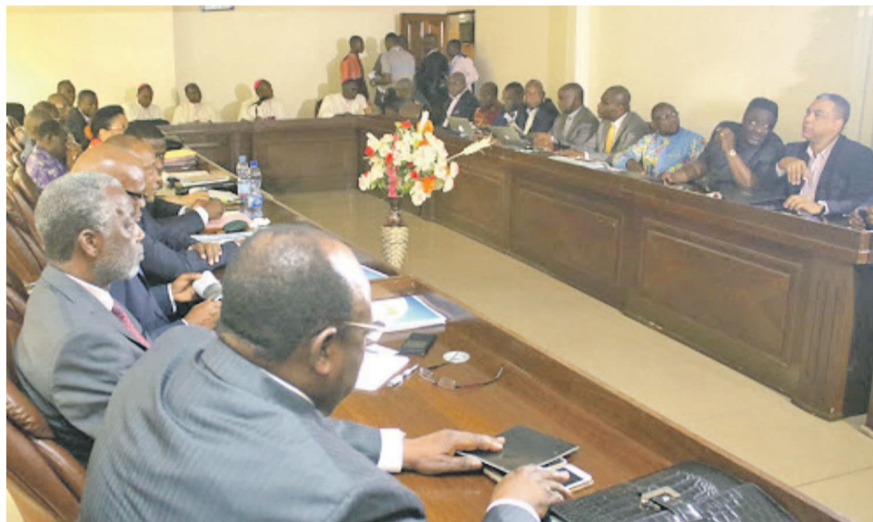
Les participants au dialogue de la Céncó

En effet, présentant respectivement la substance de ces trois points, les chercheurs de l'IRDDH ont attiré l'attention du président de la République et sa famille politique qu'il est de leur obligation primaire de faciliter le processus de mise en œuvre dudit Accord, notamment par la nomination du Premier ministre chargé de former le gouvernement ayant pour priorité l'organisation des élections prévues pour l'année 2017. «Toute manigance tendant à retarder le processus électoral ou à entraver la mise œuvre de l'Accord déstabilise l'État, porte atteinte au droit, à la paix et crée de l'insécurité», ont-ils souligné.