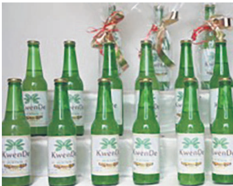
Un échantillon de KwenDe

ECM : La conservation du vin de palme étant difficile compte tenu des multiples réactions chimiques et bio-