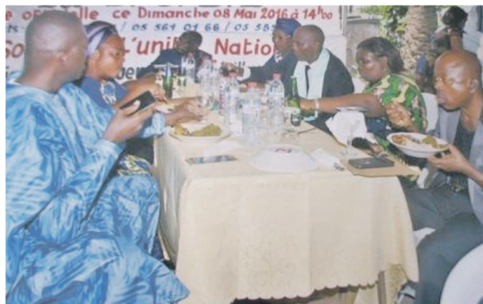
Quelques membres de la Dobe pendant la fête

La Diaspora de Ouenzé Brazzaville et ses environs (Dobe) a célébré le 25 février à Pointe-Noire son premier anniversaire dans la convivialité.