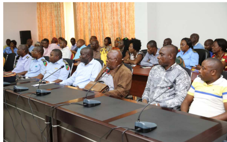
Une vue des membres de l'intersyndical

L'intersyndical des travailleurs des douanes congolaises a annoncé hier que les douaniers entraient en grève à partir de ce mercredi, sur toute l'étendue du pays.