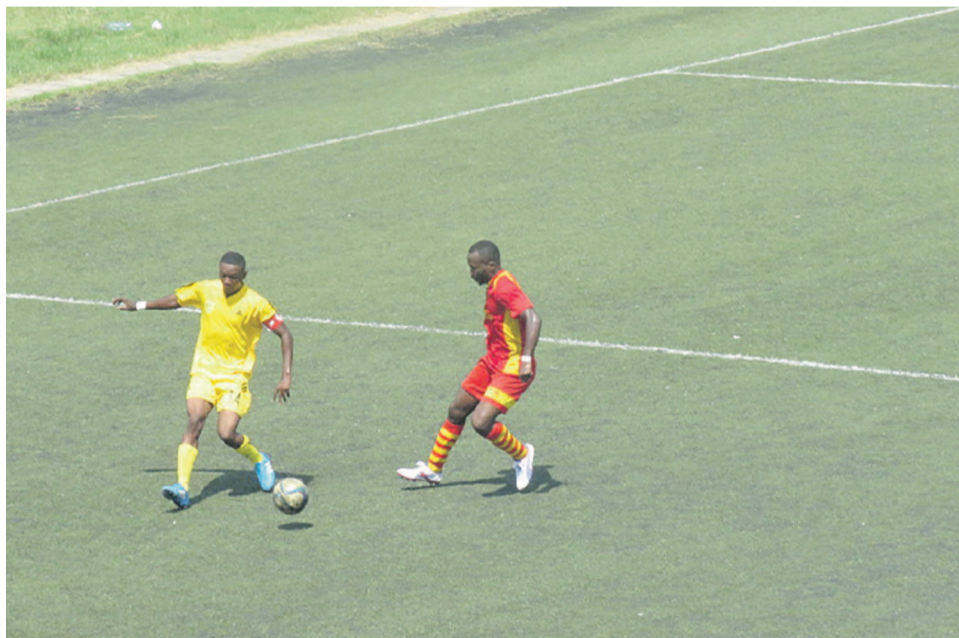
Une vue du match la Mancha contre Interclub «Adiac»

L'un des quatre représentants de la ligue du Kouilou au championnat national a battu Interclub, 1 à 0, le 25 février au Complexe sportif de Pointe-Noire, en match comptant pour la huitième journée. Cette victoire permet à la Mancha d'améliorer son classement et de se maintenir dans le top 10 du championnat.