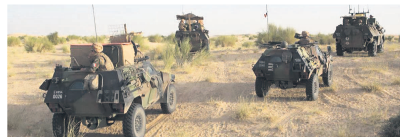
Vu d'un exercice

combat rapproché ». Depuis avril 2015, le Burkina est entré dans un cycle d'enlèvements et d'attaques islamistes, surtout dans le nord frontalier du Mali et du Ni-