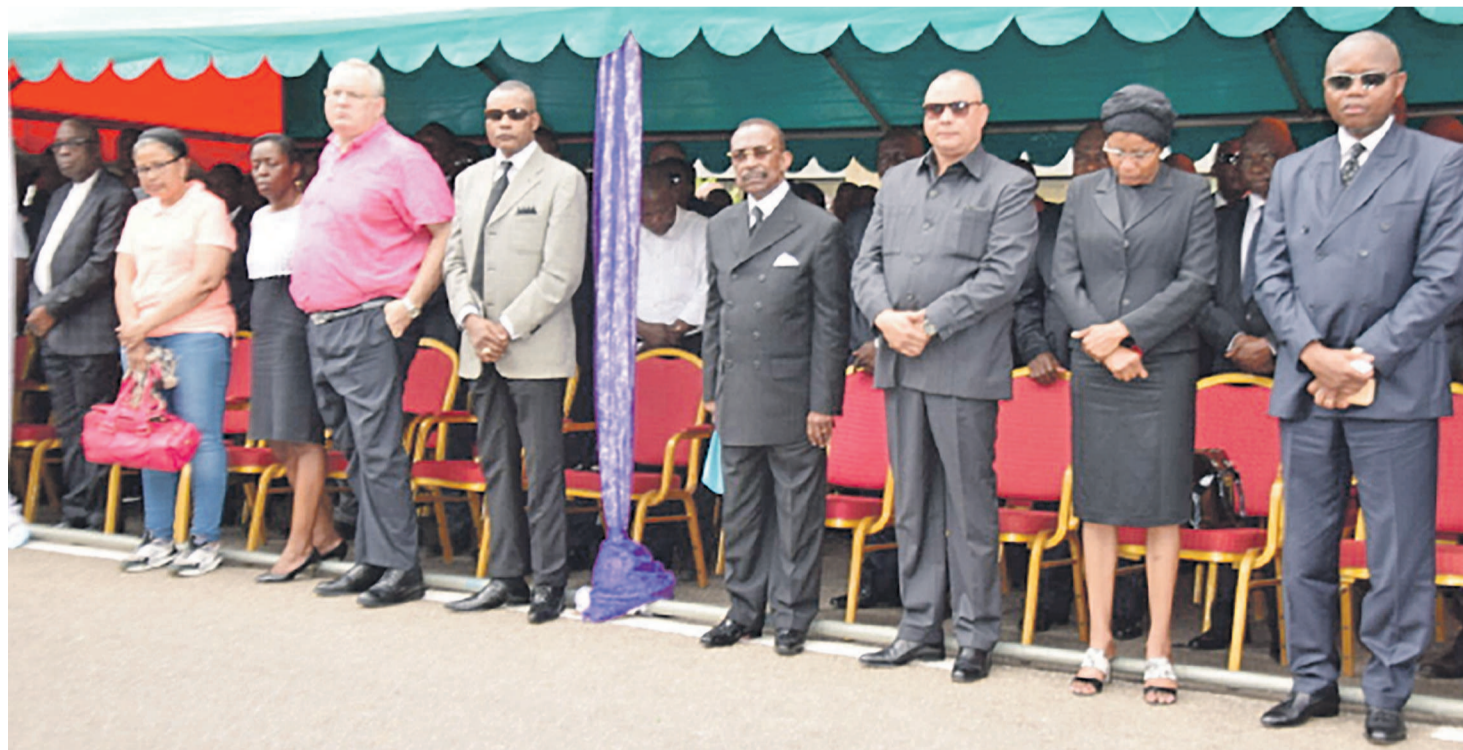
Les membres de Club 2002 PUR lors de la cérémonie d'hommage