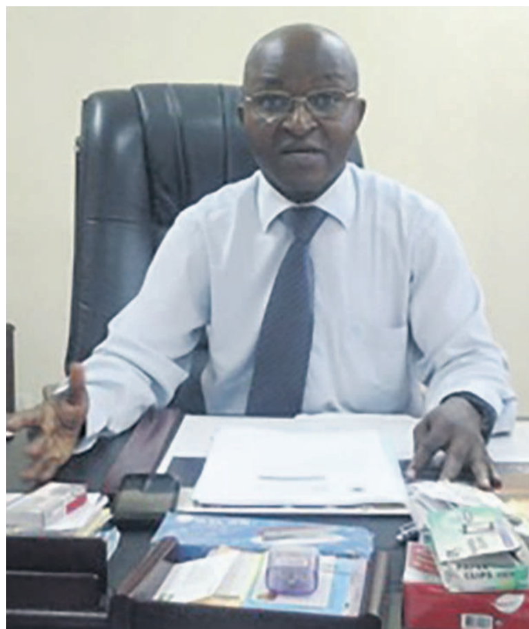
Le coordonnateur du Pdar (DR)

I.O : Certes le projet a eu des résultats satisfaisants mais, on a aussi connu des difficultés. La principale était liée au paiement des fonds de contrepartie par le gouvernement. Car, le projet qui a été lancé en 2008 n'a démarré effectivement qu'en 2011, soit la quatrième année de son existence. Ce problème a failli entraîné la fermeture du projet avant son terme. Il faut signaler que le gouvernement avait pris les choses en main et a financé le projet normalement jusqu'à sa fin. En dehors des difficultés liées aux fonds de contrepartie, l'adaptation par les cadres du projet aux méthodes et pratiques de travail de la BM n'a pas été facile. Ce qui explique les insuffisances que nous avons eues au début du projet. Les entreprises que nous