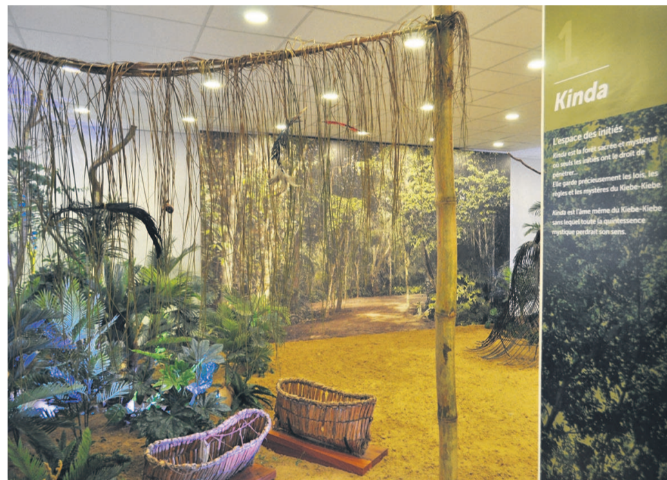
Le Kinda (DR)

Maintenant la collection est sécurisée et le public, en mesure de venir s'y ressourcer. À N'Gol'Odoua, nous avons aussi lié le traditionnel au moderne. Une conception voulue parce qu'aujourd'hui, au vingt et unième siècle, le kiebe-kiebe