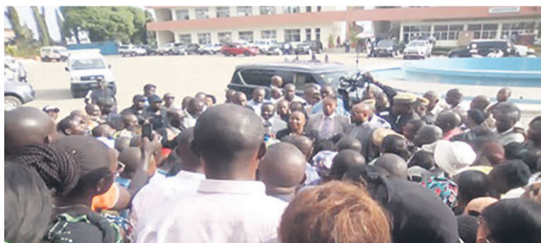
Jacqueline Lydia Mikolo, au centre en noir, s'adressant aux agents de l'hôpital général de Loandjili