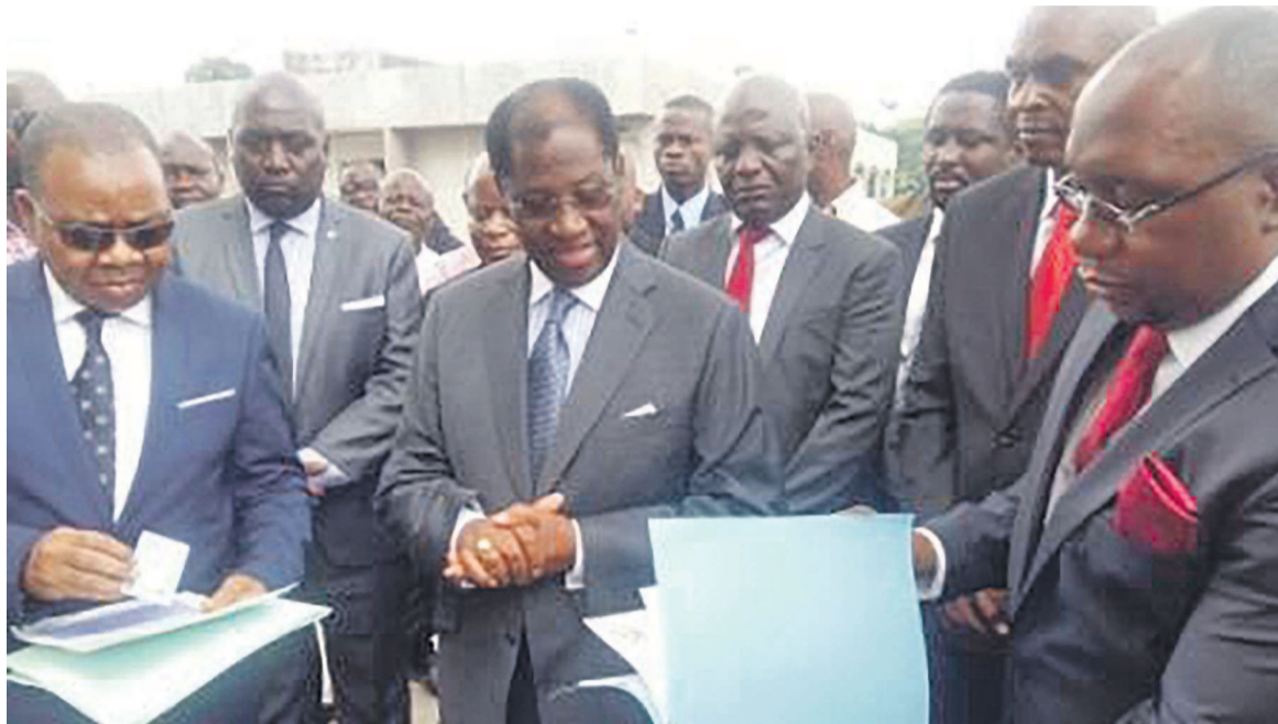
Sécurisation des immeubles de l'État, cheval de bataille de Félix Kabange Numbi

Force est de rappeler que la remise des titres sécurisés pour le compte du bâtiment du gouvernement et de la Société congolaise de construction moderne, tous en construction est l'aboutis-