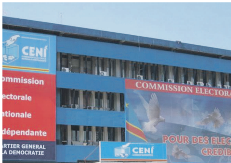
Le siège de la Céni, Kinshasa

Une ONG basée à Goma, dans le Nord-Kivu, a récolté près de 300 signatures pour exiger à la centrale électorale de se conformer à cette exigence en vue d'avoir les élections à temps échu.