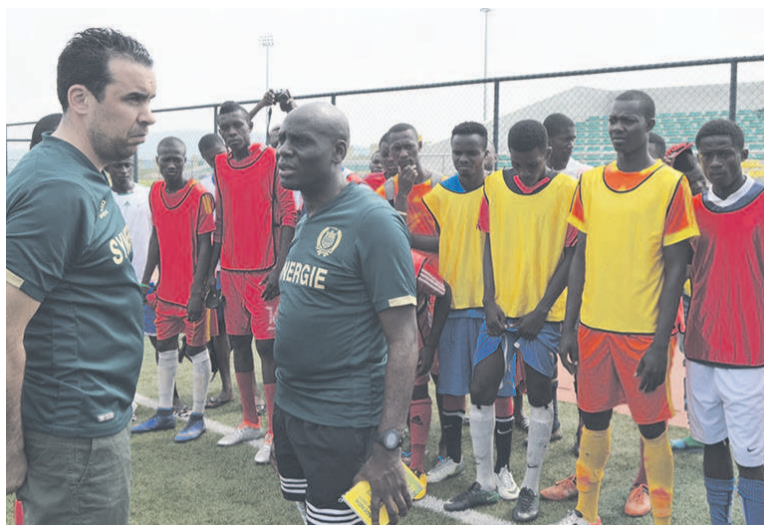
Les recruteurs sur l'aire de jeu du stade annexe de Kintélé avec les joueurs.