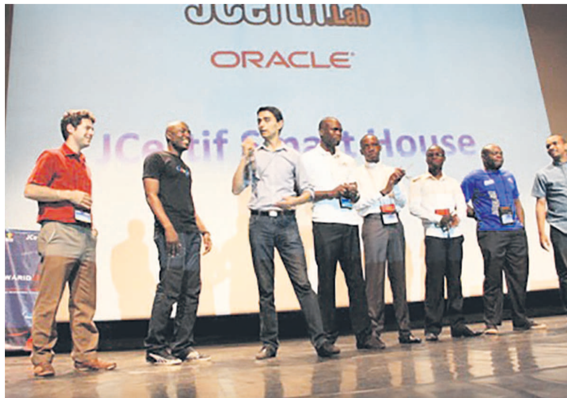
Jcertif Brazzaville édition antérieure

Événement clé pour l'écosystème TIC congolais et celui de l'Afrique centrale, JCertif 2017 qui se tient à l'hôtel Azur International « Le Gilbert » garde son programme établi à chaque édition entre formation et démonstration. Cette année, parmi les conférences épinglées, on parlera des enjeux et des perspectives de la monnaie électronique, de la Sécurité des Systèmes d'Informations, du Cloud et le Big Data, du Web 3.0 mais aussi, comme lors de l'édition dernière à Brazzaville, de l'Internet des objets et des technologies embarquées. Côté formation, on retiendra entre autres des ateliers sur le Java EE, le développement mo-