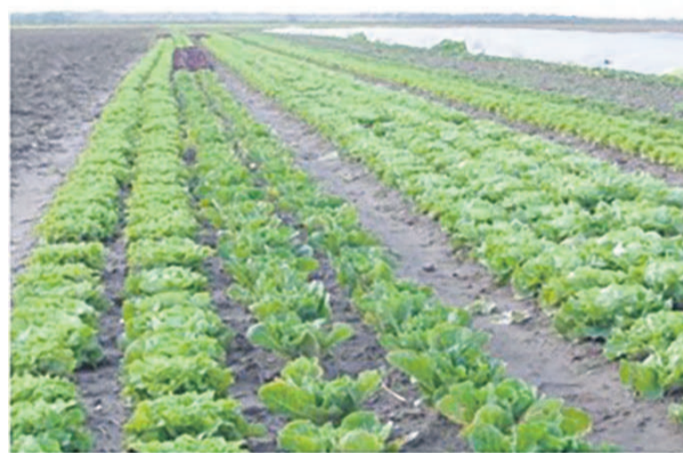
Étendue d'une plantation de chou

C'est le même cas pour le groupement Zola installé dans le village Tsounga (périphérie de Brazzaville), l'un des bénéficiaires du Projet de développement agricole et de réhabilitation des pistes rurales (Pdar). Ce groupement est spécialisé dans la culture des légumes frais ; de la tomate, de l'aubergine verte, du concombre, des haricots verts etc.