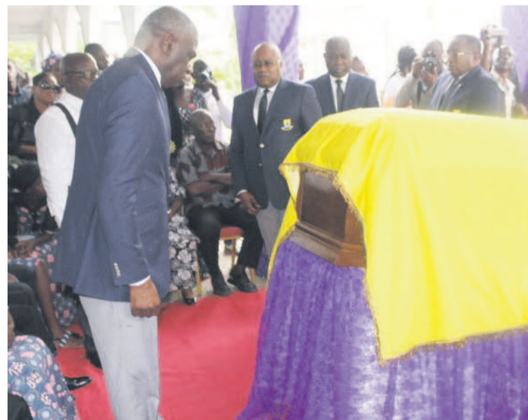
Le bureau exécutif du Conseil pendant le recueillement

Le Conseil municipal rend un dernier adieu à Fulgence Ibombo Gakosso