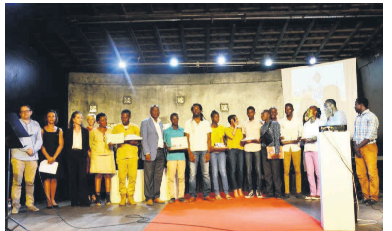
Les lauréats du concours ensemble avec quelques personnalités culturelles de Pointe-Noire

À l'occasion de la 19e édition du Printemps des poètes, l'IFC a organisé un concours de poésie en langue française afin de valoriser la jeune génération poétique. La cérémonie de remise de prix aux lauréats a eu lieu il y a quelques jours à Pointe-Noire en présence de Jean-Luc Delvert, consul général de France dans cette ville.