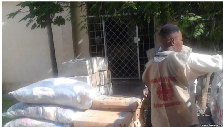
Caritas contribue à l'amélioration des conditions de vie des populations

redevabilité du programme Wash. L'atelier de démarrage et d'appropriation du Projet d'appui à la capitalisation des canaux et supports de communication pour la promotion de la durabilité des ouvrages WASH, et la redevabilité a connu la participation des délégués des Caritas diocésains de Kisangani, d'Isangi, de Bukavu, Kongolo, Kenge, Kikwit, Lisala, Kisantu, Mbuji-Mayi, Kananga,