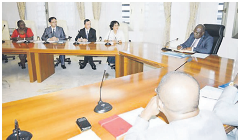
Le ministre Calixte Nganongo recevant la délégation de West Africa