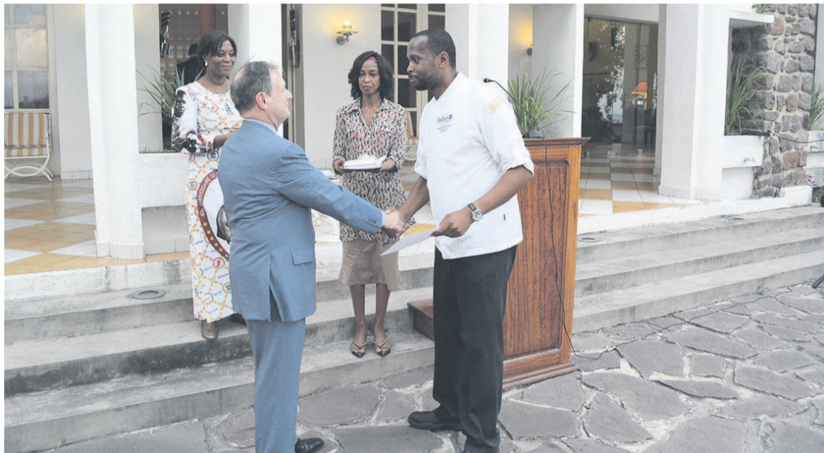
Le chef cuisinier de Radisson Blu recevant son diplôme

En effet, cette année, c'est la troisième édition à laquelle ont participé plus de 2000 chefs et près de 250 000 personnes à travers le monde, comme plus de 150 ambassades de France sur les cinq continents. L'accent a été mis sur les écoles de restauration et d'hôtellerie, qui contribuent à poursuivre cette tradition des métiers culinaires mais témoignant également que la cuisine française évolue et ne cesse de s'enrichir.