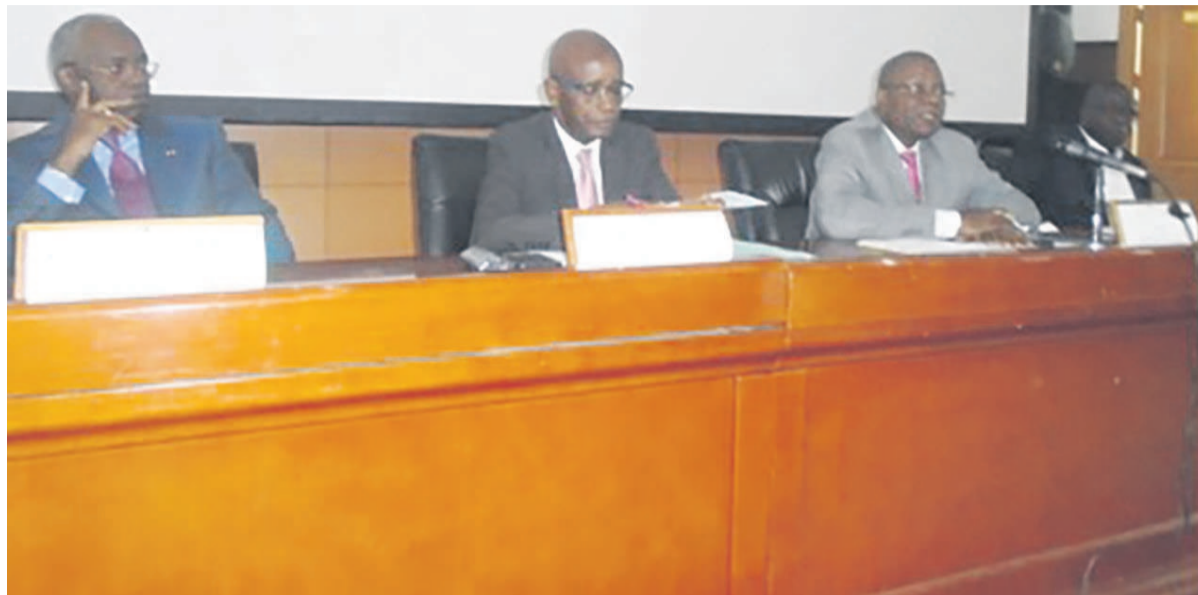
Une vue du podium lors des travaux

Les trois groupes de travail chargés d'étudier le dossier mis en place le 1er février à Brazzaville lors du lancement des travaux sur l'évaluation des capacités contributives des produits de l'exploitation du domaine et des services des collectivités locales ont rendu leurs premières conclusions le 22 mars.