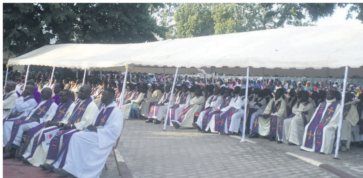
Les participants

dans le fait que la violence a été stoppée. Aujourd'hui, frères et sœurs, nous sommes encore témoins des guérisons profondes attribuées à l'intercession de papa Emile Biayenda. Chaque fois, il y a non seulement la gué-