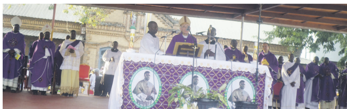
Mgr Pascal Roland célébrant la messe

Rassemblés par milliers mercredi à la place mariale de la Cathédrale Sacré-Cœur de Brazzaville, à l'occasion de la célébration du 40ème anniversaire de la disparition du car-