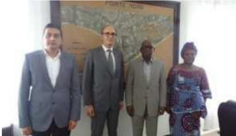
La photo de famille entre la délégation turque et les responsables de la CCIAM