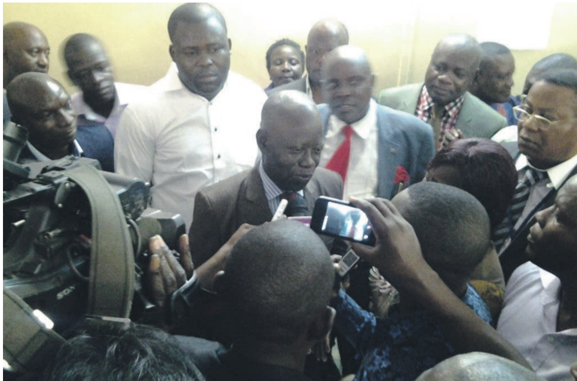
Le nouveau DG répondant à la presse

Les agents exigeaient à leur direction générale le paiement des salaires des mois de février et mars, ainsi que le 13e mois resté impayé. Les salaires de janvier 2017 des agents de la Cogélo évoluant à Gamboma et