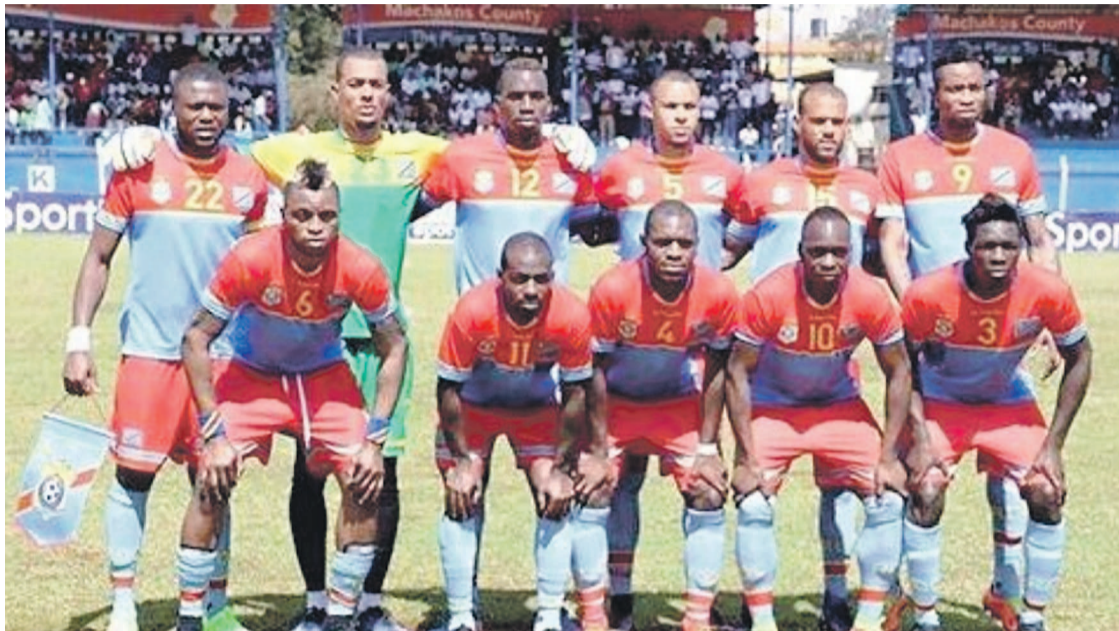
Les Léopards de la RDC, avant le match contre les Harambee Stars du Kenya à 52 km de Nairobi

« L'équipe kenyane a inscrit le but que nous n'avons pas marqué, parce qu'on s'est créé beaucoup d'occasions... On a commis deux erreurs qui nous ont été fatales, la première, c'est par rapport à l'attaquant (Olunga), on n'a pas pris la mesure de sa vitesse et de sa puissance tout de suite et il a pu faire la différence, le deuxième but, il y a une mauvaise protection de balle de notre attaquant qui