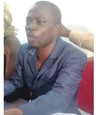
Prince Arnie Matoko

Selon Prince Arnie Matoko, cette œuvre imaginaire a aussi un brin de réalisme, car a-t-il dit dans