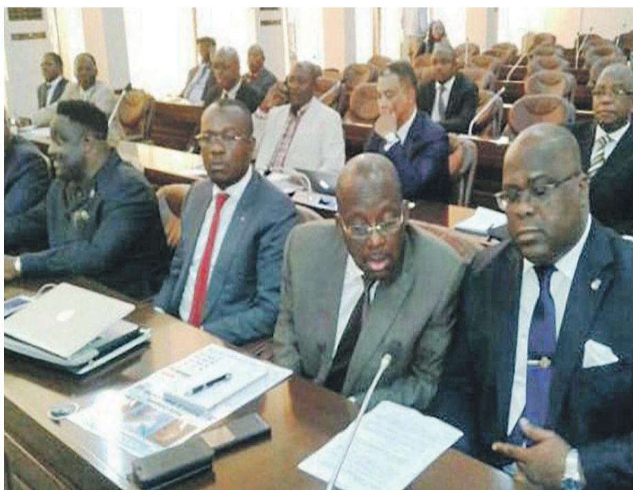
Les délégués du Rassemblement aux discussions sur l'arrangement particulier

C'est un constat d'échec auquel sont arrivés les évêques catholiques le samedi 25 mars après plusieurs jours des travaux sur l'adoption de l'arrangement particulier, texte prévoyant les modalités d'application de l'accord politique du 31 décembre. Entre autres points d'achoppement, le processus de désignation du Premier ministre de la transition, la présidence du Conseil national de suivi de l'accord (CNSA) et la répartition des postes ministériels.