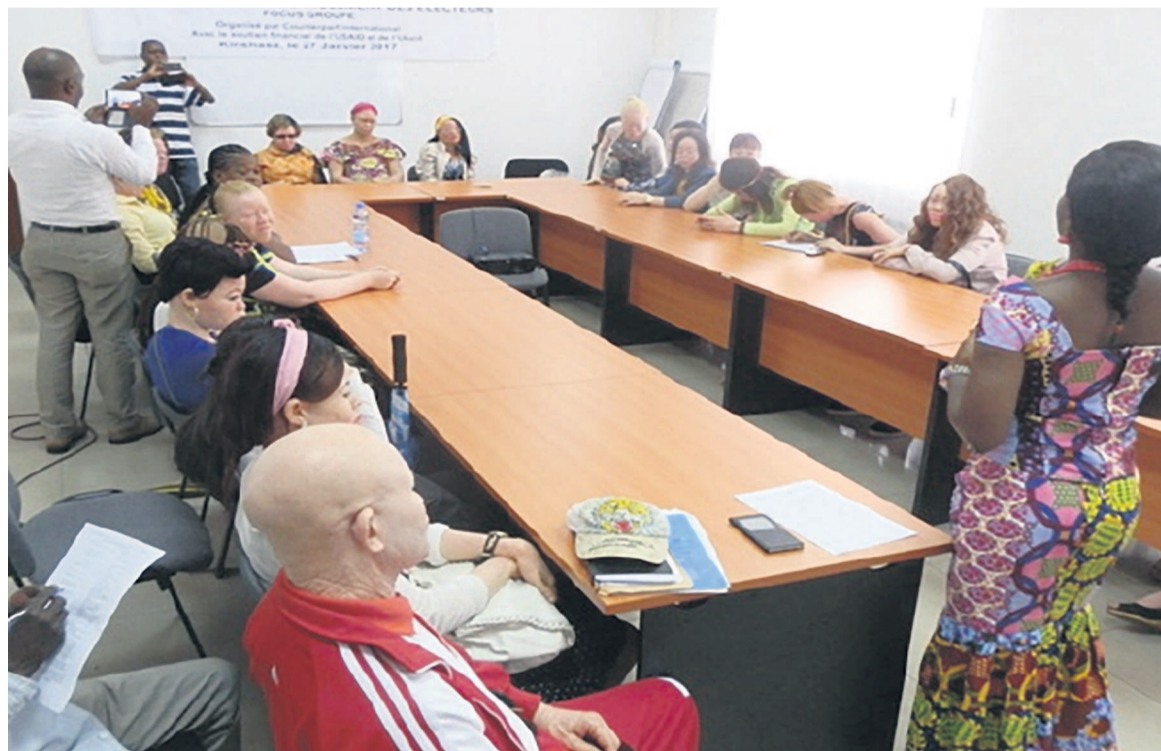
Les femmes membres de la FMT, lors d'une activité dans le cadre du processus électoral

Au cours de cette activité, la FMT attend près de quatre cents femmes albinos et non albinos venues de tous les districts de la capitale congolaise et de la province voisine du Kongo central. Alors que dans son programme, l'ONG prévoit des messages de sensibilisation et d'encouragement en direction des albinos, en vue de s'accepter et de se faire accepter par la société, en se rendant utiles. Mais également, des messages de sensibilisation contre la