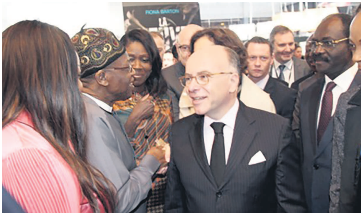
Bernard Cazeneuve, le Premier ministre français, a visité le Pavillon des Lettres d'Afrique