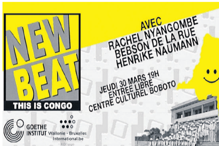
L'affiche du concert

lecture de 45tr/min, les gens dans la salle étaient complètement dans l'euphorie. Par le ralentissement, la musique synthétique avait développé un groove jusqu'alors méconnu », raconte-t-on. Le New Beat était ainsi né.