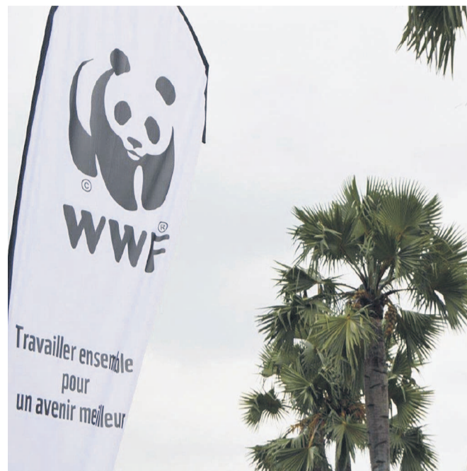
Une affiche de WWF

CSD, note-t-on, est une communauté de volontaires, initiative des anciens boursiers des programmes d'échanges sponsorisés par le département d'Etat américain. Cette organisation est présente dans