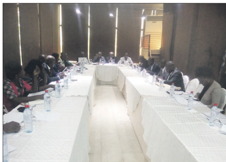
Les membres de l'Icaci lors des travaux

Notons qu'à l'issue de l'assemblée générale ordinaire de l'Icaci, outre l'adoption du programme d'activités 2017 et le budget de l'exercice, les membres de l'organisation ont approuvé le bilan des activités 2016 jugé « encourageant », en dépit de quelques