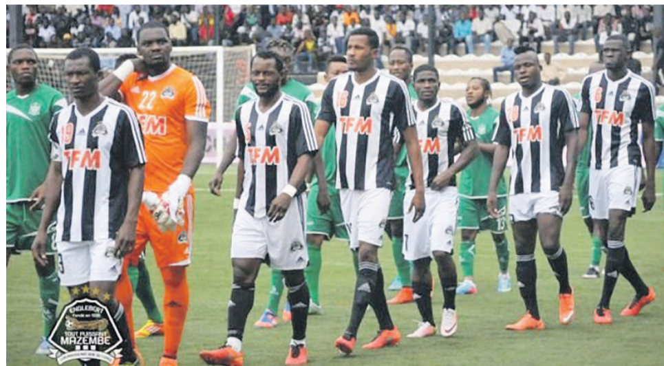
Mazembe face à DCMP à Kamal City à Lubumbashi en 2016