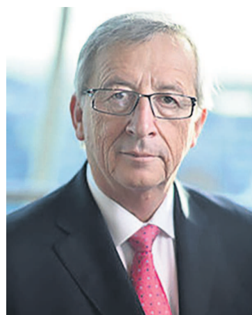
Jean-Claude Juncker

Le président français, François Hollande, a défié les candidats à l'élec-