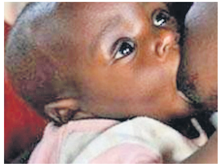
Nourrisson accroché au sein de sa maman (c'est le lait maternel en question)

Pour permettre aux mères de démarrer et de maintenir l'allaitement exclusif au sein pendant six mois, l'Organisation mondiale de la santé (OMS) et l'Organisation des Nations unies pour l'enfance (Unicef) recommandent entre autres, le commencement de l'allaitement dès la première heure qui suit la naissance, l'allaitement exclusif au sein, c'est-à-dire que le nourrisson n'absorbe que du lait maternel et aucune autre nourriture ou boisson, pas même de l'eau, l'allaitement à la demande, c'est-à-dire aussi souvent que l'enfant le réclame, jour et nuit, pas de biberons, de tétines ou de sucettes.