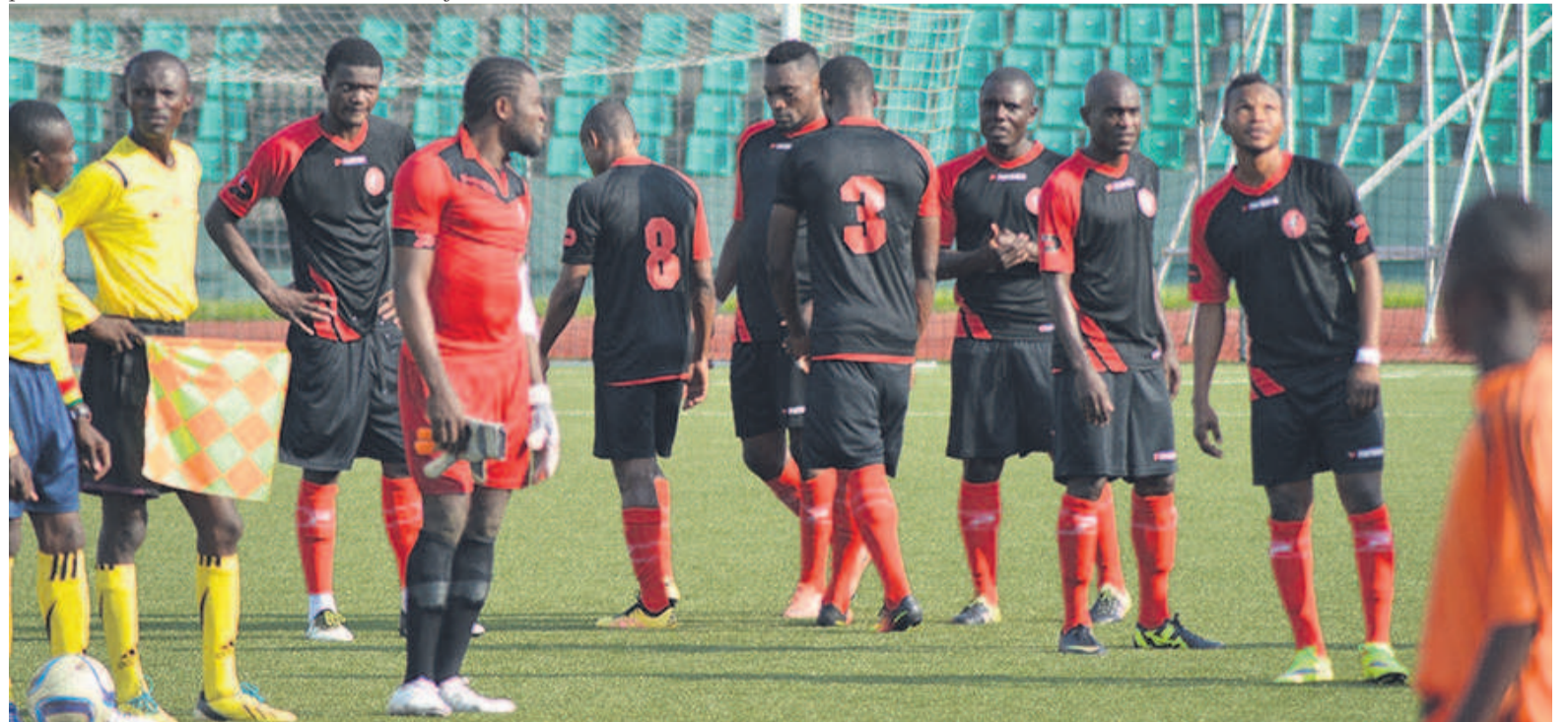
Les Aiglons en pleine regret

(27 points+20); 3- Etoile du Congo (24 points+12); 4- La Mancha (23 points+10); 5- JST (23 points+2); 6- AC Léopards (21 points+8); 7- Interclub (21 points+6); 8- Patronage (19 points+0); 9- SMO (17 points-7); 10- Nico-Nicoyé (16 points+0); 11- ASK (16 points-4); 12- Jeunes Fauves (15 points-3); 13- AS Cheminots (15 points-7); 14- Tongo FC (14 points-9); 15- JSP (13 points-6); 16- Diables noirs