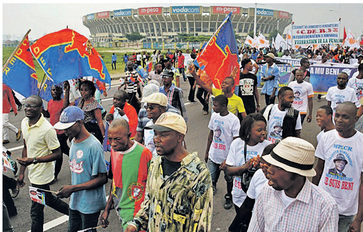
Des manifestants dans la rue à Kinshasa