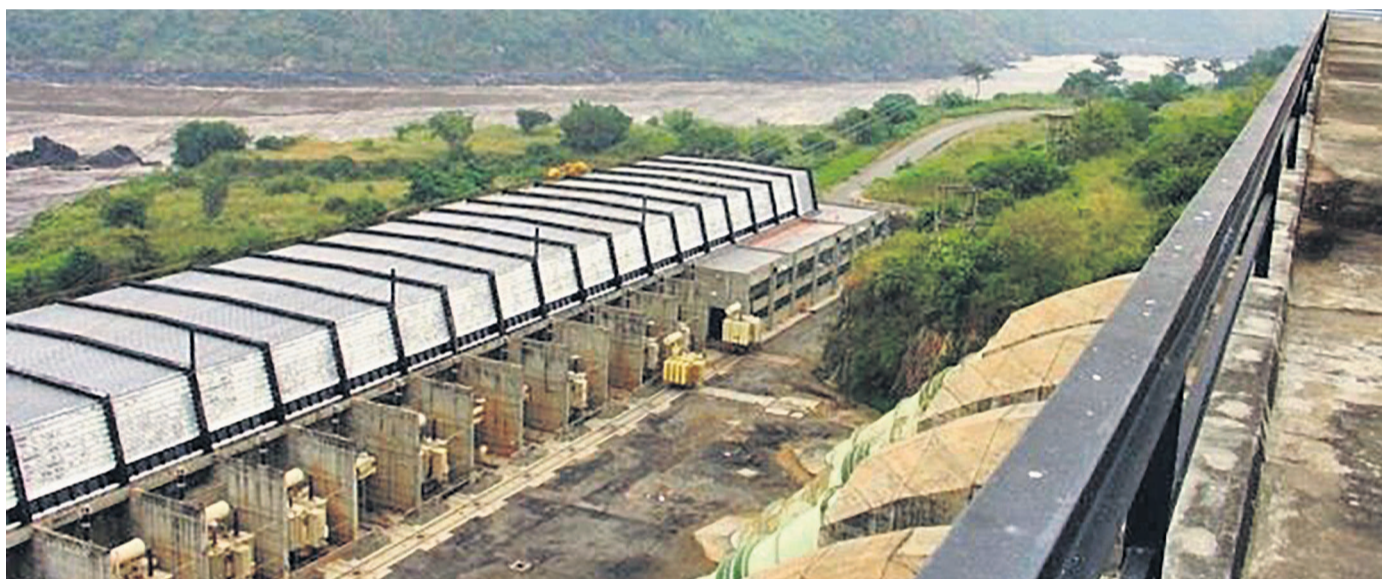
Vue de la centrale hydroélectrique Inga 2

L'initiative vise à réduire le grand déficit local d'énergie qui a affaibli la production minière de la RDC, principal producteur de cuivre du continent. Les entreprises minières établies dans la province éprouvent d'énormes difficultés pour fonctionner à cause des déficits énergétiques constatés sur le plan local. D'où les pourparlers engagés depuis le 13 avril entre d'une part la Société nationale d'électricité (Snel) et la Chambre de commerce du Congo, et Eskom d'autre part. Le but est de négocier les importations d'électricité produite par cette entreprise sud-africaine. L'électricité importée d'Afrique du Sud impliquerait le transport via de centaines de kilomètres de câbles à travers le Zimbabwe et la Zambie, entraînant ainsi l'augmentation des coûts, reconnaissent les experts. Chaque société minière serait libre de négocier avec Eskom pour la quantité d'énergie dont elle a besoin.