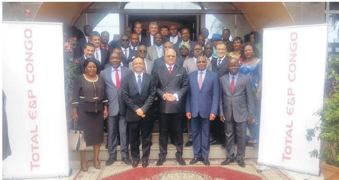
Photo de famille à la fin des travaux

Les perspectives du marché pétrolier au deuxième trimestre