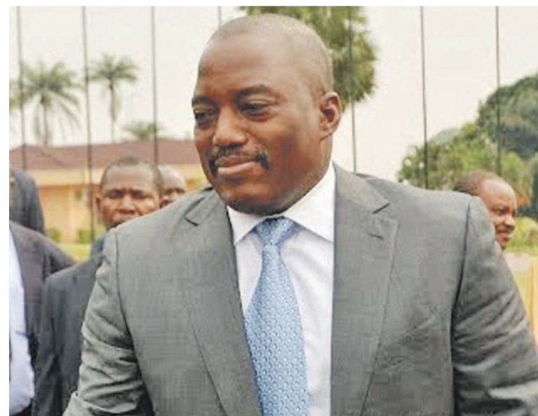
Joseph Kabila Kabange

Se faisant l'arbitre d'une crise provoquée par son maintien au pouvoir, le chef de l'Etat congolais paraît détenir seul les clés du processus politique et démocratique dans son pays en se présentant comme l'unique rempart contre le chaos. Les querelles byzantines du Rassemblement de l'opposition dont les cadres se sont fourvoyés dans des luttes de positionnement lui ont donné des ailes. Son coup de force, c'est d'avoir réussi à infantiliser l'opposition au point que celle-ci semble avoir lâché la proie pour l'ombre qui n'est autre que la chasse aux postes. Tous ceux qui l'avaient sous-estimé en prenant son mutisme pour une faiblesse devront dorénavant se raviser et reconsidérer l'homme dans ses qualités et ses atouts. Celui à qui le Congo doit d'avoir tenu en 2006 ses premières élections libres depuis quarante ans paraît, plus que jamais, être l'homme de la situation.