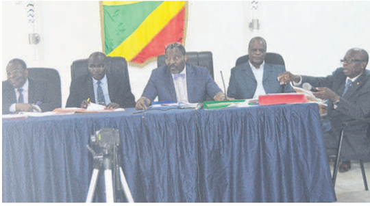
Le bureau du Comité olympique lors des travaux