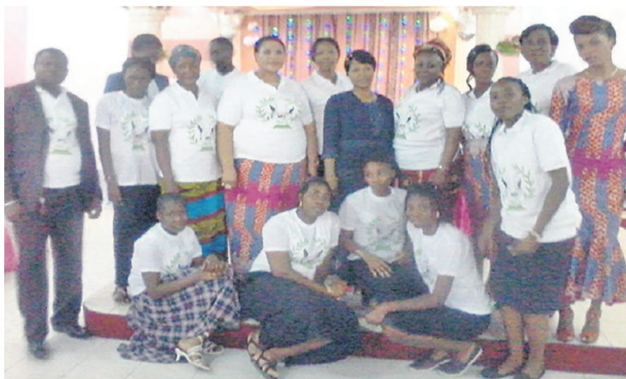
La photo de famille des membres de F.L.