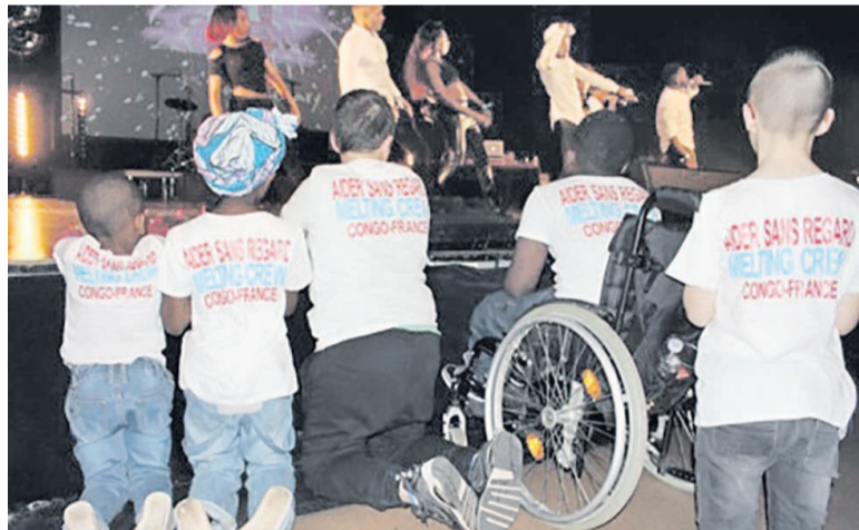
L'association ASR participe à la 6 e édition du Melting crew

Comme l'an passé à la même période, l'événement consacré à la musique et aux danses Afro-urbaines, initié par le Congolais Afouz Olongo, a enchanté le public. C'est aussi l'occasion de permettre à l'association congolaise Aider Sans Regard de collecter des fournitures scolaires pour la cinquième année consécutive.