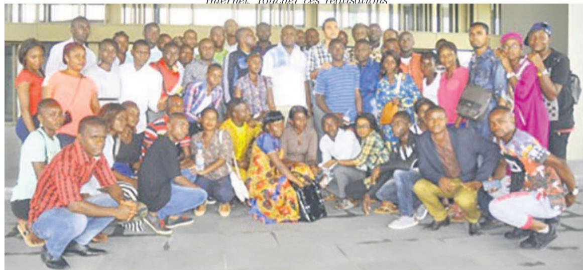
Le ministre posant avec les élèves au Centre de conférence internationale de Kintélé

ont ensuite contemplé le Viaduc qui ouvre la voie vers Kintélé, où ils ont visité tour à tour le Centre de conférence internationale (un véritable bijou regorgeant plusieurs départements) et l'université Denis Sassou N'Guesso.