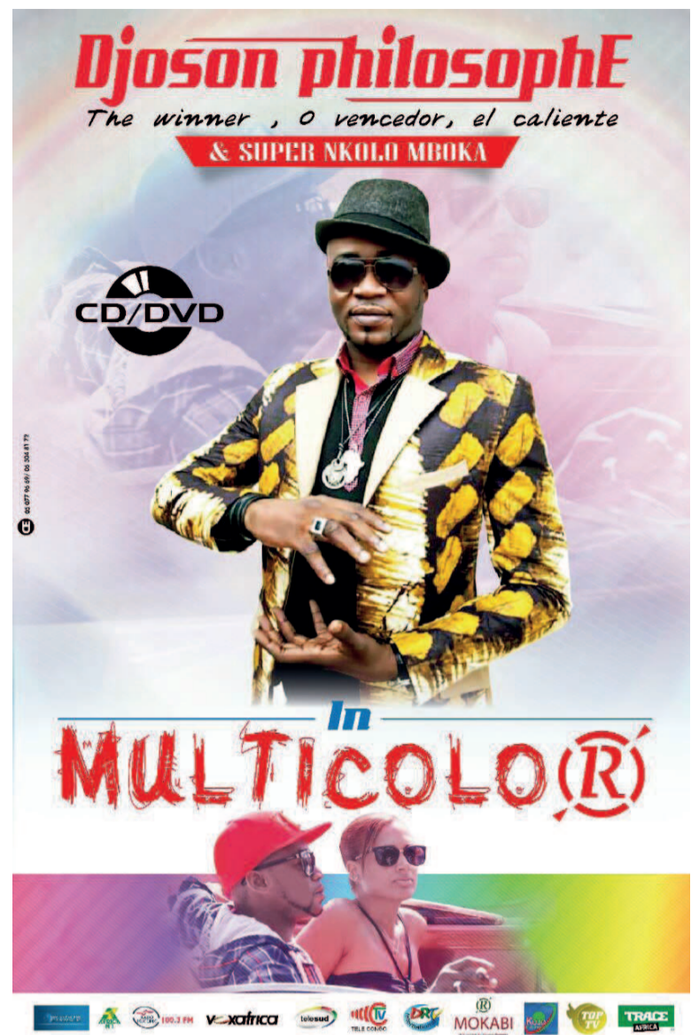
L'affiche de l'album

« Multicolor ». Les deux clips tournés et réalisés à Brazzaville mettent en exergue le paysage et les scènes de vie