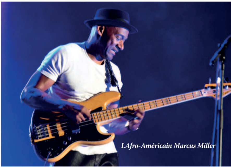
L'Afro-Américain Marcus Miller