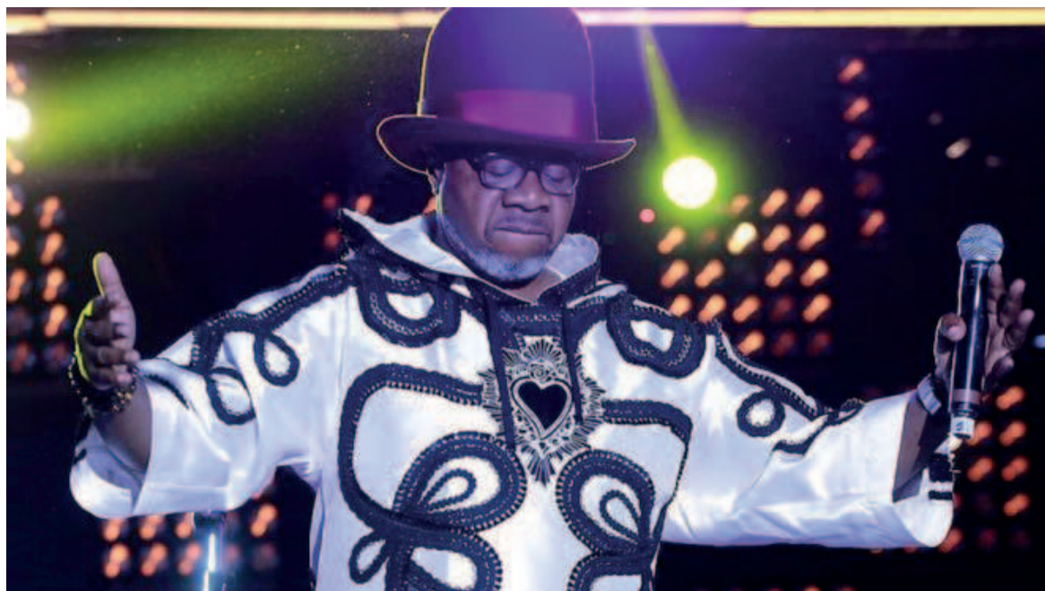
Papa Wemba sur scène lors de sa dernière performance

Les producteurs se donnent pour mission de reconstituer le puzzle du personnage, Jules Shungu Wembadio, entre chants et défilés de « sapeurs ».