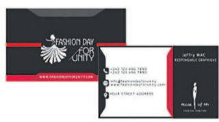
Cartes de visite