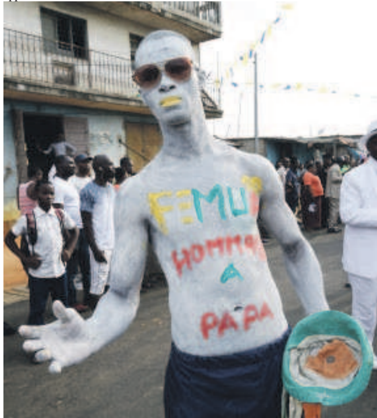
L'hommage des ivoiriens à l'idole de la chanson congolaise

Organisée jusqu'au 30 avril, cette édition du Femua est marquée par une programmation exceptionnelle avec des têtes d'affiches comme Salif Keita, la star de la musique malienne, le chanteur de reggae ivoirien Tiken Jah Fakoly, Marema (Sénégal), Bisa kdei (Ghana), Black M et Singuila (France) et Soul Bangs, prix découvertes RFI (Guinée).