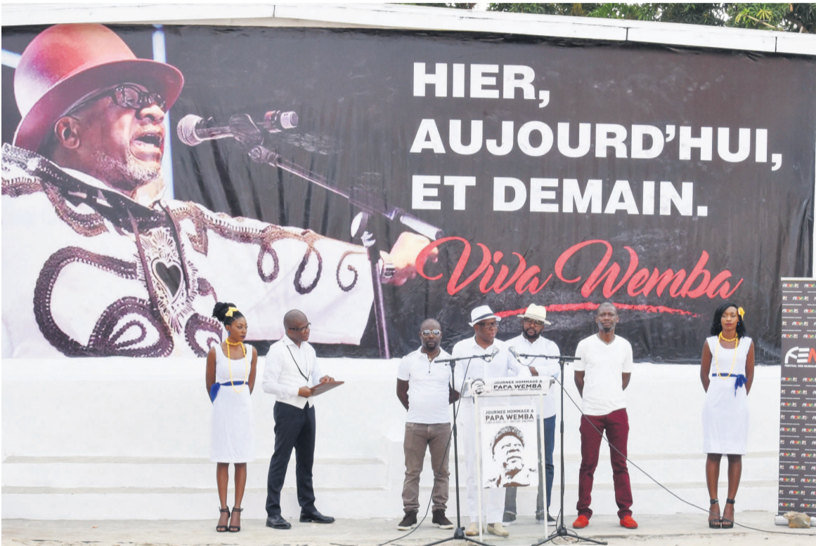
A'Salfo (au centre) entouré d'autres membres de la bande Magic System, lors de son discours en hommage à Papa Wemba le 24 avril 2017 à Abidjan dans le cadre du festival Femua.

N° 2901 DU 29 AVRIL AU 5 MAI 2017 / 200 FCFA, 300 FC, 1€