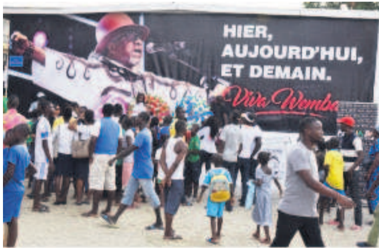
d'assumer cet héritage culturel colossal que nous a légué Papa Wemba »,

La petite plaque bleue portant l'inscription « Place Papa Wemba », fixée sur un mur à quelques mètres de la scène où le 24 avril 2016 la star de la musique s'était écroulée en plein spectacle lors du Femua, a été découverte par le ministre ivoirien de la Culture, Maurice Bandaman, et son homologue congolais Maurice Mashéké. Un moment rempli d'émotion qui a montré l'attachement de la Côte d'Ivoire à l'icône de la musique congolaise. « Papa Wemba s'en est allé mais son héritage demeure. Il nous appartient artistes d'ici et d'ailleurs