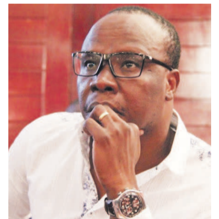
Salif Traoré, dit A'Salfo, leader du groupe Magic System

« Papa Wemba s'en est allé mais son héritage demeure. »