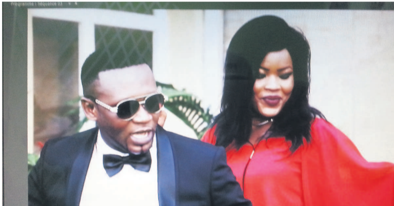
Une image de la chanson Rumba na piste

Soulignons que l'album Multicolor est un mélange de genres musicaux, à savoir : la samba brésilienne associée à la rumba congolaise d'une part et la salsa cubaine mélangée à la rumba congolaise d'autre part. « Cette association de genres est un nouveau style que j'apporte dans notre musique », se