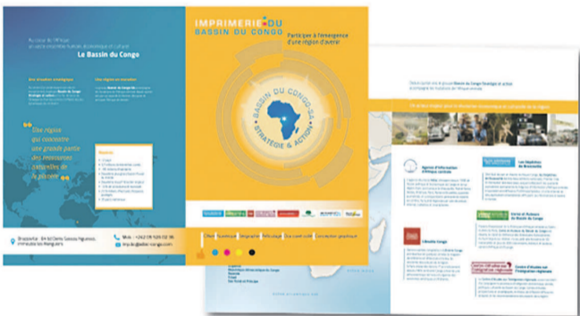
Chemises à rabat