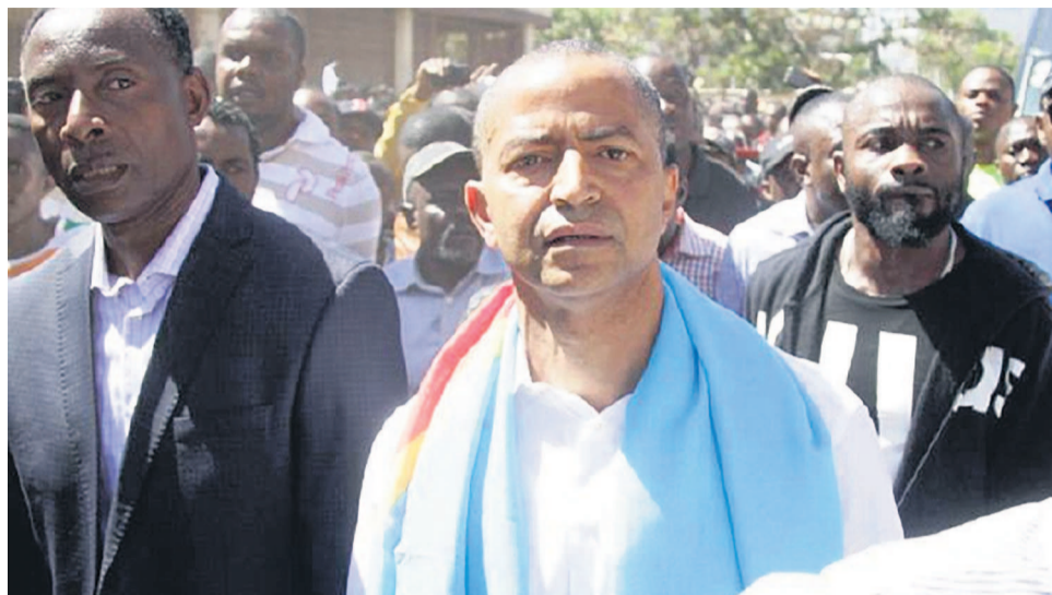
Moïse Katumbi Chapwe

Les régies financières, en l'occurrence, la direction générale des douanes et accises (DGDA), la direction générale des recettes