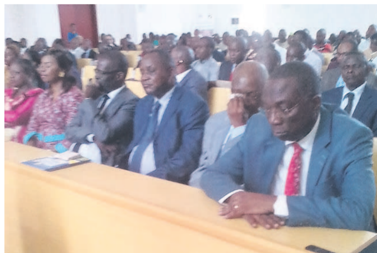
Le présidium

L'année dernière, plus de 240 congolais sont allés en Chine pour suivre les cycles de formation dans les différents secteurs. Avant la fin de cette année, 300 iront en Chine. L'ambassade souhaite une meilleure collaboration