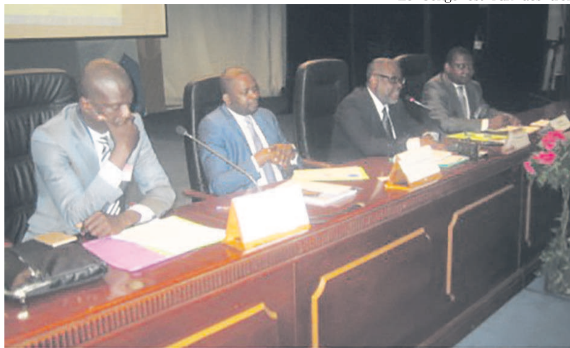
Le présidium de l'atelier

Initié par la Convention des Nations unies pour le commerce et le développement (Cnuced), à travers son groupe spécial sur les produits de base de 2015-2017, cet atelier réunit des experts, représentants du secteur public, acteurs de la société civile, associations des professionnels, universitaires et investisseurs. L'activité s'inscrit dans le cadre du projet de renforcement des capacités dans les secteurs pétrolier et minier dans les économies des pays de la Communauté économique des Etats de l'Afrique centrale (CEEAC). Celui-ci vise l'amélioration des effets structurants du secteur des ressources minières dans cette partie du continent africain. « La difficulté est que nous mettons sur le marché mondial des produits encore bruts, cela ne contribue pas assez à l'économie nationale en termes de création d'emplois et de richesse, de développement de