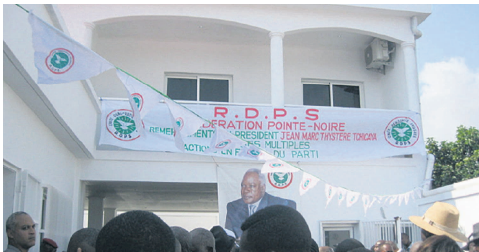
Siège interdépartemental du RDPS

Situé à Mvoumvou, dans le deuxième arrondissement, le nouveau bâtiment abritant le siège du RDPS pour les départements de Pointe-Noire et du Kouilou a été inauguré le 13 mai par Jean-Marc Thystère Tchicaya.