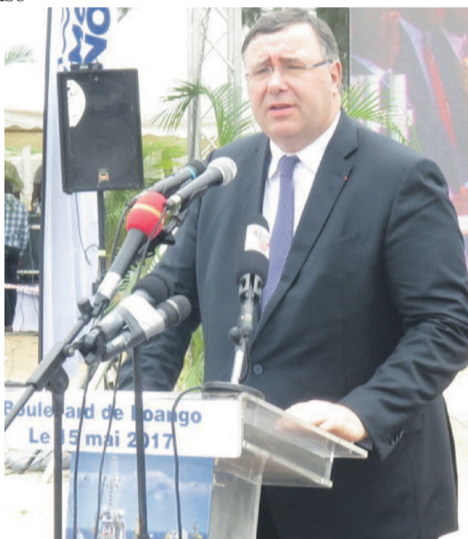
Patrick Pouyanné

« Ce projet n'a été rendu possible que grâce, aux multiples efforts déployés par des hommes et des femmes de toutes les équipes qui ont permis ce succès. Plus