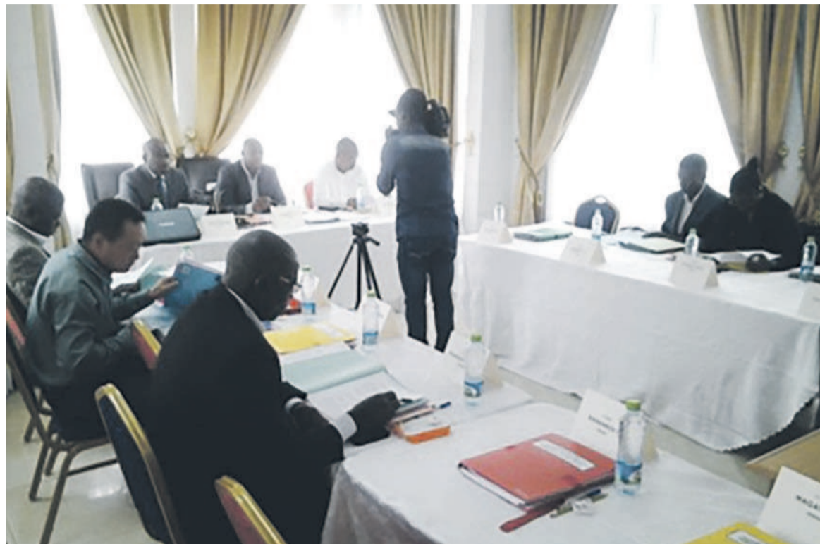
Des techniciens au comité de rédaction de la norme sur le ciment

Un comité technique composé des techniciens du ministère de l'Industrie, ceux en bâtiments et travaux publics, des chercheurs de l'Université Marien-N'Gouabi, les cimentiers ainsi que les associations des consommateurs, s'est réuni le 15 mai à Brazzaville. Objectif : élaborer un document de référence sur le ciment produit en République du Congo.