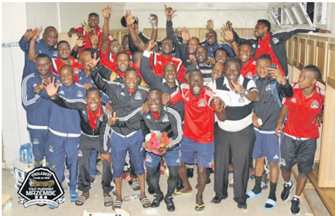
TP Mazembe de Lubumbashi

Dominateur dans le jeu, le TP Mazembe a également été dominateur au tableau d'affichage, le dimanche 14 mai 2017 dans son stade de la commune de Kamalondo à Lubumbashi, aux dépens de la formation du CF Mounana du Gabon.