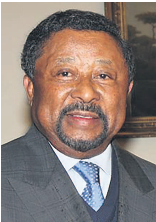
Jean Ping

Dans ce même élan, les femmes du CNR ont symboliquement déposé une bouteille remplie de sable devant l'ambassade de France à Libreville pour attirer l'attention d'Emmanuel Macron « sur les risques d'implosion de la société gabonaise ». Expliquant ce geste issu de la coutume locale, l'un des partisans