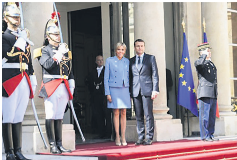
Le couple présidentiel

Pour gouverner et mettre en oeuvre son programme libéral, en économie comme sur les sujets de