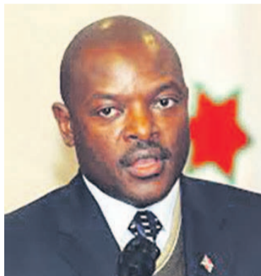
Pierre Nkurunziza (DR)

« Cette situation doit être minutieusement étudiée pour éviter de créer des ennemis au sein des forces vives (...).