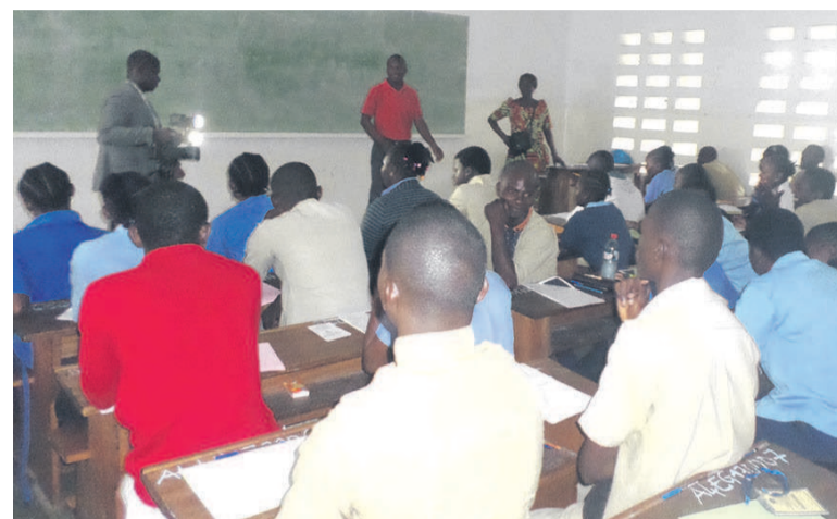
Les candidats en salle à Pointe-Noire

Le ministre de l'Enseignement primaire, secondaire et de l'alphabétisation, Anatole Collinet Makosso, qui séjourne dans la partie sud du pays, a encouragé le 1 er juin les candidats des départements de Pointe-Noire et du Kouilou à donner le meilleur d'eux-mêmes jusqu'au dernier jour.