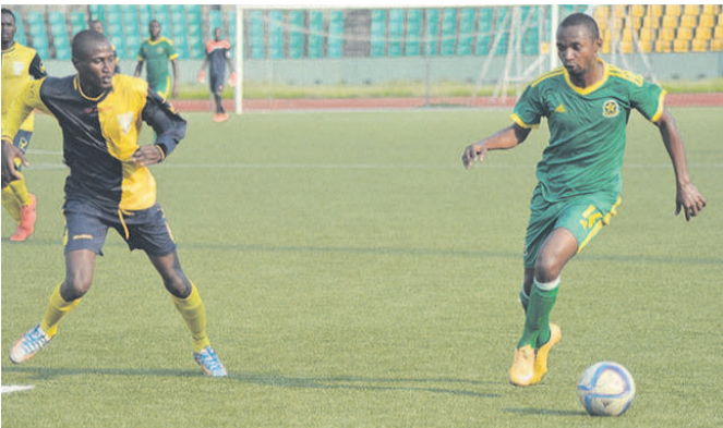
Ni vainqueur ni vaincu entre l'Etoile du Congo et ASK (Adiac)

Dimanche 4 juin au stade Alphonse-Massamba-Débat, Diabls noirs reçoit G17 avant FC Racine-Interclub. Au Complexe sportif de Pointe-Noire, FC Pèlerin sera aux prises à l'AS Cheminots avant la