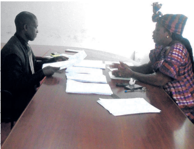
Le secrétaire général du P.A.R se renseigne sur la constitution du dossier

Le jeudi 1 er juin, deuxième jour de dépôt de candidatures, l'engouement des candidats n'était pas visible à la Direction générale des affaires électorales (DGAE).