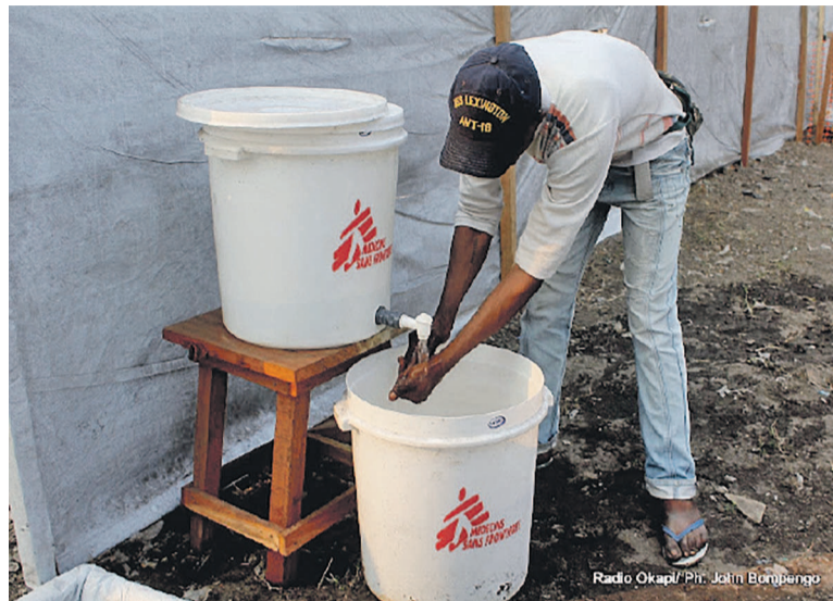
Une de précautions d'usage, dans les centres de traitement de choléra et pour la prévention de la maladie.

Les autorités sanitaires locales citées par le bureau des Nations unies pour la coordination de l'aide humanitaire (Ocha), ont signalé, pour la seule période du 08 au 21 mai 2017, 142 cas de choléra dans la zone de santé de Bukama, qui a été déclarée en épidémie depuis le 12 mai dernier. Ocha a, par ailleurs, noté que la Croix-Rouge congolaise poursuit ses activités de chloration dans la zone de santé de Kisanga wa Bioni, l'épicentre de l'épidémie. De son côté, l'Unicef fournira un soutien pour prévenir toute nouvelle