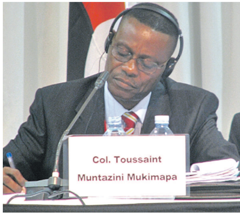
Le colonel Toussaint Muntazini

Le haut magistrat, originaire de la RDC, vient d'effectuer son premier séjour à Bangui, en Centrafrique, depuis le jeudi 25 mai dernier. Il a comme mission d'enquêter sur les crimes commis par les groupes armés depuis 2003. Créée en 2015, la Cour pénale spéciale (CPS) centrafricaine a pour mandat d'enquêter, de poursuivre et de juger les crimes résultant de violations graves des droits de l'homme en RCA.