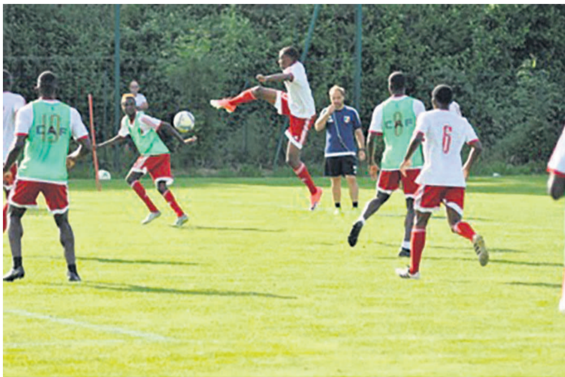
Travail physique et séance techniques intenses

« Sans effort, pas de résultat » : la formule fourmille sur les réseaux sociaux dans sa forme anglophone (no pain, no gain). Et devait tourner en boucle dans la tête des joueurs, lors de la courte mais intense séance physique du mercredi matin. Difficile d'affirmer dès aujourd'hui que les Diables rouges rapporteront un ou trois buts de Kinshasa. Mais ils font, depuis le début de ce stage, tout pour optimiser leur chance. Dans la sueur, l'engagement et la bonne humeur. C'est cet état d'esprit qu'ils ont ensuite abordé la séance technique en fin d'après-midi. Sur terrain réduit, l'accent était mis sur les constructions offensives par le biais d'oppositions avec des joueurs en points d'appuis fixes. Des séquences intenses et disputées : le sélectionneur a distribué deux cartons jaunes fictifs pour calmer les ardeurs d'un groupe où la concurrence s'exacerbe, à l'approche de la