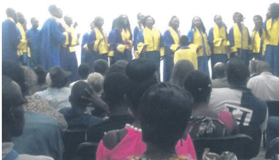
la chorale Karisma Afro-gospels