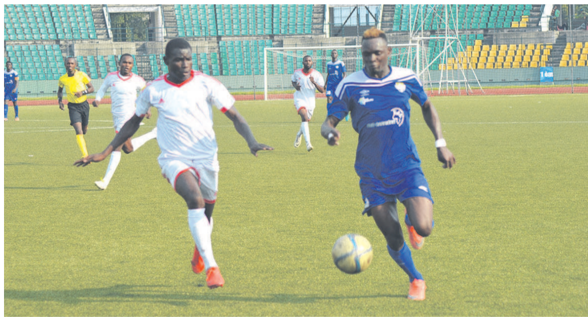
Le match aller opposant à Brazzaville la JSP à l'AS Otoho (Adiac)

La nette victoire de JSP sur Otoho invalidée par la Fécofoot