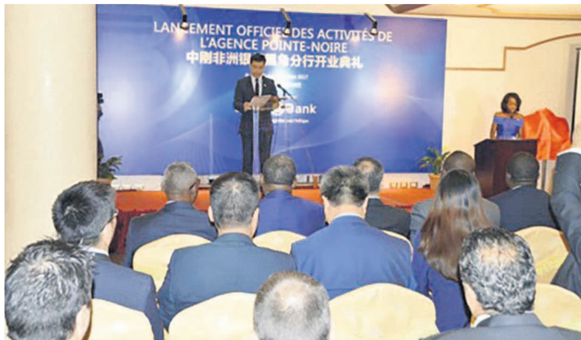
Cérémonie du lancement de l'agence de Pointe-Noire (DR)

Lors de la cérémonie d'ouverture de l'agence de Pointe-Noire, les responsables de cette banque ont promis offrir aux opérateurs économiques locaux, entre autres, produits classiques et modernes, des comptes courants, comptes