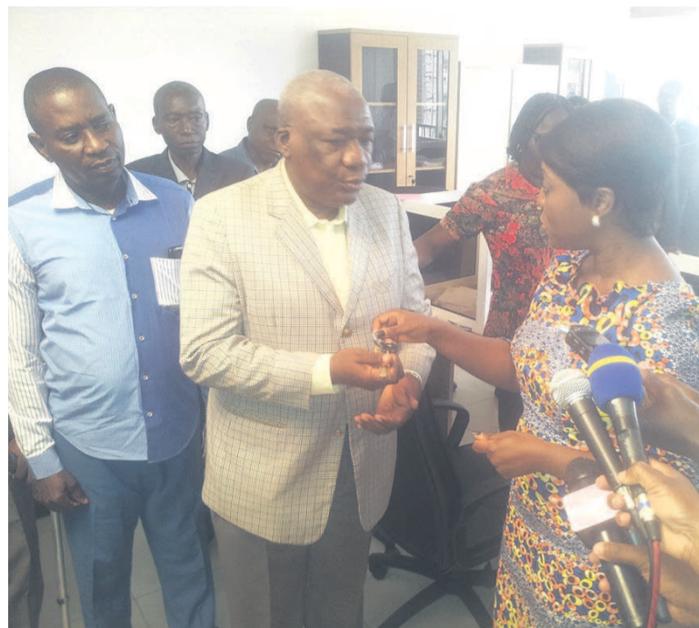
Mme la ministre du Tourisme et des loisirs remettant les clés du nouveau local au directeur général du Tourisme et de l'hôtellerie

A son tour, le directeur général du Tourisme et de l'hôtel-