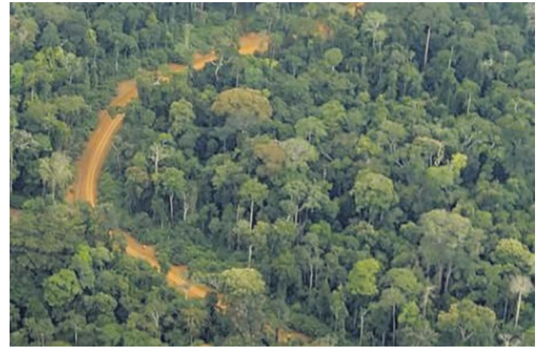
Le massif forestier du Nord-Congo/Adiac

Un accord de financement a été signé récemment entre le Congo et la Banque mondiale. Il prévoit un financement de 6,51 millions de dollars, soit près de 3,8 milliards de FCFA, pour dynamiser les activités du Projet forêt et diversification économique (Pfde).