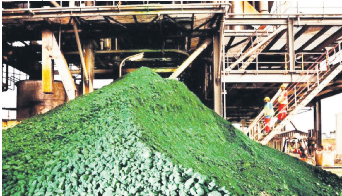
Exploitation d'une mine de cobalt au Katanga