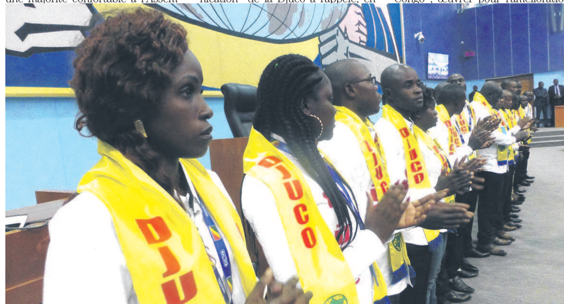
Des jeunes de la Djuco /Adiac