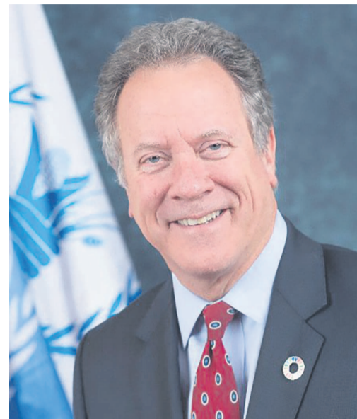
David Beasley

David Beasley a insisté pour que les pays riches comme la Grande Bretagne, l'Allemagne, et en particulier la France, envoient davantage d'aide. Paris ne fait pas assez en versant seulement 30 millions de dollars, a estimé le chef du PAM. « Nos statistiques montrent que si nous ne recevons pas dans les trois ou quatre prochains mois ce dont nous avons besoin pour fournir de la nourriture, il est possible de voir mourir 600.000 enfants », a prévenu le directeur du PAM. Et selon lui, le PAM a déjà diminué de moitié les rations distribuées aux ré-