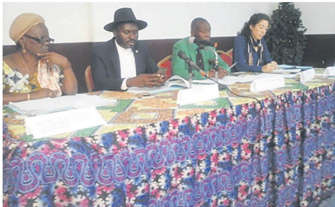
La tribune lors de la réunion à Lumumba

L'objectif global de ce projet est de contribuer à l'amélioration du respect des droits des femmes et filles congolaises conformément aux engagements internationaux et nationaux du Congo du respect des droits humains « Ce projet qui propose une approche globale pour lutter contre toutes les formes de violence à l'encontre des femmes et des enfants s'articule sur trois axes, à savoir un acte de sensibilisation, un acte de protection et un acte de plaider. Dans l'axe de protection, ce projet prévoit l'établissement d'un guichet unique sur Brazzaville et sur Pointe-Noire pour recevoir les victimes, leur proposer une assistance psychologique, médicale. Ce guichet est déjà fonctionnel à Brazzaville et Pointe-Noire. Dans les prochaines semaines, les actions de sensibilisation seront menées dans vos circonscriptions auprès des populations cibles