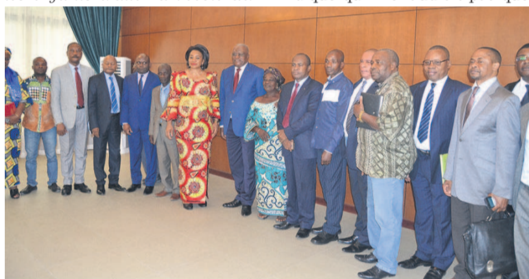
Les deux ministres entourés des chefs de villages et les autres partenaires