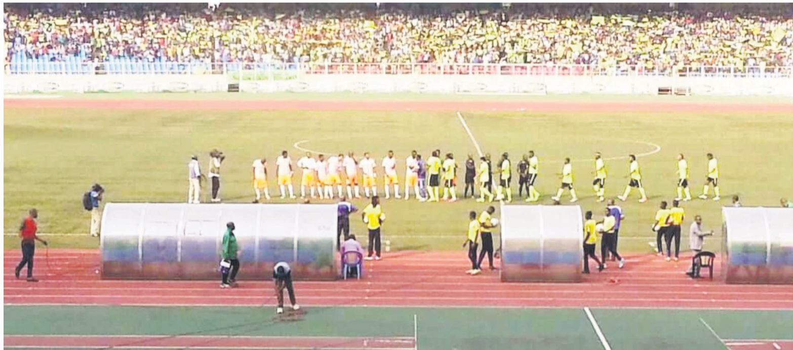
Le FC Renaissance du Congo et V.Club avant le coup d'envoi du match