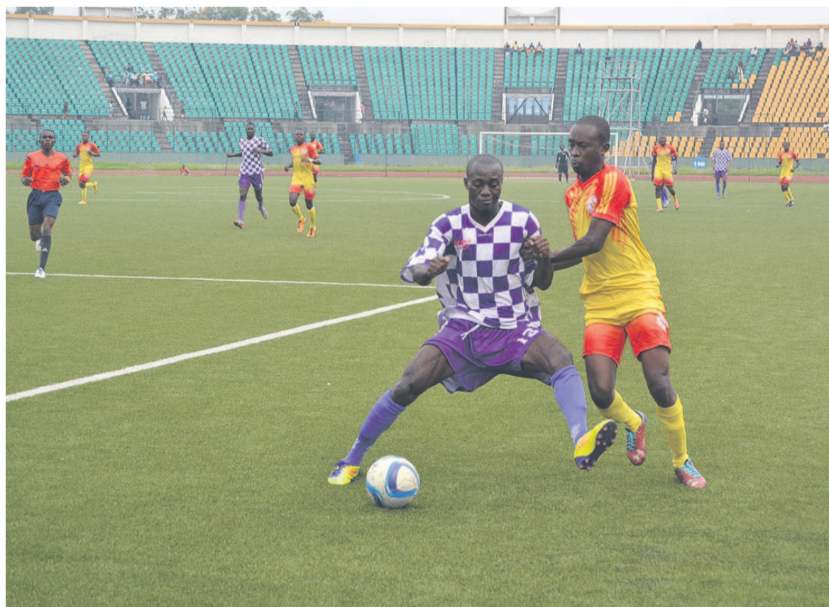
Une rencontre du championnat Adiac

La 26 e journée débute, quant à elle, débute le 14 juillet. La JSP accueille l'ASK puis en deuxième explication Tongo FC croise Saint Michel de Ouenzé. Le 15 juillet, le FC Kondzo reçoit le FC Nathalys avant le match JST-Patronage Sainte-Anne. Le 16