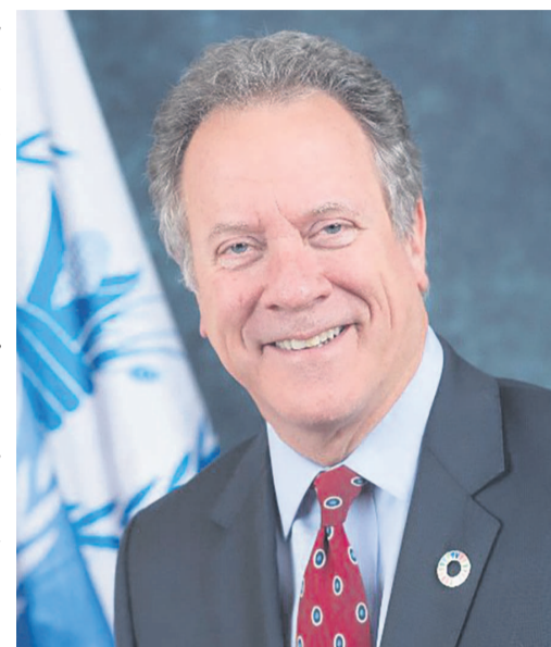
David Beasley

Grande Bretagne, l'Allemagne, et en particulier la France, envoient davantage d'aide. Paris ne fait pas assez en versant seulement 30 millions de dollars, a estimé le chef du PAM. « Nos statistiques montrent que si nous ne recevons pas dans les trois ou quatre prochains mois ce dont nous avons besoin pour fournir de la nourriture, il est possible de voir mourir 600.000 enfants », a prévenu le directeur du PAM. Et selon lui, le PAM a déjà diminué de moitié les rations distribuées aux ré-