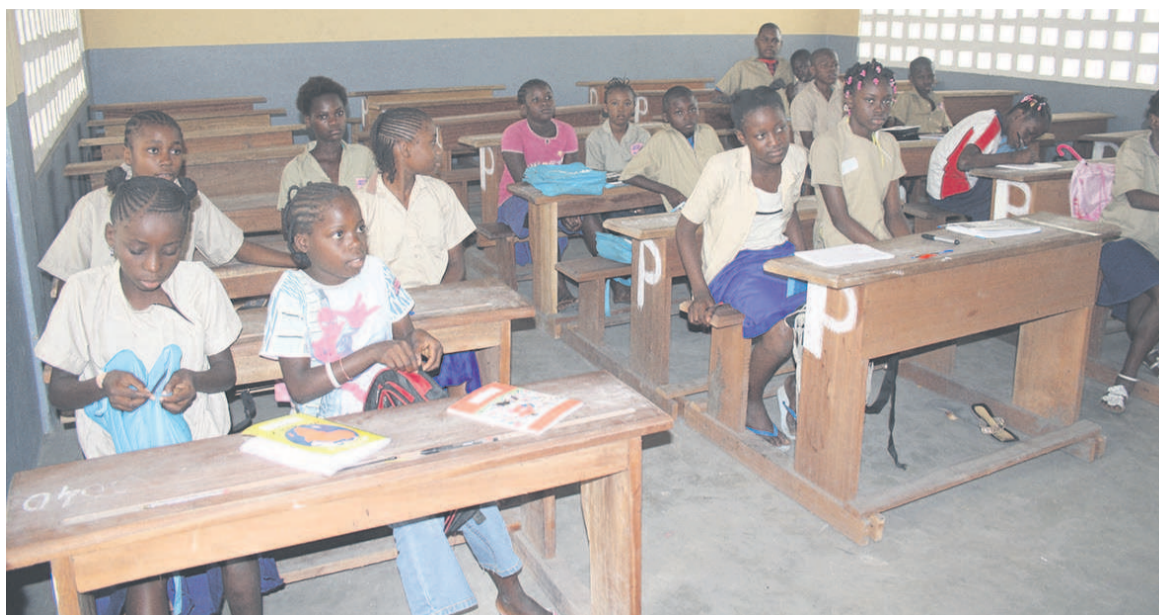
Des élèves

A l'issue de cette visite, le directeur de cabinet s'est dit satisfait du bon déroulement de cette session qui, selon lui, est à la hauteur des candidats. Tous les sujets relèvent, a rappelé Adolphe Mbou Maba, du programme étudié en classe.