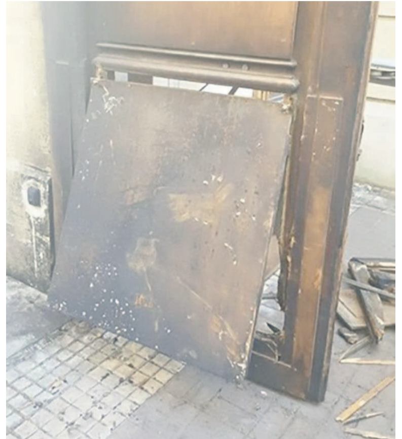
Vue partielle de l'entrée principale de la chancellerie de l'ambassade du Congo en France