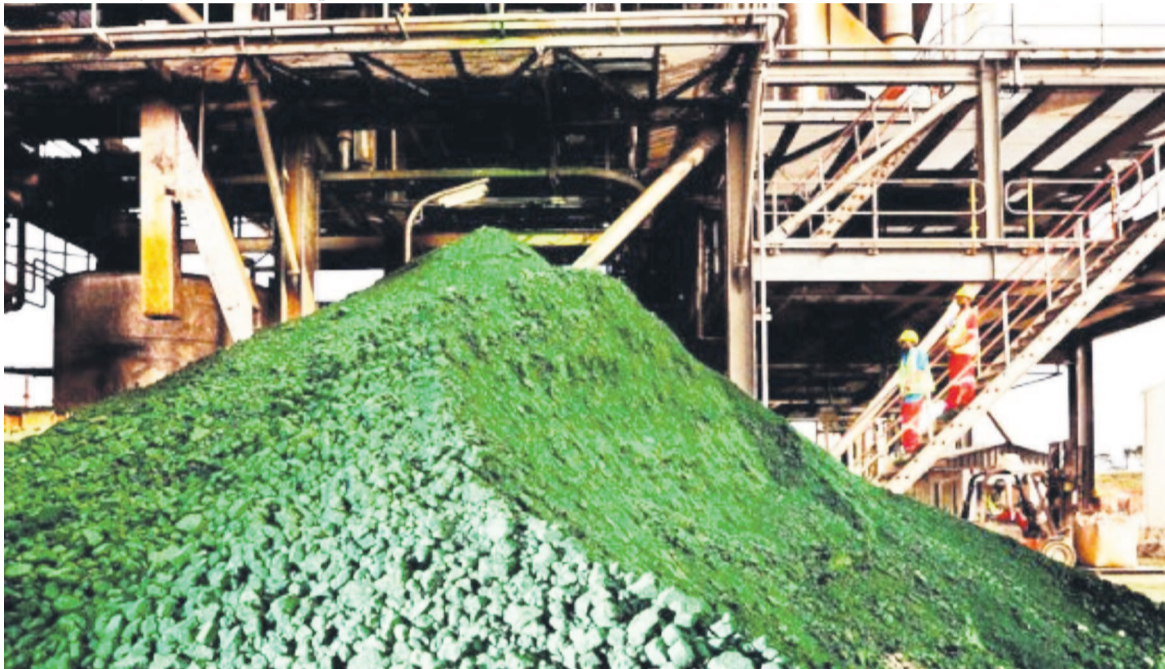
Exploitation d'une mine de cobalt au Katanga

l'État de demander aux opérateurs miniers implantés au pays l'obligation de rapatrier conformément à la loi 40% de bénéfice sur toute exportation de minerais», a déclaré Joseph Kapika. Le ministre a averti que les entreprises qui ne respectent pas cette disposition subi-