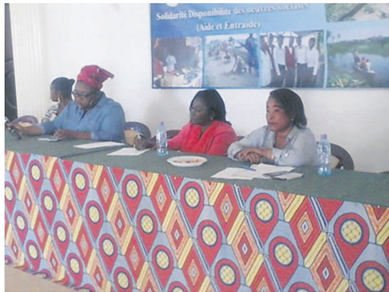
Les animatrices du focus

Pour le Groupe de réflexion contre les violences basées sur le genre, ce cadre d'échanges et de partage a été créé pour aider, accompagner, soutenir aussi les veuves et les orphelins et valoriser leurs droits bafoués souvent en cas du décès d'un des conjoints. Cependant, les juristes qui ont animé le focus ont insisté pour que les femmes cessent de vivre en concubinage, mais elles