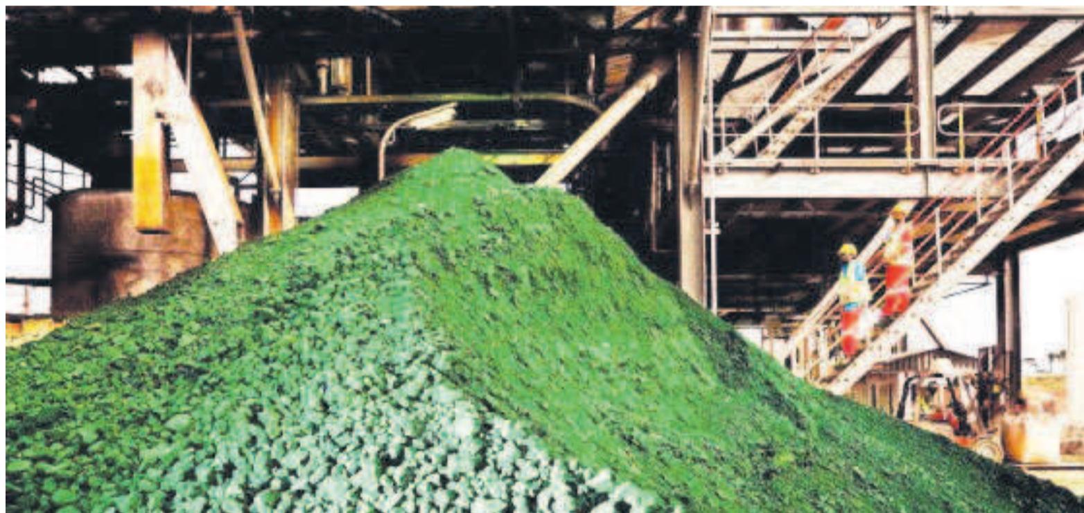
Exploitation industrielle d'une mine de cobalt à l'ex Katanga