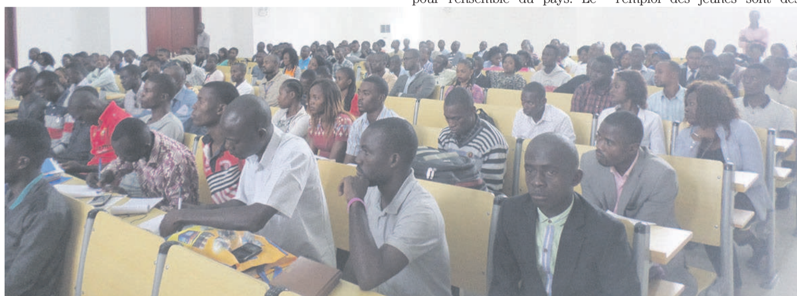
Une vue des participants à la journée inaugurale de la semaine de développement des compétences ; crédit photo Adiac

Au programme des conférences-débats portant sur diverses thématiques à savoir : « Le développement des compétences pour élargir les perspectives d'emploi des jeunes au Congo » ; « Comment se vendre sur le marché de l'emploi ? » ; « Les métiers du cinéma au Congo ». Les autres communications porteront sur « Jeunes du Congo : Enjeux et défis dans la mise en œuvre des ODD » ; « les ateliers pratiques recherche