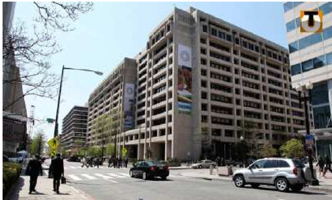
Le siège du Fonds monétaire international (FMI) à Washington

Le contexte politique de la RDC ne joue pas en faveur d'un programme de soutien financier après une rupture de la stabilité du cadre macro-économique au dernier semestre de l'année 2015. Pour le Fonds monétaire international (FMI), il se pose encore plusieurs préalables, dont l'épineuse question de la stabilité politique, pour répondre favorablement à la demande des autorités congolaises. L'aide sollicitée devrait intervenir dans le cadre de la Facilité de crédit rapide. Pour nombre d'analystes, l'institution financière internationale s'aligne à la position affichée plus tôt par l'Union européenne, les États-Unis d'Amérique et l'ONU sur le respect de l'Accord global