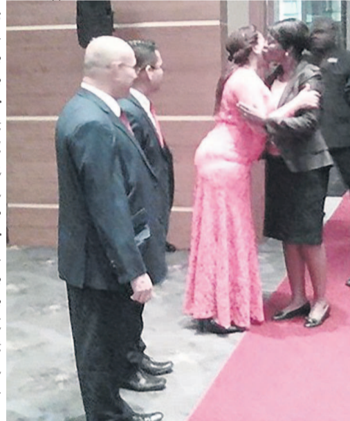
L'ambassadeur du Venezuela au Congo recevant la ministre du Tourisme et des loisirs (Adiac)

Une autre avancée importante du gouvernement vénézuélien a été