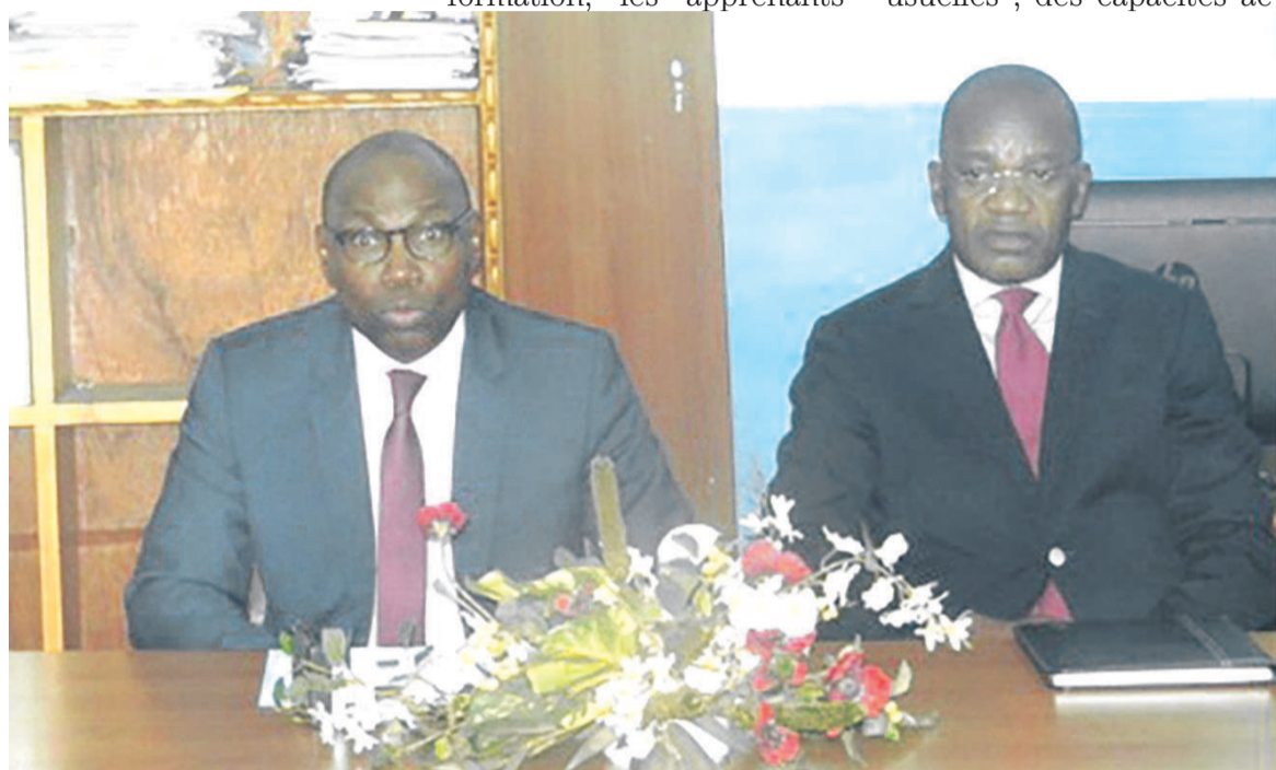
Le directeur général de l'économie et le coordonnateur du Respec à l'ouverture du séminaire de formation

« Un des objectifs spécifiques de ce séminaire est de vous donner les outils nécessaires pour exploiter efficacement le modèle