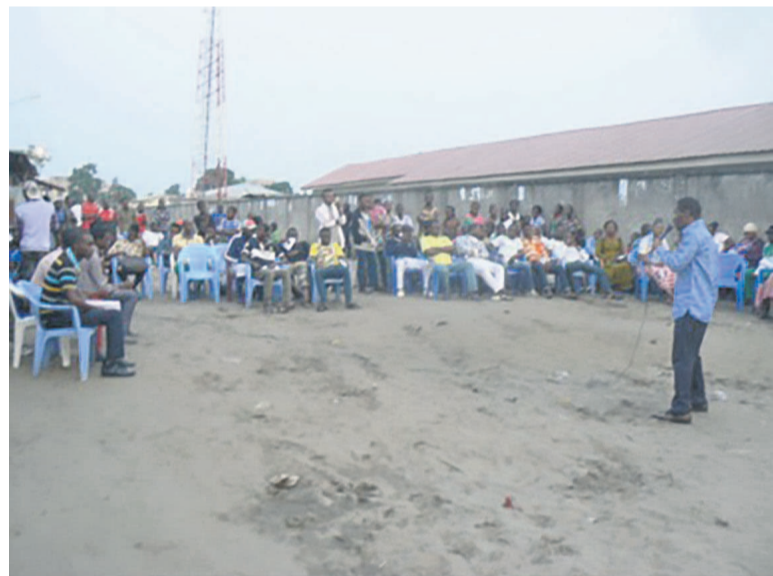
Crépin Keouosso Okimango explique les projets du Front Patriotique à Talangaï

Le candidat du Front patriotique (FP) aux locales 2017, Crépin Keouosso Okimango, a expliqué le 10 juillet à Talangaï, aux électeurs leurs projets de jumelage à exécuter pour le compte du 6 e arrondissement de Brazzaville.