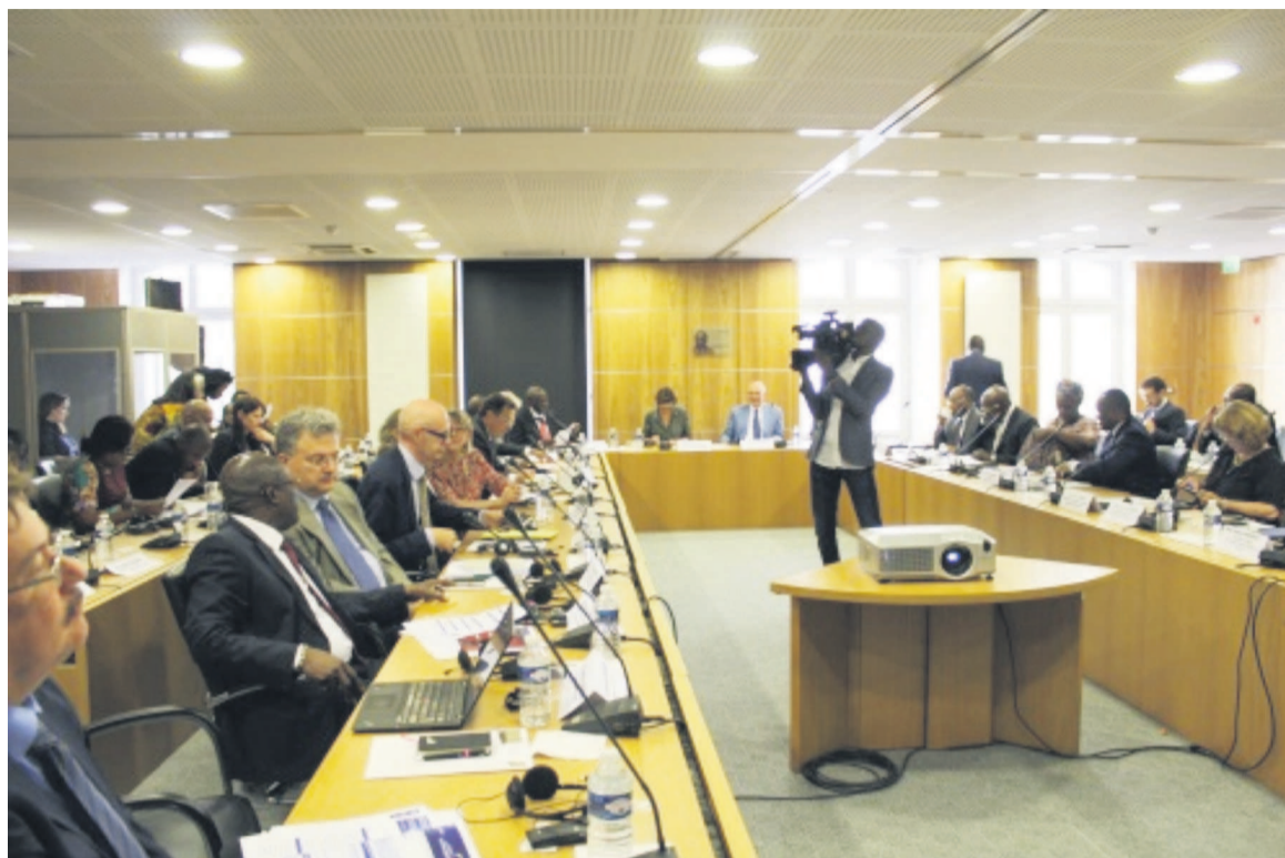
La salle lors de cette réunion

Cette rencontre exceptionnelle, a souligné un communiqué de l'OIF, visait également à poursuivre les échanges avec la communauté internationale sur le processus électoral, en y associant les autorités congolaises, qui ont une responsabilité majeure pour la tenue d'élections libres, fiables, inclusives et transparentes, dans le respect des clauses de l'Accord de la Saint-Sylvestre. Ces échanges ont permis d'examiner l'état de la situation poli-