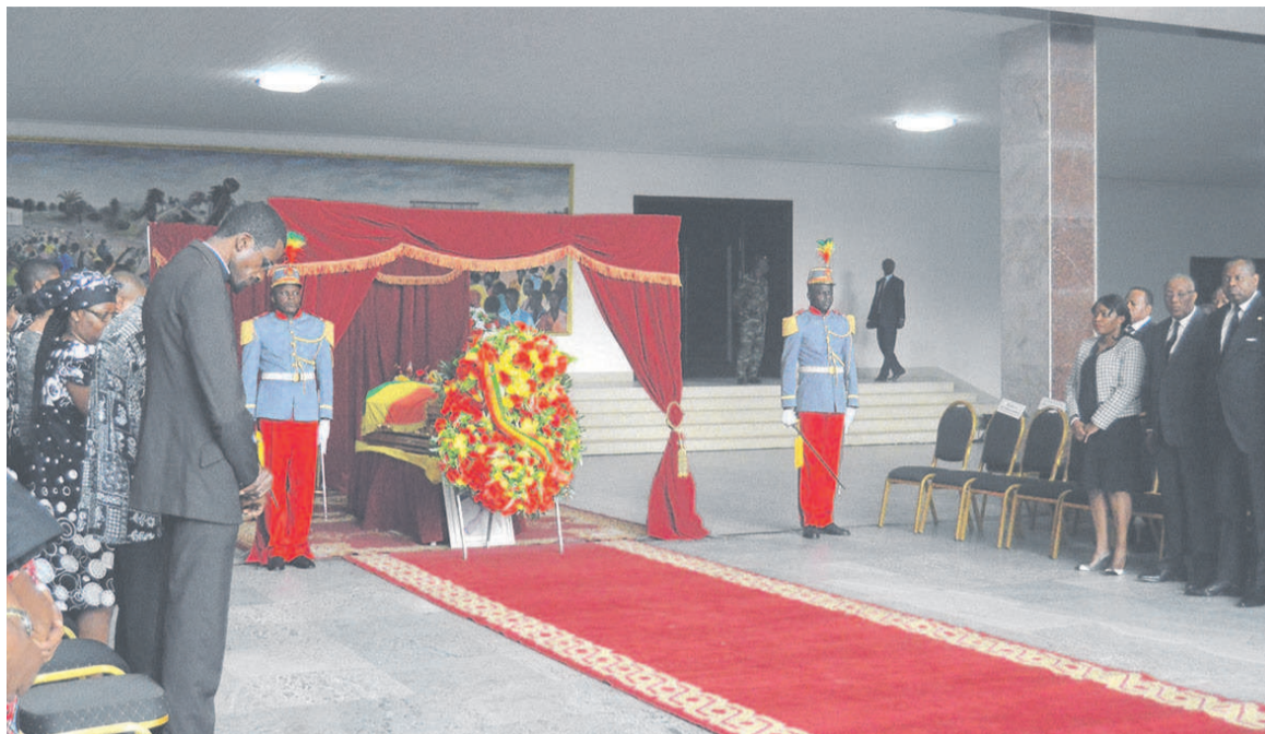
Le recueillement des membres du gouvernement et de la famille