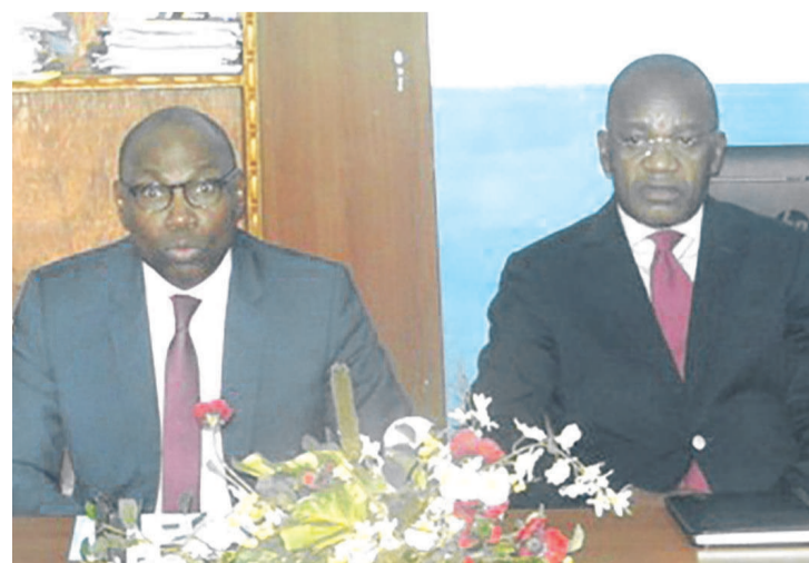
Le directeur général de l'économie et le coordonnateur du Respec à l'ouverture du séminaire de formation

En vue de renforcer ses capacités en matière de statistiques, études prospectives et planification, dans le cadre de la lutte contre la pauvreté, le gouvernement congolais organise, du 11 au 14 juillet, un atelier de formation sur la modélisation macroéconomique à Brazzaville. L'initiative trouve sa raison d'être dans l'obsolescence et le peu de fiabilité des données économiques du pays.