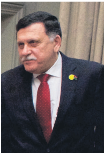
Fayed al-Sarraj

Notons que la Libye était privée pendant 40 ans d'une véritable loi fondamentale. Elue depuis 2014, l'assemblée constituante avait 18 mois pour rédiger ce projet de Constitution. Mais, le chaos dans