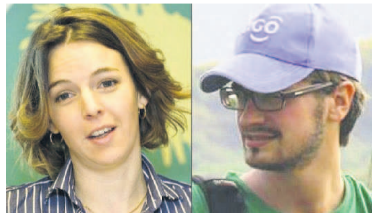
Zaida Catalan et de Michael Sharp

D'après quelques fuites glanées par-ci par-là, il en retourne que ledit rapport d'enquête serait truffé de beaucoup de mystères non encore élucidés. Très peu de certitudes caractériseraient, en effet, ce rapport sur lequel l'opinion internationale fondait énormément d'espoirs pour en savoir un peu plus sur les circonstances de l'assassinat de deux experts onusiens au Kasai. Il s'agissait, pour les enquêteurs, d'établir les faits et trouver les auteurs de l'as-