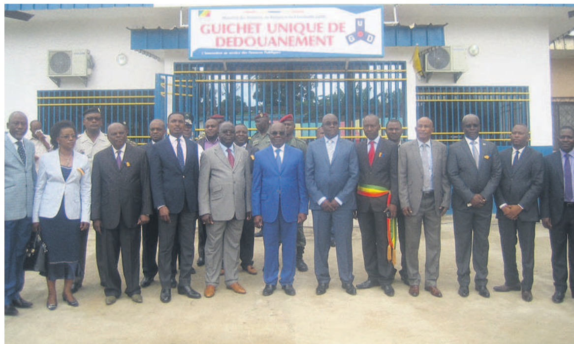
Les autorités devant le GUD de Ouesso