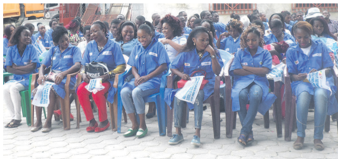
Une vue des bénéficiaires (Adiac)

Au terme d'une formation de neuf mois, financée par le gouvernement japonais et appuyée par l'Unicef, 520 jeunes dont 246 filles déscolarisées ont bénéficié de kits pour leur insertion socio-professionnelle. Les métiers ciblés sont la couture, la pâtisserie, la coiffure et la maçonnerie.