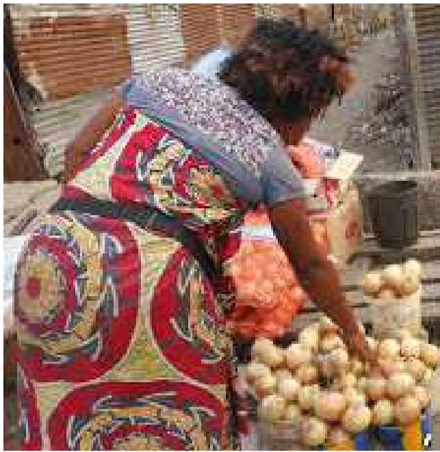
Une vendeuse d'oignons