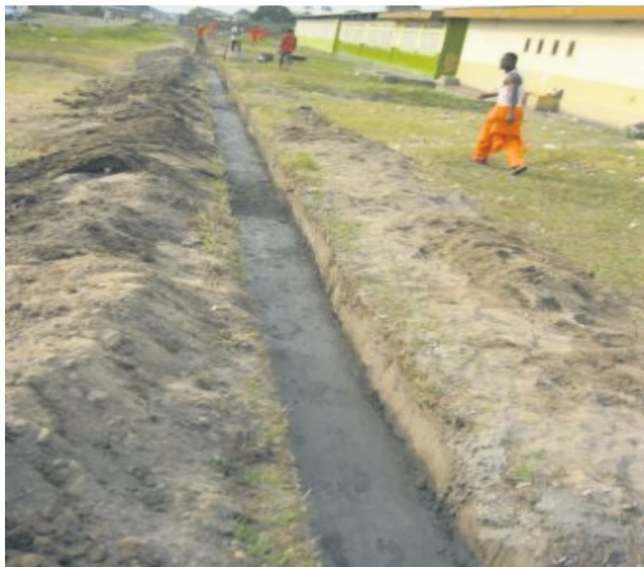
Les travaux de construction du mur de clôture du lycée Mpaka