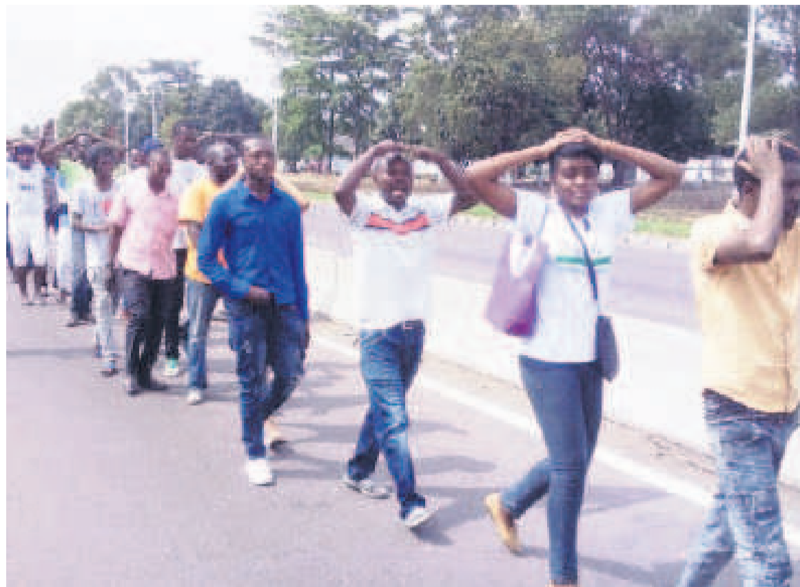
Des manifestants sur le boulevard Triomphal à Kinshasa

Cela fait près d'un an que cette décision avait été prise. Pour l'autorité politico-administrative, c'était pour éviter des troubles et des victimes comme cela a pu