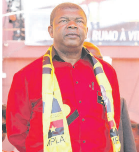
Joao Lourenço