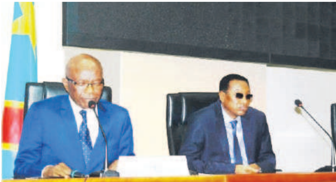
Le ministre Michel Bongongo et le Premier ministre Bruno Tshibala au lancement du processus de recrutement des 1 000 jeunes universitaires

ministration de développement Michel Bongongo a relevé le fait que le « Programme du gouvernement d'union nationale met un accent particulier sur le renforcement de l'efficacité de l'État et la consolidation de son autorité ». Dès lors, le volet Assurance-Qualité, renforcement des capacités, de la réforme marque une réelle insistance sur « la nécessité de rajeunir les effectifs de l'Administration publique. Cela, en vue de profiter des avantages comparatifs qu'offre une jeunesse formée aux normes d'une administration de développement ». Il a notamment épinglé au nombre de ces avantages incontournables « l'esprit de créativité, d'anticipation, la maîtrise de l'outil informatique, la culture des