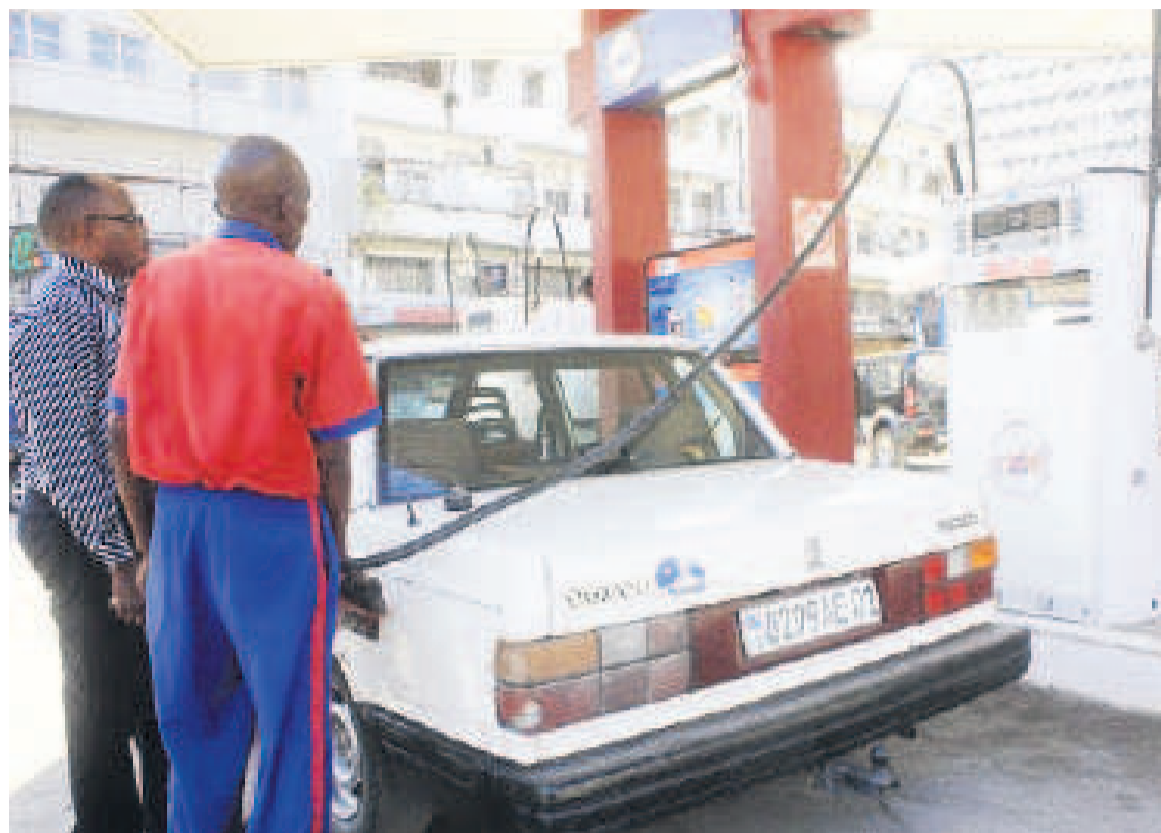
Un pompiste en activité dans une station-service

Les Congolais en général et les Kinois en particulier peuvent se tranquilliser. Il n'y aura pas d'augmentation de prix des produits pétroliers à la pompe. Leurs appréhensions de voir les paramètres de fixation du prix du carburant être modifiés par rapport au taux de change appliqué sur le marché viennent, en effet, d'être balayés à la faveur d'une récente rencontre entre le gouvernement et les opérateurs du secteur. Ces derniers tenaient impérativement à hausser les prix du litre d'essence, de gasoil et de pétrole pour faire face au changement constaté sur le marché avec, à la clé, l'instabilité du taux de change en hausse constante pendant que la structure des prix appliquée dans les stations-service demeure inchangée.