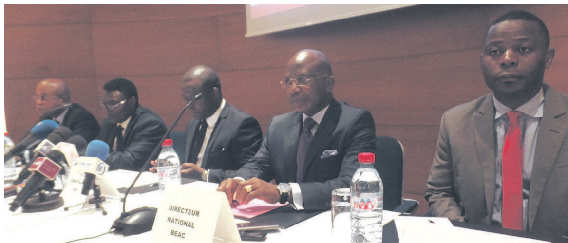
La tribune officielle

Selon le directeur national de la BEAC, Michel Dzombala, sur la dernière émission du mois de juillet 2017, d'un montant de 8 milliards de FCFA, il n'a été observé qu'une participation de