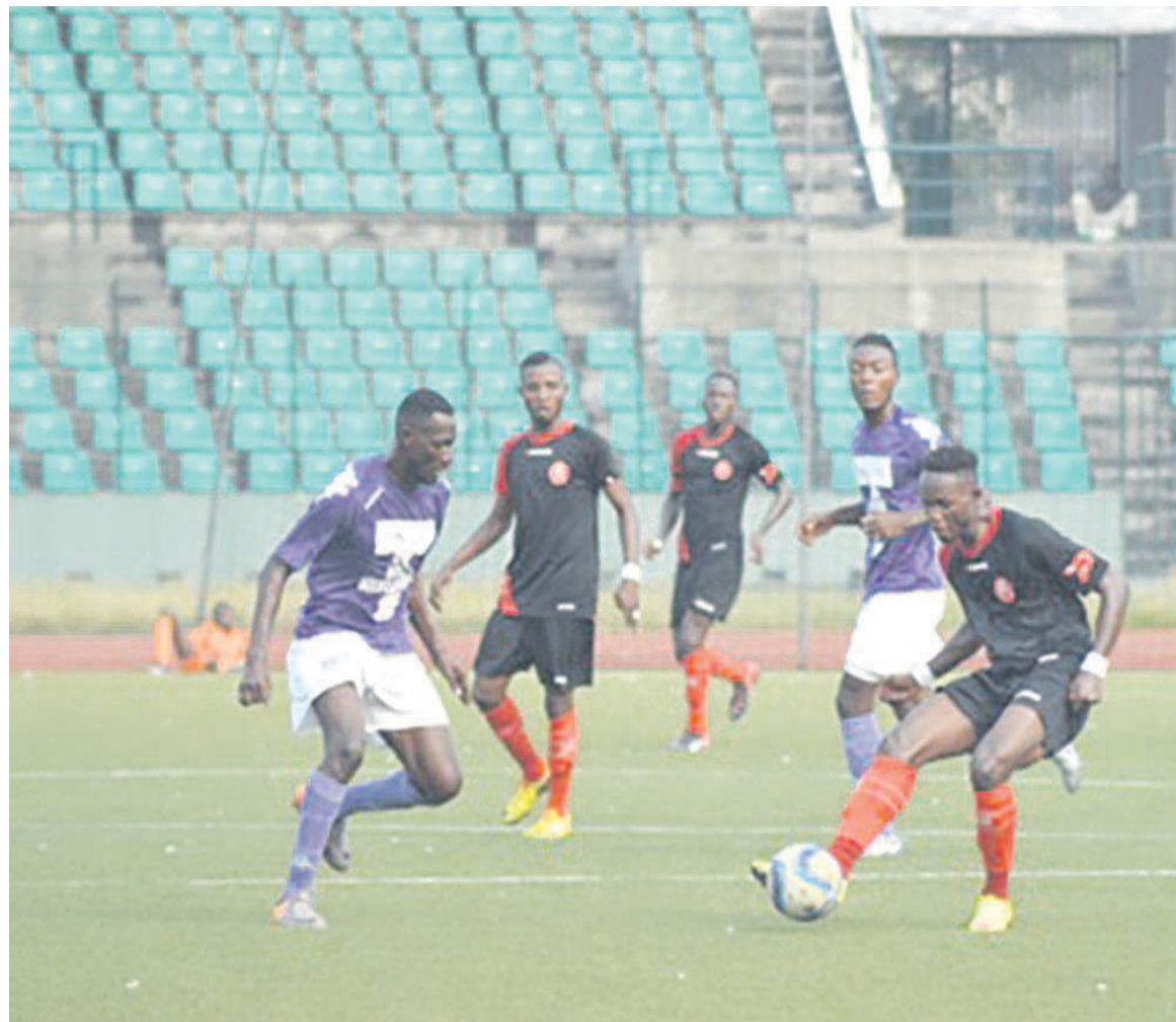
Tongo-Cara, l'une des affiches des demi-finales

Les Diables rouges, rappelés-le, ont effectué le week-end dernier un déplacement en Guinée Equatoriale en vue d'affronter sa sélection locale qui prépare également sa double confrontation contre