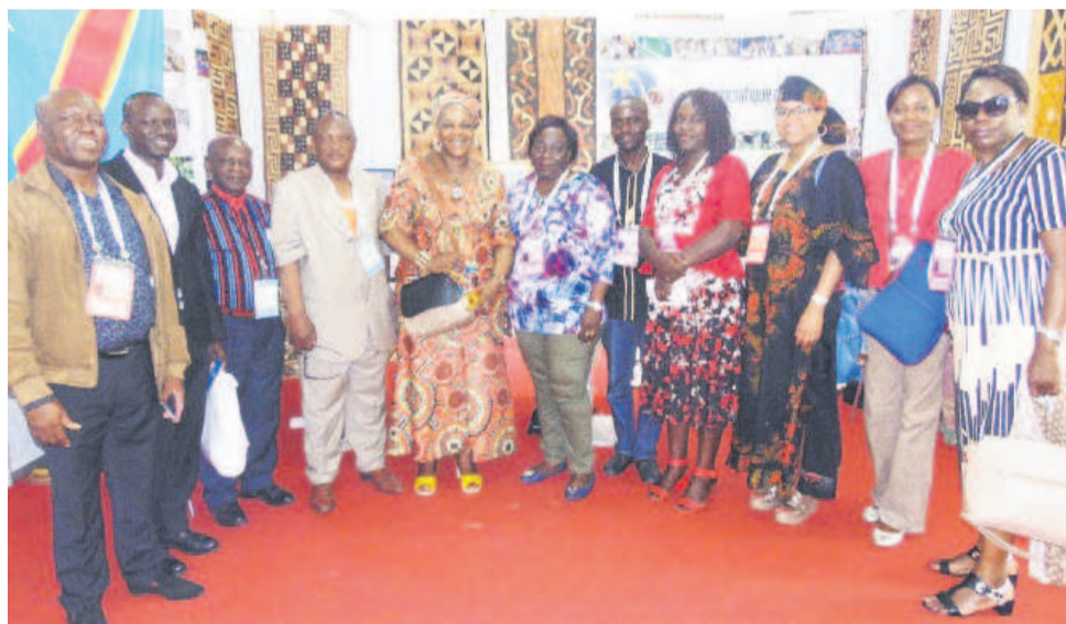
La délégation de la RDC dans le stand

marge des huitièmes jeux de la Francophonie, la RDC a participé au village de la Francophonie érigé, du 22 au 30 juillet, au Palais de la culture à Abidjan. Cette vitrine a été très visitée notamment par les ressortissants congolais vivant à Abidjan qui ont été fiers de voir leur pays présent à cet espace multinational. Les nombreux visiteurs au quotidien ont dé-