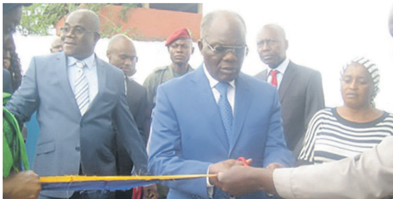
Coupure du ruban symbolique

Préoccupé par la sécurisation des recettes publiques, le ministère des Finances, du budget et du portefeuille public a rendu opérationnel, hier, le Guichet unique de dédouanement (GUD) de Ouesso, dans le département de la Sangha.