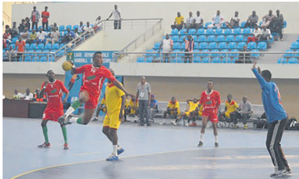
Rencontre de handball