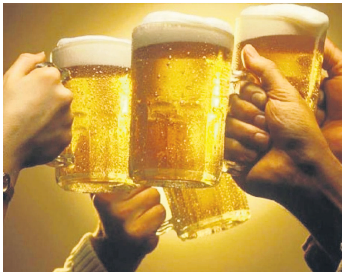
Des verres de bières

Un deuxième jeune prend la parole pour répondre à son collègue toujours dans un style ironique : « Et comme la bière a une journée que le monde célèbre, donc c'est un bon produit, alors continuons de la consommer même sans modération ». Ces propos indiquent bien que la journée de la bière n'est pas connue par ceux-là même qui la consomment. Cependant, les