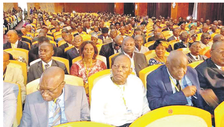
Des fonctionnaires à l'ouverture du séminaire d'orientation

Le gouvernement a décidé de majorer le salaire des agents et fonctionnaires de l'État de toutes les provinces de la RDC de 20 mille francs congolais (FC). Dans une correspondance datée du 22 août, le ministre d'État à la Fonction publique a demandé à son homologue du Budget de « donner des instructions urgentes à ses services en vue de matérialiser cette décision du gouverne-