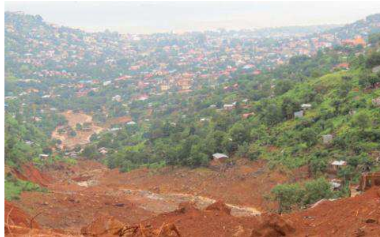
Vue partielle de la province de l'Ituri

Contrairement aux inondations de Freetown dans la nuit du 13 au 14 août, l'éboulement du 16 août en RDC n'a pas eu lieu dans une capitale relativement facile d'accès pour les sauveteurs et les médias mais à près de 2.000 km au nord-est de Kinshasa, dans la province de l'Ituri, sur les bords du lac Albert frontalier de l'Ouganda. Alors que l'évolution du bilan humain est suivi au jour le jour en Sierra Leone (810 personnes portées disparues et plus de 500 morts confirmés), personne ne sait encore précisément combien de victimes ont été emportées par la coulée de boue qui a submergé le village de pêcheurs de Tara. Entre 150 et 250, selon le vice-gouverneur de la province, Pacifique Keta, en ajoutant les quarante corps déjà enterrés dans les deux jours et ceux encore ensevelies sous les décombres des 48 maisons détruites. M. Keta a indiqué à l'AFP avoir «décidé de suspendre les recherches pour privilégier la désinfection» sur les lieux du drame, craignant «la propagation des maladies à plusieurs autres villages de pêcheurs installés le long de la rive du lac Albert». Le président congolais Joseph Kabila «a appris avec consternation le glissement de terrain survenu le mercredi 16 août» et «présente ses condoléances les plus attristées à tous les compatriotes ainsi qu'aux riverains éprouvés», a indiqué un communiqué de la présidence daté du 22 août, six jours après la catas-