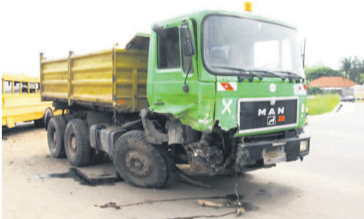
Un camion accidenté laissé sur la voie publique

Le Commissaire divisionnaire principal a averti les propriétaires de ces engins du passage des camions porte-tout de la PNC, en vue de les récupérer pour la casse, à l'expiration de ce délai. Il justifie cette décision par le souci d'assainir la capitale congolaise.