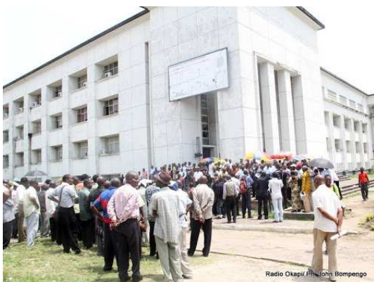
Les fonctionnaires devant le bâtiment de la Fonction publique suivant un speech de la délégation syndicale

Mais la radio onusienne a, par ailleurs, rappelé qu'en juillet dernier, l'Intersyndicale nationale de la Fonction publique et le gouvernement avaient