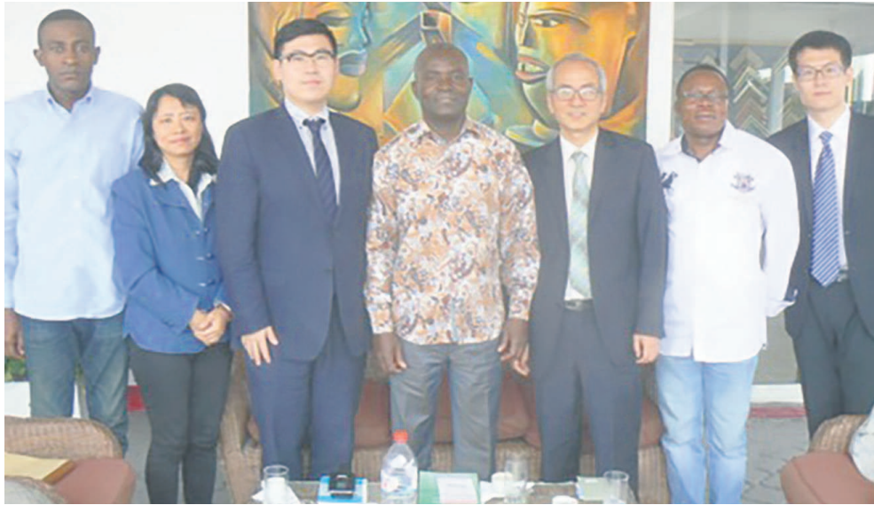
Les chercheurs chinois en photo de famille avec les responsables de la rédaction

« L'investissement à l'agriculture n'est pas profitable à la Chine, car nous finançons plus que nous gagnons. Nous exportons