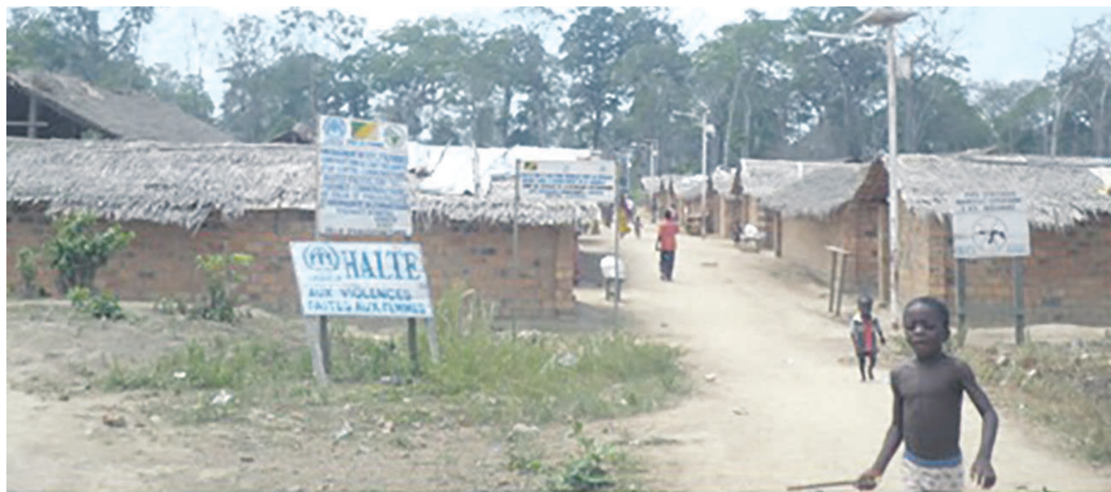
Un camp des réfugiés centrafricains à Bétou

En effet, effectuée entre 2014 et 2016, cette évaluation tient tant du point de vue de son adéquation par rapport aux priorités exprimées dans les documents de politique internationale et nationale que de l'adéquation des objectifs auxquels il vise à répondre relativement aux besoins des populations. Selon les résultats, le Haut-commissariat aux réfugiés (HCR), le Programme alimentaire mondial (PAM), l'Unicef et autres agences onusiennes ont mobilisé pendant cette période 54.024.916 dollars pour des besoins estimés à 68.607.620 USD. Les résultats escomptés liés à une efficacité des interventions menées ont été atteints pour le secteur de la santé. Concernant le domaine de l'assistance humanitaire, les secteurs de la protec-