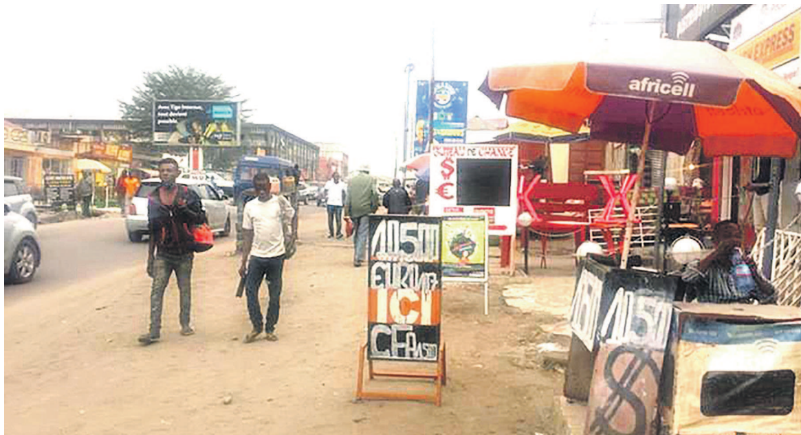
Dans une avenue de Kinshasa

La Banque centrale du Congo (BCC) a revu à la hausse ses prévisions pour fin 2017. Le taux d'inflation devrait finalement atteindre 52,6 % contre les 48 % de la dernière prévision. Quant à l'évolution du cadre macro-économique, la récente intervention