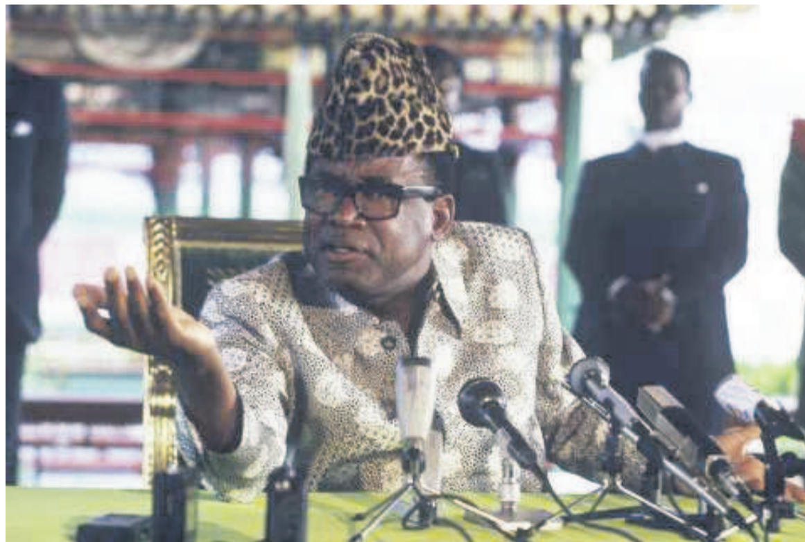
Feu Maréchal Mobutu