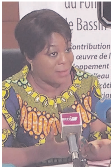
Arlette Soudan-Nonault répondant aux questions de la presse

La ministre du Tourisme et de l'environnement, Arlette Soudan-Nonault, a animé une conférence de presse, le 06 septembre à Brazzaville, sur les enjeux de la participation de la République du Congo à la 23 e session de la Convention cadre des Nations unies sur les changements climatiques (Cncucc), qui aura lieu du 06 au 17 novembre 2017 à Bonn en Allemagne sous la présidence des îles Fiji.