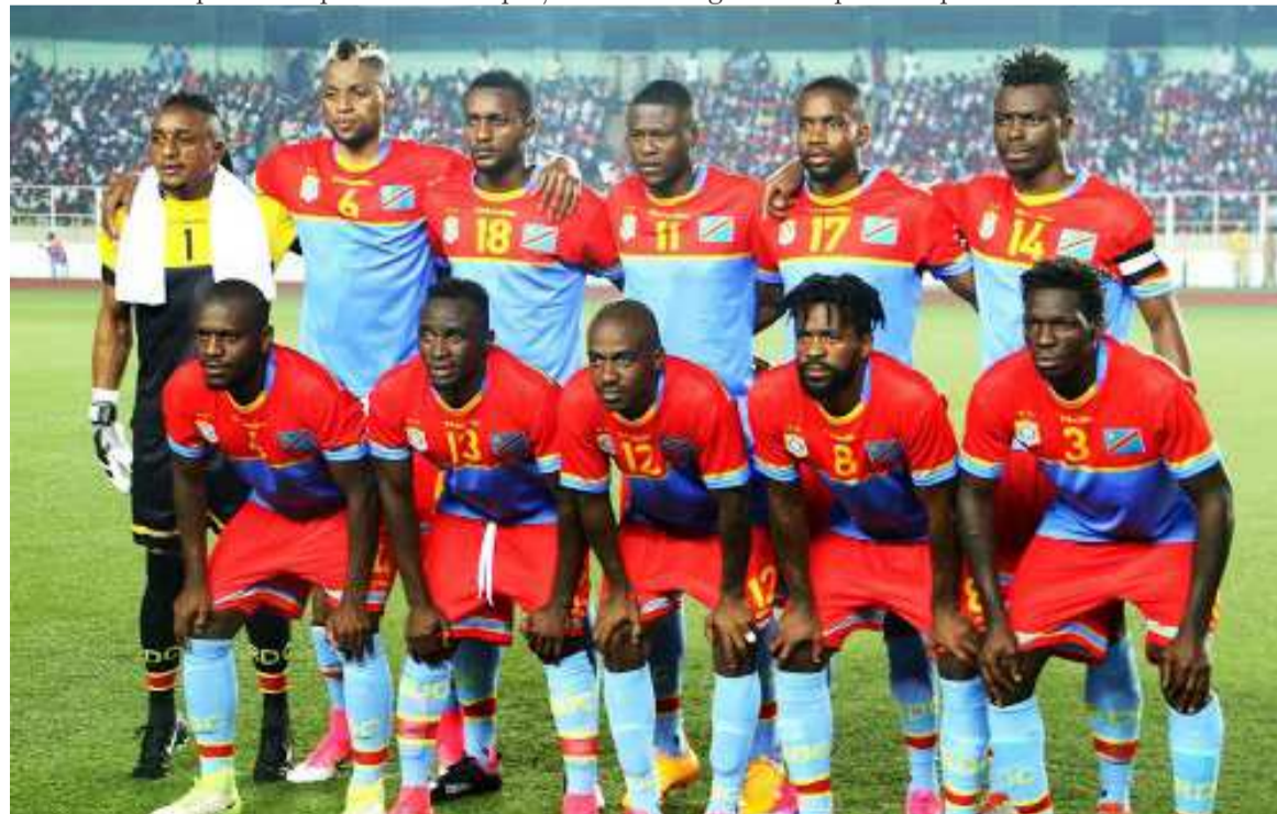
Les Léopards de la RDC.

sormais plus son destin en main. Dans l'autre match du groupe, la Guinée s'est inclinée le lundi face à la Libye par zéro but à un. Au classement, la Tunisie est seule en tête avec dix points, devant la RDC qui compte sept points. La Libye et la Guinée ont chacune trois points. La RDC joue son prochain match en novembre à Monastir en Tunisie contre la Libye, avant la dernière journée à domicile contre la Guinée. Dans d'autres rencontres de groupes des éliminatoires de la Coupe du monde Russie 2018, on retient le match à égalité entre le Cameroun et le Nigeria (1-1), la très large victoire du Ghana à Brazzaville face au Congo Brazzaville (5-1), la victoire du Cap-Vert en déplacement face à l'Afrique du Sud (2-1), le surprenant succès du Gabon face à la Côte d'Ivoire à Abidjan (1-2), le résultat d'égalité entre le Burkina Faso et le Sénégal (2-2), la courte mais précieuse victoire de l'Égypte sur l'Ouganda au Caire (1-0), le nul entre le Mali et le Maroc à Bamako (0-0), et la victoire de la Zambie sur l'Algérie (1-0).