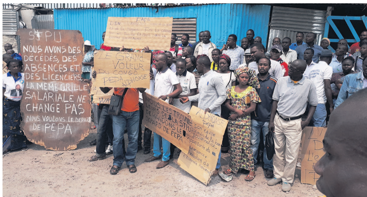
Les travailleurs de la STPU lors de l'assemblée générale

Réunis en assemblée générale le 6 septembre à Brazzaville sous la direction de leur syndicat, les travailleurs de la Société des transports publics urbains (STPU) ont appelé à l'intervention du président de la République, afin de trouver une solution à la crise que traverse cette entreprise.