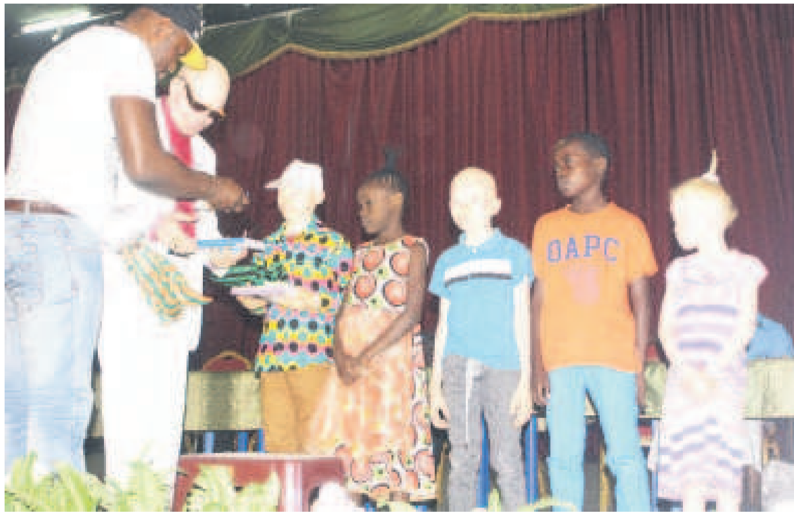
Remise symbolique des fournitures scolaires

Expliquant le sens de ce geste, le président national de la FMT a noté que pour cette fondation, cet apport en fournitures scolaires constitue pour elle