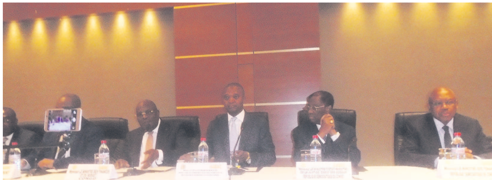
Les responsables du Gabac à l'ouverture de la réunion

Le Gabac est constitué des pays membres de la Communauté économique et monétaire des états d'Afrique centrale (CEMAC) et de la République démocratique du Congo (RDC). Pour parvenir à sa bataille contre le blanchiment des capitaux, le Gabac compte sur les Agences nationales d'investi-