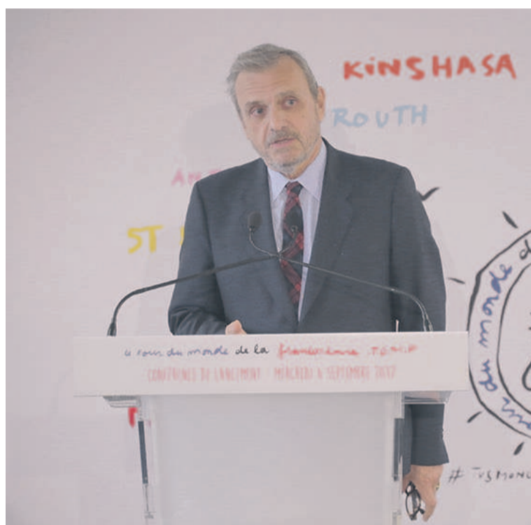
Jean-Charles de Castelbajac

combats au sein de la francophonie et la «formidable énergie qui s'en dégage», a relevé Michaëlle Jean, secrétaire générale de l'OIF. Delphine Ernotte, présidente de TV5MONDE et de France Télévision a pour sa part souligné l'ampleur inédite de l'opération qui mobilise d'importants moyens - 10 satellites, 15 cars de production, 140 caméras, etc. Une prouesse technique au moment où des sommes vertigineuses sont dépensées dans des programmes anglo-saxons. «Pour ne pas laisser à d'autres le monopole de