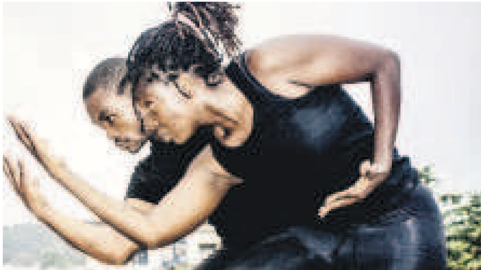
Un extrait de Para Dignita

De l'espagnol Para Dignita, ou « Pour la dignité » en français, a été inspiré à la base d'un travail accompli par Kongo Drama Company dans le cadre du Programme Refugees on the Move de la fondation