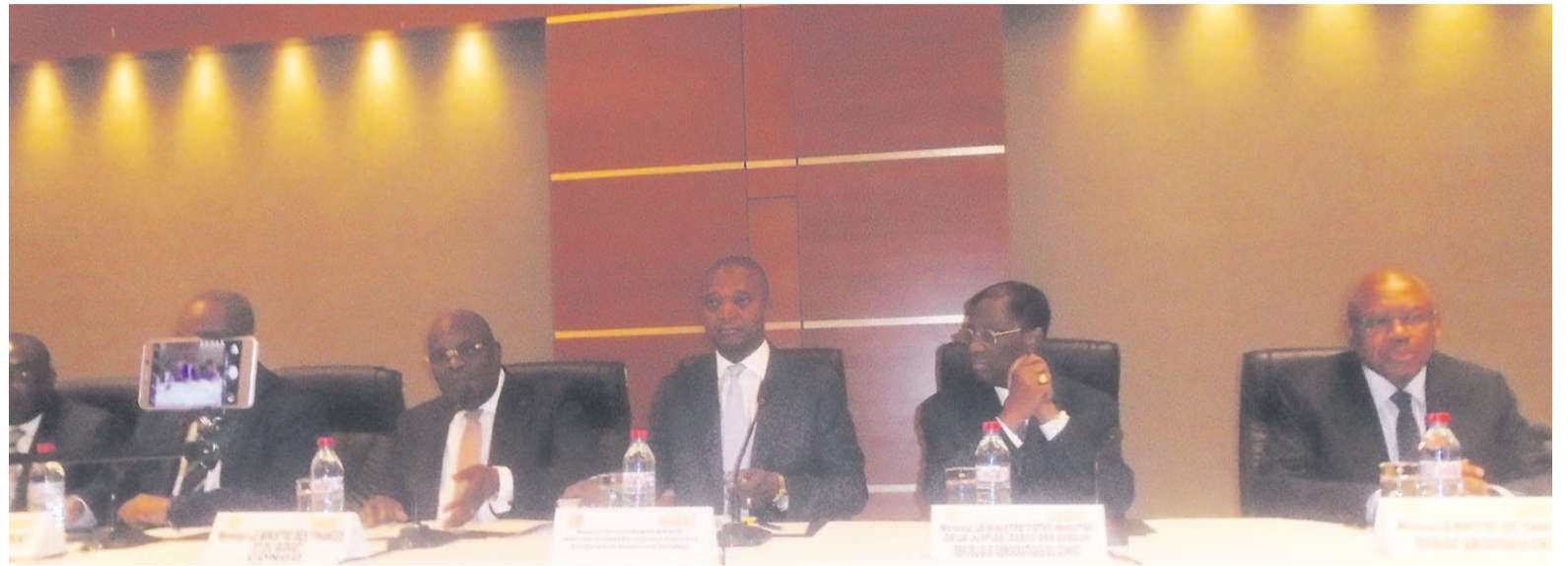
Les responsables du Gabac à l'ouverture de la réunion

Le Gabac est constitué des pays membres de la Communauté économique et monétaire des états d'Afrique centrale (CEMAC) et de la République démocratique du Congo (RDC). Pour parvenir à sa bataille contre le blanchiment des capitaux, le Gabac compte sur les Agences nationales d'investi-