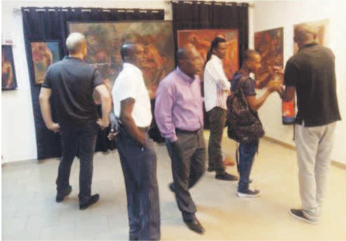
Des participants lors du vernissage

L'exposition relate notamment le parcours de vie intéressant de la femme Loango que l'artiste nomme le « vaisseau » à travers les étapes de la « capture », de l'initiation, de la danse, le rapport aux traditions et