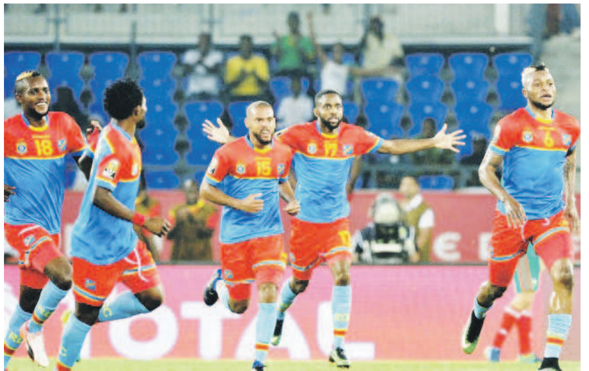
Les Léopards jubilant un but

La vile rumeur laisse également entendre que les Tunisiens auraient été informés que c'est bien lui qui tenait la baraka des Léopards. « Si cela est vrai, qui leur avait donc mis la puce à l'oreille », s'interroge-t-on dans certains milieux avec la conviction que c'est en connaissance de cause que les Tunisiens l'avaient ciblé pour ensuite le