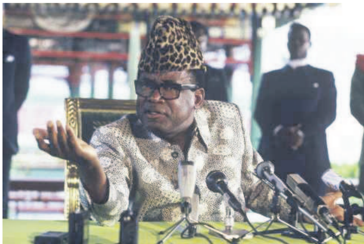
Feu Maréchal Mobutu

- Reproduction d'un système - «Il reste le souvenir d'une dictature mais qui avait donné sa dignité au pays», ajoute le réalisateur belge Thierry Michel, auteur d'un long documentaire «Mobutu roi du Zaïre» qui doit être rediffusé sur TV5Monde jeudi soir. «Je n'ai pas une image positive de Mobutu car il a créé les conditions de l'effondrement du Congo», ajoute Thierry Michel. «Mais il a toujours tué en ciblant, avec parcimonie, en tous cas il a empêché que le pays ne sombre dans la violence d'aujourd'hui. Il n'y a pas eu à l'époque de Mobutu ces massa-