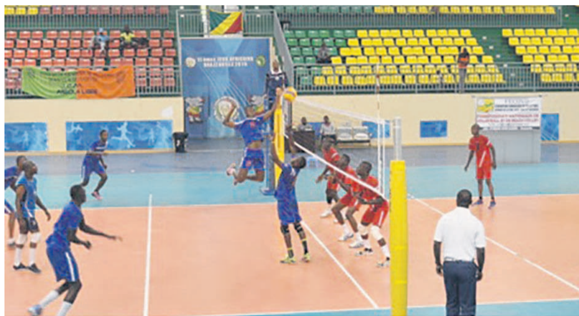
Phase de jeu du match DGSP-Kinda Odzoho

Depuis le 5 septembre, les équipes venues de plusieurs départements du pays se mesurent au championnat national, qui prendra fin le 10 du même mois. Certaines ont amorcé la compétition par des victoires et d'autres des défaites. En seniors dames, la DGSP est venue à bout de l'Inter club (3 sets à 0), puis en seniors hommes, la DGSP s'est imposée face à Kinda Odzoho (3 sets à 1). Chez les cadets, Renaissance a pris le dessus sur la DGSP (2 sets à 1), tandis que chez les cadets Inter