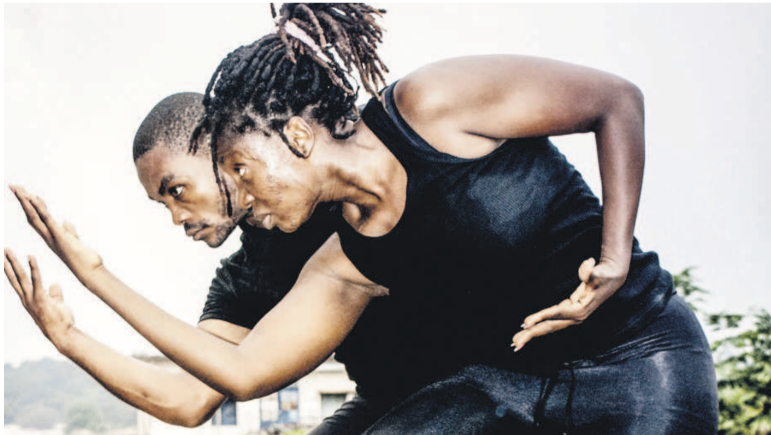
Un extrait de Para Dignita

De l'espagnol Para Dignita, ou « Pour la dignité » en français, a été inspiré à la base d'un travail accompli par Kongo Drama Company dans le cadre du Programme Refugees on the Move de la fondation