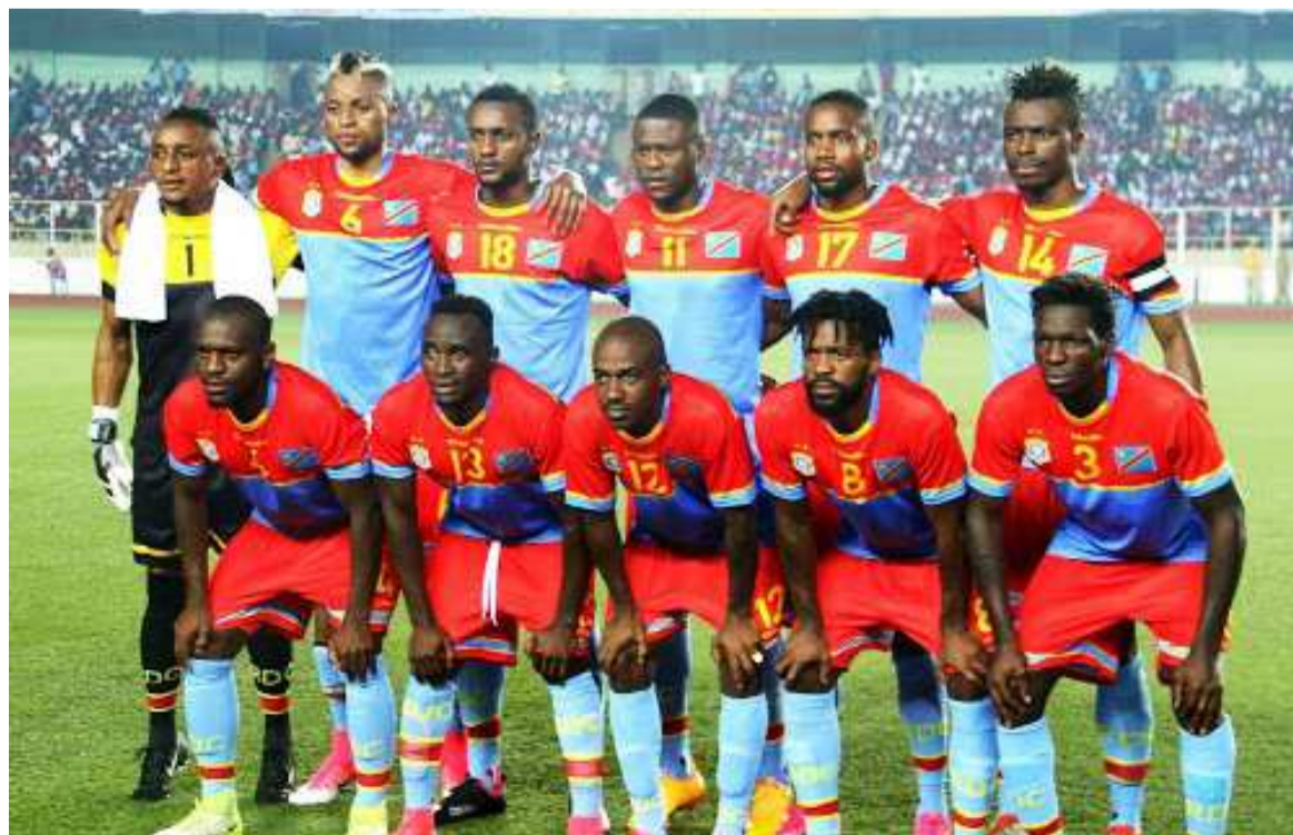
Les Léopards de la RDC.