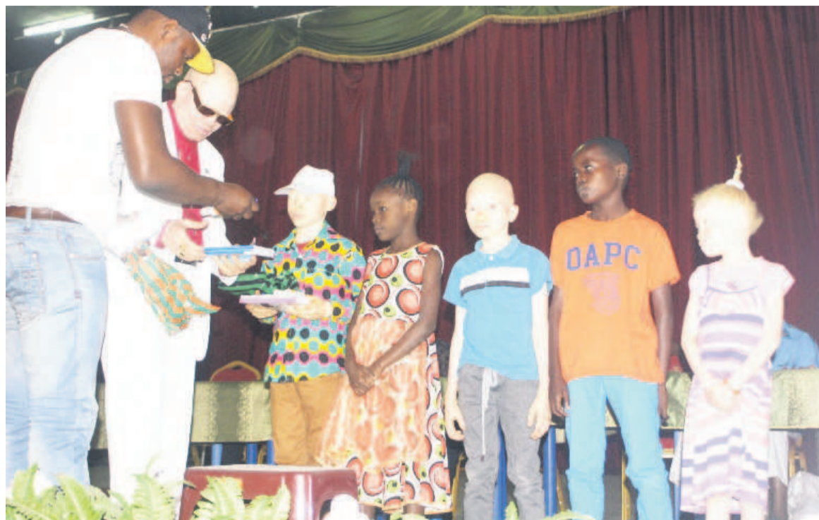
Remise symbolique des fournitures scolaires

Cette manifestation était également l'occasion pour le président national de cette organisation, Alphonse Mwimba Makiese Texas, de lancer un appel aux albinos afin de s'accepter et de se faire accepter dans la société. Le président de la FMT a également rappelé à la société qu'être né albinos n'est pas un péché ou une malédiction. « C'est le manque de la mélanine qui fait cette différence entre les albinos et les non-albinos. Mais, mis à part certains handicaps liés à cet état d'albinos, un albinos a les mêmes facultés qu'un non-albinos », a-t-il souligné.