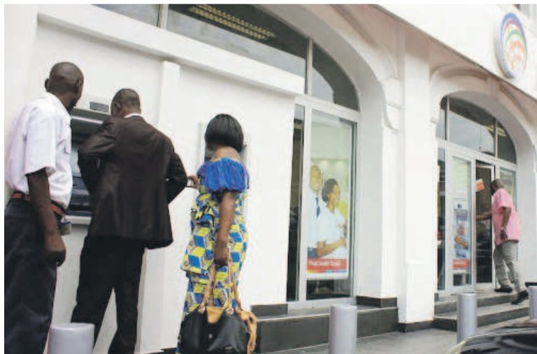
Des clients cherchant à s'approvisionner dans une banque à Kinshasa

Ces dernières années, plusieurs institutions financières ont disparu du paysage financier congolais. Les derniers cas signalés sont la Biac, la Fibank et la Mercreco. Aux dernières nouvelles, tous les clients épargnants d'I-Finance sont invités à se présenter chez Finca à la suite d'un accord intervenu entre les deux institutions avec l'aval de la Banque centrale