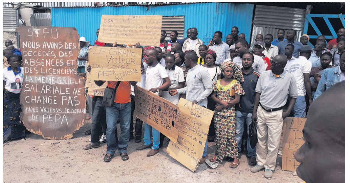
Les travailleurs de la STPU lors de l'assemblée générale

Réunis en assemblée générale le 6 septembre à Brazzaville sous la direction de leur syndicat, les travailleurs de la Société des transports publics urbains (STPU) ont appelé à l'intervention du président de la République, afin de trouver une solution à la crise que traverse cette entreprise.