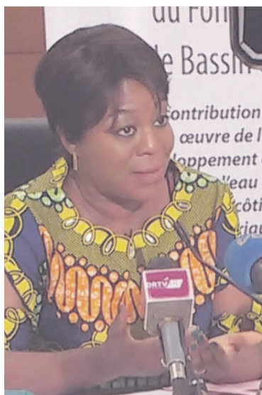
Arlette Soudan-Nonault répondant aux questions de la presse

La ministre du Tourisme et de l'environnement, Arlette Soudan-Nonault, a animé une conférence de presse, le 06 septembre à Brazzaville, sur les enjeux de la participation de la République du Congo à la 23 e session de la Convention cadre des Nations unies sur les changements climatiques (Cncucc), qui aura lieu du 06 au 17 novembre 2017 à Bonn en Allemagne sous la présidence des îles Fiji.