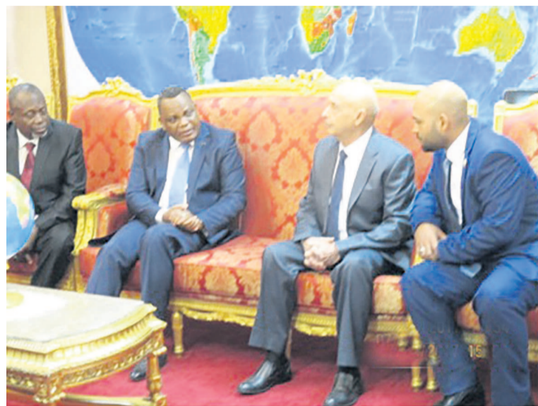
Le ministre des Affaires étrangères en tête à tête avec le président du Parlement libyen de Tobrouk

de son rival, le maréchal Khalifa Haftar. À 48 heures de l'ouverture de ce sommet les autorités congolaises ont accueilli le président du Parlement libyen basé à Tobrouk, Aguila Salah Issa. Page 2