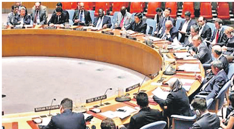
Une réunion du Conseil de sécurité

Alors que tous les signaux attestent qu'il n'y a rien à attendre en décembre 2017, il appartient à la classe politique, plus précisément au CNSA, au gouvernement et à la Céni, d'évaluer, en conformité avec l'accord de la Saint-Sylvestre, l'ensemble du processus électoral et de pro-