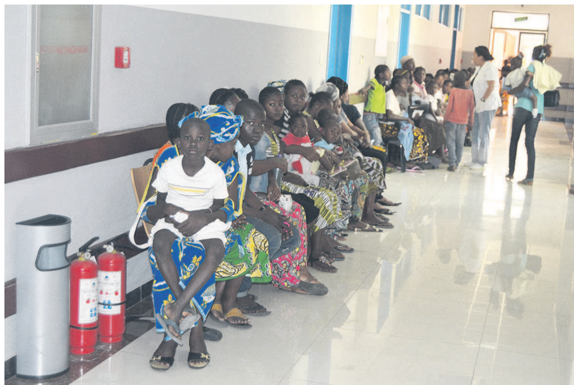
Vue d'enfants à l'hôpital

Dans ce centre de santé du sixième arrondissement de la