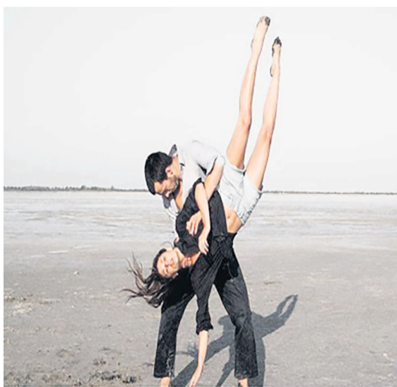
Les deux artistes exécutant le Noos

Ces deux artistes jouent avec les limites de leur corps, en exécutant la danse du Noos. Le samedi 9 septembre, les Ponténégrins sauront un peu plus sur cette danse acrobatique qui a pour point de départ le corps de ces deux artistes et ce qu'ils sont : des portants et des portés, comme tout un chacun l'est à sa manière. À la différence que leur manière est radicalement physique, la même chose et autre-