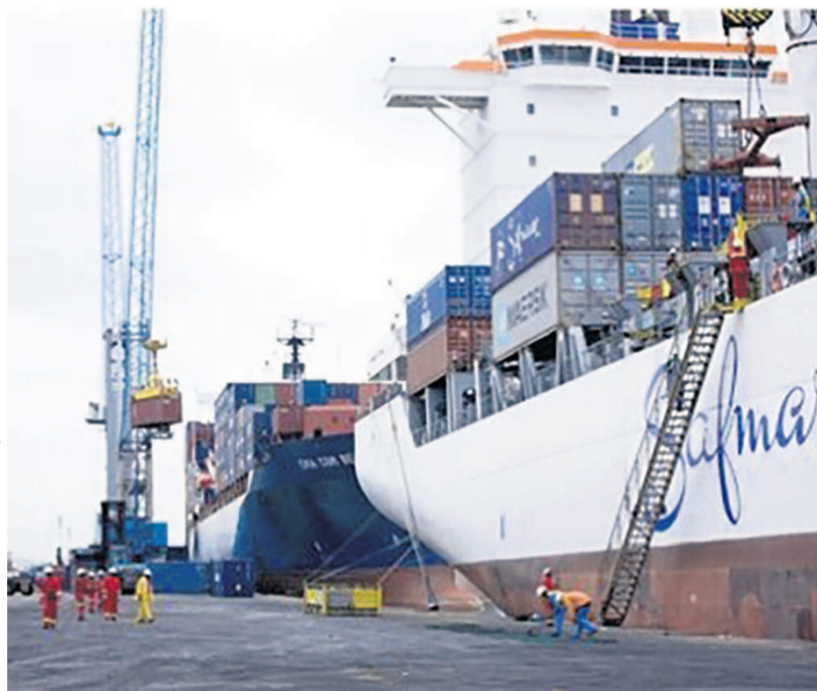
Un navire à quai au port autonome de Pointe-Noire (D)

« Le CMI est le lieu par excellence où s'élaborent les projets de conventions maritimes internationales tout comme