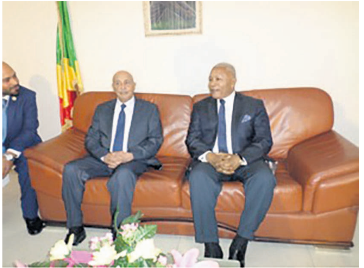
Isidore Mvouba et Aguilah Salah Issa

Le président du Parlement libyen basé à Tobrouk, Aguilah Salah Issa, s'est entretenu, le 7 septembre à Brazzaville, avec le ministre congolais des Affaires étrangères, Jean-Claude Gakosso, dans le cadre de la réunion sur la crise libyenne.