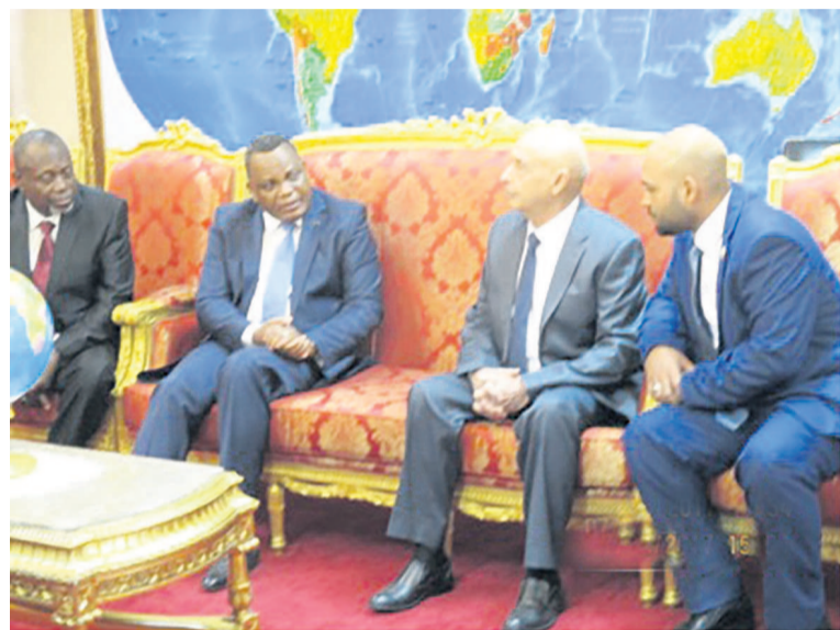
Le ministre des Affaires étrangères en tête à tête avec le président du Parlement libyen de Tobrouk

de son rival, le maréchal Khalifa Haftar. À 48 heures de l'ouverture de ce sommet les autorités congolaises ont accueilli le président du Parlement libyen basé à Tobrouk, Aguila Salah Issa. Page 2