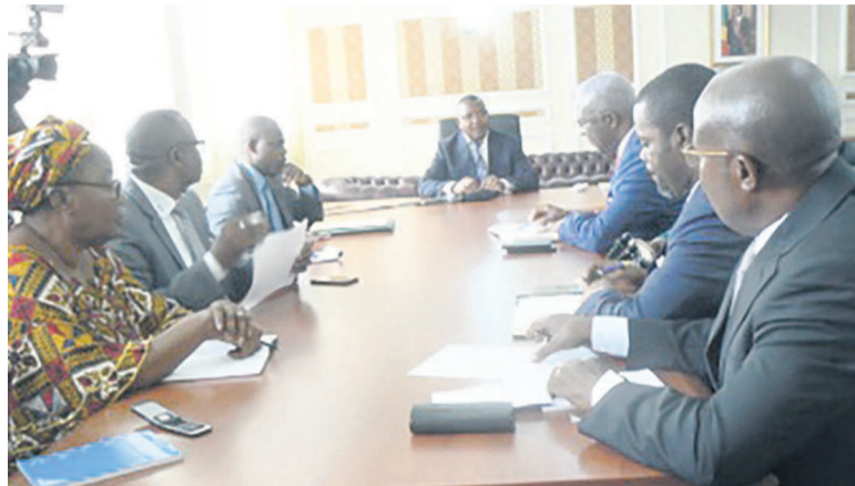
Christian Roger Okemba échangeant avec les maires d'arrondissements

Le maire de la capitale a demandé le 6 septembre à Brazzaville, aux neuf administrateurs-maires d'arrondissements de procéder à la centralisation des caisses municipales et de changer les méthodes de recouvrement en vue d'améliorer les recettes et autonomiser cette structure.