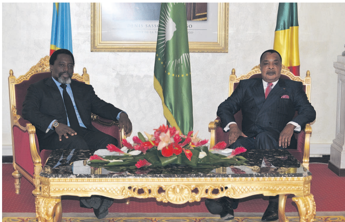
Denis Sassou N'Guesso et Joseph Kabila Kabange

Arrivé hier pour un bref séjour de travail à Brazzaville, où il a été accueilli par son homologue Denis Sassou N'Guesso, le président de la République démocratique du Congo (RDC), Joseph Kabila Kabange a regagné Kinshasa dans l'après-midi. Les deux chefs d'Etat ont échangé, au cours d'un tête-à-tête, sur la situation poli-