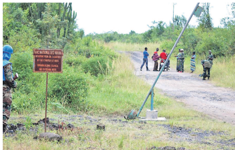
Parc national des Virunga

Le projet, qui a pour objectif principal la protection des animaux qui traversent, mais également les cultures des populations environnantes, est la réponse de l'Institut congolais pour la conservation de la nature (ICCN) aux nombreuses plaintes des populations.