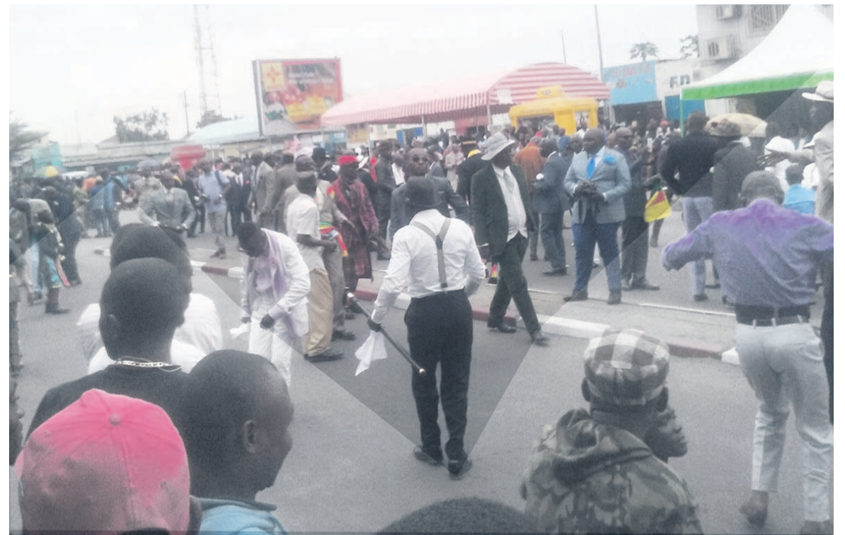
les sapeurs prenant d'assaut l'avenue des Trois Martyrs

La troisième édition du festival de la sape a été récemment organisée par l'administrateur maire de l'arrondissement 5 Ouenzé, Marcel Nganongo. Placée sous le thème « La sape : puissant vecteur de l'unité nationale et du vivre ensemble », cette édition qui s'est déroulée en présence du ministre de la Culture et des arts Dieudonné Moyongo, a rendu hommage à Guy Domyce Azangassoué et Lezin Mampouya dit Lozano.