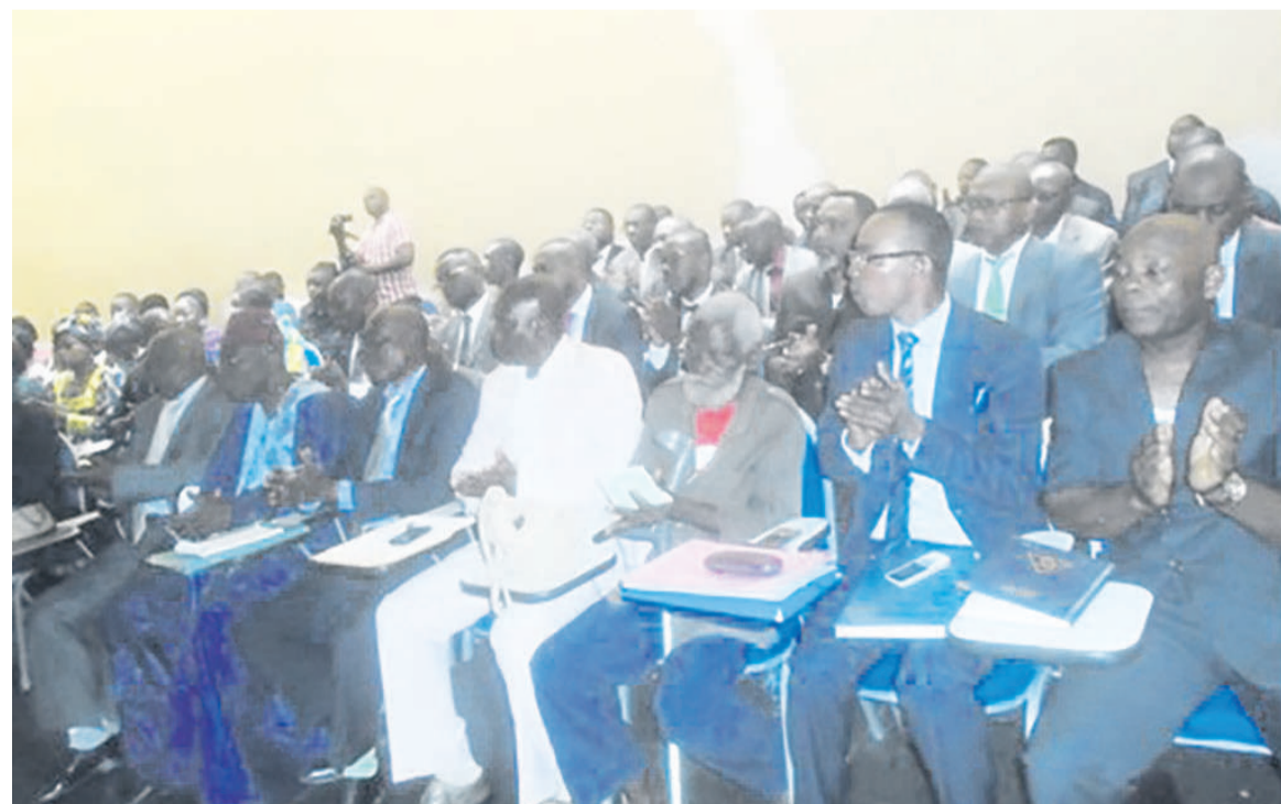
Des propriétaires terriens du Congo lors de la rencontre avec le ministre Pierre Mabiala

Le ministre des Affaires foncières et du domaine public a en outre demandé aux propriétaires terriens de ne plus vendre des portions de terrains situées dans les zones interdites de commercialisation, conformément à la loi foncière. « La loi de 2004 indique entre autres qu'on ne peut pas occuper les zones non constructibles, notamment les montagnes sablonneuses, les versants de montagnes, les zones marécageuses, des emprises des cours d'eau, des routes nationales », a-t-il rappelé.