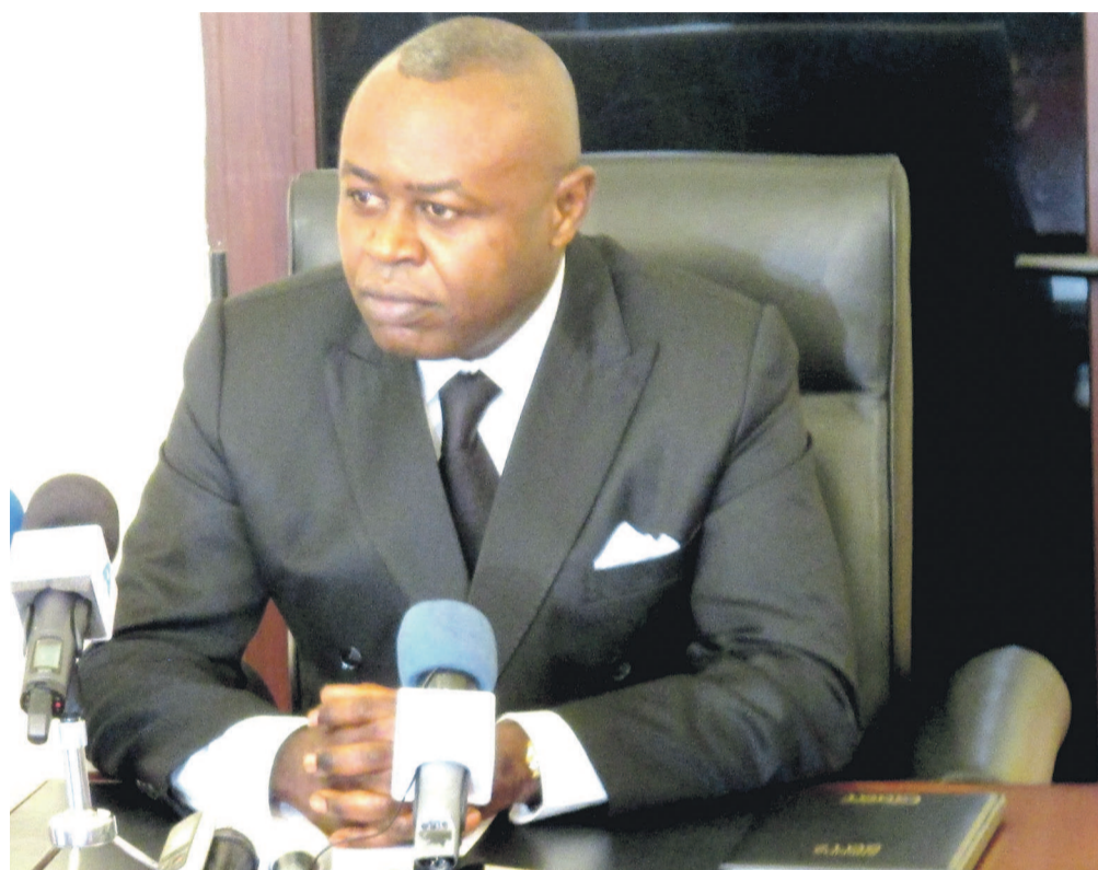
Le ministre des Postes, des télécommunications et de l'économie numérique, Léon Juste Ibombo

Le projet fait suite à la qualité défectueuse des services fournis par l'ensemble des opérateurs, contrairement à leurs cahiers de charges et aux licences auxquels ils sont soumis. « Je vous enjoins de tout mettre en œuvre pour améliorer ce service dans un délai de deux mois, et ce, pour le bien-être de nos populations », a précisé le ministre. Page 4