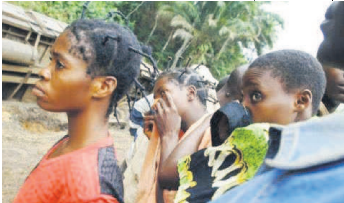
Une vue du lieu de l'accident

donné que la pharmacie est sans médicaments, la prise en charge des accidentés pose problème», a expliqué à l'AFP le Dr Guy Kilundu médecin traitant à l'hôpital de référence de Kikwit. «L'excès de vitesse» et «l'ivresse» du chauffeur qui est mort sur le champ seraient à l'origine de l'accident, selon les témoignages des survivants, recueillis par l'AFP. Les accidents sur les routes congolaises sont souvent meurtriers. Vendredi, 11 personnes ont été tuées lorsqu'un camion de transport