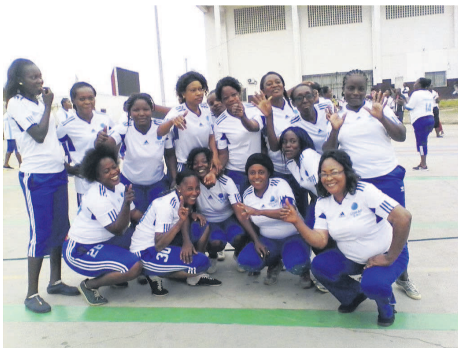
Épouses agents Coraf «Adiac»

À cet effet, les capitaines des deux équipes ont promis réaliser de belles prestations. « On avait la foi depuis le départ d'embrasser le premier trophée de la coupe de la ville, notre