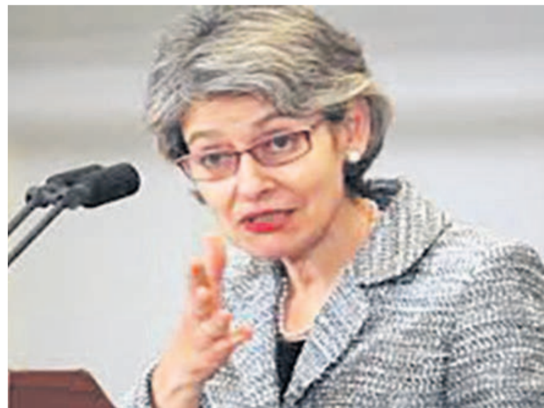
Irina Bokova

Cependant, pour l'Unesco, réduire cet écart de compétences est un impératif sur le plan de l'éducation et du développement. Parce que, les technologies de l'information et de la communication offrent des solutions pour y parvenir. « Les outils numériques peuvent nous aider à élargir l'accès à l'apprentissage et à en améliorer la qualité. Grâce à eux, nous