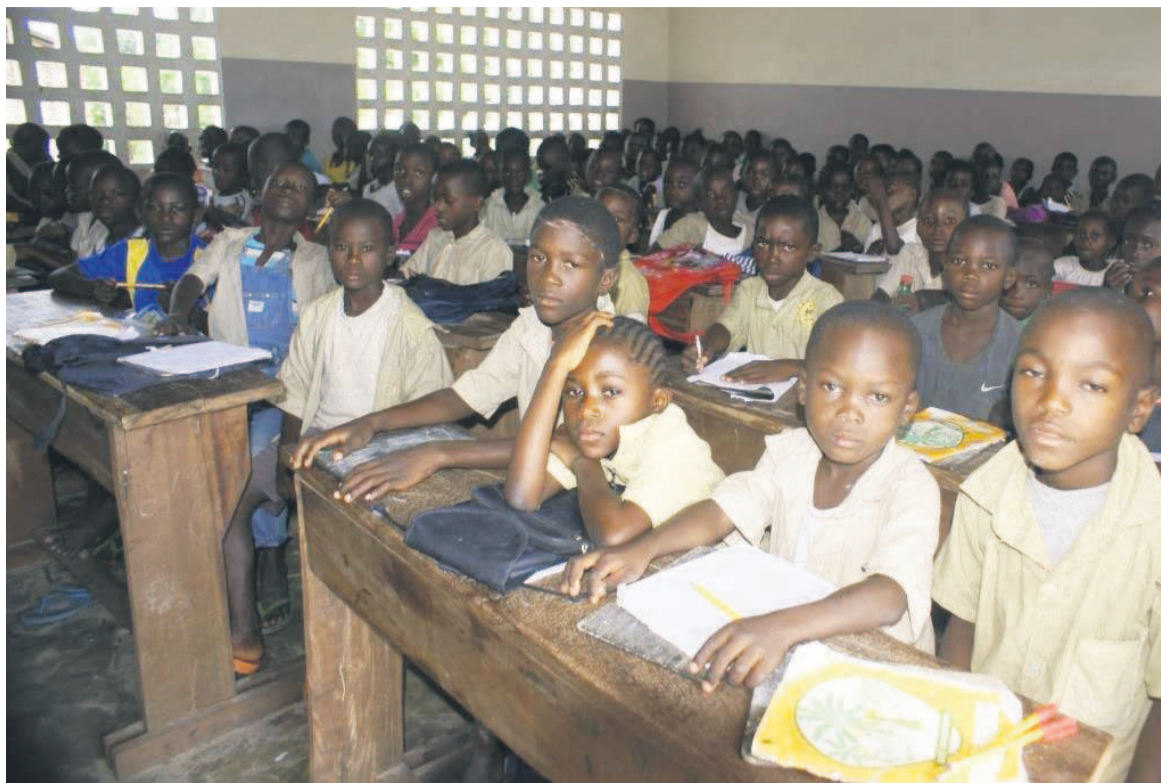
Une vue des écoliers en classe dans une école publique

Des écoles qui agissent ainsi se cachent derrière, semble-t-il, le système scolaire français. Une source proche des services nationaux de l'enseignement révèle que le nombre d'écoles privées qui sont dans ce système ne dépasse pas cinq au Congo. Mais elles sont plus de cinq seulement dans la ville océane qui ont déjà démarré avec les enseignements. Et pour éviter de se faire distinguer, certains responsables de ces écoles demandent aux parents de dire à leurs enfants de ne pas mettre les uniformes scolaires jusqu'au mois d'octobre. Notons que cette rentrée scolaire a deux vitesses dans certaines villes du