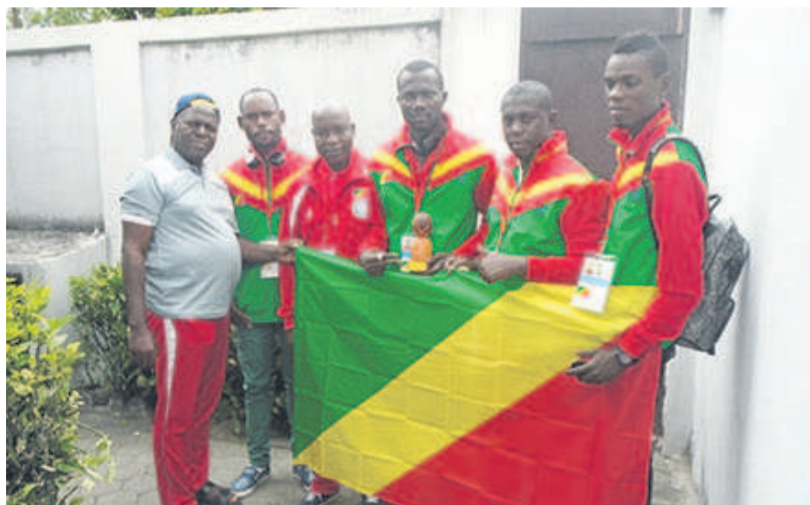
Les Diables rouges de Petanque

Les Diables rouges ont été battus le samedi (13-14) en finale de la coupe des nations par le Benin, vice-champion du monde. Les Congolais quittent la Tunisie avec une médaille d'argent plus que qualification pour les championnats du monde prévus en 2018.