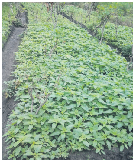
Un sillon de légumes Adiac

Réagissant notamment au problème d'eau, le directeur du FACP a indiqué