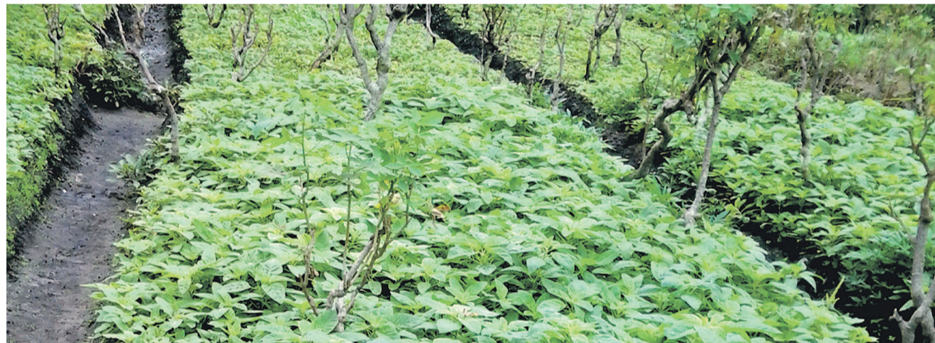
Des sillons de légumes

Formés aux techniques agricoles sans l'usage des engrais chimiques, grâce au Pade, un projet cofinancé par le gouvernement congolais et la Banque mondiale, les maraîchers évoluant dans la sous-préfecture de Makoua, dans le département de la Cuvette, ont du mal à mener à bien leurs activités faute de terres cultivables disponibles.