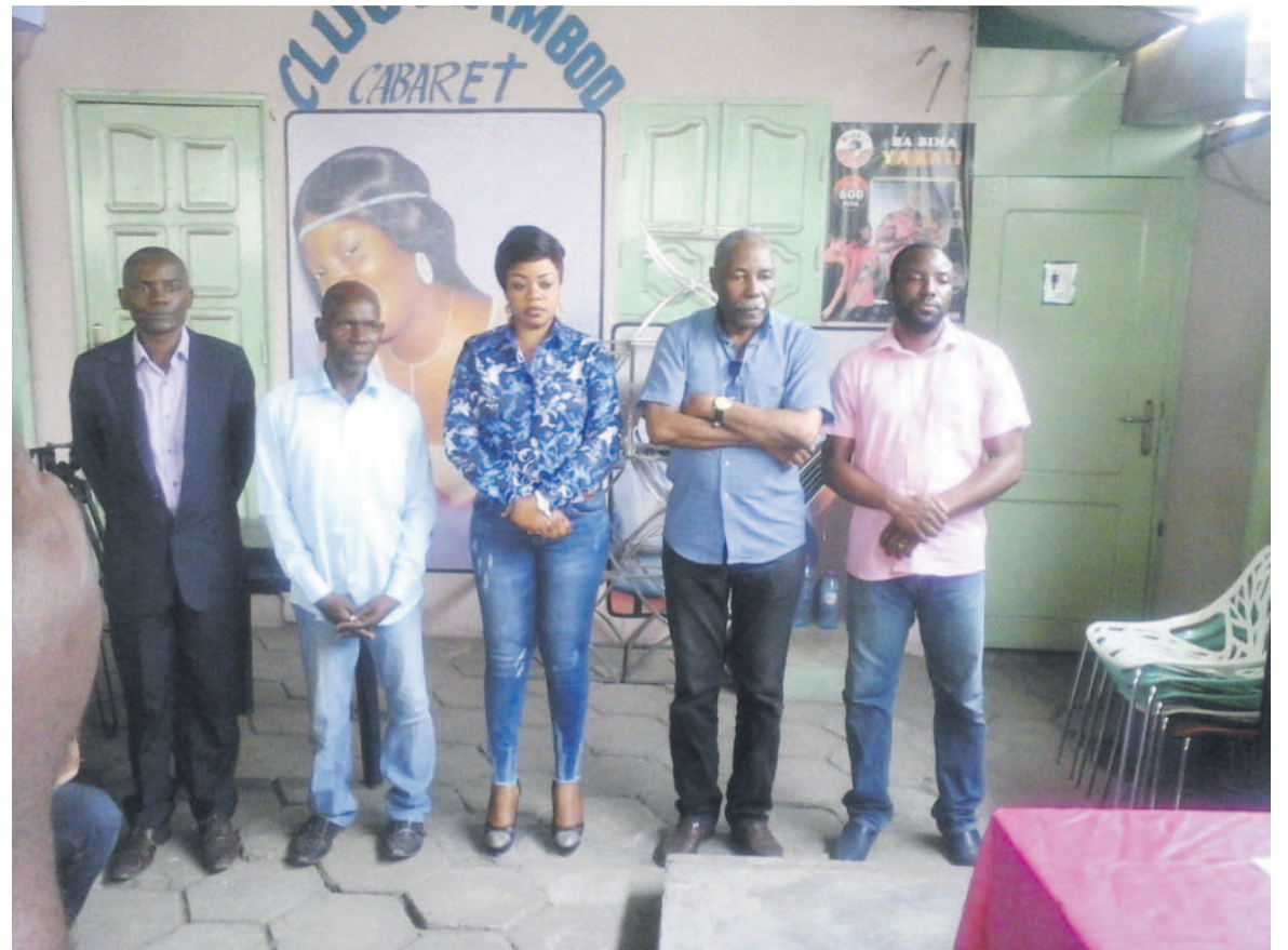
Les membres du bureau de l'ITI

« Au cours du congrès, les statuts de l'ITI ont été amendés. Cette organisation englobe désormais tous les arts de la scène y compris la musique. Le sigle en français ITI a fait place au seul sigle