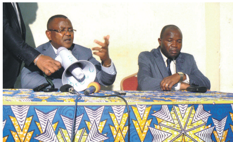
Le maire de la ville s'adressant à l'auditoire