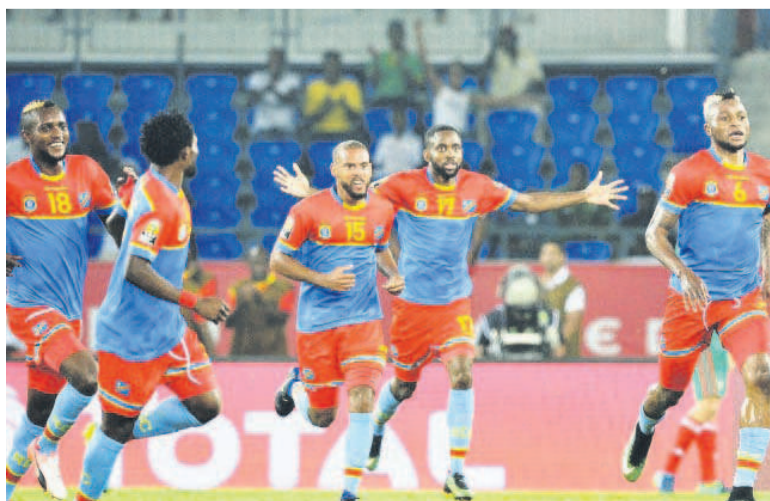
Les Léopards célébrant un but

La République démocratique du Congo (RDC) qui avait reculé à la 42 e position, après sa défaite contre la Tunisie (1-2) en troisième journée des éliminatoires du Mondial en septembre, a fait un bond de sept places pour occuper la 35 e position en octobre. Sa victoire de deux buts à un contre la Libye, à Monastir, en cinquième journée et le match à égalité concédé à domicile face à la Tunisie (2-2), en quatrième journée des éliminatoires de la Coupe du monde Russie 2018, ont impacté sur son classement en ce mois d'octobre.