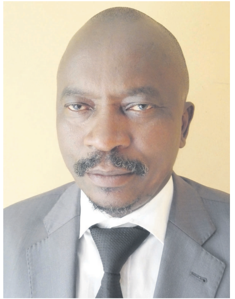
Le président de la LIZADEEL