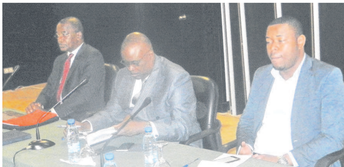
Les membres du présidium lors des travaux de l'atelier

Les experts issus d'un certain nombre de départements ministériels ont procédé, le 17 octobre à Brazzaville, à l'examen en vue de la validation du rapport provisoire sur l'évaluation des besoins en renforcement des capacités de la République du Congo.