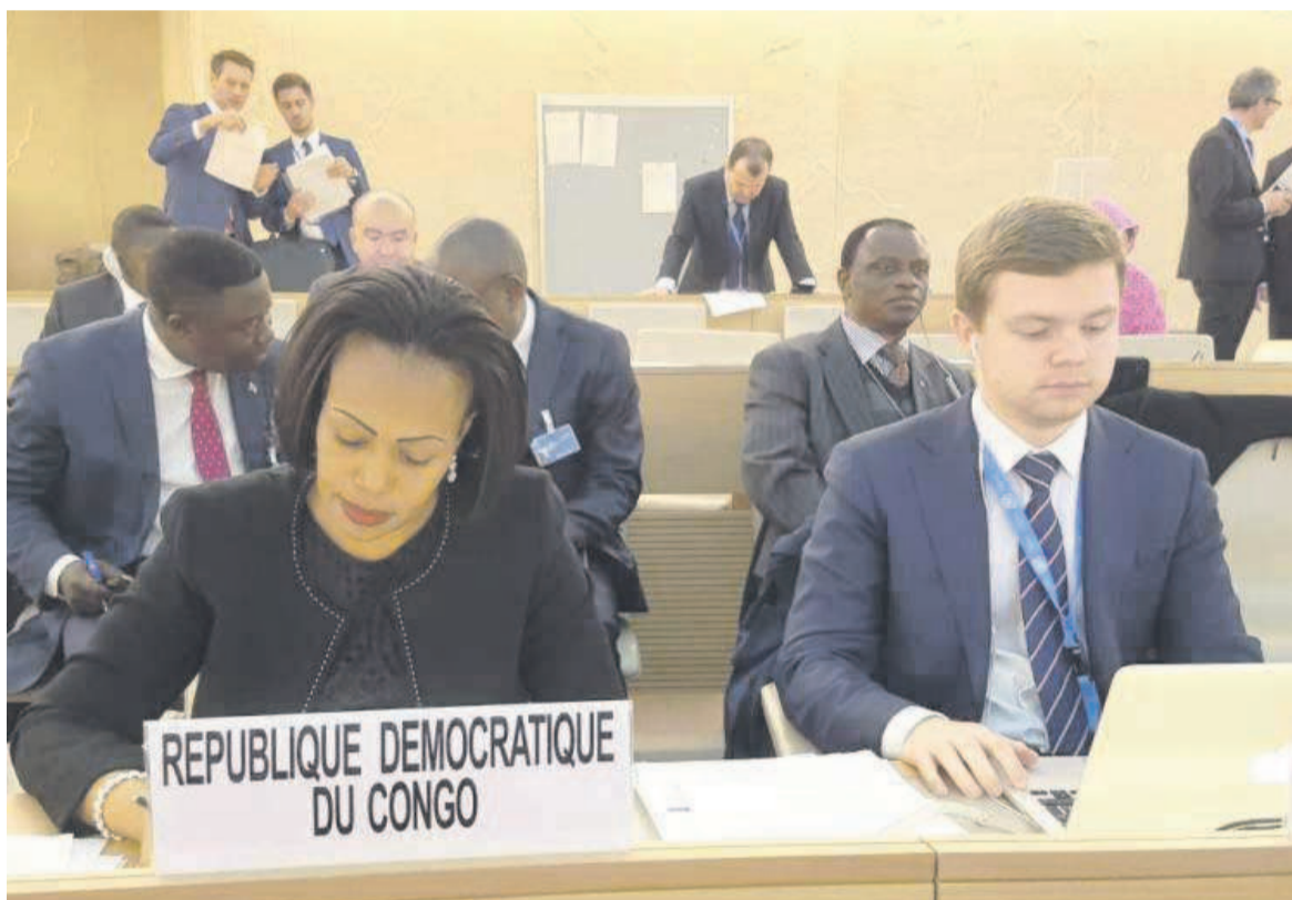
Marie Ange Mushobekwa (à gauche) ministre des droits humains, s'est félicitée de l'élection de la RDC au Conseil des droits de l'homme de l'Onu

À la suite de son élection lundi, le Congo Kinshasa siègera comme membre à cette institution onusienne de 2018 à 2020 à côté de trois autres États africains (l'Angola, le Sénégal et le Nigeria),