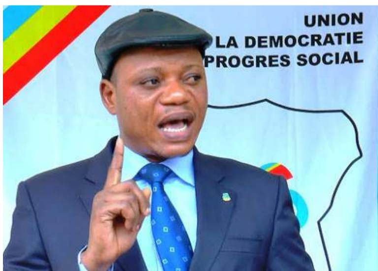
Jean Marc Kabund