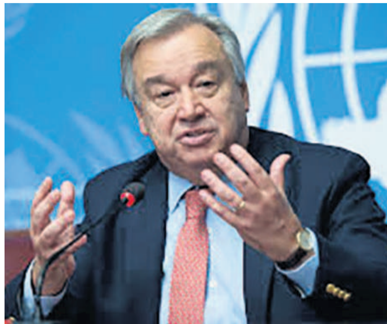
Antonio Guterres

ment a fait des progrès dans la réduction de la pauvreté, la diversification des économies, la construction d'une classe moyenne et la croissance dans une série de secteurs tels que la banque, les télécommunications et le commerce de détail », a noté M. Guterres. « Davantage d'enfants - et surtout de filles - vont à l'école primaire. Davantage de femmes siègent dans les parlements. Les décès d'enfants et de mères ont été réduits, tout comme la prévalence du VIH/sida », a-t-il indiqué, avant d'ajouter : « Notre défi commun est de poursuivre nos efforts en nous appuyant sur ces progrès ».