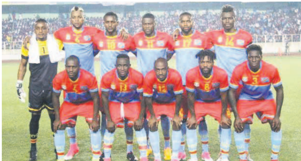
Les Léopards de la RDC

La République Démocratique du Congo (RDC) qui avait réculé à la 42 e position, après sa défaite contre la Tunisie (1-2) en troisième journée des éliminatoires du Mondial en septembre, a fait un bond de sept places pour occuper la 35 e position en octobre. Sa victoire de deux buts à un contre la Libye, à Monastir en cinquième journée, et le match égalité concédé à domicile face à la Tunisie (2-2), en quatrième journée des éliminatoires de la Coupe du monde Russie 2018, ont impacté sur son classement en ce mois d'oc-