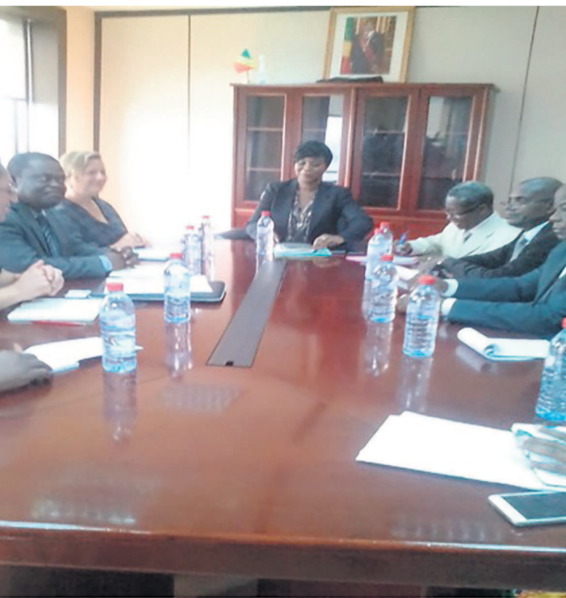
Les deux parties s'entretiennent