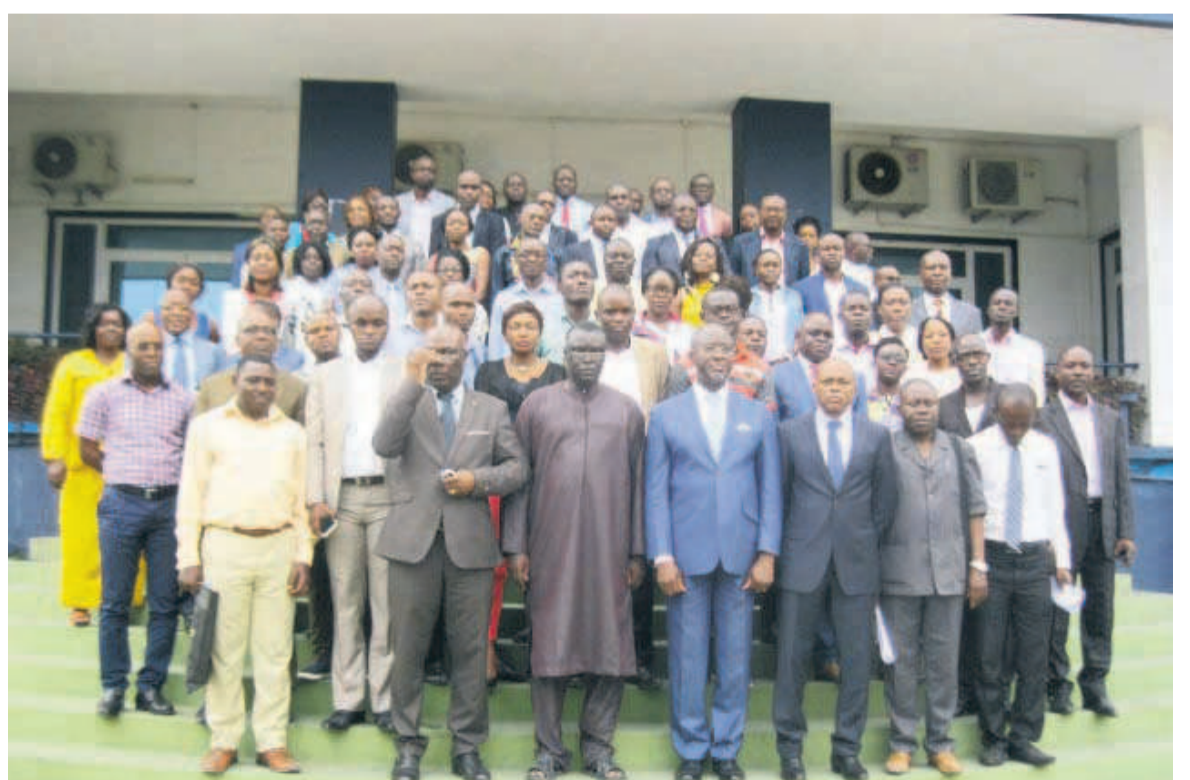
La photo de famille des participants

Pour tout dire, cette formation qui s'achève le 19 octobre va per-