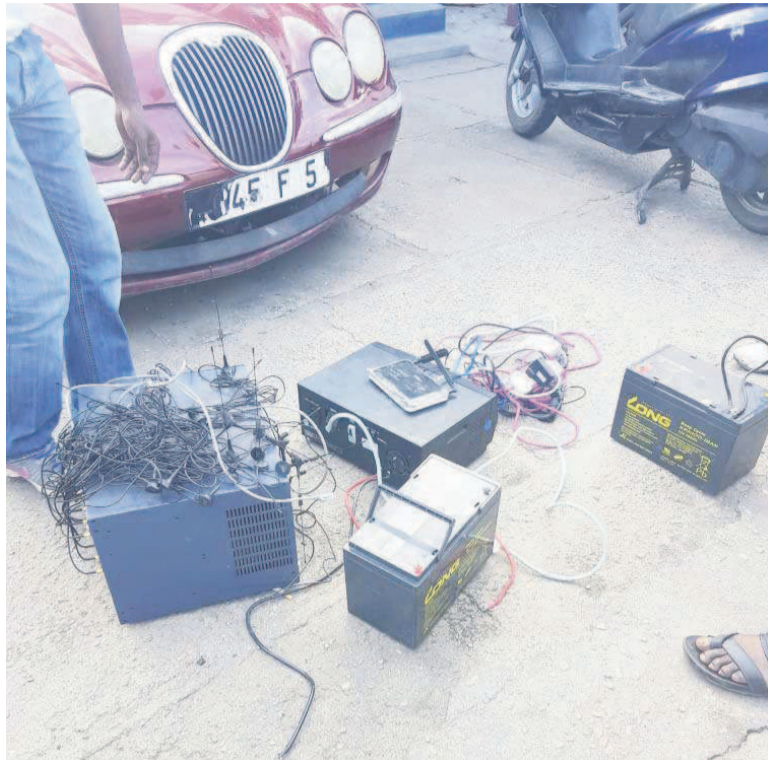
Du matériel Sim Box retrouvé chez le fraudeur à Pointe-Noire

« Nous avons mis un certain temps pour pouvoir mettre la main sur ces fraudeurs, très expérimentés. Grâce aussi au concours des opérateurs que je tiens à saluer ici, nous avons pu détecter leur localisation pour pouvoir les faire arrêter