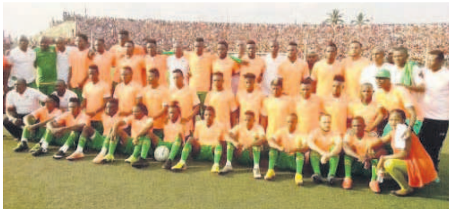
FC Renaissance du Congo saison 2017-2018