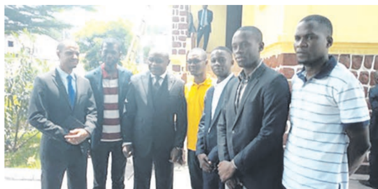
Le ministre Léon Juste Ibombo, Jean-Martin Bauer et les développeurs de la communauté Fongwama

Les lauréats du concours organisé par la communauté Fongwama et le Programme alimentaire mondial (Pam) ont échangé, le 18 octobre, avec le ministre des Postes, télécommunications et de l'économie numérique, autour d'une collaboration plus soutenue afin que l'initiative participe à l'économie numérique en plein essor.