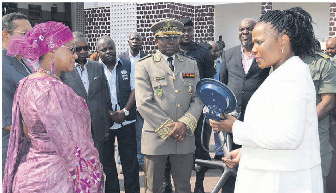
Remise symbolique de don à l'hôpital Pierre Mobengo

La délégation a ensuite pris la direction de l'hôpital central des armées, Pierre-Mobengo, où une vingtaine de césariennes