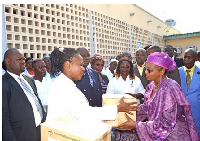
Remise de médicaments à l'hôpital de Talangai

La représentante de l'OMS au Congo, Fatoumata Binta Diallo et la ministre de la Santé, Jacqueline Lydia Mikolo, se sont rendues samedi dans les hôpitaux de Talangai, Bacongo, Makélékélé, Mfilou, ainsi qu'à l'hôpital militaire et au CHU pour accomplir ce geste qui a été du reste très apprécié par les gestionnaires de ces structures. Page 16