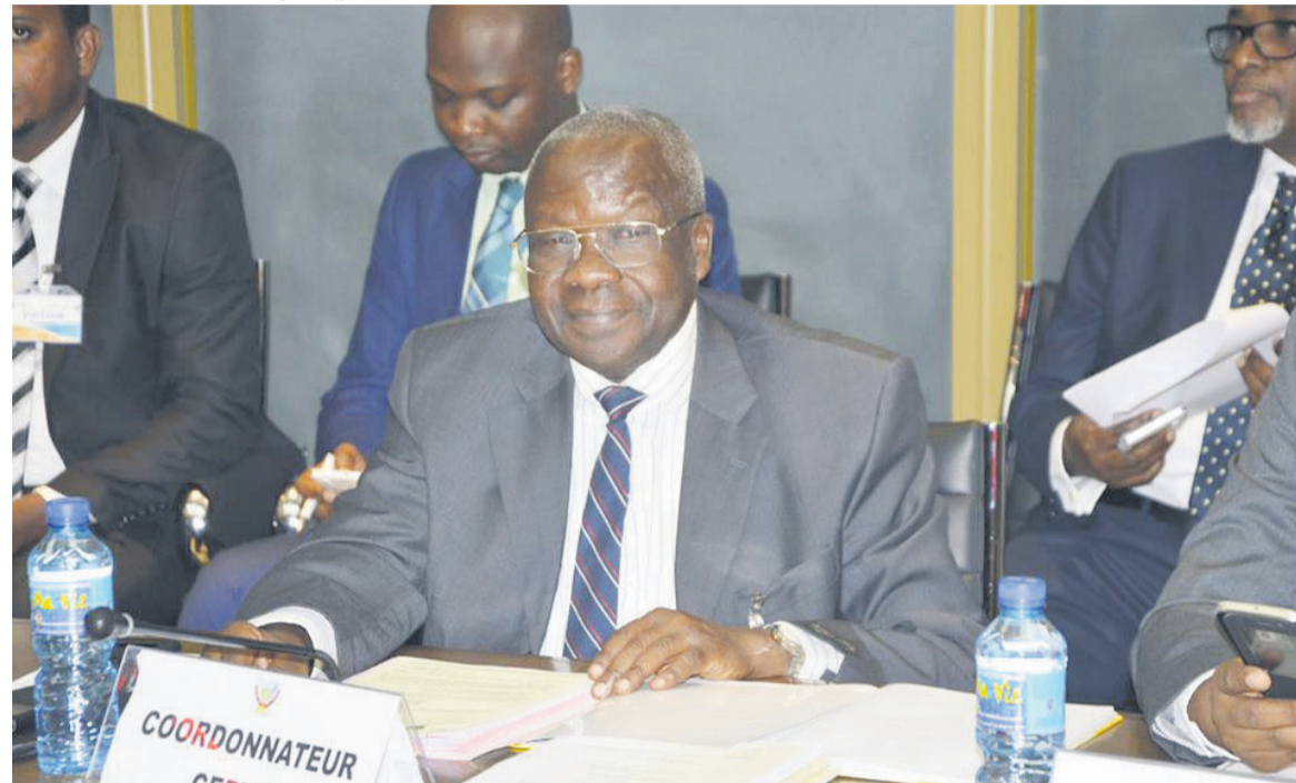
Le coordonnateur du CEPTM, expliquant les motivations ayant conduit à solliciter la réunion/photo CEPTM

La CEPTM, par son unité de projet basée à Lubumbashi (UPL,) s'est