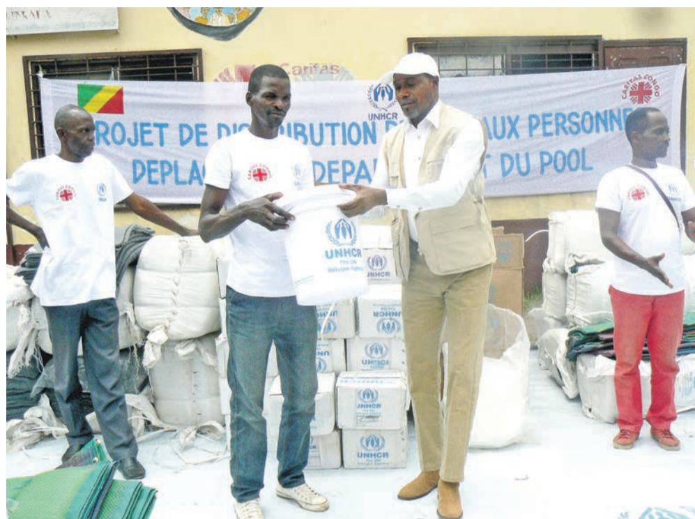
Le représentant du HCR remettant le don à un sinistré