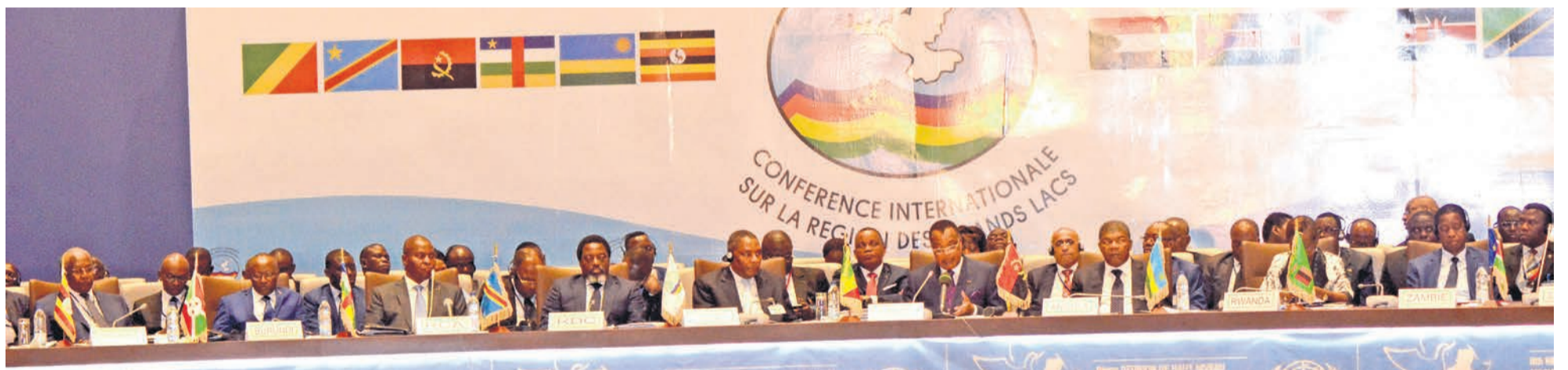
Vue du présidium des travaux

Les chefs d'Etat et gouvernement des pays signataires de l'Accord-cadre pour la paix, la sécurité et la coopération pour la République Démocratique du Congo (RDC) et