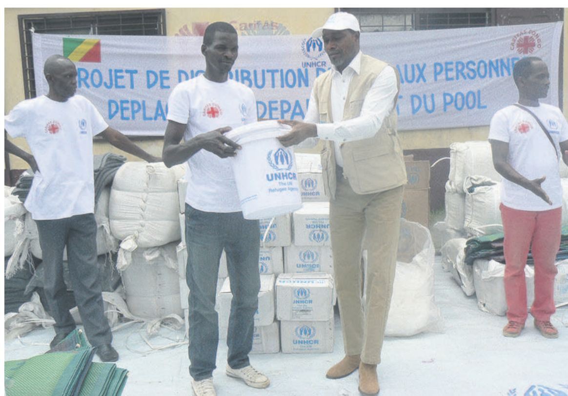
Le représentant du HCR remettant le don à un sinistré

« Le HCR à Kinkala traduit de façon concrète votre engagement dans l'humanitaire et un soutien moral pour nous », a