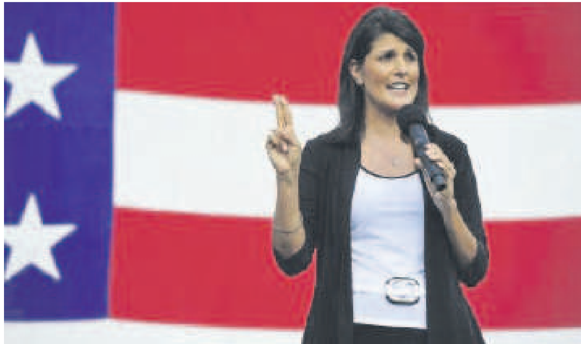
L'ambassadrice américaine à l'ONU, Nikki Haley

Avec ce déplacement, «l'ambassadrice Haley pourra se rendre compte par elle-même du travail de l'ONU dans des pays dévastés par les conflits, avec des visites auprès de missions de maintien de la paix et de sites où oeuvrent d'autres agences de l'ONU apportant de l'aide humanitaire vitale». «J'envoie l'ambassadrice Nikki Haley en Afrique pour discuter des conflits et de leur résolution,