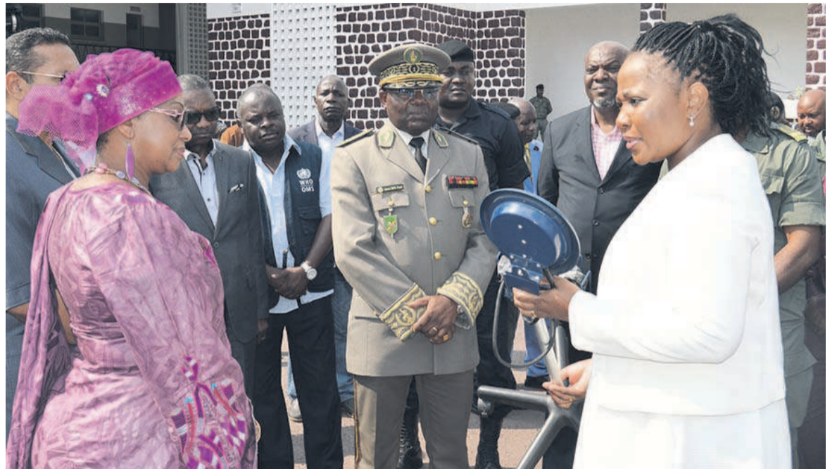
Remise symbolique de don à l'hôpital Pierre Mobengo

La délégation a ensuite pris la direction de l'hôpital central des armées, Pierre-Mobengo, où une vingtaine de césariennes