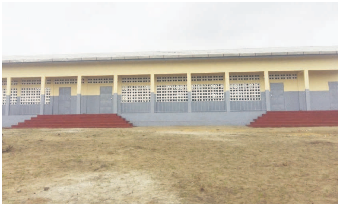
Vue de l'école primaire de Kondi-Mbaka/Adiac

Construit au départ en matériaux non durables depuis sa création en 1981, l'établissement du cycle primaire de la localité a désormais des bâtiments modernes grâce à la société ENI-Congo, dans le cadre du Projet intégré de Hinda (PIH).