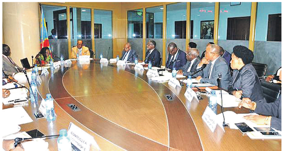
Une vue des participants à la réunion

La réunion tenue le 20 octobre a été sollicitée par le coordonnateur de la Cellule d'exécution du projet de transport multimodal (CEPTM) auprès du président par le vice-Premier ministre et ministre chargé des Transports et