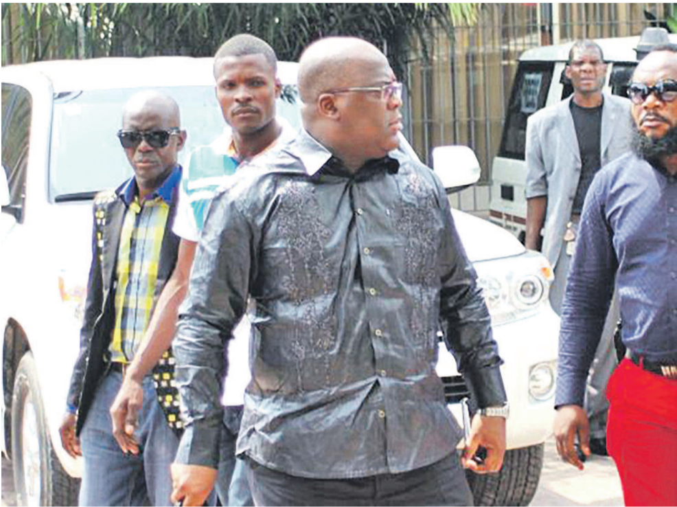
Félix Tshisekedi attendu ce lundi 23 octobre à Lubumbashi