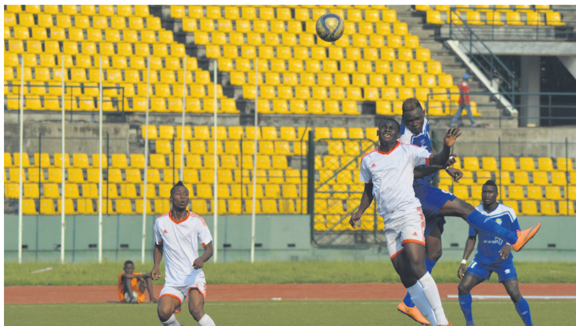
La rencontre JSP-As Otoho/Adiac

Dans la circulaire n°17, Badji Mombo Wanteté précise que la saison sportive 2017-2018 a été ouverte le 1 er novembre. Il est rappelé aux dirigeants des clubs que la période d'enregistrement des joueurs a été ouverte le 6 novembre, ce, jusqu'au 28 janvier 2018. La deuxième phase d'enregistrement, lit-on dans la note, sera ouverte du 1 er au 31 mai 2018. « Toutes les formalités de mutations des joueurs