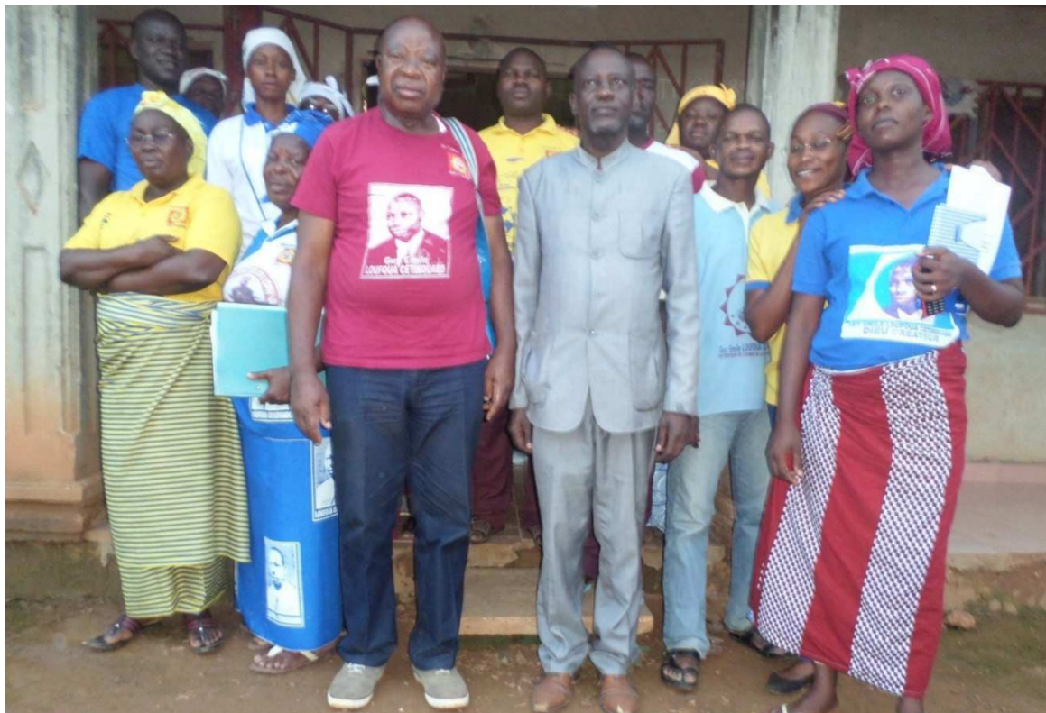
Les membres de l'association Louzolo Amour en compagnie du directeur départemental du Patrimoine

qu'une association qui a une ancienneté de plus de 30 ans ne puisse pas disposer d'un siège digne ? Qu'il