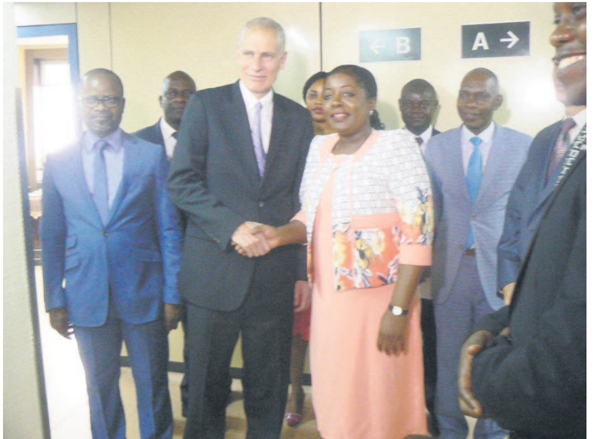
La poignée de main entre la ministre et l'ambassadeur