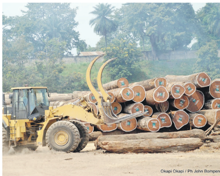
Okapi Okapi

Le ministre chargé du secteur aurait ouvertement affirmé ces ambitions lors d'une activité tenue le week-end dernier à Kinshasa.