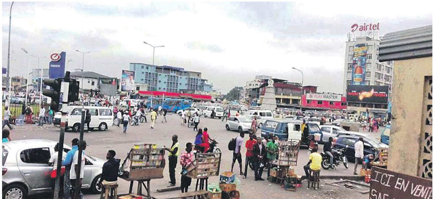
Scène de vie quotidienne à la Place Victoire à Kinshasa