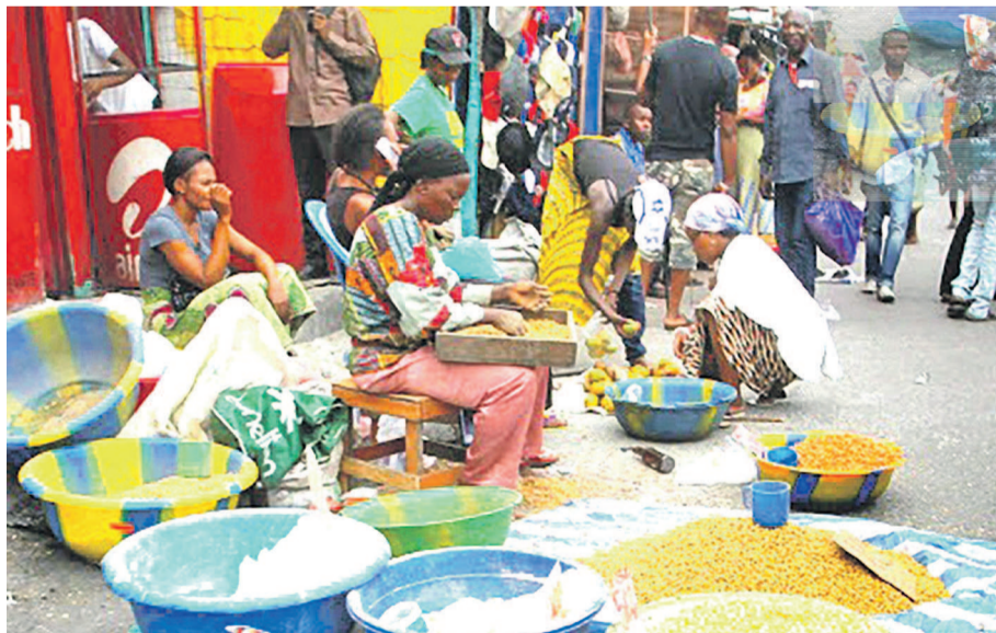
Des vendeuses au grand marché de Kinshasa