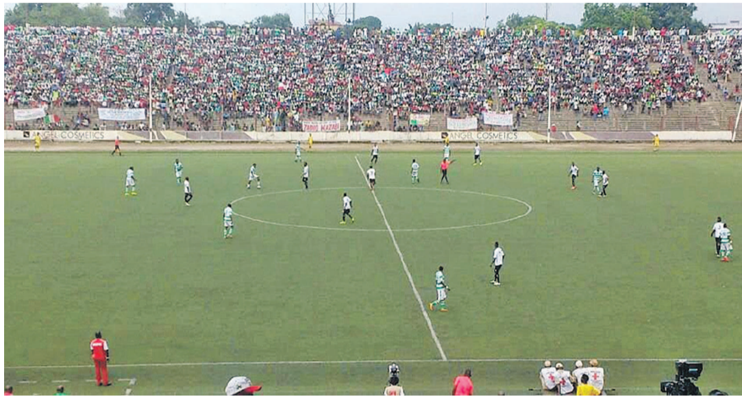
Une vue du match DCMP-Rangers