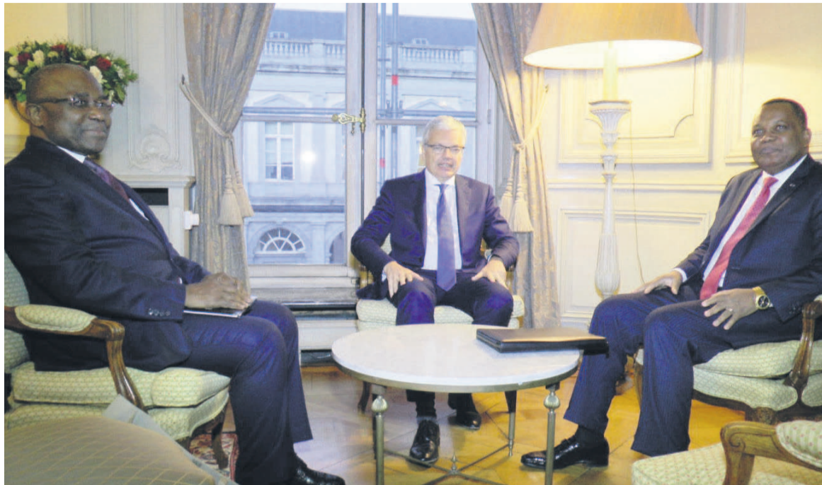
Le ministre Jean Claude Gakosso reçu par Didier Reynders

A l'issue du tête-à-tête, le chef de la diplomatie congolaise a parlé de l'excellence des relations entre Bruxelles et Brazzaville. « Entre le Congo et la Belgique, il y a de bonnes perspectives de coopération » et les deux pays vont « se déployer pour que cette relation demeure dynamique », a déclaré Jean-Claude Gakosso. Le ministre a, par ailleurs, indiqué que la situation dans le département du Pool figurait parmi les points abordés avec la partie belge. « Nous