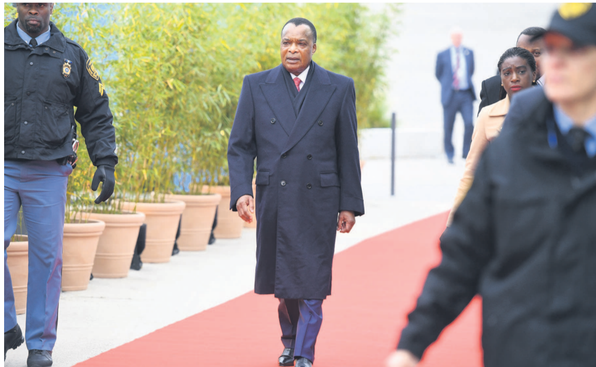
L'arrivée du président Denis Sassou N'Guesso

«Le Bassin du Congo depuis Marrakech a mis en place trois commissions», a rappelé le chef de l'Etat.