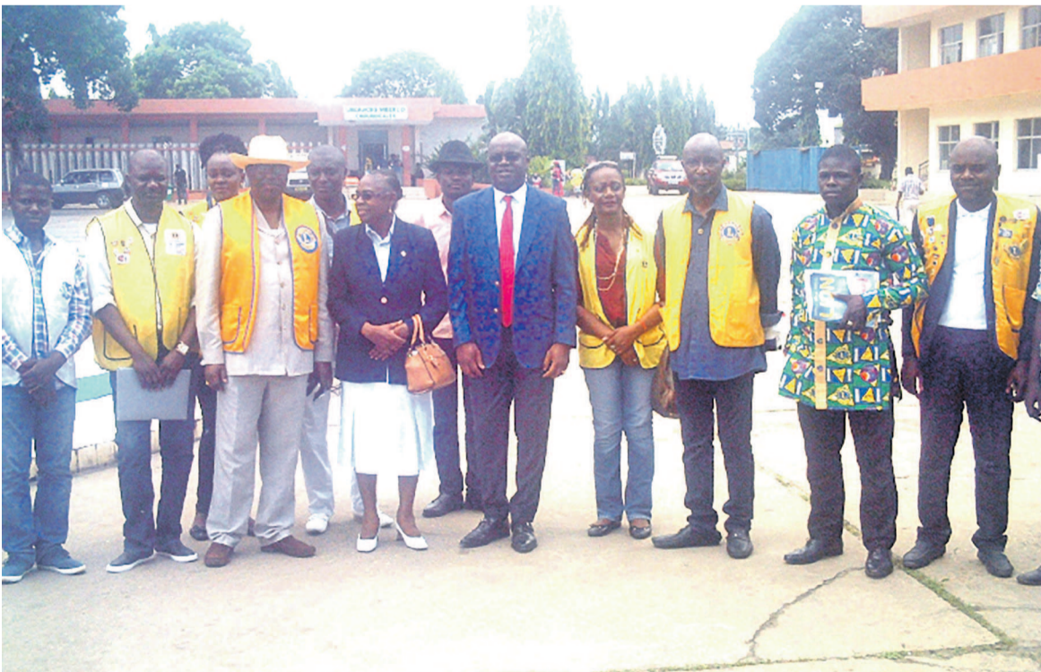
La photo de famille lors de la journée internationale du diabète à Loandjili crédit photo «Adiac»