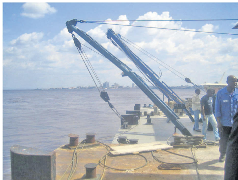
Les bâtiments destinés aux opérations de dragage