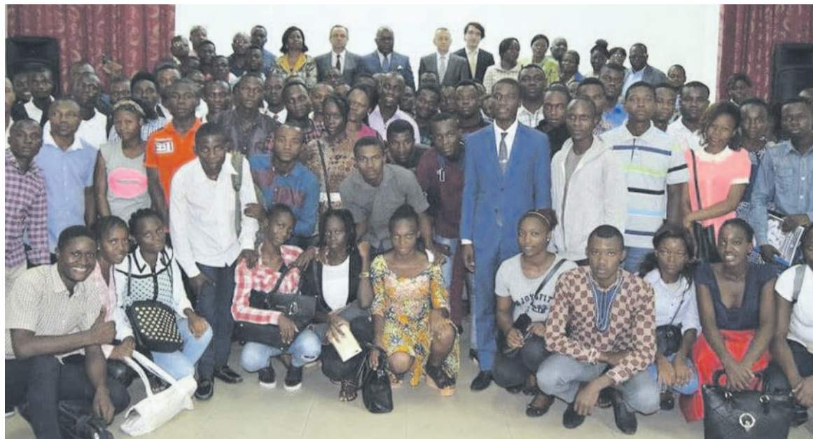
La photo de famille avec les 90 étudiants