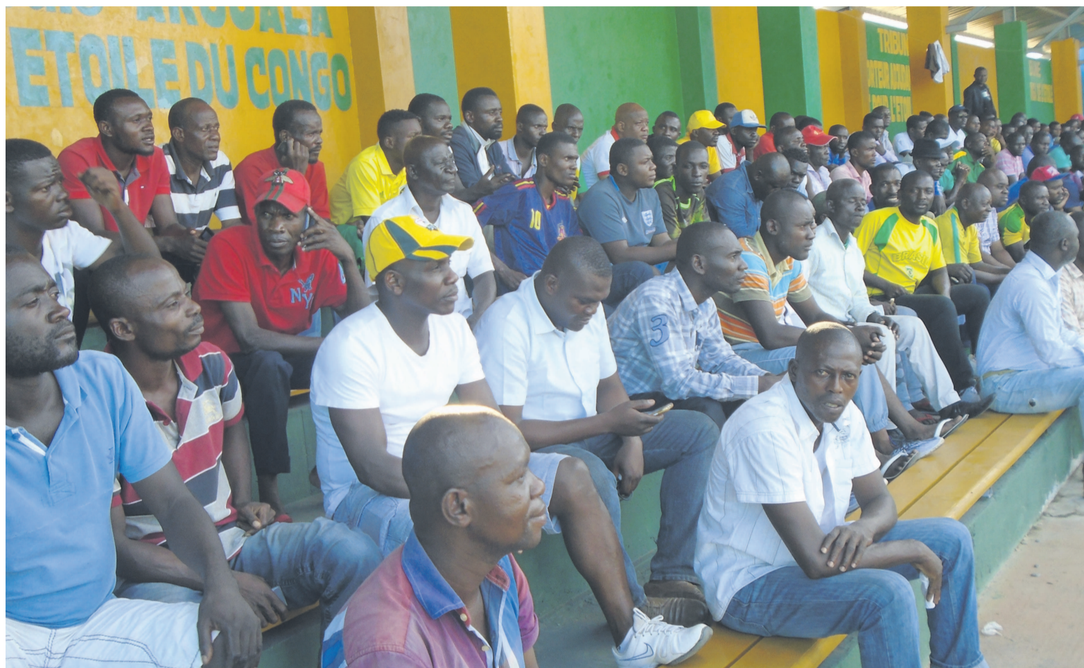
Les supporters de l'Etoile du Congo pendant la réunion

Ce n'est pas la vérité du terrain qui devrait les contredire. Pour preuve, la saison sportive 2017-2018 a été ouverte le 1er novembre. Mais l'Etoile du Congo n'a pas encore repris les entraînements. La section football, ont-ils soutenu, serait amputée de cinq joueurs clés de la saison dernière qui auraient choisi d'autres horizons à cause de la