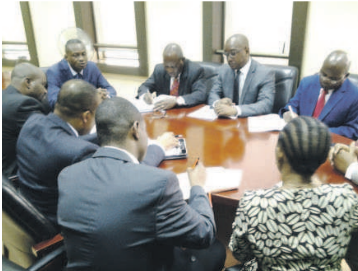
La délégation sud-Africaine s'entretenant avec le directeur de cabinet du ministre des ZES

Le consortium ADI entend créer de l'emploi et envisage une stratégie sur l'échange de connaissances « pour bâtir l'Afrique ». Trois priorités intégrant les attentes du secteur des travaux publics ont été présentées par les experts du ministère de l'Equipement. « Nous avons proposé trois grands ouvrages qui nous