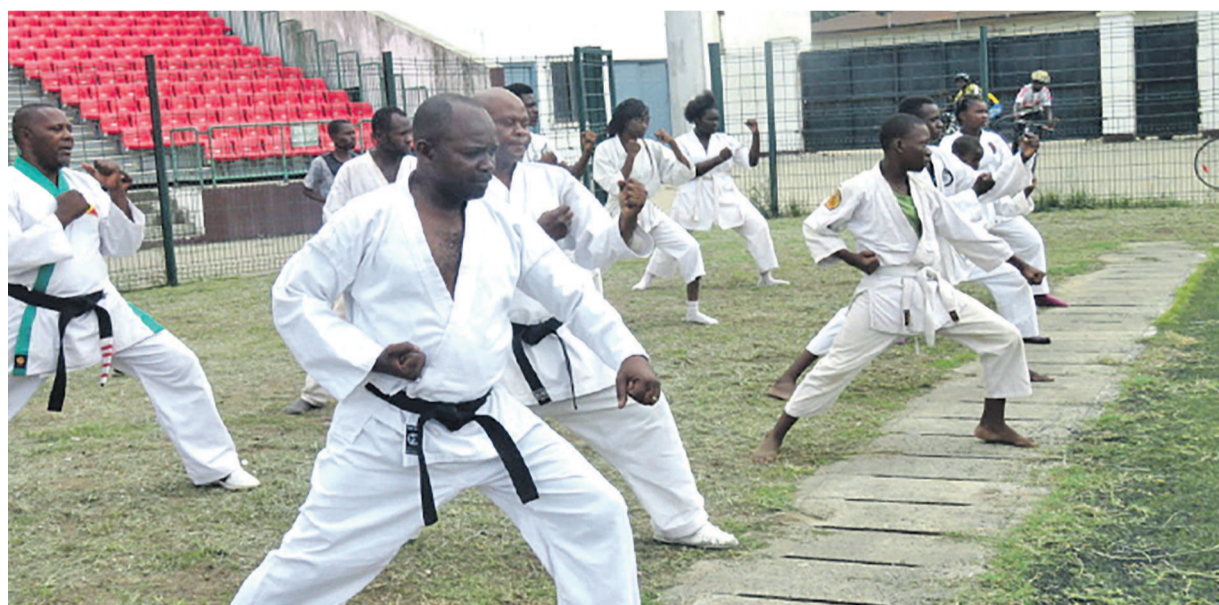
Une séance d'exhibition du karaté

La compétition sera organisée du 2 au 3 décembre, à l'Institut Thomas-Sankara de Pointe-Noire, dans les catégories seniors messieurs et dames.