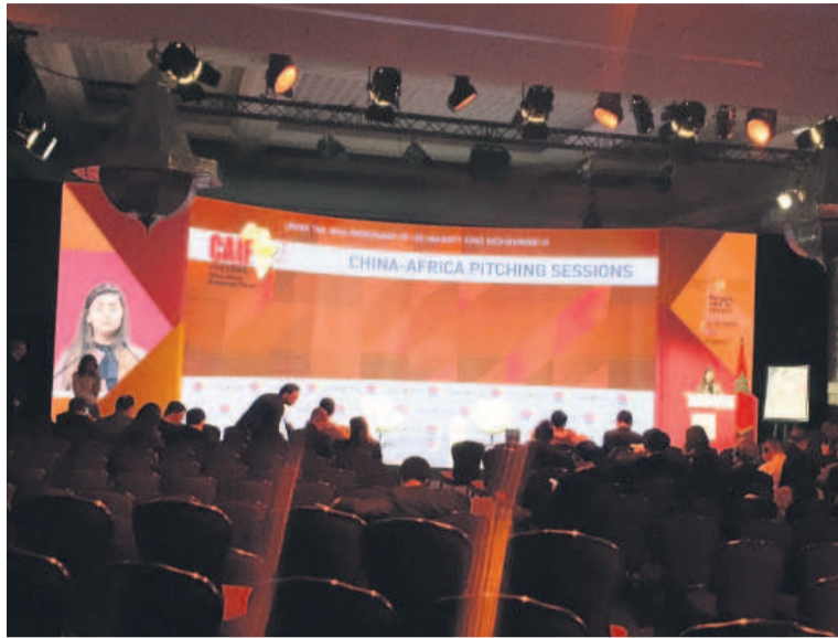
Une vue de la salle lors du forum Chine Afrique sur l'investissement (@CAIF2017)

Le Kenya, l'Égypte, Djibouti, le Maroc depuis peu, ont intégré l'initiative Obor, cet ambitieux programme d'infrastructures qui relie par voie terrestre la Chine à l'Europe occidentale via l'Asie centrale et la Russie, et par voie maritime l'Afrique et l'Europe par la mer de Chine et l'Océan indien.