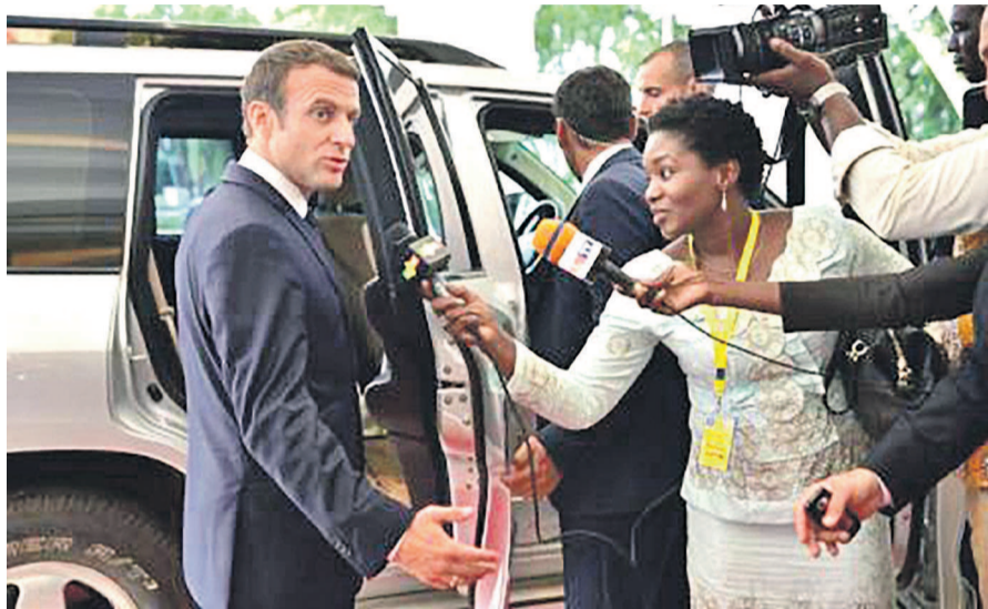
Le président français, Emmanuel Macron

Le président français Emmanuel Macron, interrogé sur les crises politiques en Afrique, a affirmé qu'il « souhaitait » que « le peuple togolais puisse s'exprimer librement » et qu'il y ait des élections en 2018 en RD Congo.