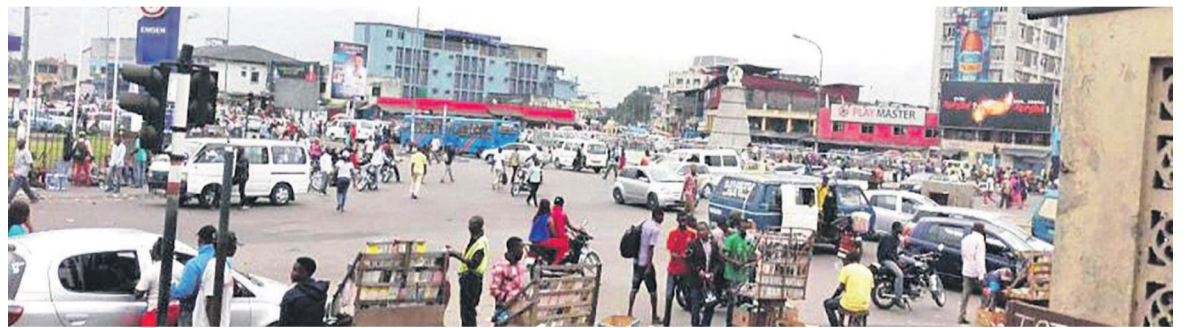
La place Victoire à Kinshasa

Caducité des textes légaux au niveau provincial, mode de perception archaïque, détournement systématique des recettes, absence de preuves de paiement, multiplicité des services publics et manque de parkings modernes