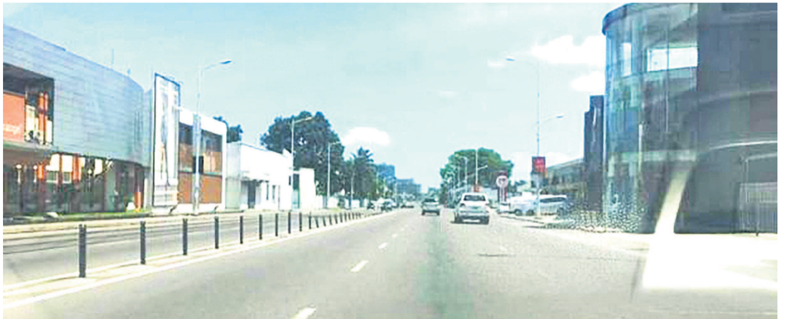
Le centre-ville de Kinshasa dans la matinée du 30 novembre