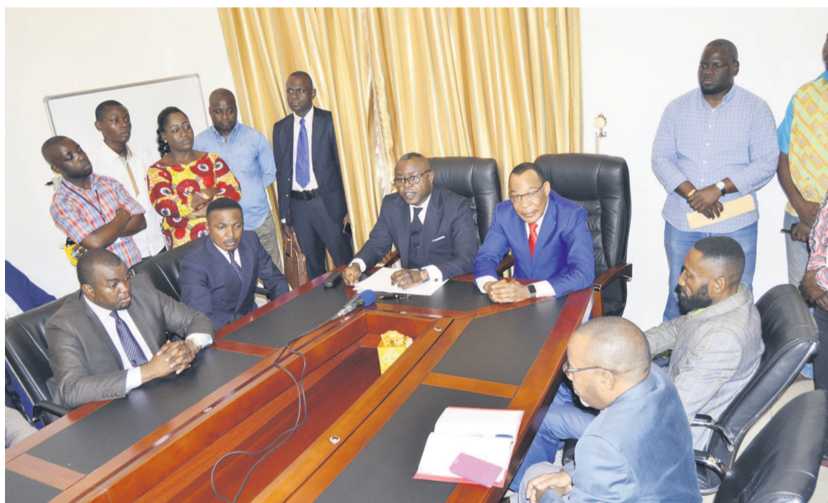
Le siège social de Congo télécom

D'après le ministre, cette restructuration permettra de rendre la société plus compétitive. « Le gouvernement, à travers cette réforme, compte seulement positionner Congo Télécom comme un opérateur historique fort afin de redonner à cette société ses lettres de noblesse pour qu'elle joue pleinement son