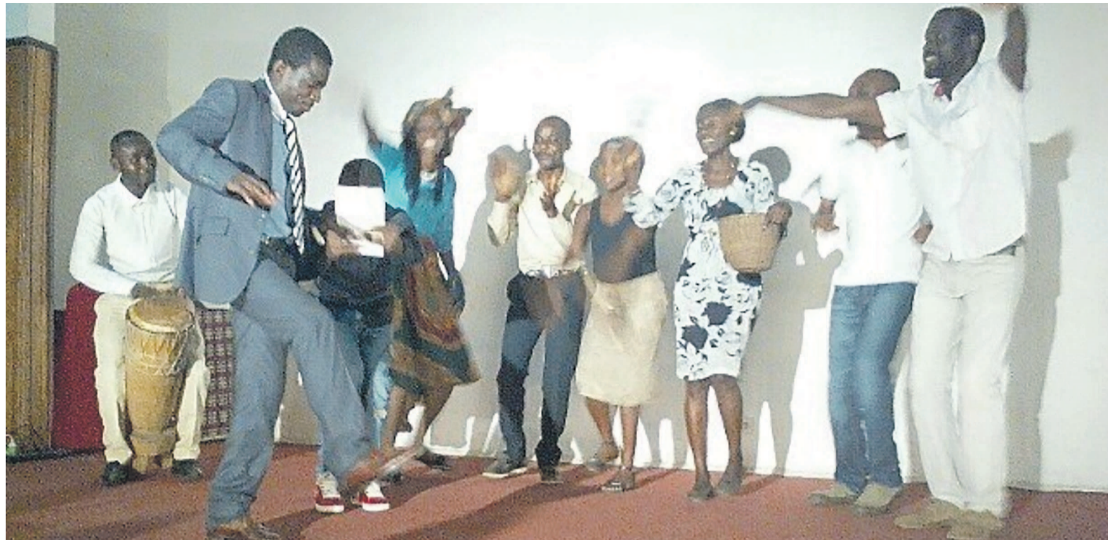
Une scène du spectacle Apocalypse

En effet, le Prix Ngoujel 1er récompense les jeunes âgés de moins de 25 ans, perspicaces après la série de questions selon les niveaux d'études de la 6 e jusqu'à l'université sur une représentation théâtrale. « Souvent, quand on suit un film à la télé ou une représentation théâtrale quelconque, on ne comprend juste que l'histoire superficielle sans pourtant chercher à savoir le message qui s'y cache derrière. C'est pour cette raison que nous avons initié ce concours qui