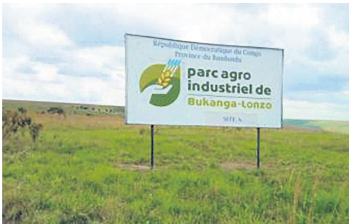
L'opacité dans la gestion des fonds énerve la Licoco

Bien plus, à en croire la Licoco, certaines dépenses engagées pour le compte du projet sont simplement fantaisistes et il y a de quoi s'interroger sur leur traçabilité. Ces dépenses se rapportent, entre autres, «aux paiements en faveur des institutions