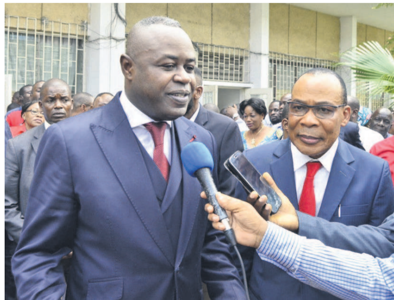
Le ministre Léon Juste Ibombo s'adressant à la presse

Dans la déclaration faite à l'issue de leur assemblée générale tenue le 5 décembre, à Brazzaville, les travailleurs ont contesté le projet de « réforme juridique » de leur société initié par l'Etat. Ils dénoncent, en effet, l'idée de « faire évoluer les statuts juridiques de Congo télécom et créer une