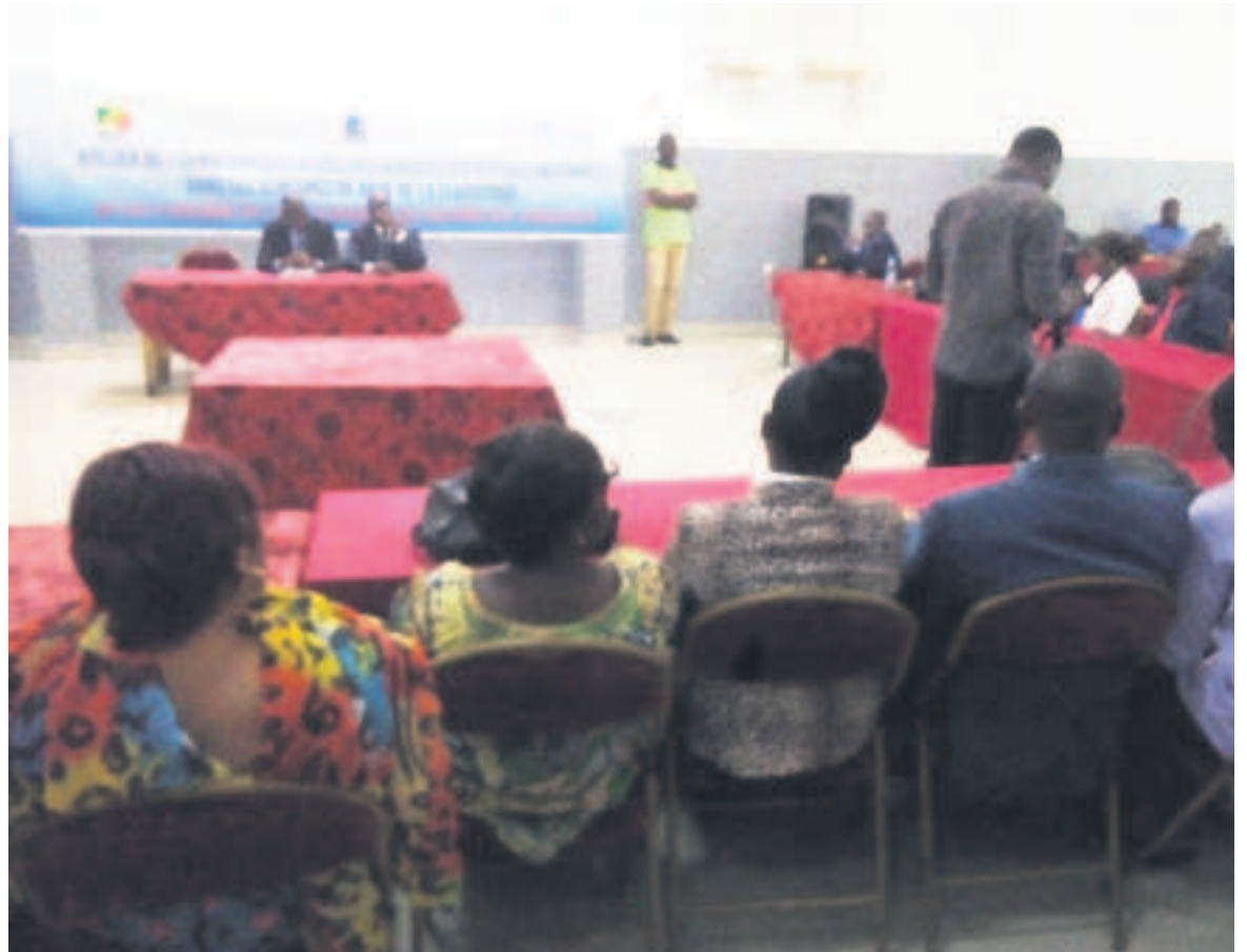
Une vue des participants à l'atelier de formation

Les cadres des agences statistiques des ministères sectoriels (Finances, Mines, Petites et moyennes entreprises, Santé, Agriculture, Promotion de la femme...) ont acquis, pendant deux semaines à Brazzaville, des connaissances sur l'analyse, la collecte et le traitement des données statistiques.