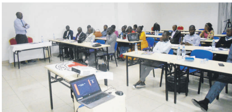
Les participants à la formation

Le CICR, a-t-il ajouté, envisage également de maintenir le partenariat avec la Croix-Rouge congolaise en vue de contribuer au renforcement de ses