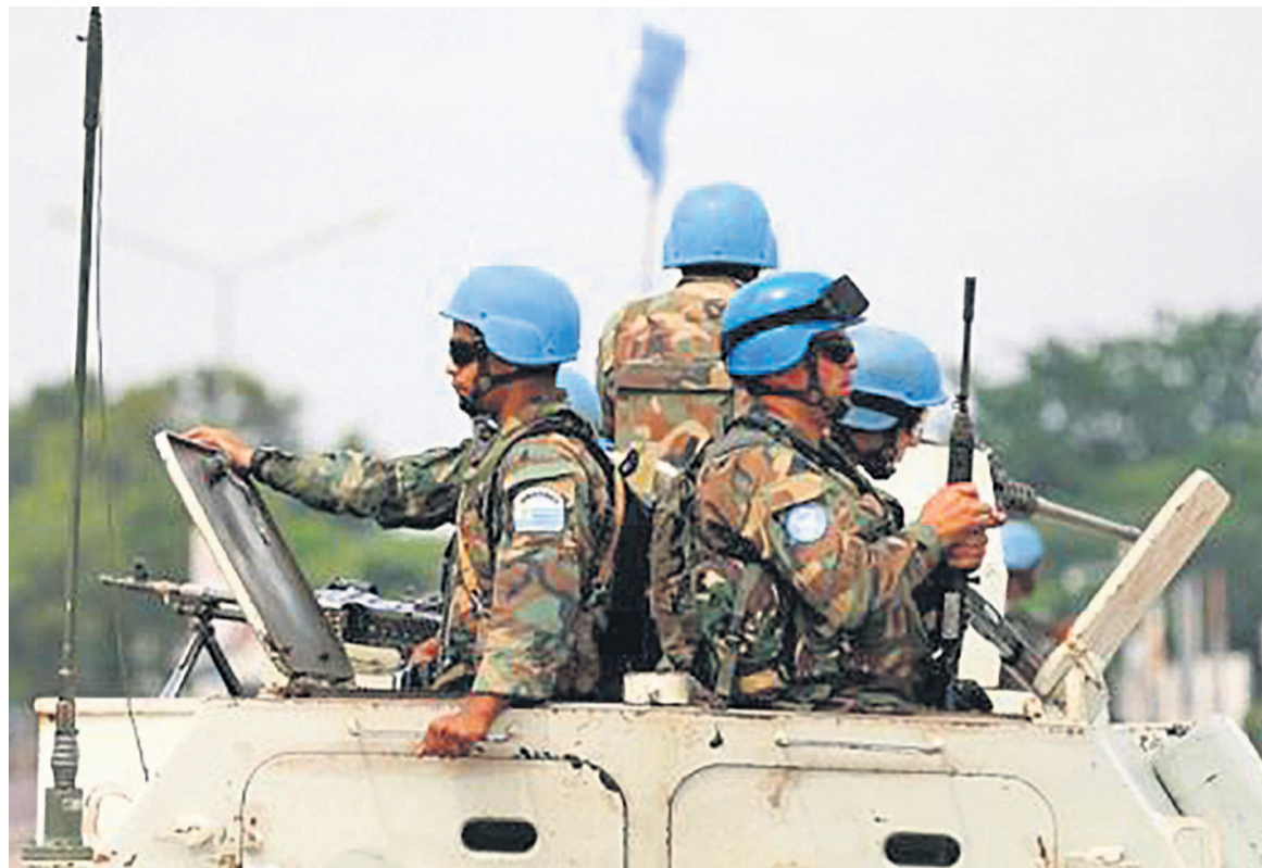
Des Casques bleus de la Monusco

Le 7 décembre restera une journée chargée de souvenirs macabres pour les Casques bleus de la Monusco positionnés au niveau de Semuliki, en plein « triangle de la mort » en territoire de Beni au Nord-Kivu. Ces hommes de troupe ont vu quelques-uns de leurs collègues être brutalement arrachés à la vie à la suite d'un affrontement armé. Des tirs à l'arme lourde ont, en effet, crépité aux heures du crépuscule dans cette zone réputée dangereuse qui se prolonge sur l'axe Mbau-frontière ougandaise. Le bilan est très lourd pour la mission onusienne en RDC qui a perdu près de quinze Casques bleus au cours de cette attaque perpétrée sur leur base par des présumés rebelles ougandais des ADF. Trois