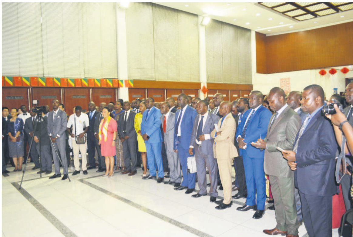
Une vue des participants

nisés chaque année en Chine s'inscrivent dans le cadre du renforcement de la coopération entre les deux Etats qui ont établi officiellement leurs relations diplomatiques en 1964. Depuis plus de cinquante ans, les deux pays voient leur relation politique s'améliorer. La Chine et le Congo