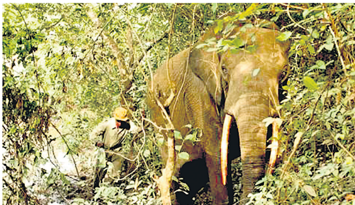
Les aires protégées ne sont pas à l'abri des braconniers

Selon le rapport de l'ONG Traffic, qui se concentre sur trois parcs nationaux aux confins de la République démocratique du Congo (RDC) et de la Centrafrique, le «braconnage est répandu dans toute la région et ses principaux auteurs sont des groupes armés non étatiques, des acteurs étatiques, des éleveurs armés et des braconniers indépendants». Ces acteurs, en particulier «l'Armée de résistance du Seigneur (LRA), les Janjaweed (milice soudanaise) et d'autres milices non étatiques», exercent une «pression énorme sur les populations d'espèces sauvages dans ces aires protégées», les parcs de la Garamba et Bili (dans le nord de la RDC), ainsi que