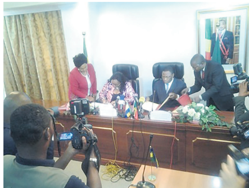
Les ministres Estelle Ondo et Fidèle Dimou paraphant les accords

Estimant que le transport aérien est « un acteur économique majeur de développement pour un pays », le moyen de transport le plus adapté pour relier les individus entre eux, et également le plus sûr, Estelle