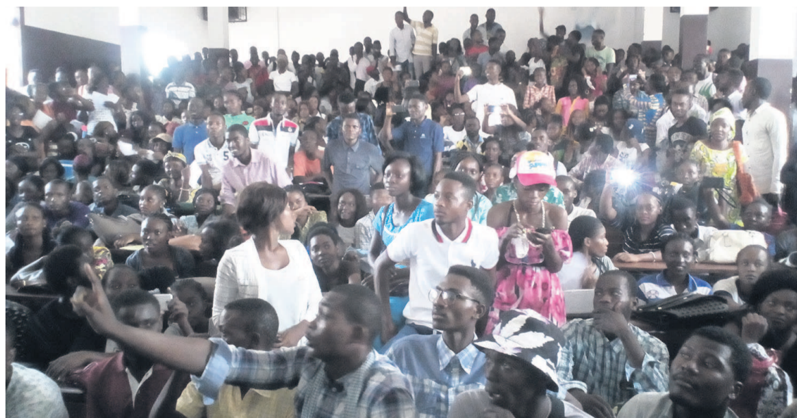
Les participants Adiac