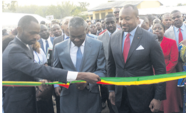
Le ministre Anatole Collinet Makosso coupant le ruban symbolique

tures scolaires et d'assurer l'animation sportive, culturelle, ou aux différentes activités récréatives, parascolaires ou périscolaires. « Je suis, d'ailleurs, heureux de recevoir ces installations avec la ministre de la Jeunesse, parce qu'on voit bien que le GABC voudrait créer un espace convivial de formation de nos jeunes, un véritable outil de prise en main de la jeunesse et je ne