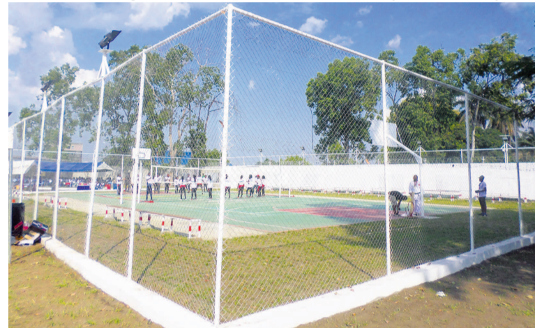
L'aire de jeu Adiac