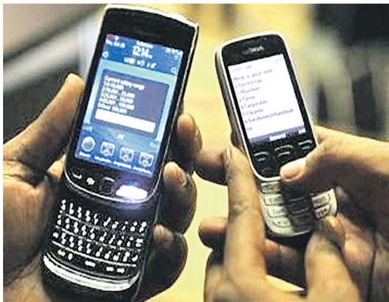
Orange revendique aujourd'hui dix millions d'abonnés en RDC

La restitution de ces résultats a été un exercice assez atypique dans le monde des affaires en RDC. Une entreprise acceptant de communiquer à la presse certaines informations sensibles de son impact réel sur l'économie nationale, après avoir eu précédemment une séance de travail avec les autorités du pays. Dans ce genre d'exercice, deux éléments sont d'une importance cruciale :