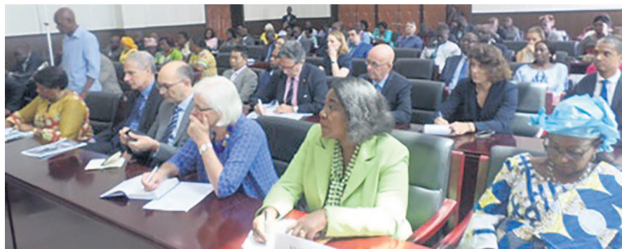
Une vue de la salle Adiac

Les deux composantes étant l'assistance humanitaire dans les lieux de déplacement ainsi que dans les zones du Pool jusqu'alors inaccessibles (22,9 millions de dollars) et des activités de relèvement précoce pour soutenir la réintégration des personnes déplacées rentrant chez elles ainsi que celles qui sont restées chez elles (47,8 millions de dollars). Ainsi, la première opération consistera à la mise en œuvre d'activités génératrices de revenus là où se trouvent les déplacés et la seconde à la reconstruction, le rétablissement de structures de