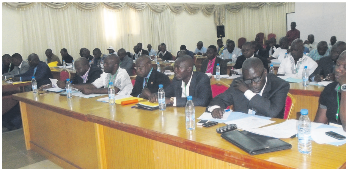
Les participants à l'assemblée générale ordinaire de la Fécofoot/Adiacget d'investissement.

Les deux organes ont été mis en place, le 17 mars 2018 à Brazzaville, lors de l'assemblée générale ordinaire de l'instance gestionnaire du football au Congo.