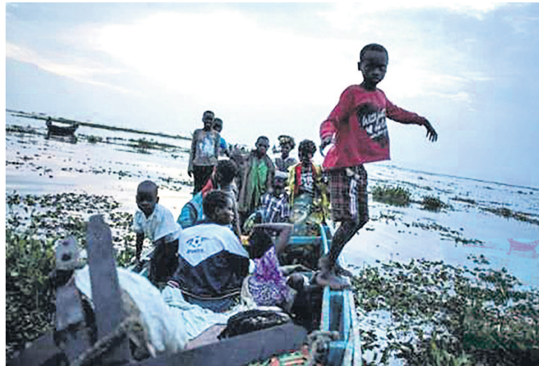
Des déplacés par les violences en Ituri, dans l'est de la République démocratique du Congo, le 5 mars 2018

L'acte a été commis le 15 mars par des déplacés, victimes de la reprise des violences dans l'est de la République démocratique du Congo, a-t-on appris de sources concordantes.