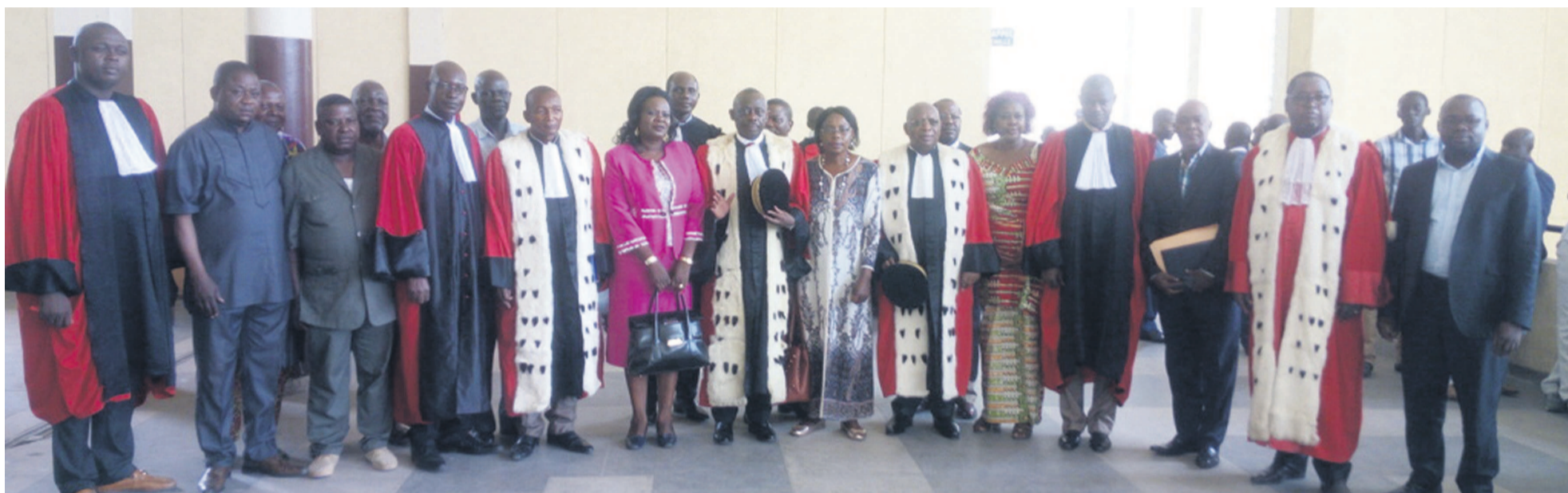
Les membres de la Cour criminelle et les jurés

Jusqu'au mois de mai prochain, la Cour criminelle siègera à Brazzaville sur 127 affaires inscrites à sa session, ainsi que l'a confirmé l'audience publique tenue ven-