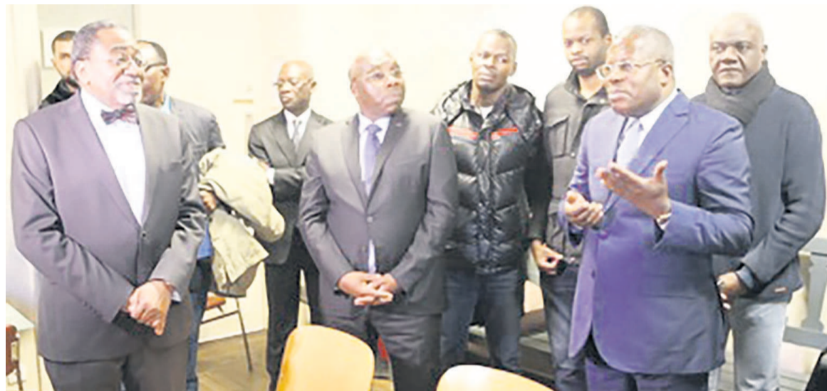
Une des séances d'explication de la procédure de l'obtention du passeport à Paris

La promesse avait été faite par l'ambassadeur du Congo en France, Rodolphe Adada, lors des festivités de la fête nationale à Paris. Le précieux sésame que représente le passeport pour les Congolais de France sera délivré à Paris.