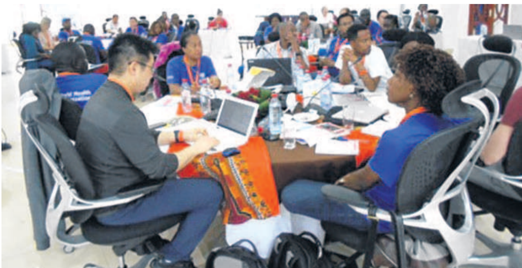
Les épidémiologistes en formation

démie, les informations sont relayées dans chaque organisation, afin de répondre au besoin. Selon lui, le mécanisme de coordination de l'organisation est évoqué par un représentant de chacune d'elle. Notons que la deuxième journée de formation a été mar-