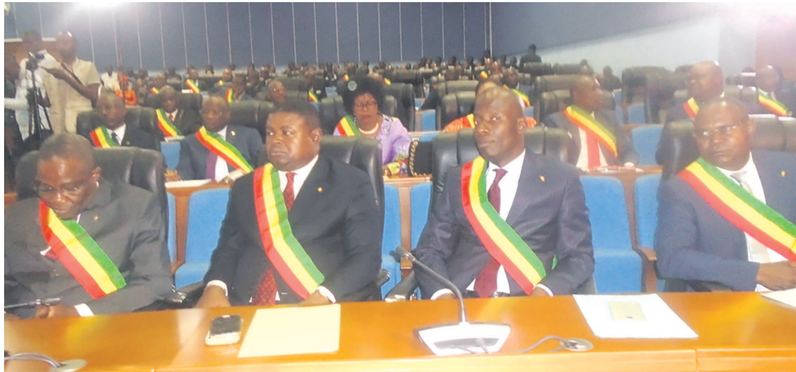
Une vue des députés pendant la clôture de la session

Conscient de ce que la paix est la condition sine qua non de