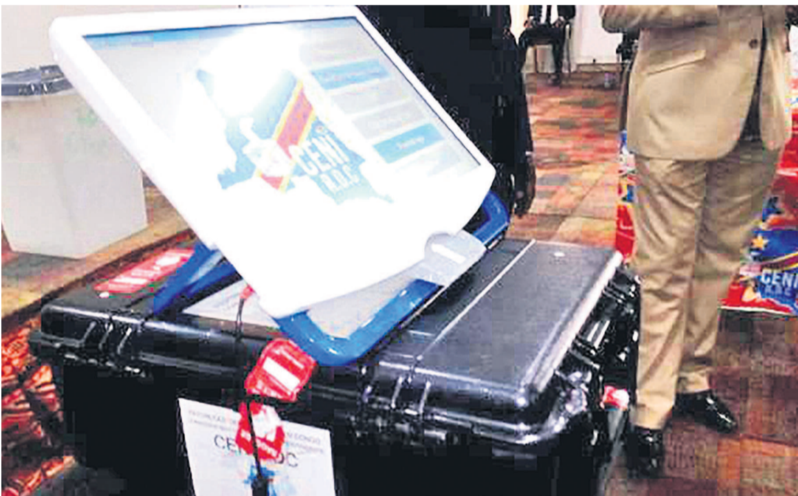
Une machine à voter

Dans un communiqué publié mardi, l'institution électorale de la Corée du sud déclare n'apporter ni «soutien officiel» ni aucune «garantie» à son homologue congolais qui tient mordicus à utiliser ces machines de fabrication coréenne pour les élections cruciales du 23 décembre. À la suite des diplomates