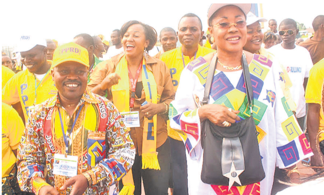
Des membre du PPRD