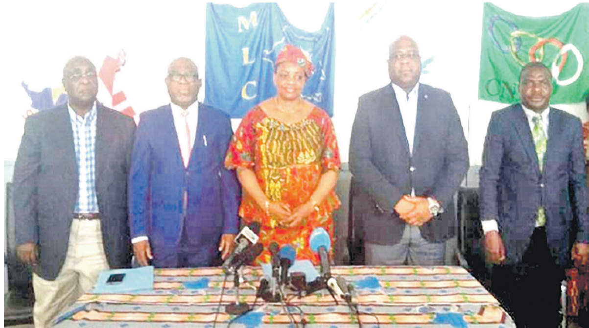
La photo de famille des leaders de l'opposition, après la rencontre.

Jugeant, en effet, peu sérieux le travail abattu par la Céni lors de l'enrôlement des électeurs et du nettoyage du fichier électoral, l'opposition a noté qu'elle a présenté les données statistiques incorrectes, en affichant des chiffres manifestement et intentionnellement inexacts. Pour l'opposition, le nombre ex-