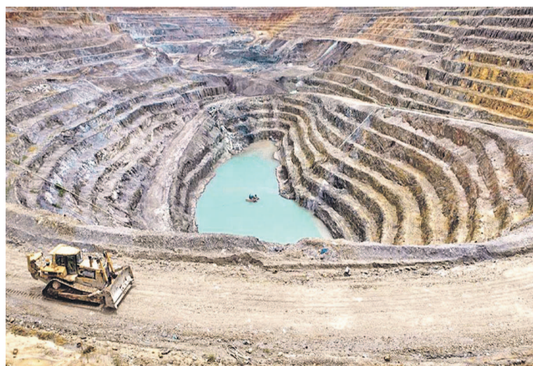
Un gisement de cuivre en RDC

Cette question promet de garder son actualité jusqu'à la tenue, du 13 au 15 avril à Lubumbashi, de la prochaine édition de DRC Mining Week. L'on apprend que le nouveau code minier et son impact sur l'industrie minière constitueront un des thèmes majeurs de la rencontre. Pour l'heure, la problématique semble se poser en des termes très clairs. Après sa promulgation, le nouveau code instaure désormais une augmentation des taxes sur les minerais extraits et traités en RDC. Il faut