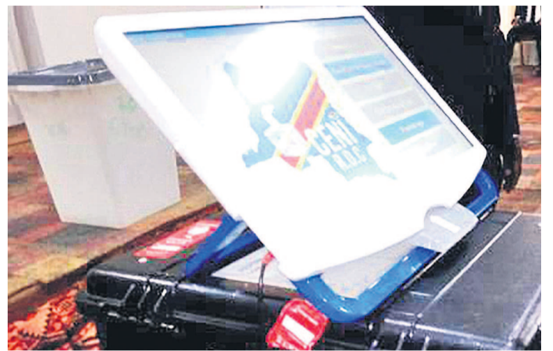
Une machine à voter

À la suite des diplomates dont des officiels des États-Unis, tout comme de nombreuses personnes en RDC, la NEC redoute que l'introduction de ces machines puisse augmenter les risques d'élections frauduleuses. L'autre appréhension tient au fait que les électeurs en zone rurale, peu familiers de nouvelles technologies, auront du mal à se servir de ces outils. Ce qui donnerait le champ libre à toute forme de manipulation pouvant facilement entraîner le tripatouillage des résultats. Du côté de la Céni, la sérénité reste toujours de mise. Nonobstant les différentes oppositions qui s'expriment contre ces machines commandées auprès du fournisseur sud-coréen Miru Sys-