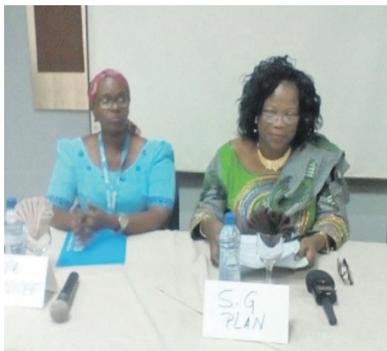
Une vue des oratrices lors de la présentation des résultats l'enquête

L'étude menée depuis 2015 par l'Unicef, le ministère de la Santé et l'université de Havard, visait, entre autres, à mieux comprendre les contraintes et obstacles liés à l'adoption des comportements favorables à la survie et au développement de l'enfant.