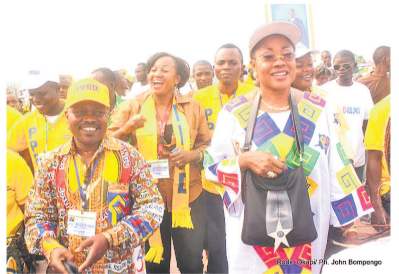
Des membre du PPRD

Dans la perspective des élections générales de décembre 2018, le parti présidentiel vient d'acheter un aéronef qui permettra à ses cadres de battre campagne dans des conditions optimales.