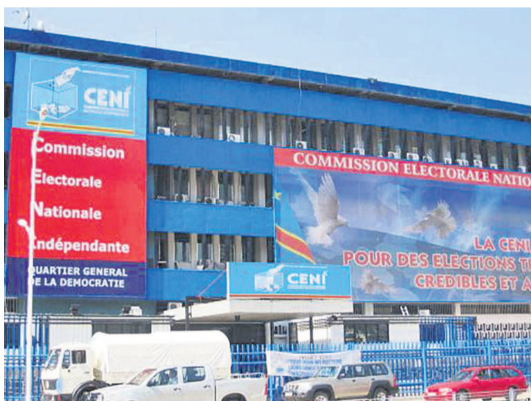
Le siège de la Céni sur le boulevard du 30 juin

Le fichier électoral présenté dernièrement par la Commission électorale nationale indépendante (Céni), au terme de l'enrôlement et après nettoyage, n'a pas convaincu nombre d'acteurs politiques, particulièrement ceux de l'opposition. Ces derniers contestent les chiffres avancés par la Céni qui, d'après eux, seraient en inadéquation avec les réalités du terrain. Certains, à l'instar du président de l'Écité, ont carrément rejeté ce fichier, estimant que les chiffres présentés ne sont pas proportionnels, notamment avec la densité démographique de cer-