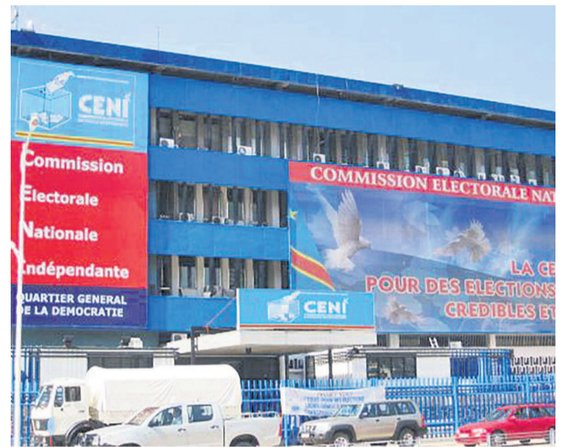
Le siège de la Céni sur le boulevard du 30 juin des machines à voter.

Pour mettre fin à la controverse que suscite le fichier électoral de plus de 40 millions d'électeurs présenté récemment, la centrale électorale a lancé, le 11 avril, un appel d'offres pour auditer le fichier électoral ainsi que la machine à voter. Par contre, rien n'a été dit sur l'audit du financement des élections, encore moins sur l'utilisation des fonds perçus pour l'achat