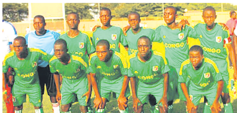
Les Diables rouges U-17

Éliminés en demi-finale par les Lionceaux indomptables du Cameroun sur la plus petite des marges (0-1), les Diables rouges U-17, tenants du titre, rencontrent, ce 12 avril, les Sao du Tchad en match de classement pour la troisième place du tournoi de l'Union des fédérations de football d'Afrique centrale (Uniffac) qui se dispute en terre camerounaise.