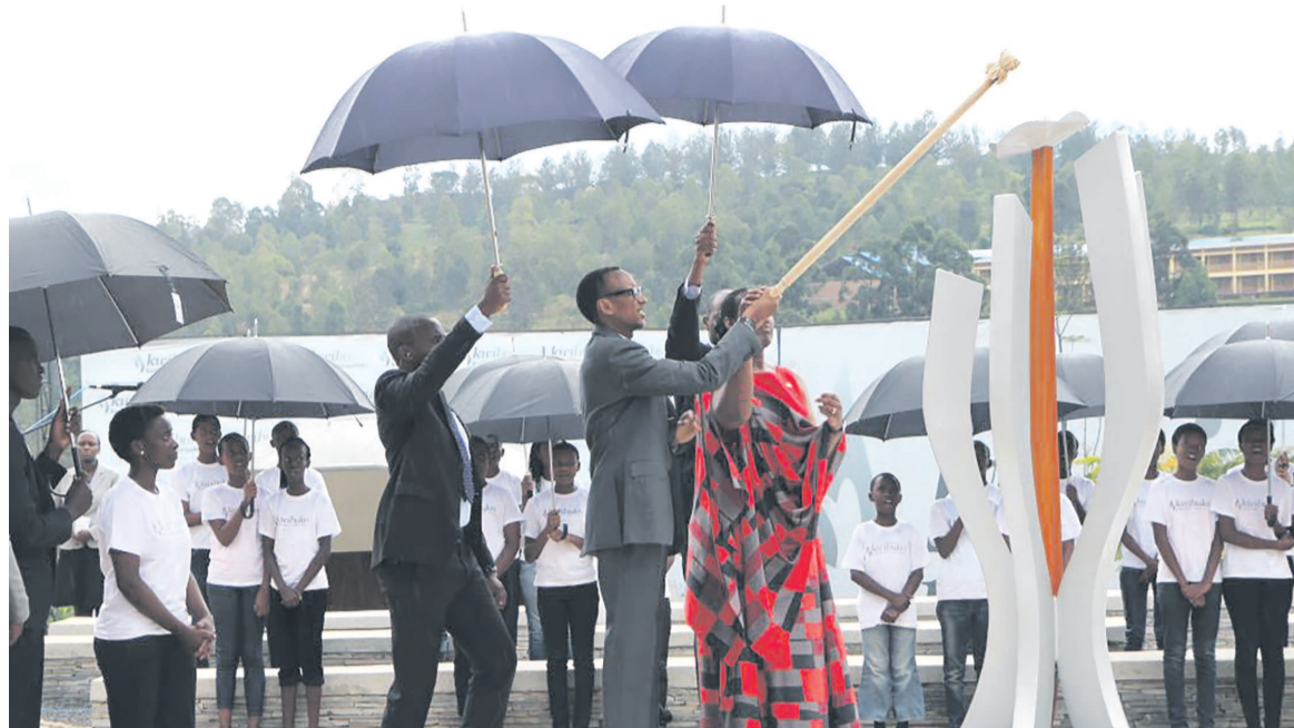
Le président rwandais Paul Kagame allume la flamme du souvenir au mémorial du Kigali, lors de la commémoration des 21 ans du génocide, le 7 avril 2015.