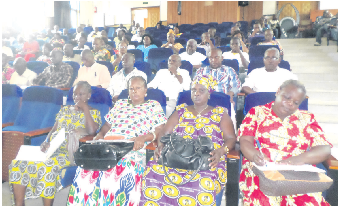
Une vue des bénéficiaires

En effet, en fonction du financement disponible grâce aux efforts du gouvernement et ses partenaires techniques et financiers, l'Unité de gestion a élaboré un calendrier de paiements qui s'étale jusqu'à huit mois. Dans sa communication, le coordonnateur du projet Lisungi a annoncé la suspension, à titre conservatoire, de nombreux ménages qui ne répondraient pas aux critères d'éligibilité. « Le gouvernement a, pour sa part, pris des engagements pour inscrire dans le budget un financement important qui doit permettre de faire l'extension de Lisungi dans des zones additionnelles et de prendre aussi en compte un peu plus de ménages. Pour l'instant, nous avons une liste de 4 161 ménages des zones pilotes à payer mais les premières suspensions concernaient soixante ménages seulement. Sur la base