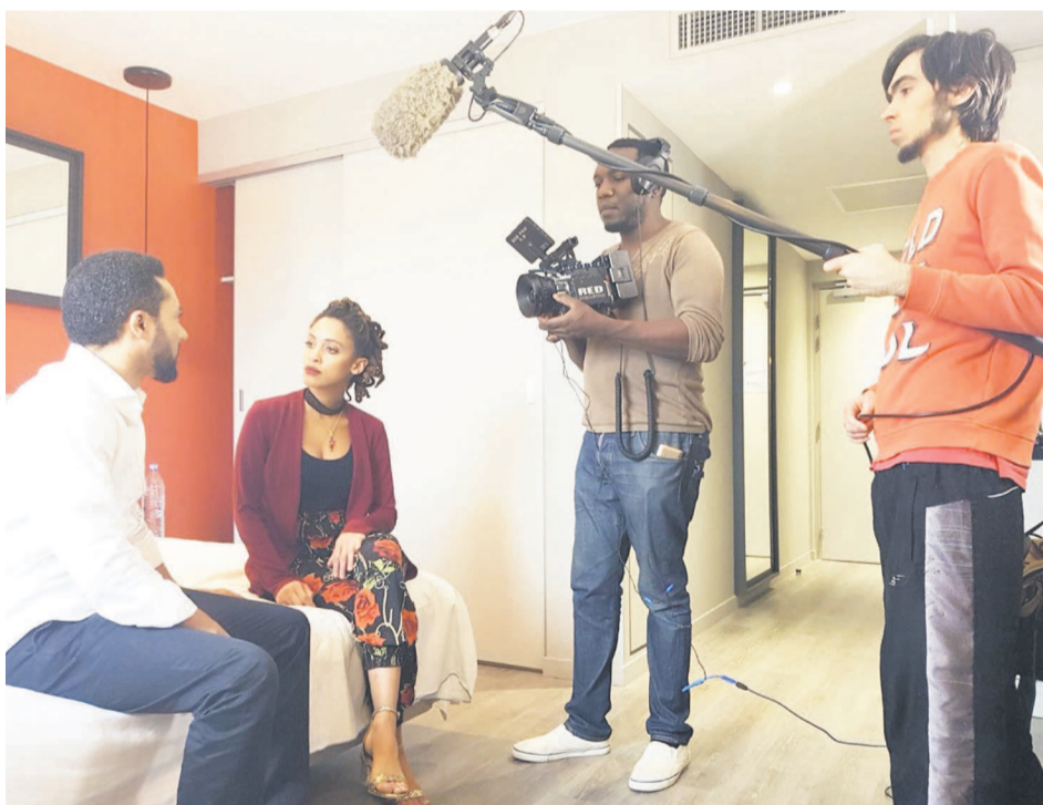
La projection d'une séquence de «River hôtel»

Prenant la parole avant la projection de deux épisodes (16 et 27) sur les cinquante-deux, le directeur général de «TV5 Monde» a indiqué que c'est important pour sa chaîne qui est celle de l'ensemble de la francophonie, d'ac-