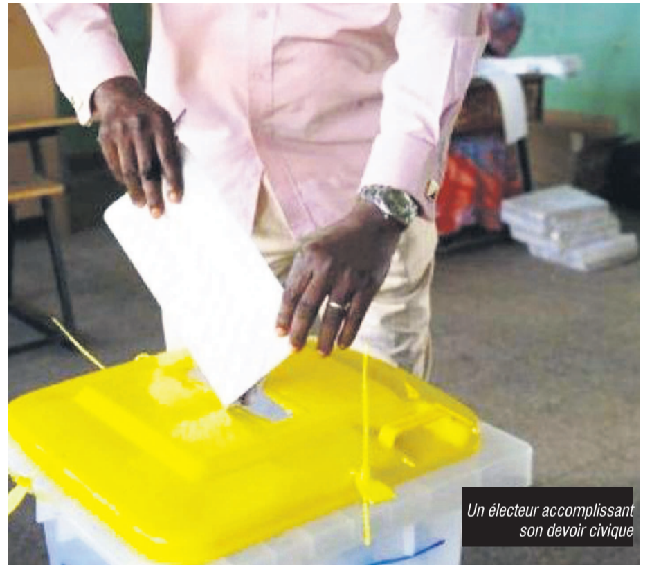
Un électeur accomplissant son devoir civique