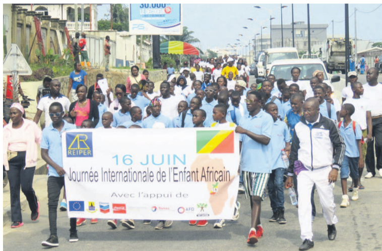
Les enfants en rupture, lors de la marche de solidarité organisée en leur faveur

De ce point de vue, signer les textes d'application en vue de donner un caractère plus contraignant à la loi n°4-2010 du 14 juin 2010 portant protection de l'enfant en République du Congo serait pour le Reiper, les autorités et la communauté internationale, un véritable pas vers la mise en place d'un Etat engagé à respecter les droits de l'enfant, a-t-il martelé. « C'est, d'ailleurs, l'occasion