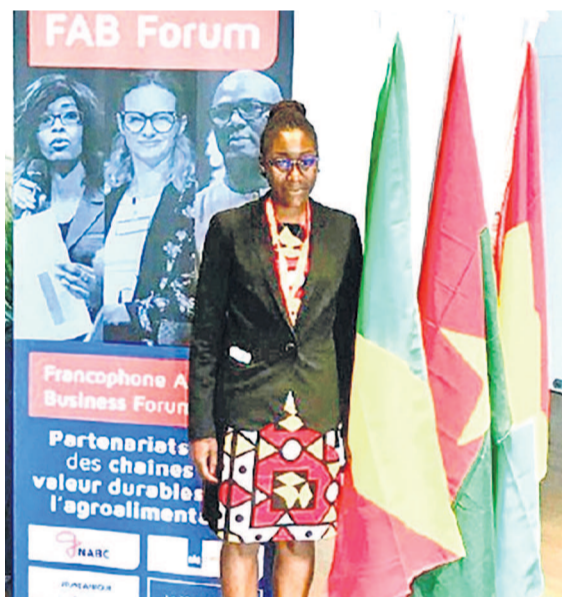
Stand Eco-Oil au FAB Forum 2018, aux Pays-Bas

L'objectif, au sortir de cette rencontre, ayant été de pouvoir établir des liens d'affaires, pour la suite acheter de produits néerlandais de tous genres : graines, équipement de traitement, machines / véhicules agricoles, ou opter pour les systèmes d'irrigation, les solutions solaires, chambres froides, aliments pour animaux, engrais, produits laitiers, emballage. Etre capable d'assurer la vente de produits fruitiers, les légumes ou la viande. Cela a été aussi une occasion offerte à ceux qui souhaitent jouer un rôle actif au niveau du partage de