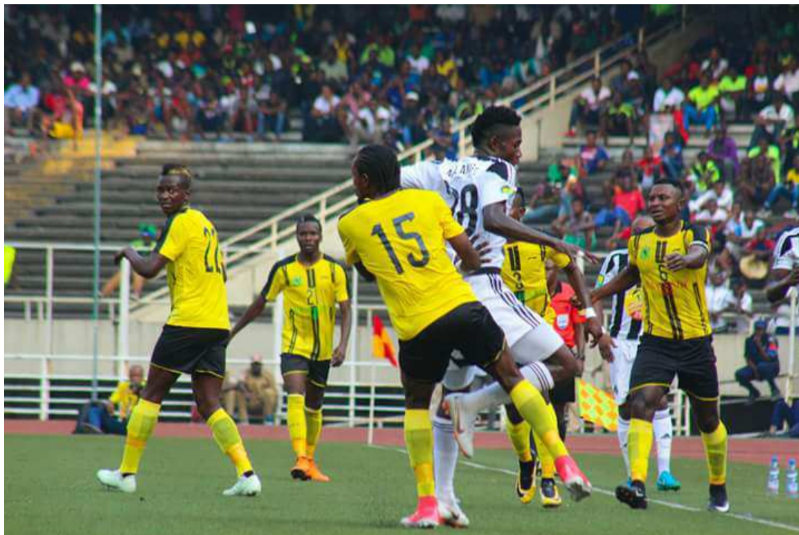
Vue d'un match de V.Club en Play-Off du championnat de la Linafoot