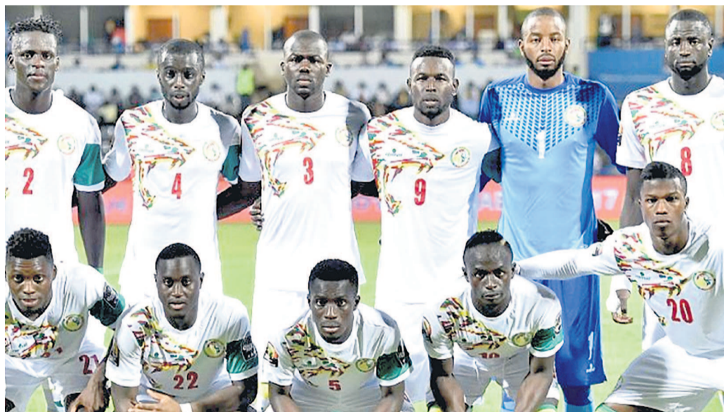
Le onze sénégalais

Le principal enjeu du match Sénégal-Japon n'est autre que le ticket pour les huitièmes de finale du groupe H. Les Lions de la Teranga ont trois points après leur victoire face à la Pologne 2-1, lors de la première journée. Leur futur adversaire pour la deuxième journée, le Japon, a réalisé le même exploit devant la Colombie. Sénégalais et Japonais sont donc co-leaders de la poule H. La confrontation de dimanche prochain pourra les départager en cas de victoire de l'une ou l'autre équipe. Si le Sénégal s'impose, il totalisera six points qui lui ouvriront les portes du second tour. Même chose au cas où le Japon l'emporterait. Le score nul n'est pas exclu. Dans ce cas de figure, le suspense se poursuivra jusqu'à la dernière journée de cette phase de poule. La Pologne et la Colombie, qui ont perdu leur premier match, occupent les deux dernières