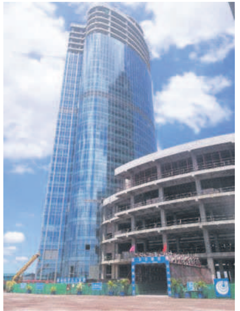
L'une des deux tours jumelles de Mpila, à Talangaï

Ces tours jumelles viendront s'ajouter au chapelet des ouvrages construits au Congo grâce à la coopération chinoise. Les deux pays sont depuis 2016 liés par un partenariat stratégique global, couvrant plusieurs domaines d'activités.