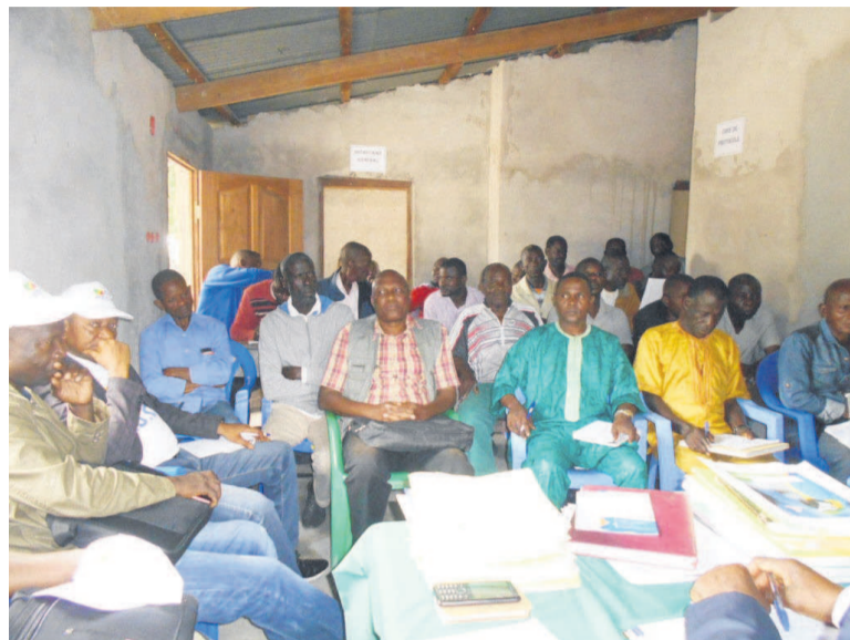
les chefs de quartier lors de la sensibilisation avec la délégation du PDCE

Le projet est à sa deuxième phase de réalisation dans les deux grandes villes, Brazzaville et Pointe-Noire. Il consiste à inscrire gratuitement les jeunes âgés de 16 à 30 ans, ayant abandonné l'école, dans les différents centres retenus, a expliqué le