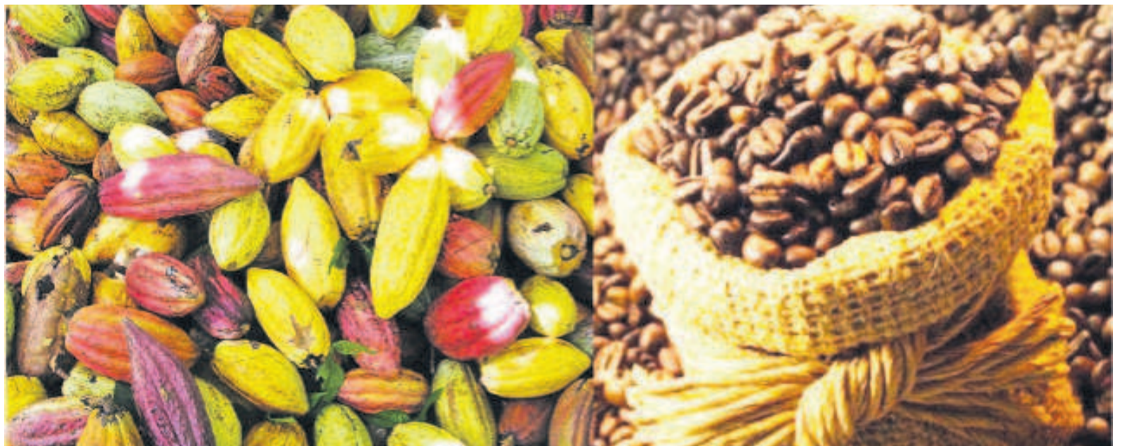
La RDC entend booster sa production du café et du cacao