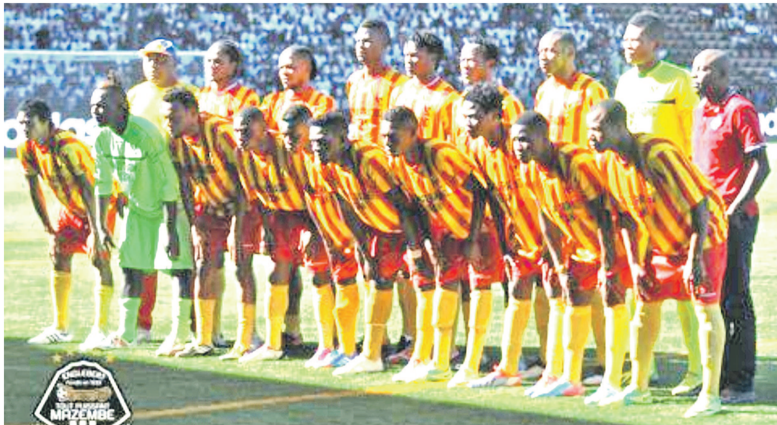
Sanga Balende n'est plus leader du Play-Off du championnat national