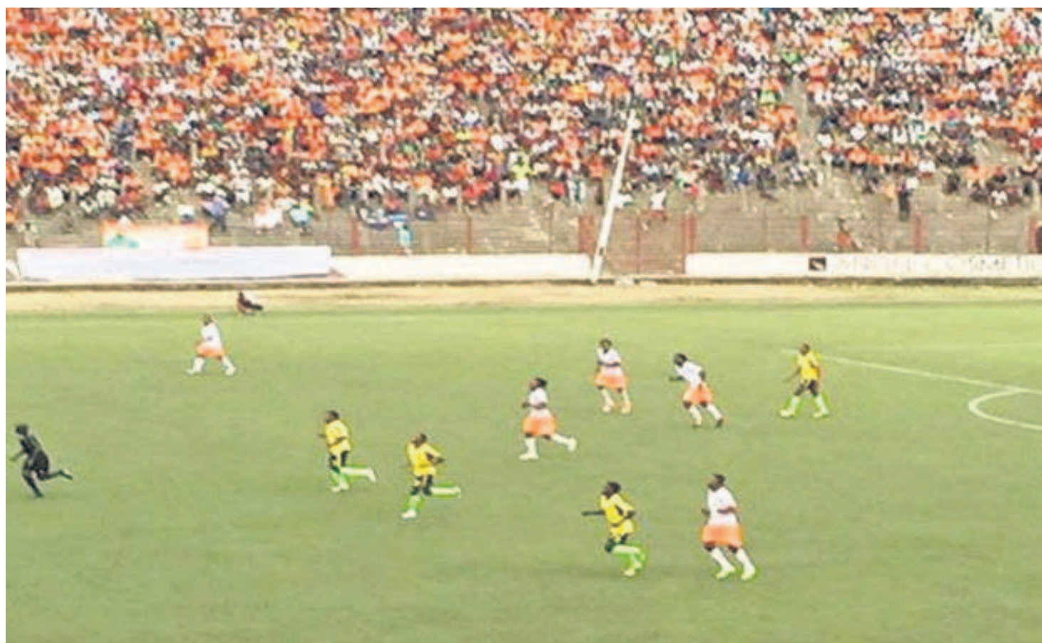
Vue d'un match du FC Renaissance du Congo au stade Tata-Raphaël de Kinshasa

Sur le site de Mbuji-Mayi, Kungu Pemba affrontera, le 28 juin, la Jeunesse sportive de Kinshasa et l'AS Nyuki s'opposera au club local d'AS Bantous. Les deux premiers des deux groupes accéderont en demi-finales prévues à Kolwezi, dans la province du Lualaba. Le vainqueur de la 54e édition de la Coupe du Congo succédera à Maniema union et prendra part à la Coupe de la Confédération.