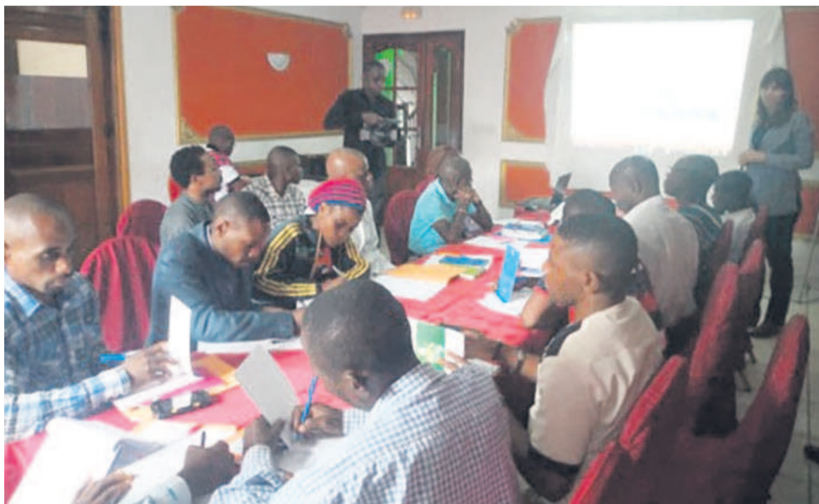
Les participants au séminaire

Quant à la sélection, elle a été faite sur la base des critères spécifiques: les candidats devraient montrer leur pertinence en rapport avec la concession forestière certifiée ou