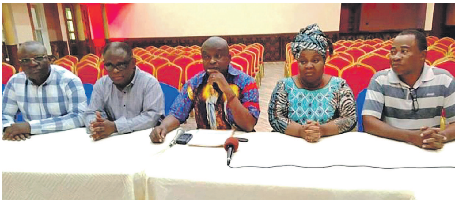
Le CLC envisage une reprise de ses actions pacifiques

Dans une correspondance adressée au président de l'institution panafricaine, le 23 juin, le Comité laïc de coordination catholique attire son attention sur le blocage constaté dans la mise en œuvre de l'Accord de la Saint-Sylvestre. Aussi les laïcs catholiques interpellent-ils l'institution panafricaine auprès de laquelle ils sollicitent « une plus grande implication afin de permettre au peuple congolais de vivre une alternance pacifique qui puisse garantir la paix et la stabilité dans la région ».