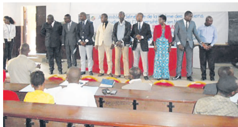
Les membres élus du bureau fédéral de la Crane