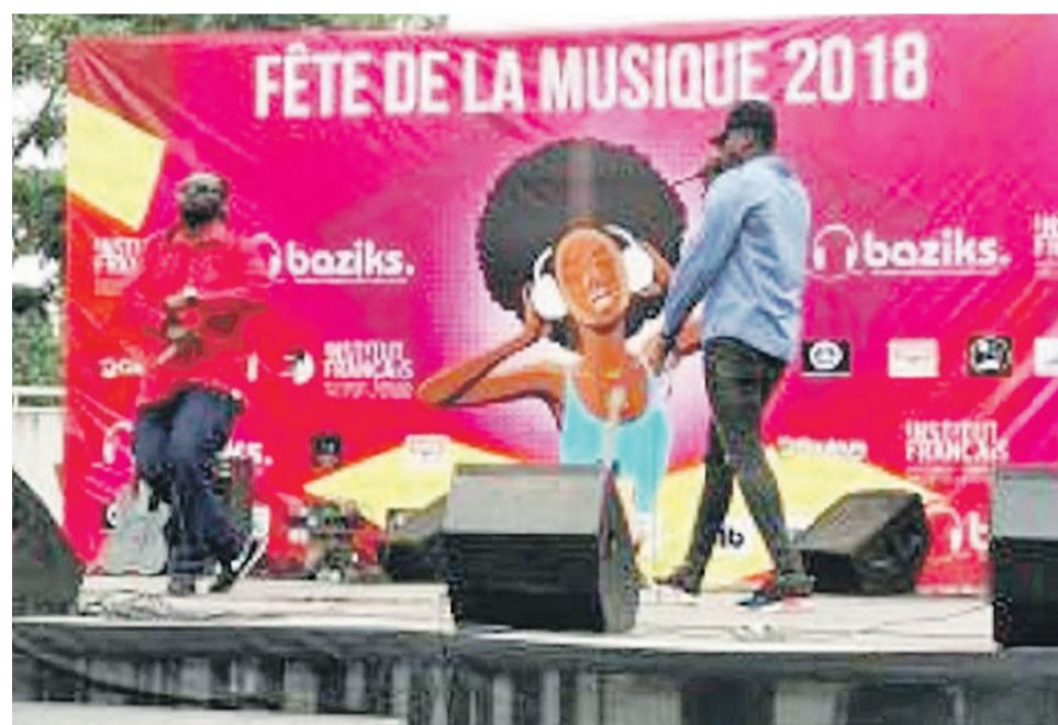
Le podium de la Fête de la musique en journée, à la Halle de la Gombe

Accaparés par la Coupe du monde, les Kinnois ont à peine fait cas à la Fête de la musique. Cette année, l'on était loin des grandes célébrations populaires d'autrefois sponsorisées par les grandes brasseries Bracongo et Bralima. Pas de stars à l'affiche non plus pour un quelconque concert livré à un endroit ou un autre de la capitale. Les « Fans zone », installés un peu partout pour la circonstance, ont volé la vedette à tous les lieux habituels de concerts. Ils ont accueilli du monde le 21 juin, à l'instar de celui de Coca-Cola qui occupe la Place des artistes au célèbre rond-point Victoire ou encore celui du rond-point Huileries où l'indication Fan Zone est repris sur l'autocollant aux couleurs du mondial placardé sur l'enclos en triplex. Les habituelles terrasses et autres bars de la ville qui d'ordinaire diffusent sur petit écran ou écran géant, c'est selon, les compétitions de foot, notamment la Ligue des champions européenne, n'étaient pas en reste. Depuis le début du Mondial, le 14 juin, ces lieux affichent presque tous complets en soirée. Il semble que seul l'Institut français de Kinshasa a fait l'exception. En effet, son association avec Baziks Entertainment pour la Fête de la musique, organisée en écho à la soirée Baziks Live Session tenue en début d'année, a porté de bons fruits. Les nombreuses prestations d'artistes ont