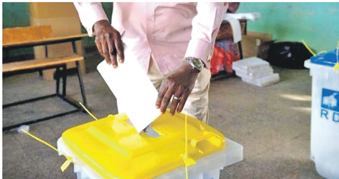
Un électeur dans un bureau de vote

La convocation officielle de l'électorat, le 23 juin, a donné lieu à l'ouverture des bureaux de réception et traitement des candidatures des députés provinciaux le jour d'après. L'opération, à en croire la Commission électorale nationale indépendante (Céni), s'étalera du 24 juin au 8 juillet.