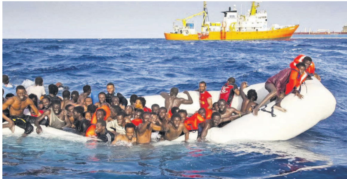
Les migrants à bord d'une embarcation de fortune

Un mini-sommet qu'Emmanuel Macron a jugé « utile », parce qu'ayant permis d'évacuer des solutions « non-conformes » aux valeurs européennes, comme des stratégies de refoulement.