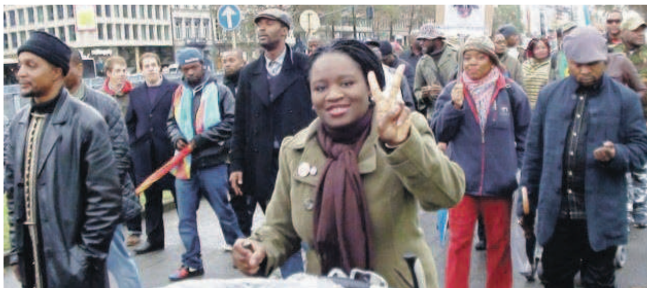
Une marche des congolais à Bruxelles