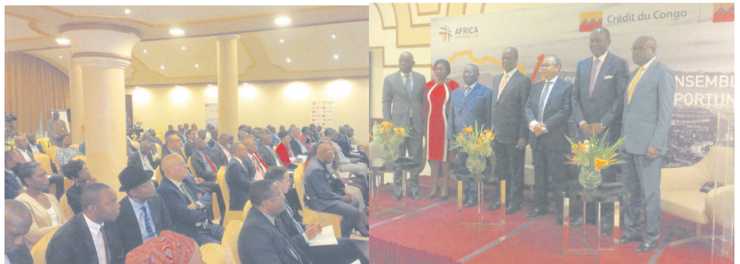
Les participants au focus (Adiac)

« La diversification de l'économie est une stratégie que le Congo tend à mettre en œuvre en vue d'explorer et de développer les secteurs et les filières poten-