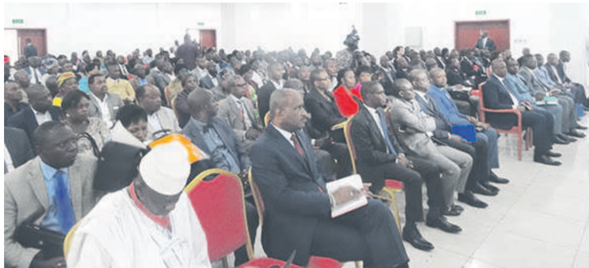
Des participants

Le document d'aide à la décision a fixé deux axes stratégiques prioritaires pour les cinq années à venir, à savoir la réforme du système éducatif et le processus de diversification de l'économie nationale. La prochaine étape consiste à transmettre le texte au parlement en vue de le hisser