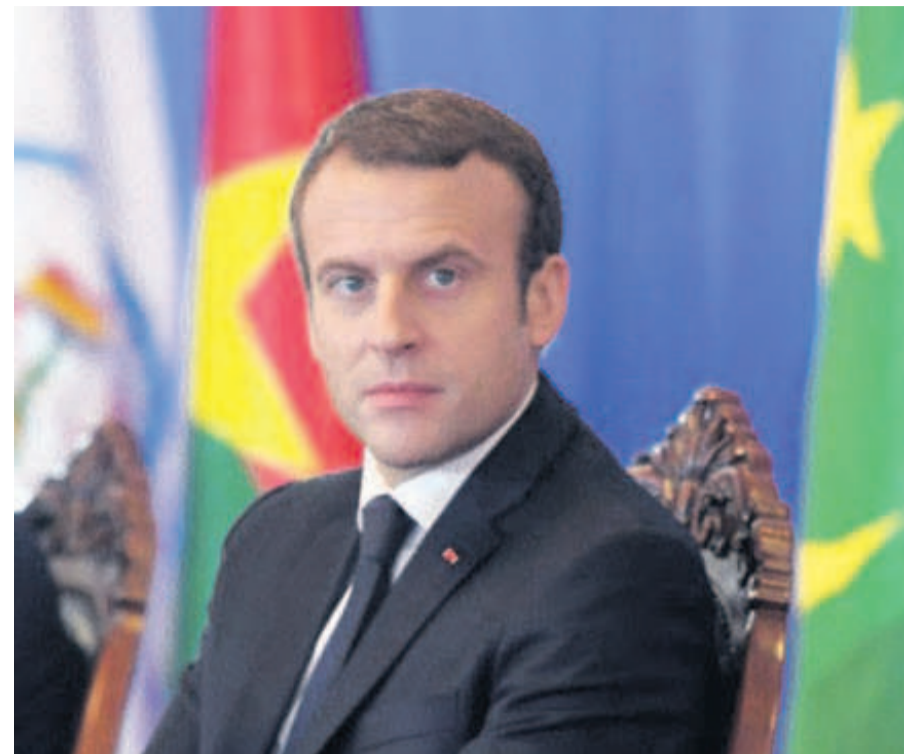
Emmanuel Macron

Au Nigeria, il fera escale dans la capitale Abuja pour s'entretenir avec son homologue Muhammadu Buhari, 75 ans, qui préside depuis 2015 le pays le plus peuplé d'Afrique (près de deux cents millions d'habitants) et la première puissance du continent. Emmanuel Macron a tissé des liens avec ce pays en y effectuant un stage