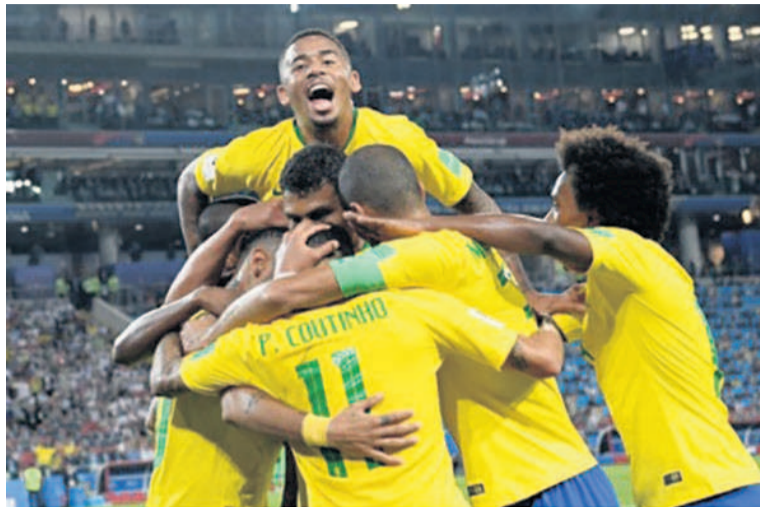
Auteur du second but brésilien face à la Serbie, Thiago Silva est félicité par ses coéquipiers

que Coutinho a magnifiquement lancé Paulinho, plein axe. Le solide joueur du FC Barcelone a devancé du bout du pied, en extension, le gardien serbe et deux défenseurs, pour ouvrir le score (36e mn) et donner aux quintuples champions du monde une bouffée d'oxygène avant la pause.