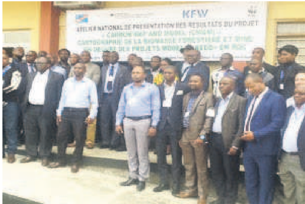
La photo de famille des participants à l'atelier

L'estimation résulte de l'étude menée dans le cadre du projet Carbon Map dans deux puits spécifiques du Mai-Ndombe par le Fonds mondial pour la nature (WWF).