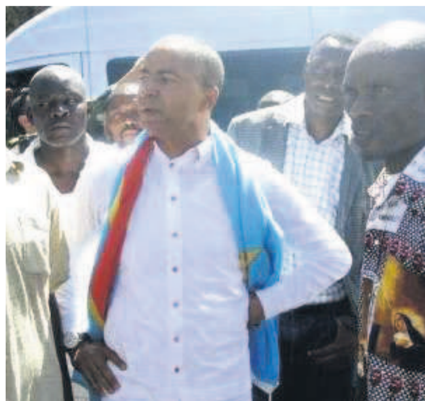
Moïse Katumbi au milieu de ses partisans