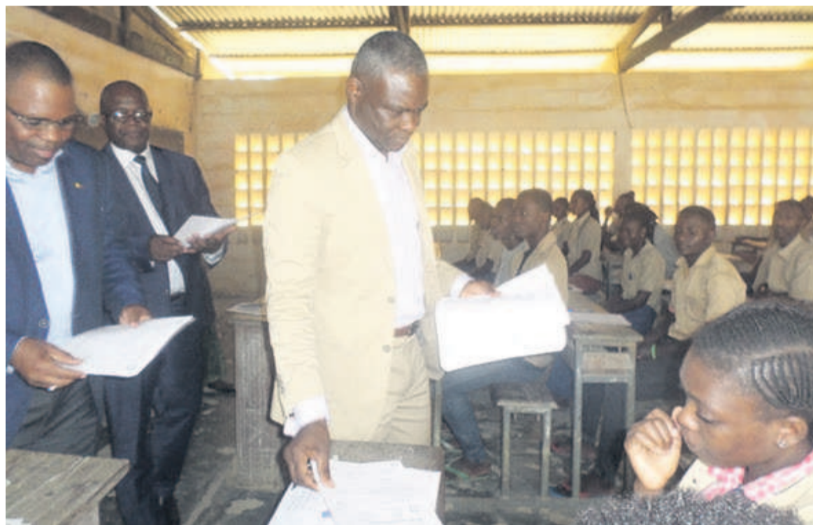
Le ministre supervisant les épreuves

Notons qu'à Brazzaville, quelques incidents ont été signalés, notamment aux centres de l'école fleuve Congo et à Ngamakosso, dans le 6 e arrondissement, Talangai, où certains éléments de la force publique retenus pour la sécurité se seraient mal comportés envers des candidats.