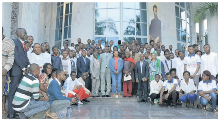
La photo de famille avec les apprenants