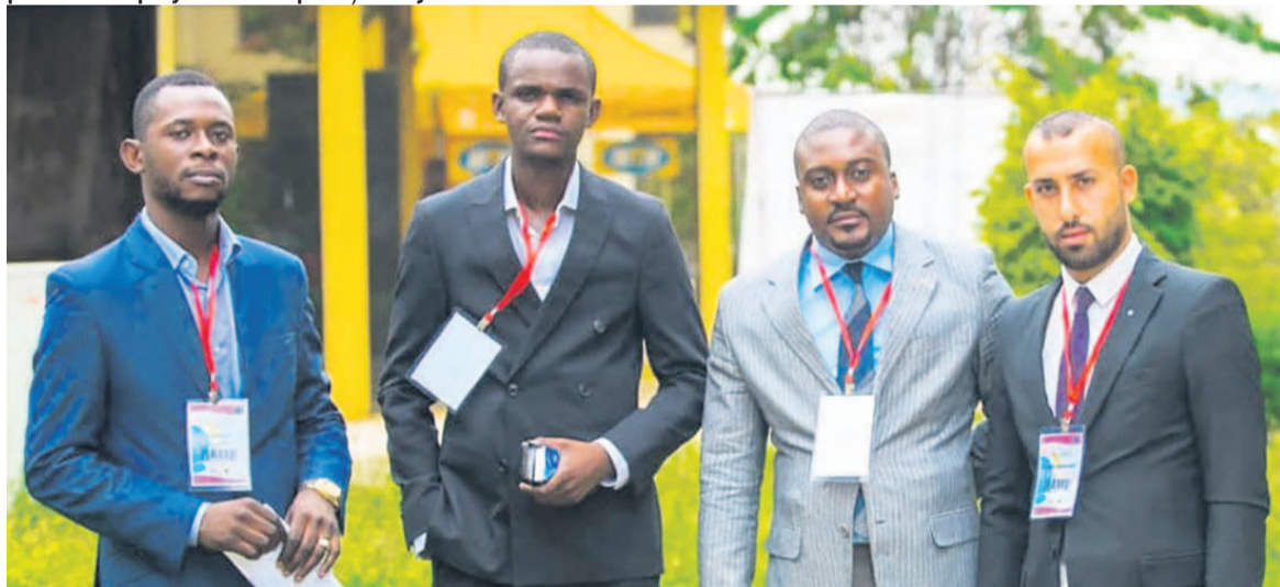
Les organisateurs et entrepreneurs

Dans le cadre de la célébration de la Journée internationale des micros, petites et moyennes entreprises, initiée par les Nations unies en juin 2017, la plate-forme Oukaley a organisé une causerie débat entre les entrepreneurs et les porteurs de projets d'entreprise, le 27 juin à Brazzaville.