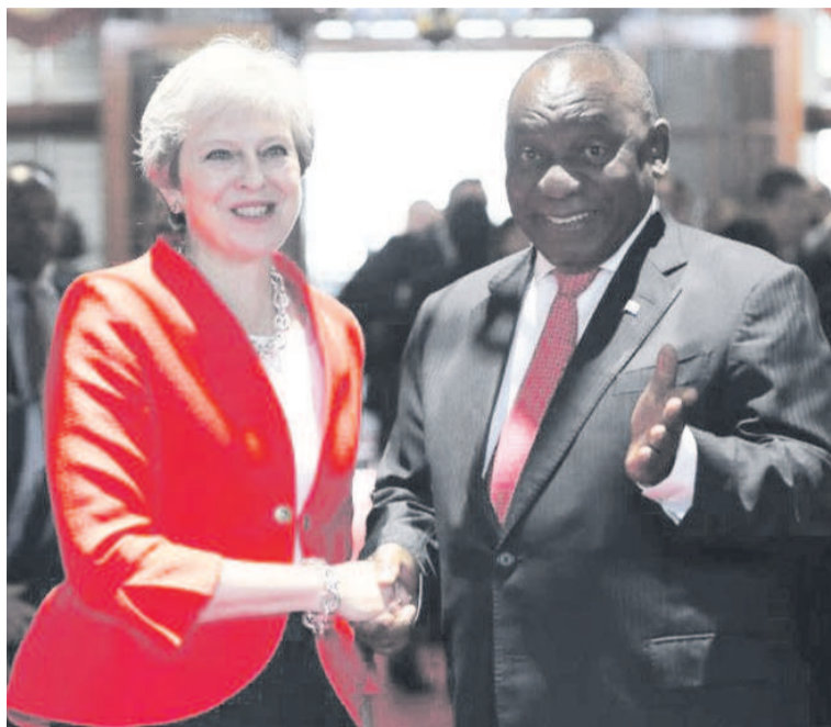
La Première ministre Theresa May est saluée par le président sud-africain Cyril Ramaphosa au Cap le 28 août 2018, première étape d'une tournée de la dirigeante britannique en Afrique.

« Je peux aujourd'hui annoncer une nouvelle ambition : d'ici 2022, je veux que le Royaume-Uni devienne l'investisseur numéro un en Afrique parmi les pays du G7, avec des entreprises britanniques prenant les devants et investissant des milliards dans les économies africaines »