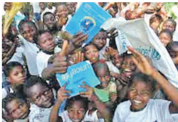
Les enfants ne doivent pas être privés de leur droit à l'éducation

L'agence onusienne qui milite pour les droits de tous les enfants à l'école peaufine des stratégies pour que ceux vivant dans les zones affectées par l'épidémie ne soient pas privés de leur droit à l'éducation.