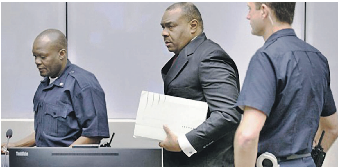
Jean Pierre Bemba (au milieu) lors de sa dernière comparution

Le 8 juin dernier, la Chambre d'appel de la Cour pénale internationale (CPI) avait décidé, à la majorité, d'acquitter Jean-Pierre Bemba Gombo des charges de crimes de guerre et de crimes contre l'humanité prétendument commis en Centrafrique.