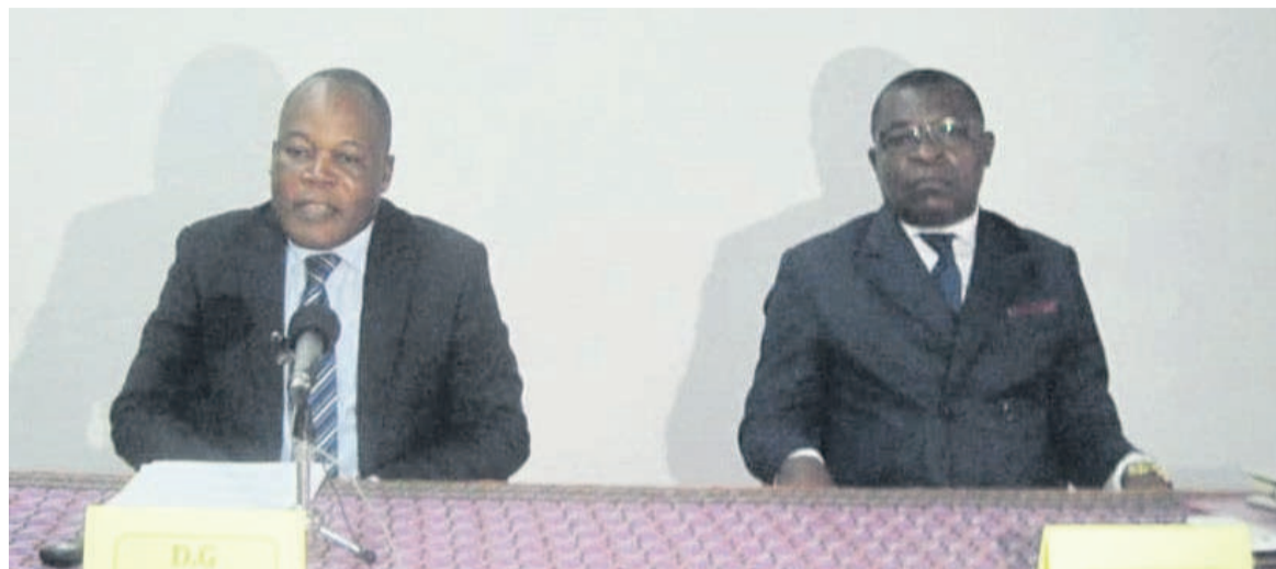
Le directeur de l'INRAP et l'inspecteur général de l'enseignement (Adiac)

La sélection des manuels à proposer aux élèves va se faire à l'occasion d'un atelier qu'a ouvert la direction de l'Institut national de recherche et d'action pédagogiques (Inrap), le 29 août à Brazzaville.