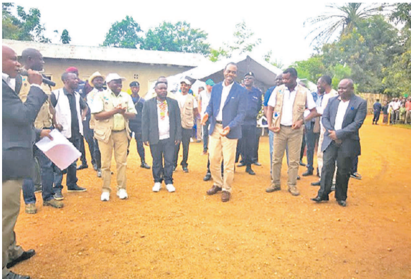
Le ministre de la Santé coordonnant la lutte contre Ebola

Dans la ville de Béni, l'équipe de la coordination de la lutte contre