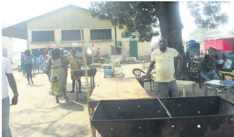
Des occupants de l'école primaire Angola-Libre

Le ministre de l'Enseignement primaire, secondaire et de l'alphabétisation, Anatole Collinet Makosso, qui est descendu le 28 août à l'école primaire Angola-Libre à Brazzaville, a prié les occupants de libérer immédiatement ce site.