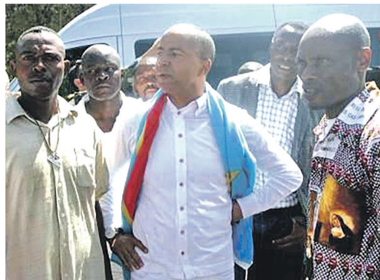
Moïse Katumbi au milieu de ses partisans

La requête initiée par l'Office des étrangers fait suite à l'interpellation de l'ex-gouverneur du Katanga, en juin dernier, à l'aéroport de Bruxelles-Zaventem en raison d'un passeport qu'il détenait par devers lui jugé « falsifié » par la police belge. Une situation qui rendait son séjour en Belgique irrégulier. Le parquet de Halle-Vilvoorde a confirmé qu'une information judiciaire pour « faux en