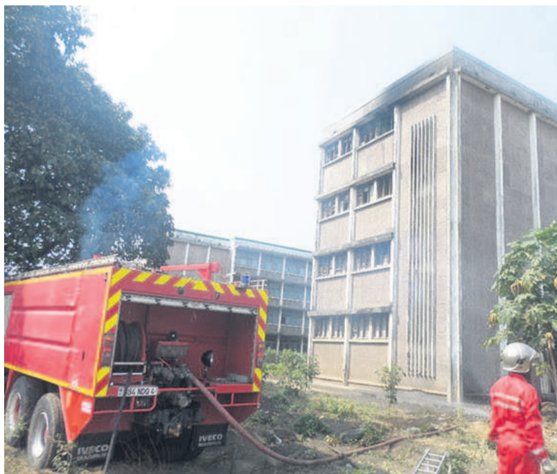
Le véhicule de la sécurité civile à pied d'œuvre

Un incendie s'est déclaré, le 28 août, dans un bâtiment abandonné au lycée Pierre-Savorgnan-de Brazza, dans le deuxième arrondissement, Baongo, aux environs de 14 h. Pour s'enquérir de la situation, le ministre de l'Enseignement primaire, secondaire et de l'alphabétisation, Anatole Collinet Makosso, s'y est rendu sur place où un véhicule de la sécurité civile était déjà à pied d'œuvre pour maîtriser le feu. En effet, le ministre a salué la promptitude avec la-