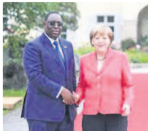
Le président Macky Sall et la chancelière Angela Merkel

Dans le cadre des migrations clandestines, autre sujet de discussion avec les dirigeants des pays visités, Angela Merkel compte montrer aux pays africains que l'Allemagne s'implique de plus en plus en Afrique, convaincue que le développement