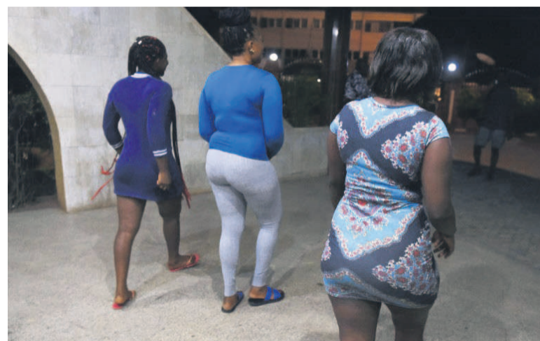
La prostitution des mineures a pris de l'ampleur à Kinshasa

L'opération lancée le 21 septembre par la police consiste à arrêter toute mineure qui sera trouvée, à des heures indues, dans un débit de boisson, hôtel ou tout endroit suspect et à la déférer devant le tribunal pour enfant pendant que son partenaire occasionnel sera, lui, transféré au parquet pour tentative de viol. La police entend également traquer toutes les jeunes filles qui s'attellent à exposer leurs parties intimes par le port des tenues indécentes. Afin d'éviter tout dérapage dans le chef des hommes en uniforme, le commissariat provincial de la police a pris l'option d'impliquer dans cette opération son personnel féminin et quelques agents triés sur le volet en raison de leur moralité. Page 4