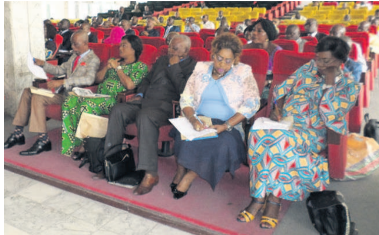
Les participants

taire sur la question sociale, véritable casse-tête aujourd'hui a également émise. Les conseillers ont soulevé le problème de l'école en perte de vue, de la santé, de la sécurité des citoyens, des érosions, du manque criard des enseignants dans les établissements scolaires, la précarité de la vie dans certains quartiers, les négociations avec le Fonds monétaire international, sans oublier l'épineuse question de la lutte contre les antivaleurs.