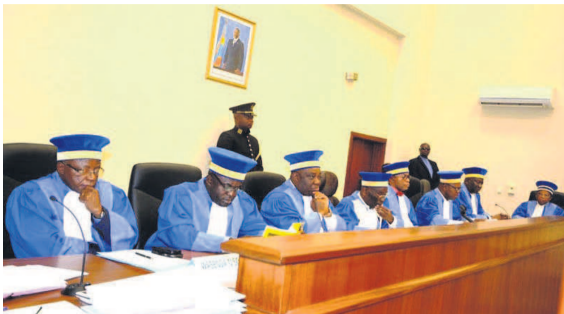
Les membres de la Cour constitutionnelle

Dans son rapport portant sur la réception, le traitement et le contentieux des candidatures aux élections du 23 décembre, présenté le 21 septembre, la Synergie des missions d'observations citoyennes des élections (Symocel) soutient que les audiences sur les contentieux électoraux à la Haute Cour étaient émaillées de plusieurs défaillances.