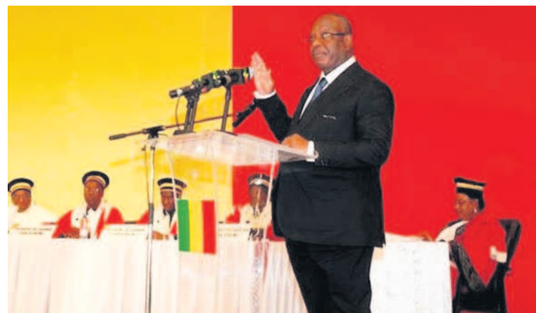
Ibrahim Boubacar Keïta

Au sujet de la paix et de la réconciliation nationale, le président Ibrahim Boubacar Keïta a assuré que « la mise en œuvre de l'Ac-