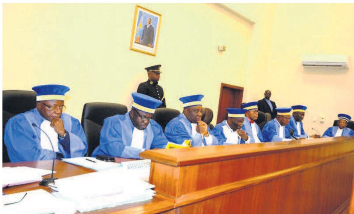
Les membres de la Cour constitutionnelle

Notons que pour mener à bien ce travail, la Symocel dit avoir déployé cent quarante-huit observateurs dans vingt-deux provinces pendant la période de réception et traitement des candidatures. Neuf juristes ont été commis pour observer les contentieux des candidatures à la Cour constitutionnelle et quatre experts électoraux ont été dépêchés auprès des partis et regroupements politiques.