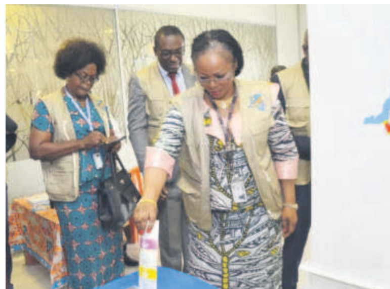
Une séance de simulation du vote avec la machine à voter

d'une seule à chaque arrivée et départ des vols nationaux et internationaux. A l'aéroport de Ndolo, deux machines ont été installées dans la salle d'attente des vols nationaux. Entre-temps, mille deux cents autres