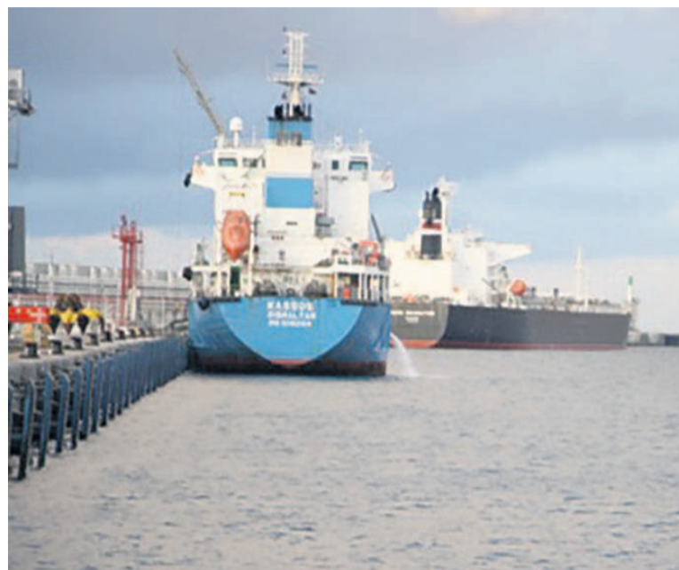
Un navire à quai (Adiac)

S'agissant des modalités du recours à la coercition en mer, le projet de loi évoque la reconnaissance du navire, du bateau ou embarcation en vue d'en connaître l'identité nationale. Il y a aussi son inspection, en vue de contrôler les documents de bord et procéder à toutes vérifications prévues par le droit international de la mer ou les lois et règlements nationaux.