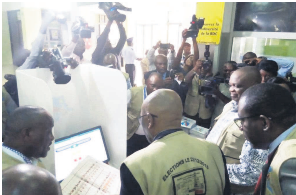
Une séance de simulation du vote avec la machine à voter

L'objectif poursuivi par cette action, à en croire des sources proches de l'institution électorale, est de permettre aux passagers d'expérimenter l'utilisation de cet outil de vote. Aussi la Céni a-t-elle convié chaque passager, via un communiqué remis le même jour aux services compétents de la RVA, à expérimenter