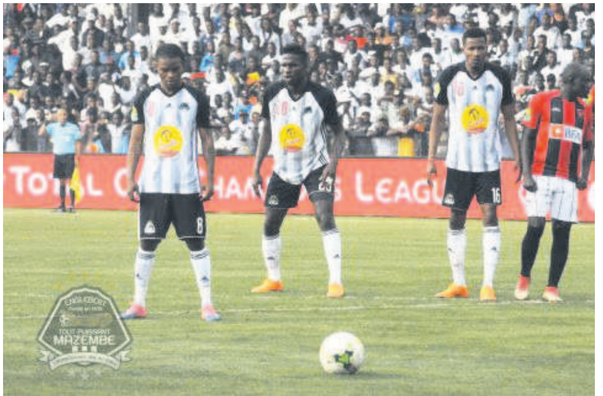
Le TP Mazembe ne disputera pas la demi-finale de la Ligue des champions d'Afrique

Avant le coup d'envoi du match, l'entraîneur serbe de Primeiro do Agosto déclarait :