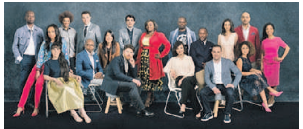
L'affiche de la campagne / crédit photo Vaya sigmas/Success DiverStory ASBL.

L'opération de sensibilisation, initiée par la Belgo-Congolaise Chouna Lomponda via l'association « Success DiverStory », a été officiellement lancée le 17 septembre dans la capitale belge. Elle présente dix-huit rôles-modèles issus des minorités dites visibles afin de combattre les stéréotypes.