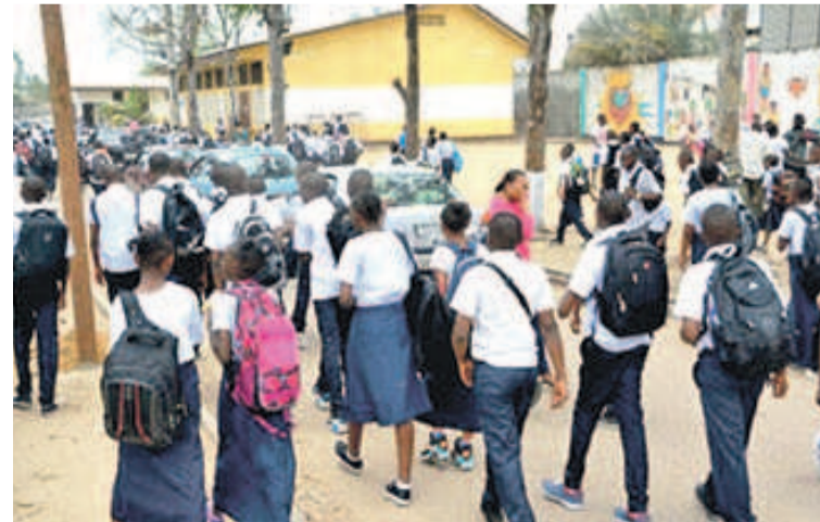
Des élèves dans une rue à Kinshasa

Cette performance a été saluée par les responsables de ces écoles qui soutiennent tous qu'il s'agit là d'un bon départ pour les enfants, augurant ainsi un lendemain radieux pour