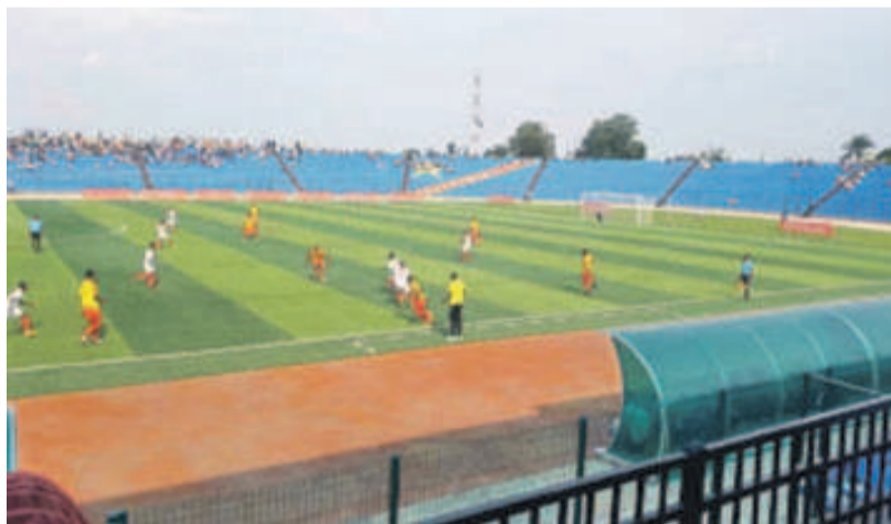
Le stade Kashala Bonzola de Mbuji-Mayi a servi de cadre au match entre Sanga Balende et Lubumbashi Sport

Le coup d'envoi de la 24e édition a été donné le 22 septembre, au stade des Martyrs de Kinshasa, par une victoire par forfait de Daring Club Motema Pembe (DCMP) sur l'OC Muungano.