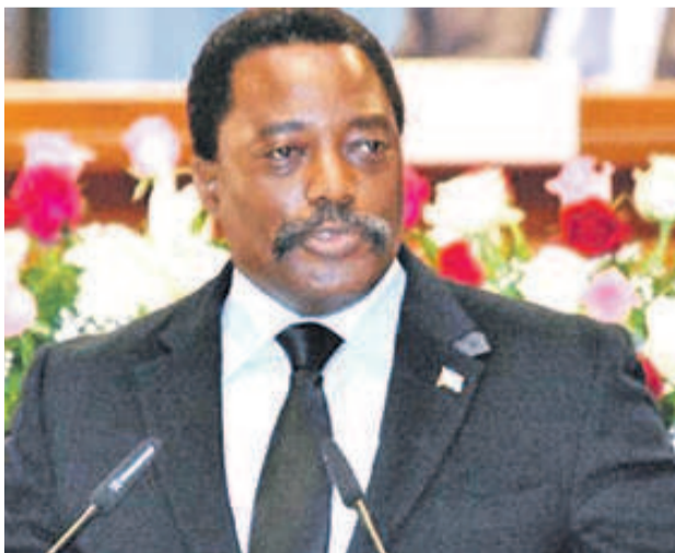
Joseph Kabila Kabange

Selon maints observateurs, il est fort probable que Joseph Kabila saisisse cette opportunité pour réitérer le désir ardent du peuple congolais d'assumer seul son des-