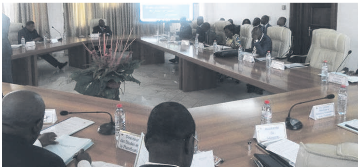
Des participants à la réunion du comité des réformes

nique pour dématérialiser et automatiser la collecte des recettes de timbre. L'étude de faisabilité est déjà finalisée de même que le cahier de charges. D'autres réformes sont également en cours d'exécution, cependant, mieux avancées, notamment l'interconnexion des services des impôts et des douanes. Les travaux de l'extension se font à partir des centres de Brazzaville et de Pointe-Noire. Le projet est jugé primordial par les partenaires du Congo, dont la Banque mondiale, qui en assure la facilitation. Enfin, un nouveau site de formation est même créé pour initier les cadres à