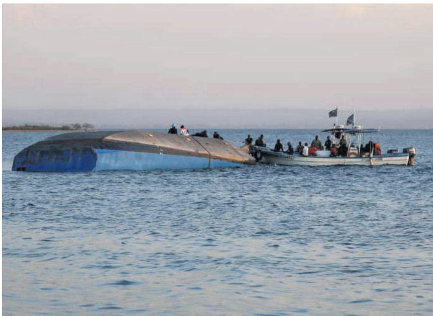
Le nombre de morts a été revu à la hausse