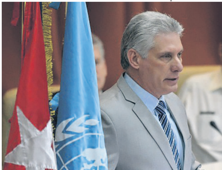
Le président Miguel Diaz-Canel

La Havane souhaite avoir avec Washington « une relation civilisée malgré des différences idéologiques », a-t-il insisté. Mais le gouvernement du président Donald Trump, qui a imposé un sérieux coup de frein au rapprochement engagé fin 2014, est « une administration avec