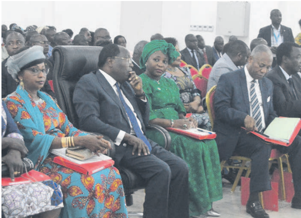
Les membres du gouvernement et les partenaires suivant les exposés des experts (Adiac)

Les experts en santé publique, avec l'appui des partenaires dont l'Organisation mondiale