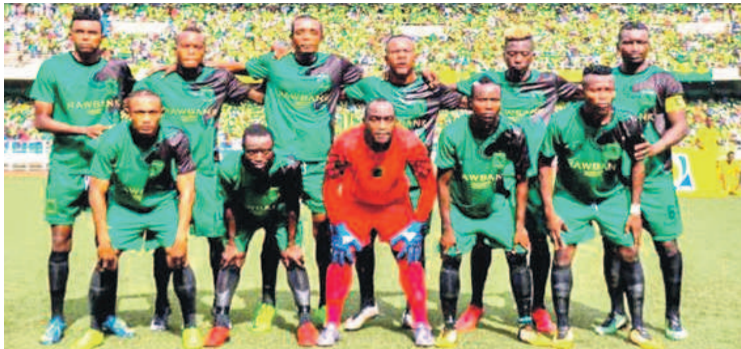
V.Club sera aux prises avec Al Masr en demi-finale de la Coupe de la Confédération