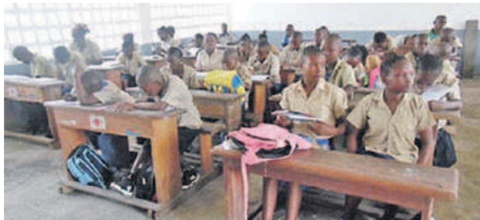
La rentrée scolaire réussie de 2016-2017

Les difficultés financières et l'ouverture d'autres établissements dans les mêmes blocs sont évoquées pour expliquer le peu d'engouement des parents à inscrire leurs enfants dans les écoles privées. « Cette année, les choses sont très moroses car à la veille de la rentrée scolaire 2017-2018, dans notre établissement, de la maternelle jusqu'au collège, on sentait l'engouement des parents qui défilaient pour des inscriptions et réinscriptions. Nous avons pris l'initiative de faire du porte-à-porte pour nos anciens élèves, mais hélas ! ces derniers évoquent des difficultés financières », s'est indigné le surveillant général d'un complexe scolaire dans le quartier La Base, dans le premier arrondissement Eme-