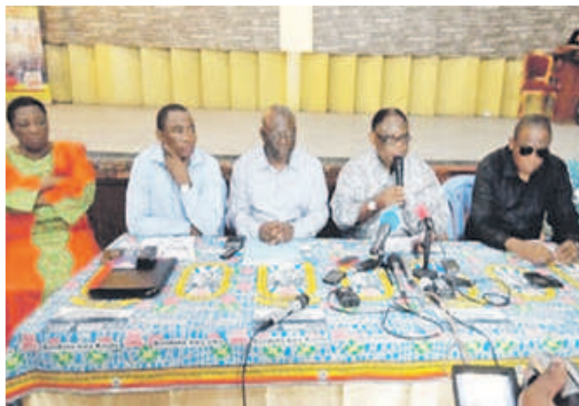
Les membres du CLC, lors de la conférence de presse

C'est ainsi qu'au cours de son point de presse, le CLC a mis en garde la Céni pour l'organisation des élections réellement crédibles, le 23 décembre. Les laïcs catholiques ont, en effet, relevé deux conditions indispensables pour la tenue de bons scrutins.