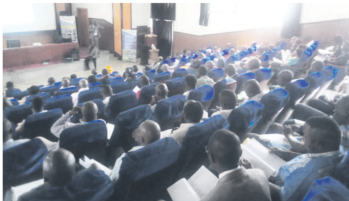
Les participants à l'atelier de sensibilisation

Ce mécanisme d'assistance financière s'adresse à trois types d'acteurs : les groupes de producteurs, les micros, petites et moyennes entreprises, ainsi que les autochtones. Ils doivent surtout intervenir