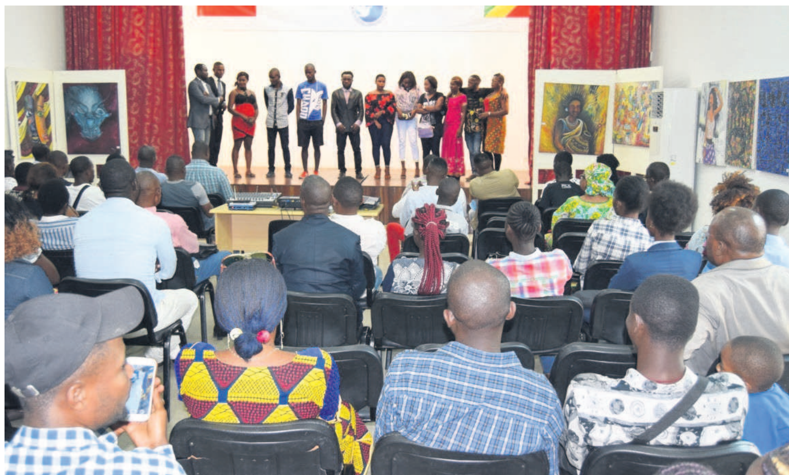
Les acteurs et cinéastes congolais posant après la projection

Ces deux films congolais sont une production du Club Kongo Movie, un groupe de cinéma qui a vu le jour à Brazzaville, en octobre 2017, par le collectif des jeunes congolais motivés et enthousiastes. Le Club Kongo Movie produit ses