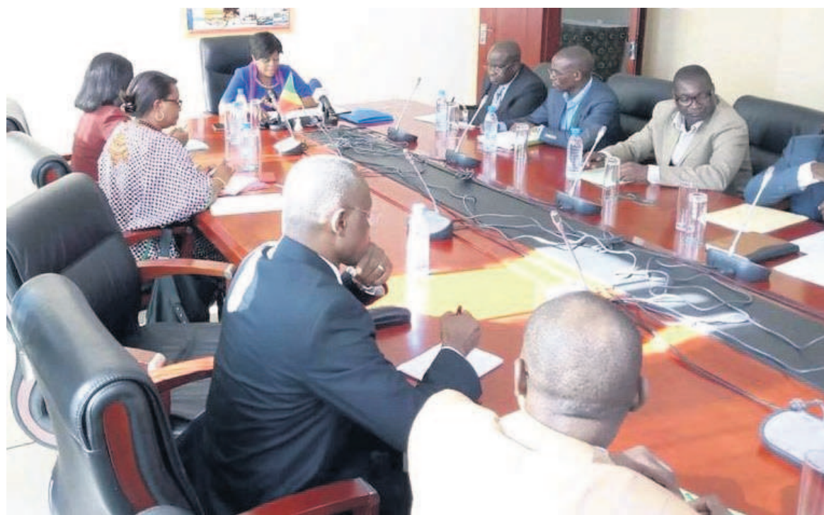
Une vue des participants

La concertation vise, entre autres, à informer un plus large public du