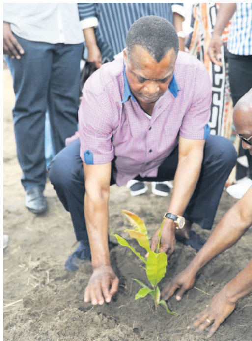
Denis Sassou N'Guesso plantant un arbre sur le site du village Okondo

Comme chaque 6 novembre de l'année, le président de la République qui séjourne à Oyo, dans le département de la Cuvette, a planté un arbre sur le site de cinq hectares du village Okondo, à Obouya.