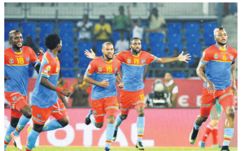
Les Léopards célébrant un but

Le sélectionneur national a dévoilé, le 5 novembre, via le site officiel de la Fédération congolaise de football association, une liste de vingt-quatre joueurs retenus pour le match de la cinquième journée du groupe G des éliminatoires de la Coupe d'Afrique des nations (CAN) Cameroun 2019. La RDC affrontera le Congo, le 18 novembre, au stade