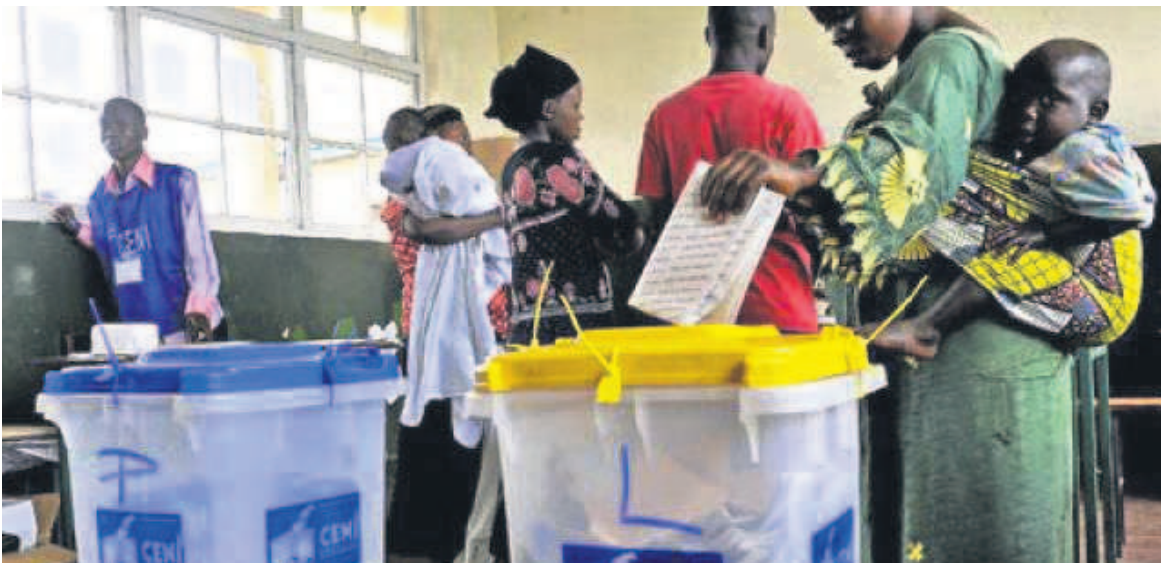
Des électeurs dans un bureau de vote

L'accréditation des témoins, observateurs et journalistes débute demain sur toute l'étendue du pays, conformément au calendrier de la Céni. À la veille du démarrage de cette opération importante, plusieurs partis politiques tardent encore à finaliser les listes de leurs témoins, avec le risque d'aller au-delà du délai imparti par la Centrale électorale.