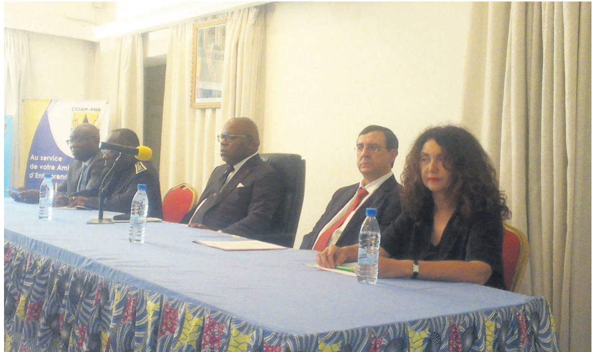
La tribune à l'ouverture du forum

Édifiant l'assistance sur la campagne d'orientation de nouveaux