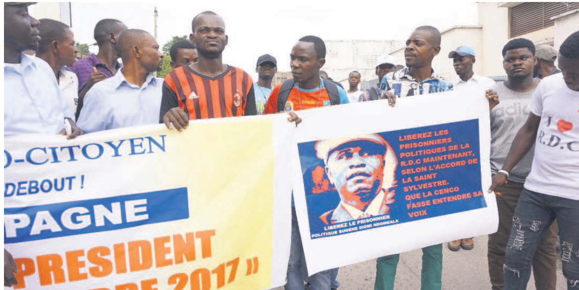
Les jeunes d'un mouvement citoyen, lors d'une manifestation devant l'ambassade des Etats-Unis en RDC

Des membres de Vigilance citoyenne (Vici) sont détenus au parquet de grande instance de Kalamu, à Kinshasa, où ils ont été transférés par la police qui les avait interpellés, le 1er novembre, au marché Gambela, à Kasa-Vubu.