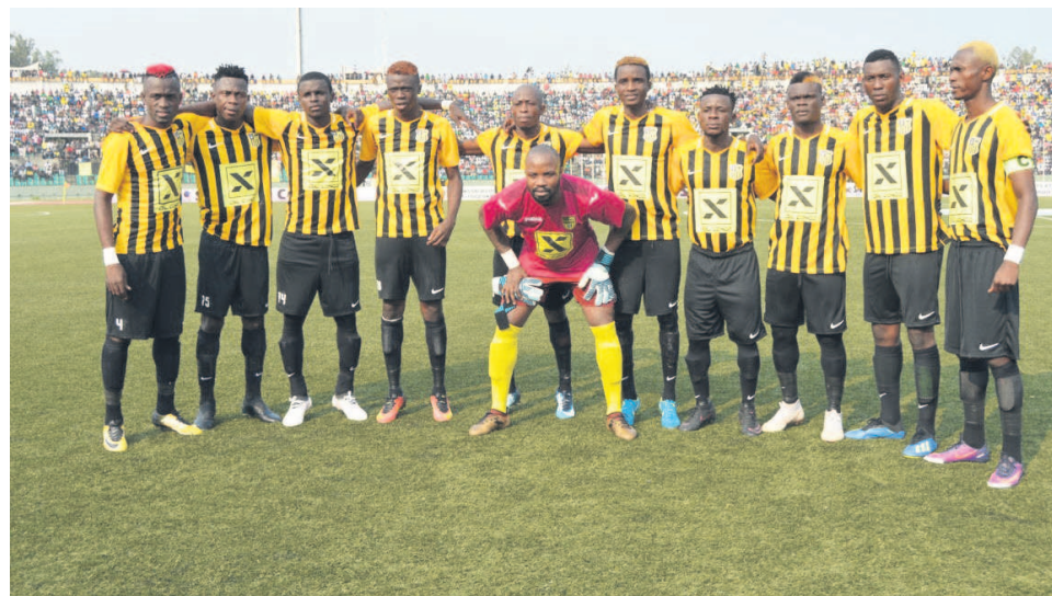
L'AS Otohô et les Diabes noirs attendent de connaître leurs adversaires

Le tirage au sort des tours préliminaires des deux compétitions de la Confédération africaine de football (Caf) pour le compte de la saison 2018-2019, initialement prévu le 3 novembre à Rabat, au Maroc, a été reporté. « Suite à la réunion du Comité d'organisation des interclubs à Rabat, le samedi 3 novembre, et en raison de la spécificité de cette saison transitoire due aux changements de dates des interclubs de la Confédération africaine de football, une décision sera prise par le Comité d'urgence de la CAF dans un délai court