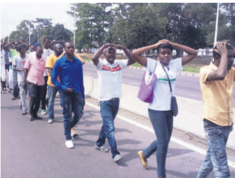
Des manifestants sur le boulevard Triomphal à Kinshasa

Dix-huit mouvements prodémocratie ont exigé, dans un communiqué du 5 novembre, la libération de dix-sept de leurs militants dont trois filles, membres du mouvement Vigilance citoyenne. Ils ont été interpellés, le 1er novembre, au marché Gambela, pendant qu'ils menaient une campagne d'éducation civique de la population en rapport avec les élections du 23 décembre. Ces militants arrêtés ont été transférés et détenus au parquet de grande instance de Kalamu. Appelant à une action urgente, l'ONG de défense des droits de l'homme Acaj a décrié cette « culture des violations des droits de l'homme qui s'installe en RDC » et s'insurge en même temps contre l'impunité dont jouissent les auteurs de ces transgressions. Page 2