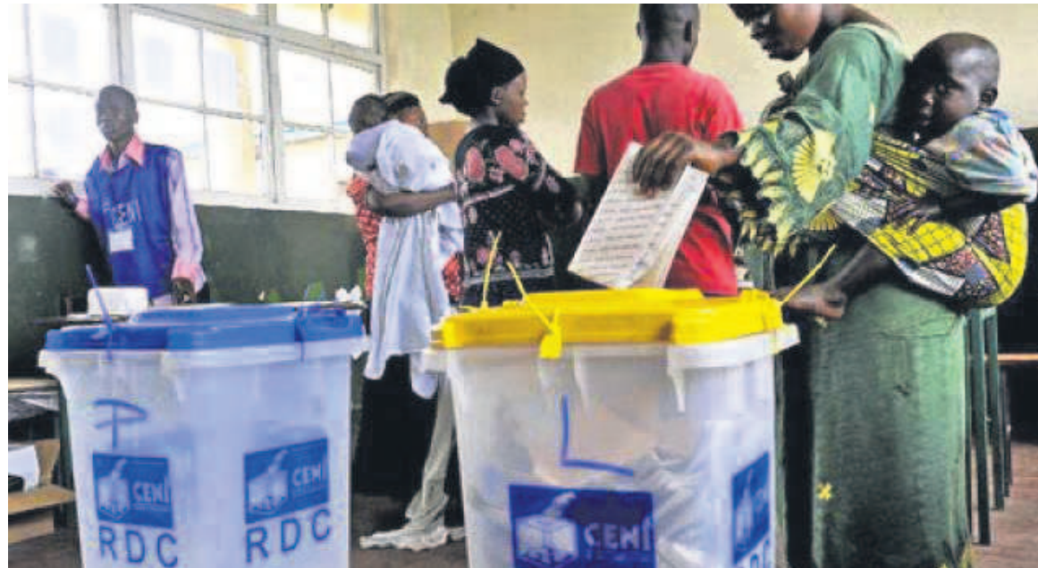
Des électeurs dans un bureau de vote

Le processus électoral poursuit son bonhomme de chemin. Après la dernière livraison gouvernementale à la Céni composée d'équipements et autres engins affectés au déploiement des kits électoraux, l'heure est à l'accréditation des témoins, observateurs et journalistes qui auront la charge de s'assurer du bon déroulement des scrutins. Il s'agit d'une étape importante censée créditer l'ensemble du processus et lui garantir une issue heureuse en termes de fiabilité des résultats. Conformément au calendrier de la Céni, tout commence le 8 novembre. Les partis et regroupements politiques seront les premiers à ouvrir le bal en accréditant leurs témoins jusqu'au 22 novembre. Mais, il est constaté qu'à la veille du démarrage de cette opération, plusieurs partis politiques tardent encore à finaliser les listes de leurs témoins, avec le