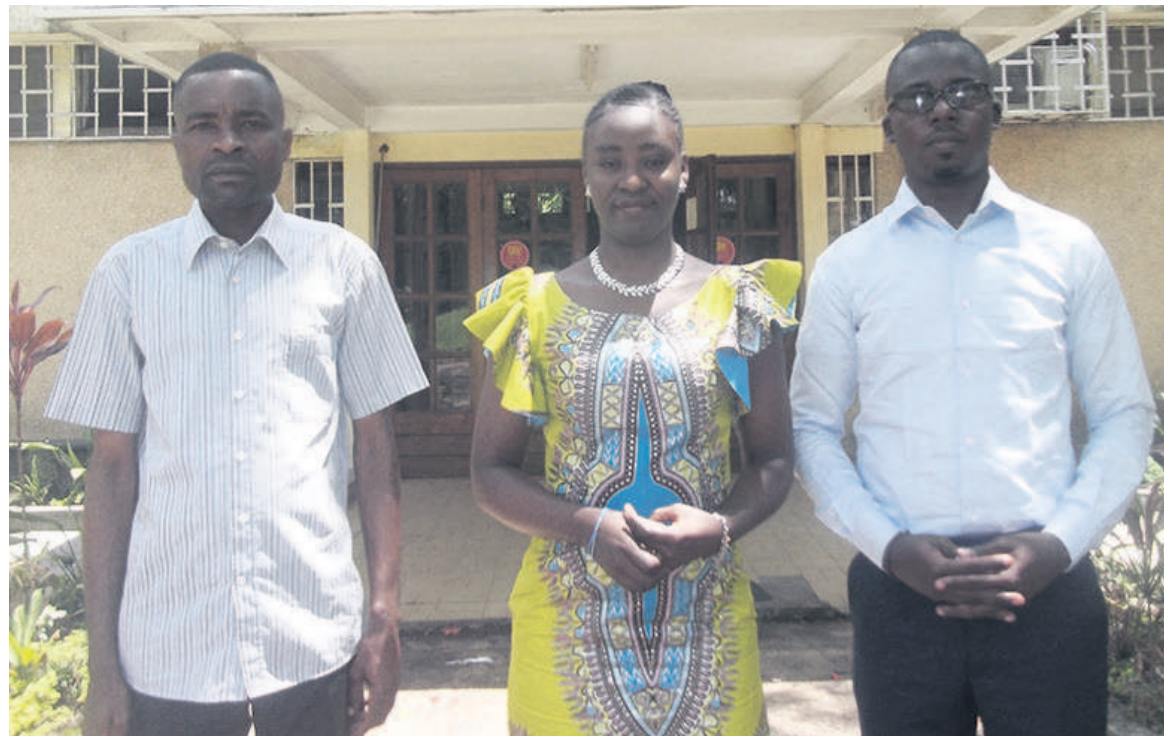
Les trois diplômés de l'Université d'Abomey Calavi de CotonouDr