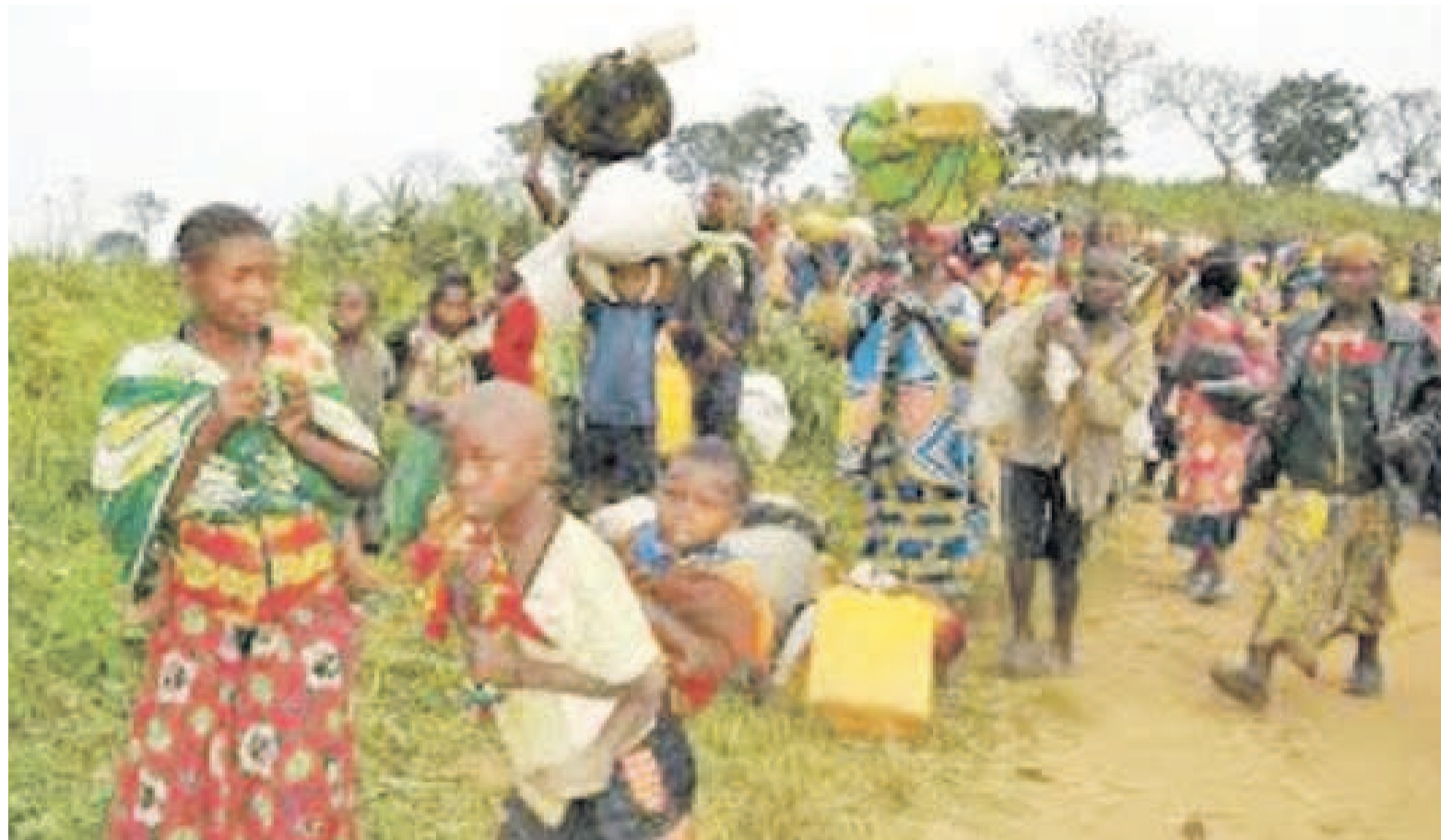
Les enfants, premières victimes des conflits armés et autres catastrophes naturelles

Quant au second plan, Réponse régionale pour les réfugiés congolais, il cible sept cent quarante-trois millions de dollars qui devraient permettre de répondre aux besoins les plus urgents. Ces besoins comprennent la protection, l'eau et l'assainissement, la