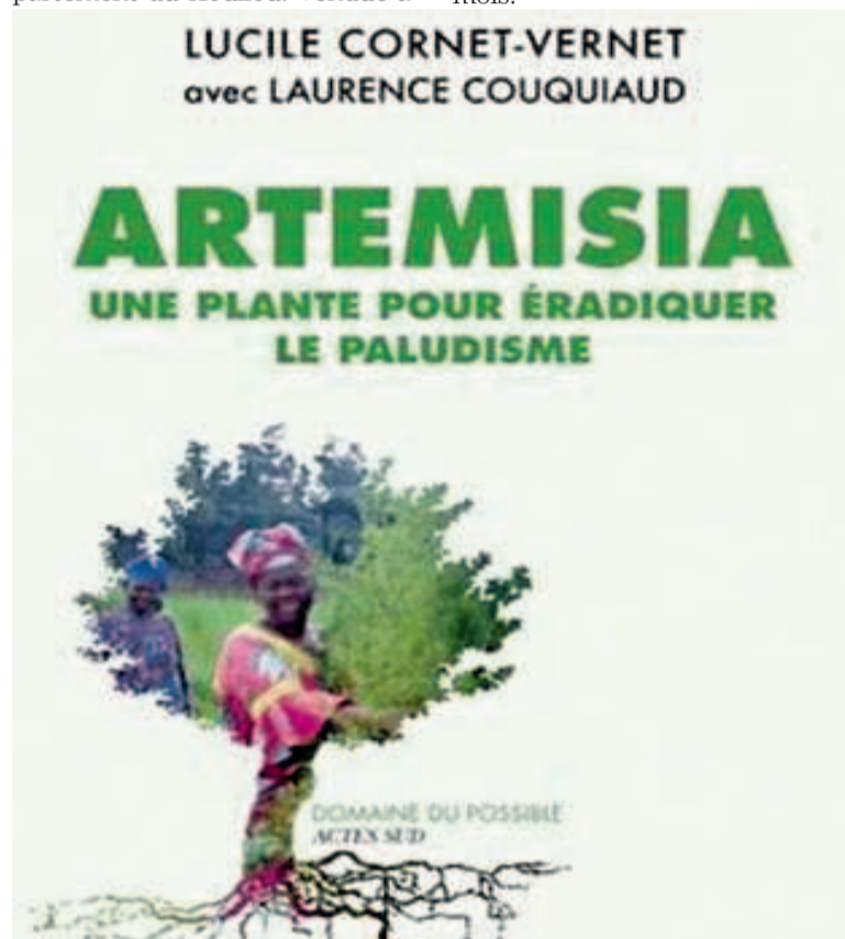
Le livre sur l'artémisia