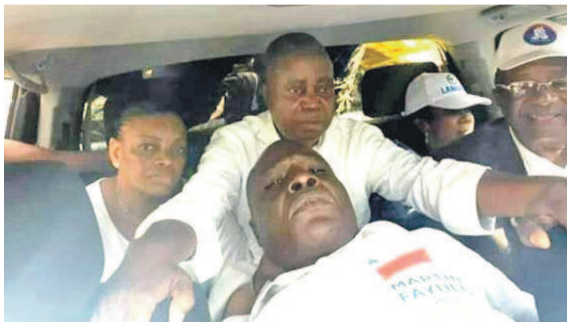
Martin Fayulu à l'étape de Kalemie