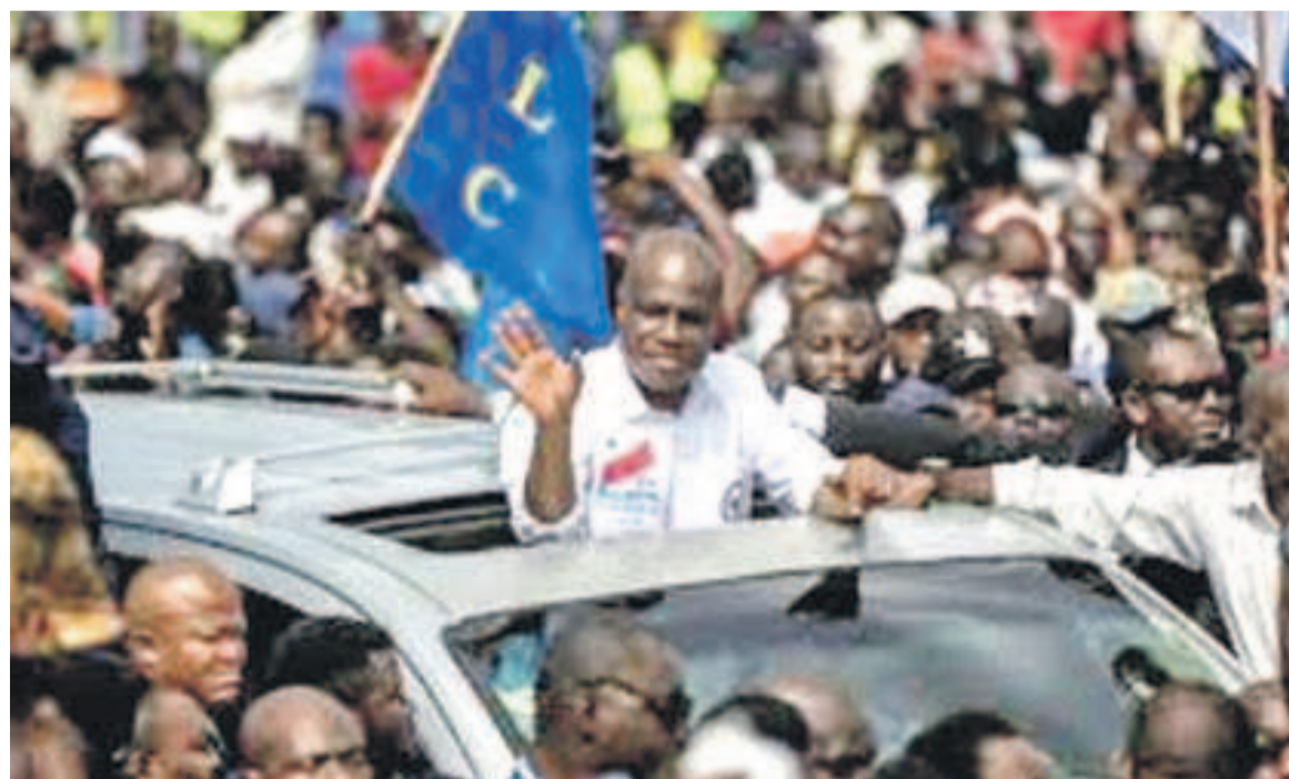
Martin Fayulu saluant la foule

Faisant le monitoring des violences survenues, le 11 décembre à Lubumbashi, dans le Haut-Katanga, relatives à l'attaque du cortège du candidat de Lamuka à la présidentielle, Martin Fayulu, l'Association congolaise pour l'accès à la justice (Acaj) donne le bilan provisoire de deux morts par balles réelles parmi les partisans de ce candidat. L'association de défense des droits de l'homme a indiqué également qu'un policier a été grièvement blessé et se trouve dans un état critique, quarante-trois civils sont blessés dont quinze par