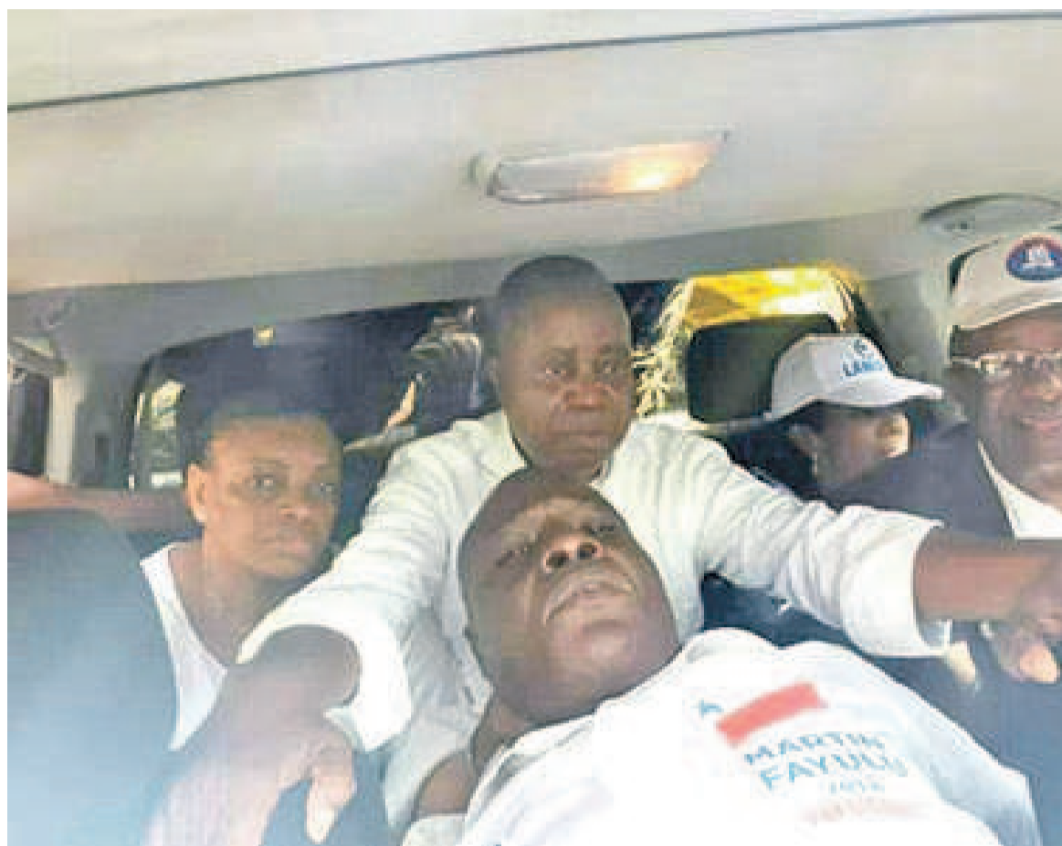
Martin Fayulu à l'étape de Kalemie

Dans la foulée, le cortège de Martin Fayulu, qu'encadrait une foule d'inconditionnels intrépides, obligé d'emprunter un autre itinéraire sur ordre de la police, a éprouvé bien de peine à se mouvoir dans les rues de la capitale cuprifère, pour la plu-