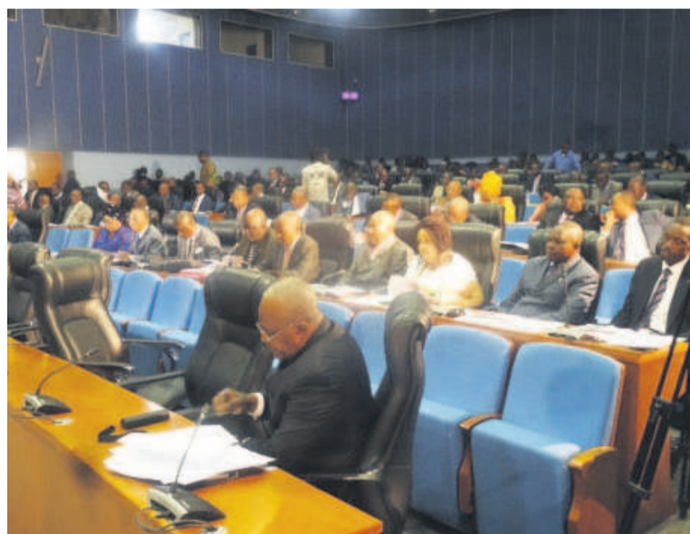
Les membres de l'alliance