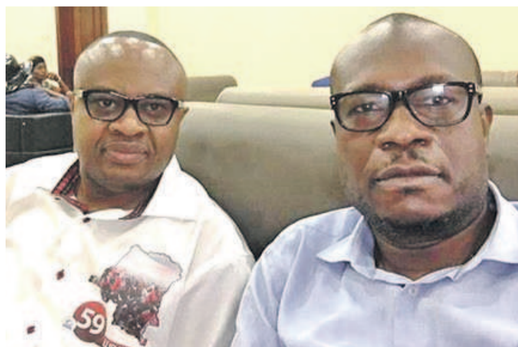
André-Claudel Lubaya et Delly Sessanga