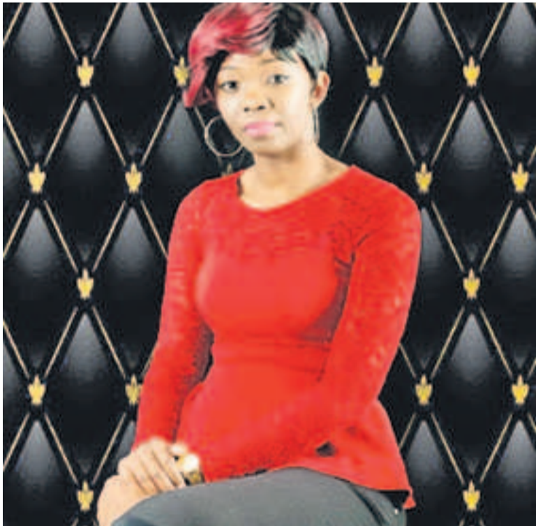
Christelle Fleur

L'auteure compositrice et interprète s'apprête à mettre sur le marché du disque son premier album gospel avec des mélodies et rythmes qui magnifient la bonté divine.