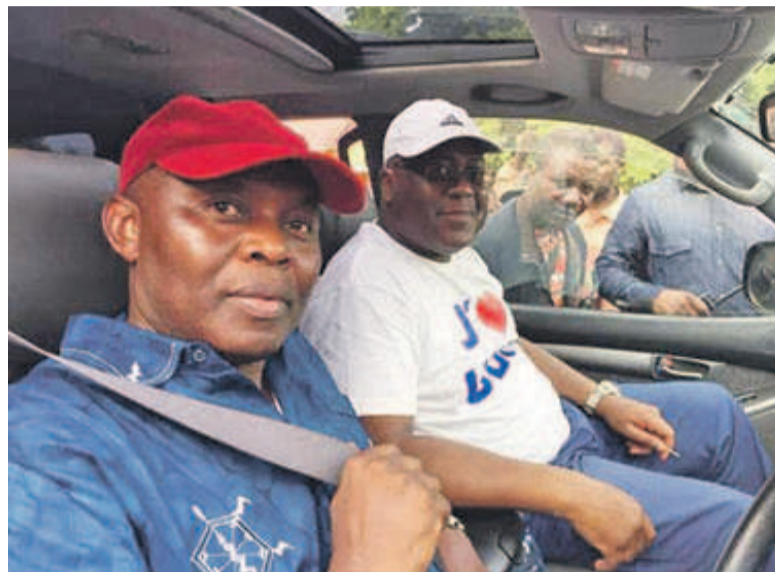
Vital Kamerhe et Félix Tshisekedi, cap sur Butembo après Beni

Le candidat président de la coalition « Cap pour le changement » a indiqué, au cours d'un meeting, que les militants de la coalition soutenant Martin Fayulu ne veulent pas d'élections et veulent les perturber.