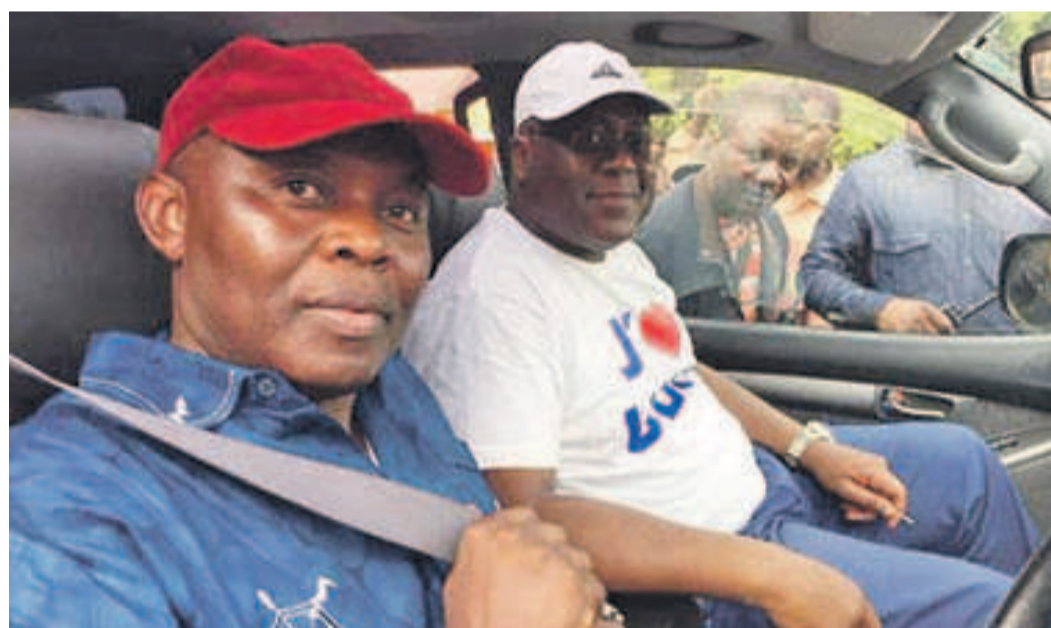
Vital Kamerhe et Félix Tshisekedi, cap sur Butembo après Beni