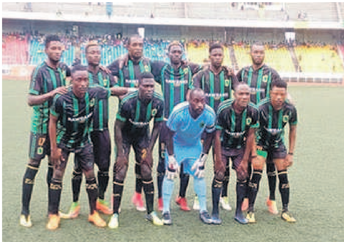
V.Club avant d'affronter Nyuki, le 11 décembre