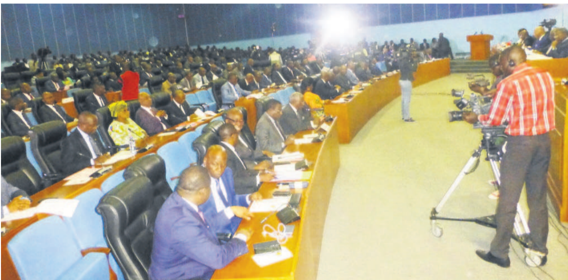
Une vue de la salle pendant le débat