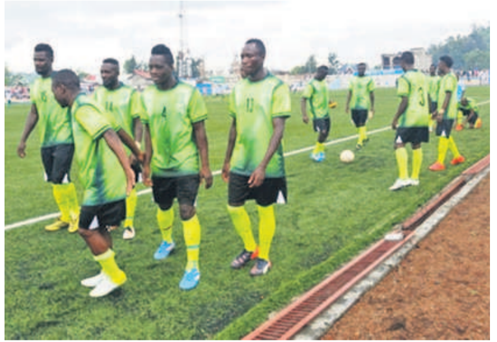
L'AS Nyuki de Butembo battue à Kinshasa par Petro Atletico de Luanda

Après avoir éliminé Al Shendi de Soudan au tour préliminaire, le club de Butembo du Nord-Kivu a trébuché à domicile, le 14 décembre, face à l'expérimentée équipe angolaise