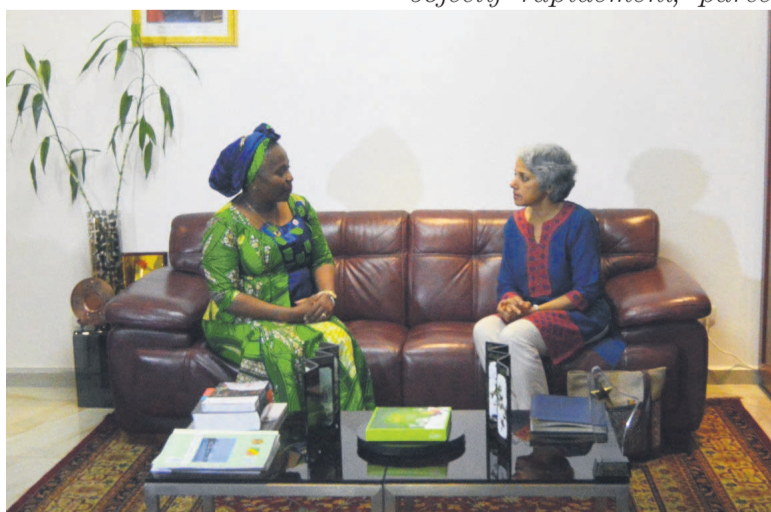
La ministre de la Santé et la directrice générale adjointe de l'OMS en tête-à-tête