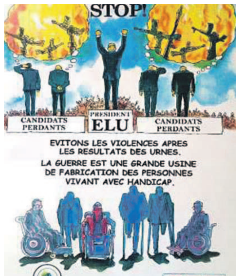
L'affiche de la campagne

Publiée par la direction de la recherche et des statistiques sous la responsabilité de la Direction générale de la politique monétaire et des opérations bancaires, le dernier bulletin d'informations statistiques économiques de la Banque centrale du Congo indique une variation en dents de scie de la production de ciment gris dans la partie ouest de la RDC.