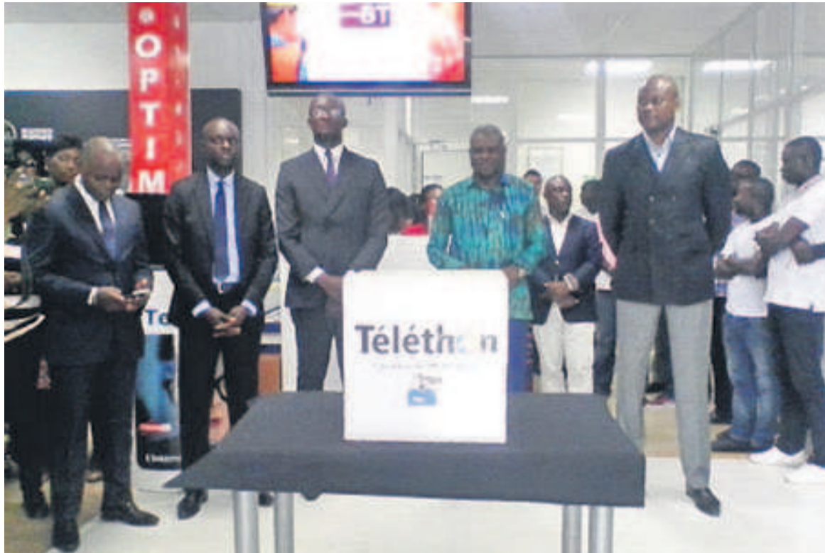
Le ministre Anatole Collinet Makosso, au centre, pendant la cérémonie.