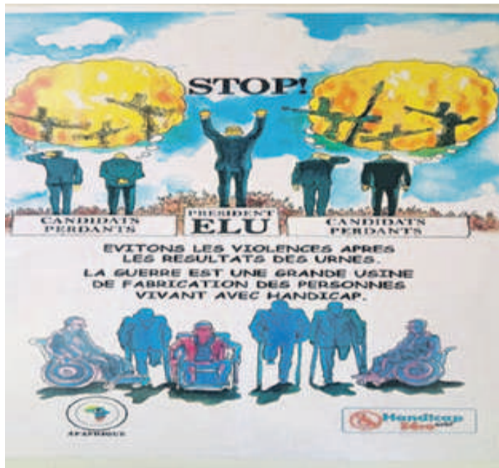
L'affiche de la campagne

Au cours de cette cérémonie, une exposition vente a été organisée. Ce qui a permis au coordonnateur de la cellule chargée des personnes vulnérables et vivant avec handicap d'apprécier leur esprit inventif et créatif à travers les œuvres