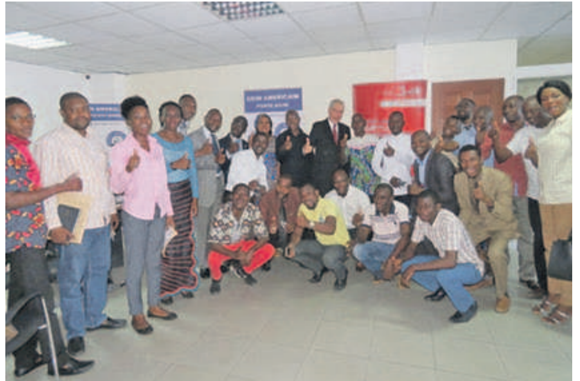
La photo de famille après la cérémonie

Des boîtes contenant des enseignements d'anglais ont été remises aux clubs des deux départements, le 13 décembre, par l'ambassadeur extraordinaire et plénipotentiaire des Etats-Unis d'Amérique au Congo, Todd P. Haskell, dans le cadre du nouveau programme de son ambassade.