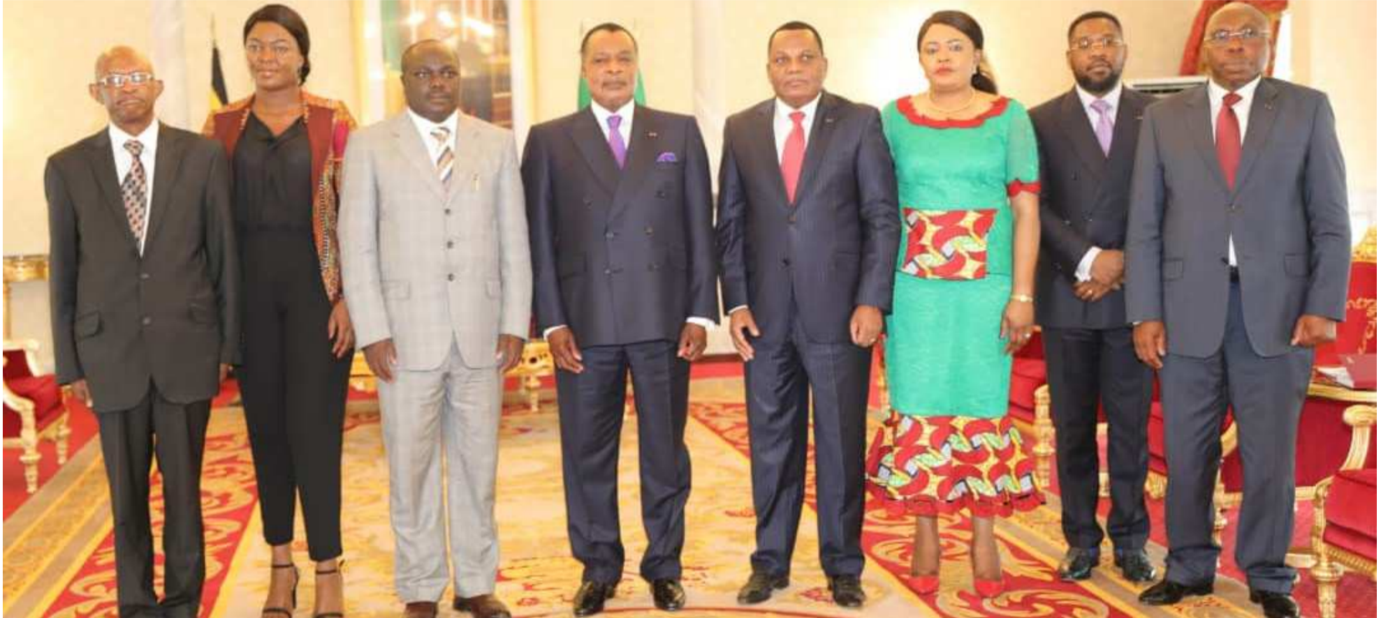
L'ambassadeur de l'Ouganda (à droite) posant avec le président de la République