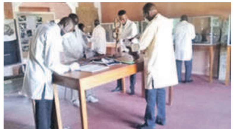
Les participants lors de la formation/Adiac patrimoine sur le continent.

Créée en 1998, l'EPA a pour vocation de former des spécialistes du patrimoine culturel. Elle découle du programme de prévention mis en place à la suite du constat sur l'insuffisance des