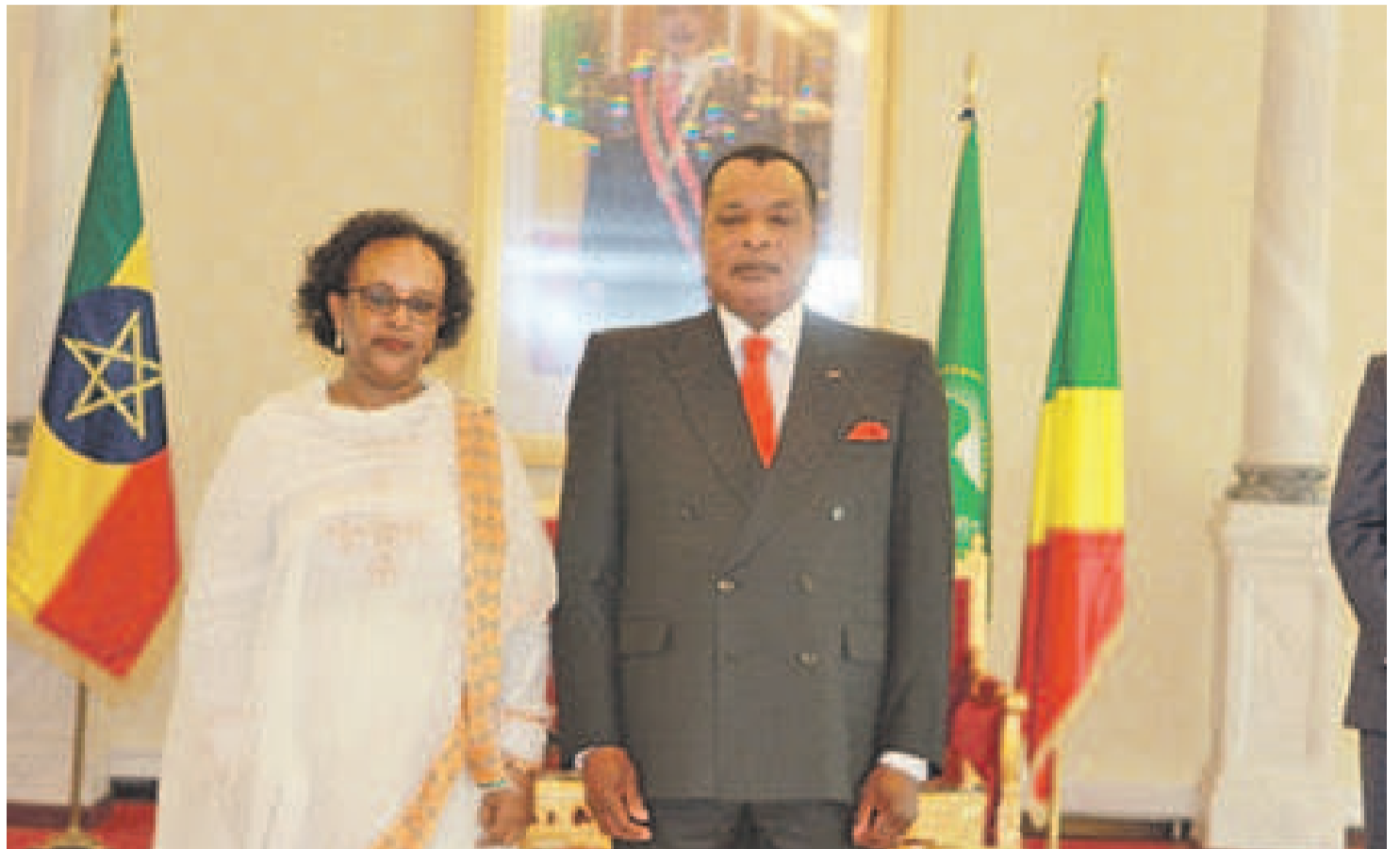
L'ambassadrice d'Éthiopie posant avec le chef de l'État congolais