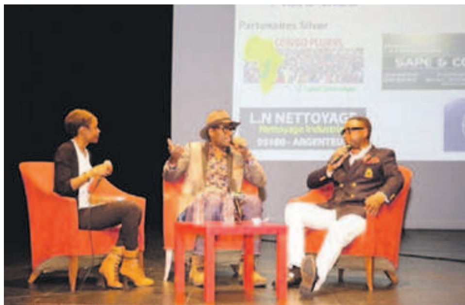
Ziana TV-Causerie-débat avec Alain Mabanckou lors du lancement officiel de la chaîne au cœur des diasporas