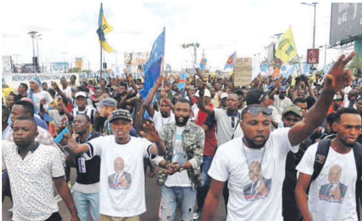
Effervescence des militants durant la campagne électorale