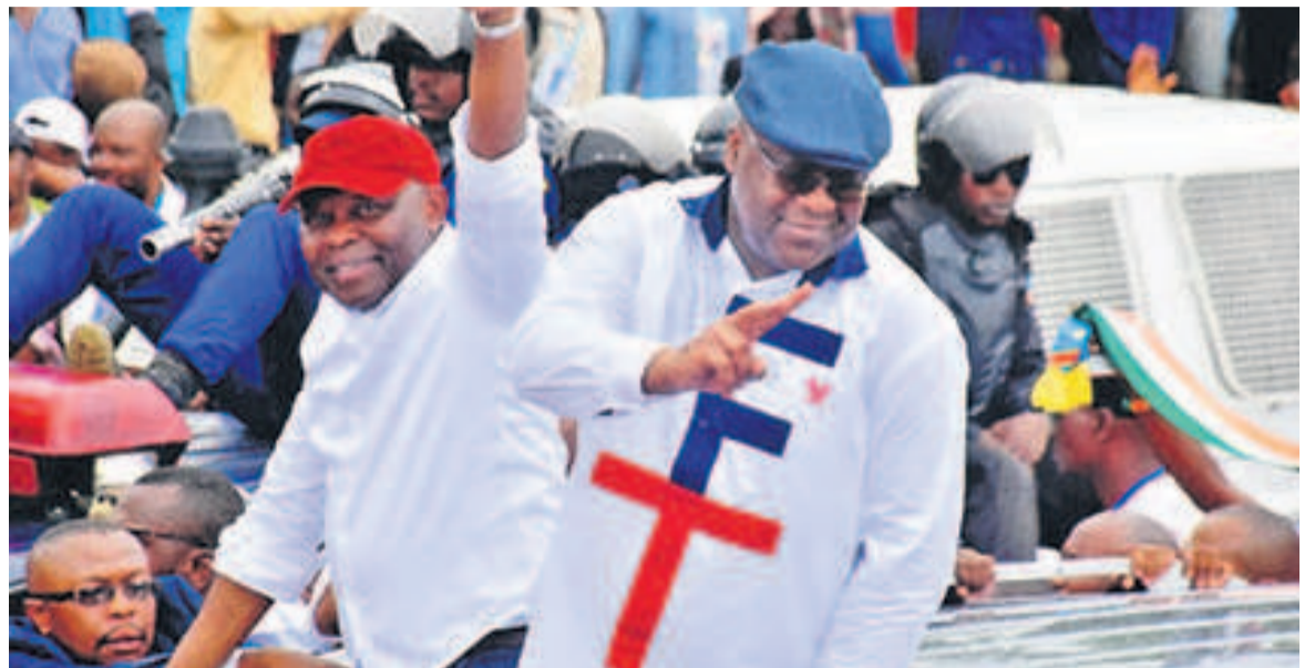
Félix Tshisekedi et Vital Kamerhe

Dans la province de Kongo central où il est arrivé le 17 décembre pour sa campagne électorale, le candidat n°20 à la magistrature suprême, qu'accompagnait son colistier Vital Kamerhe, est monté au créneau pour conditionner les esprits par rapport à son ascension à la tête du pays.