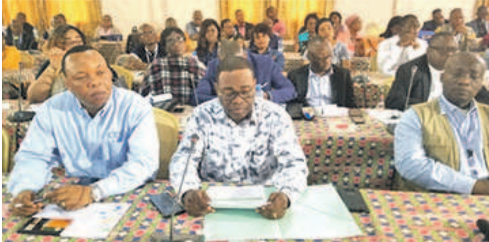
Le Pr Onésime Kukatula lors du lancement de la formation au centre Caritas à Kinshasa

Le stage lancé simultanément à Kinshasa et dans les grandes villes du pays concerne les cadres et agents permanents de la Commission électorale nationale indépendante (Céni) mais aussi 7486 temporaires.