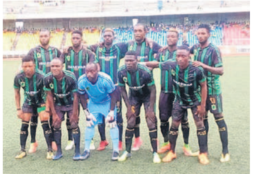
V.Club de Kinshasa

Dans d'autres rencontres des seizièmes de finale de cette C1 africaine, le 15 décembre, Wydad Casablanca (Maroc) a dominé Diaraf (Sénégal) par deux buts à zéro, JS Souara (Algérie) a eu raison de d'Ittihad Tanger (Maroc) par la même marque. Orlando Pirates (Afrique du Sud) a été accroché à domicile par African Stars (Namibie) par zéro but partout, et Nkana FC (Zambie) s'est offert Simba SC (Tanzanie) par deux buts à un. Al Ahly (Égypte) a disposé de Jimma Aba Jifar (Éthiopie) par deux buts à zéro, CS Constantine (Algérie) est venu à bout de Vipers (Ouganda) par un but à zéro. Stade Malien (Mali) a