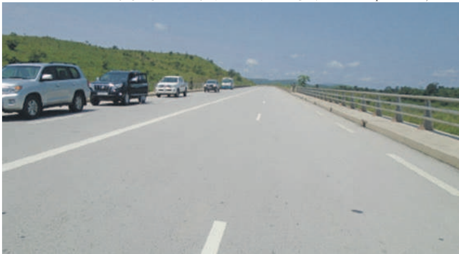
Une vue de la route lourde

Il faut rappeler que la route Brazzaville-Pointe-Noire, longue de 553 kilomètres, a été construite en deux phases. Le premier tronçon Pointe-Noire-Dolisie, long de 160 kilomètres, dont les travaux ont été lancés en octobre 2007, a été inauguré le 22 décembre 2011 par le président de la République. Le second, qui va de Dolisie à Brazzaville, sur une distance de 375 kilomètres, a été mis en service le premier mars 2016. Initialement prévu pour un trafic T3, soit trois mille véhicules par jour, au regard de l'afflux constaté, le trafic a doublé en passant à six mille véhicules par jour. Pour garantir sa dureté, sa chaussée a été renforcée.