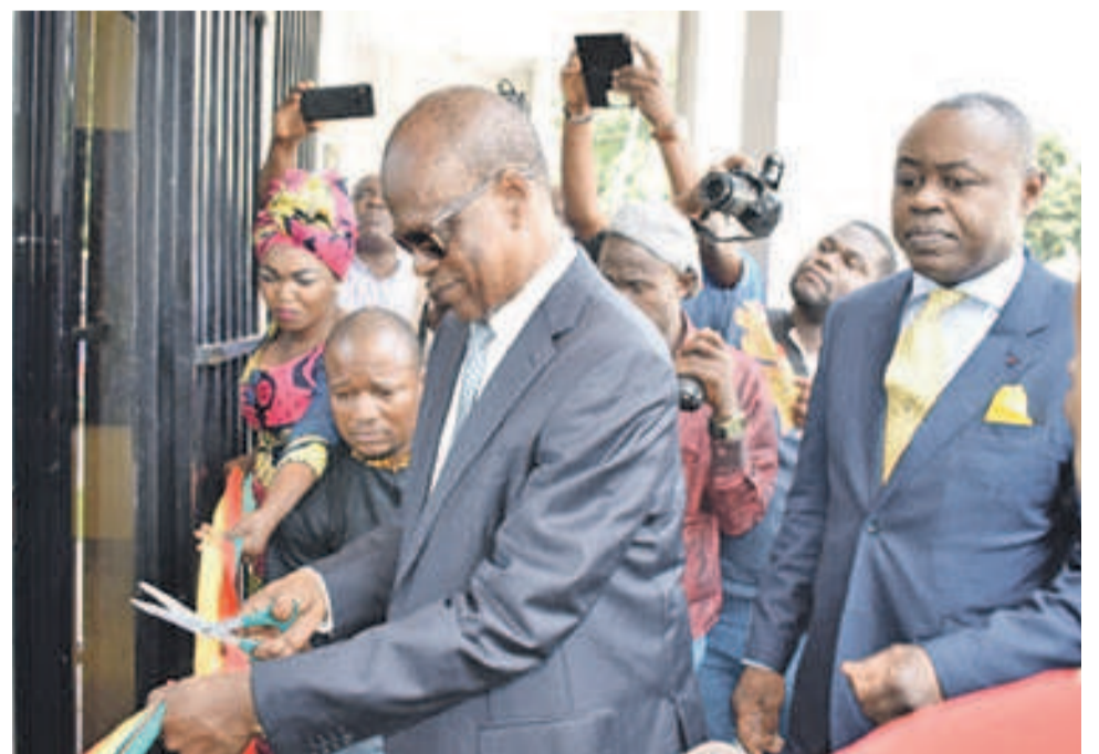
Le ministre d'Etat, ministre de l'Agriculture, de l'élevage et de la pêche, coupant le ruban symbolique