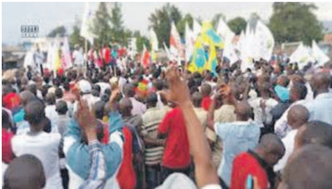
La foule lors d'une activité de campagne électorale en RDC

électorales de la Céni. LONG note, en effet, qu'en date du 13 septembre dernier, Olivier Kamitatu, de la coalition Lamuka, avait, par un tweet, déclaré que « si Corneille Nangaa s'entête à imposer ses cent mille machines à tricher, il devra déployer derrière chacune d'elles un policier pour qu'elles ne soient pas cassées, détruites, brûlées ! Les Congolais vont se charger de faire respecter la loi électorale ». Pour sa part, le 8 décembre, le gouverneur de la province du Haut-Katanga, Pande Kapopo, a appelé, lors d'une réunion avec les jeunes du FCC, à la violence pour imposer la candidature de Ramazani Shadary, garantissant l'impunité à tout jeune qui serait arrêté pour avoir usé de la violence contre les membres des partis politiques de l'opposition. À en croire cette association, le gouverneur Pande a déclaré : « Le Haut Katanga est le fief de Ramazani Shadary, on ne permettra à personne d'autre de venir faire la loi ici. Nous sommes prêts à prendre tous les risques pour Shadary. Nous sommes au pou-