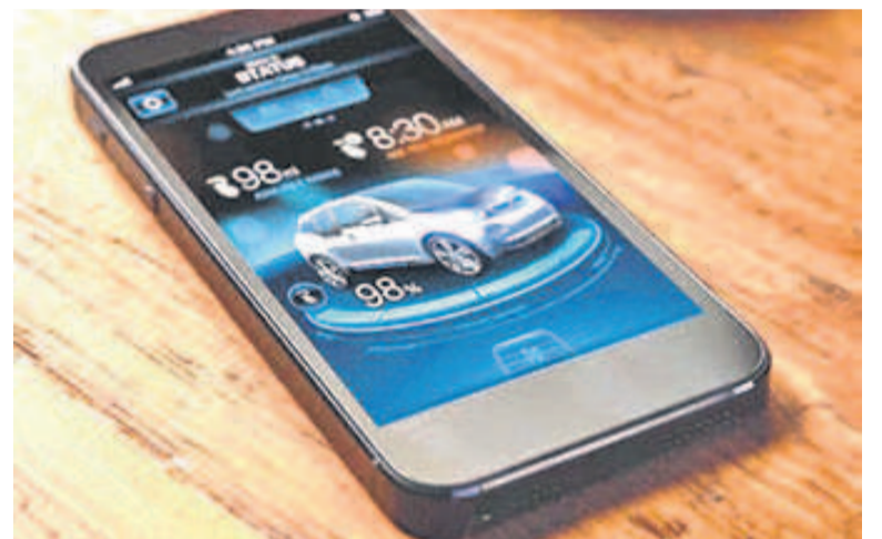
Un téléphone mobile

L'entrée en vigueur du décret sur la mise en place d'un « nouveau système de contrôle des flux téléphoniques des réseaux des opérateurs des télécommunications en RDC » va occasionner la hausse des prix des appels, SMS et Internet de l'ordre de 60%, estiment des experts. C'est la société African general investment limited qui a été choisie pour « contrôler de manière exclusive, durable et permanente pendant dix ans, le volume d'appels locaux, le volume des SMS émis et reçus, le volume des data déclaré par les opérateurs Télécoms pour mieux répondre aux exigences de la RDC ».