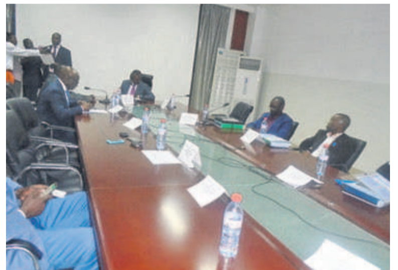
Les membres du Comité de direction lors de la réunion du 19 décembre

« Le budget 2019 accorde la priorité à la formation du personnel, notamment le renforcement de capacité des agents, parce que nous sommes en train de préparer une grande mission d'audit de l'Organisation internationale de l'aviation civile, prévue en juin 2019. Il nous faut donc