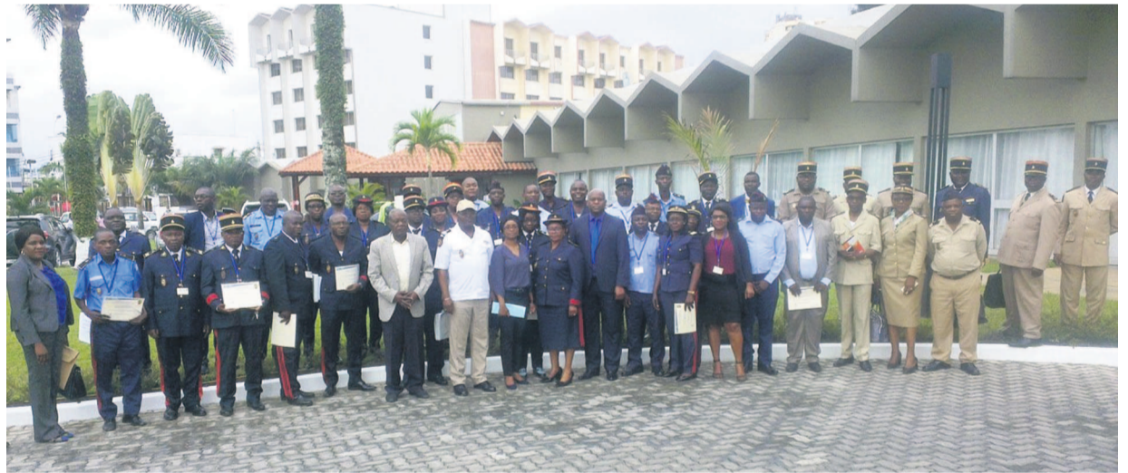
La photo de famille des séminaristes à Elais