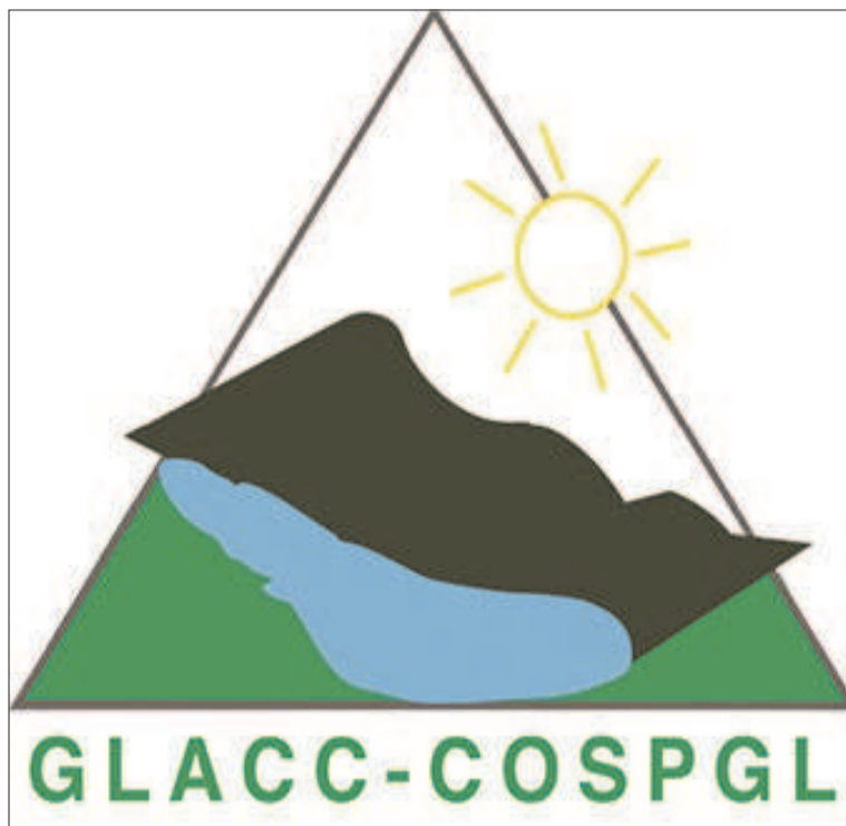
Le logo de COSPGL RN adopté par les membres

Ce plan contient les objectifs généraux définis par les membres de la coalition et l'ensemble d'actions et de stratégies qui faciliteront l'acquisition, l'utilisation et la répartition des ressources. « Il oriente les dirigeants vers les objectifs à atteindre et a pour objectif principal de faire les choix stratégiques en orientant les décisions en fonction des conséquences prévisibles sans éliminer le risque », a expliqué le réseau COSPGL dans son communiqué. Ce plan, selon le réseau, est également un