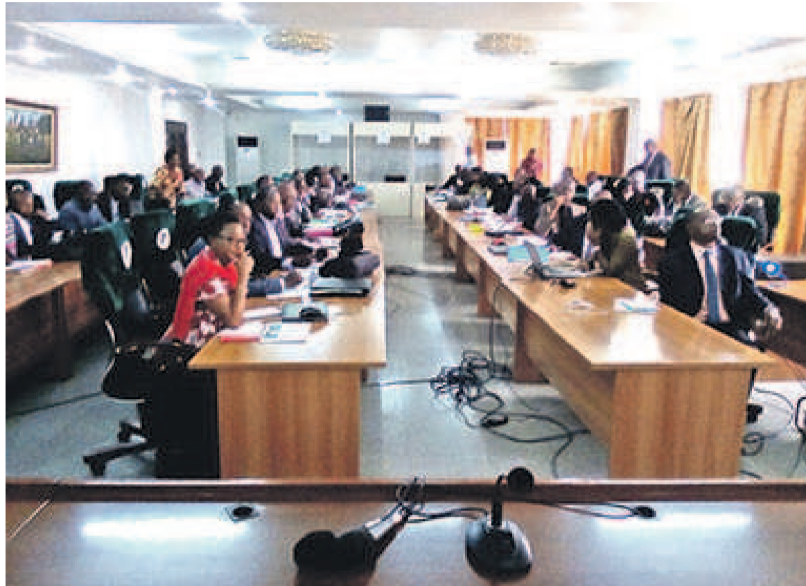
Une vue des participants

En effet, le programme pays consiste à aider le Congo à consolider les progrès accomplis au cours du cycle passé et à remédier aux lacunes qui subsistent en matière de pauvreté et d'inégalité. Ce programme est également destiné à soutenir les efforts du gouvernement décrits dans le PND qui prône un changement structurel de