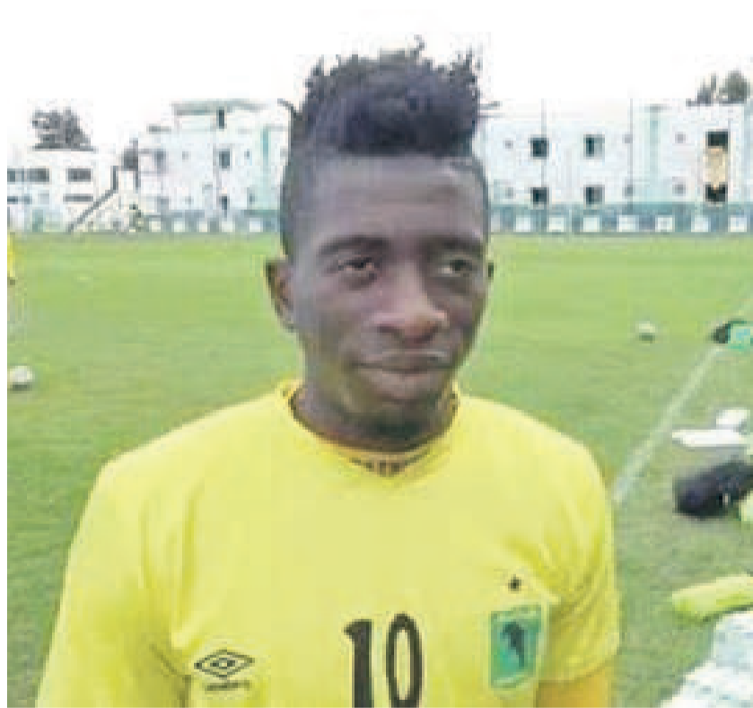
Makusu plait à Constantin en Algérie

Le mercato d'hiver est déjà ouvert et l'on parle des mouvements de transferts des Congolais.