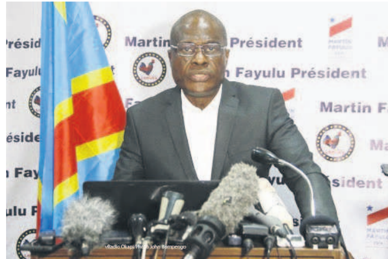
Martin Fayulu en conférence de presse

Le challenger de Félix Tshisekedi à la dernière présidentielle est loin de se résigner devant ce qu'il considère comme une usurpation de sa victoire. « Je sais que vous avez donné au total 80% des vos suffrages à toutes les forces de l'opposition. Ces voix sont celles du changement. J'en suis pleinement