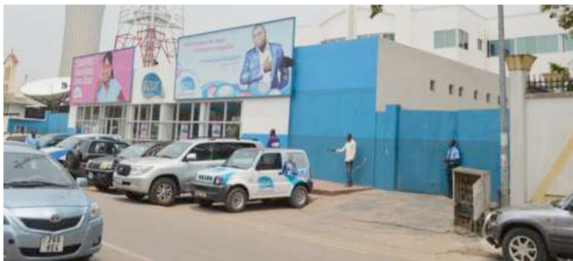
Le siège de la société à Brazzaville

Les employés de la société Equateur Télécom, qui opère au Congo sous la marque Azur Télécom, réclament, dans une déclaration officielle, le paiement de quatorze mois de salaires et exigent qu'une lumière soit faite sur « la liquidation clandestine » de l'immeuble abritant le siège de la société à Brazzaville.