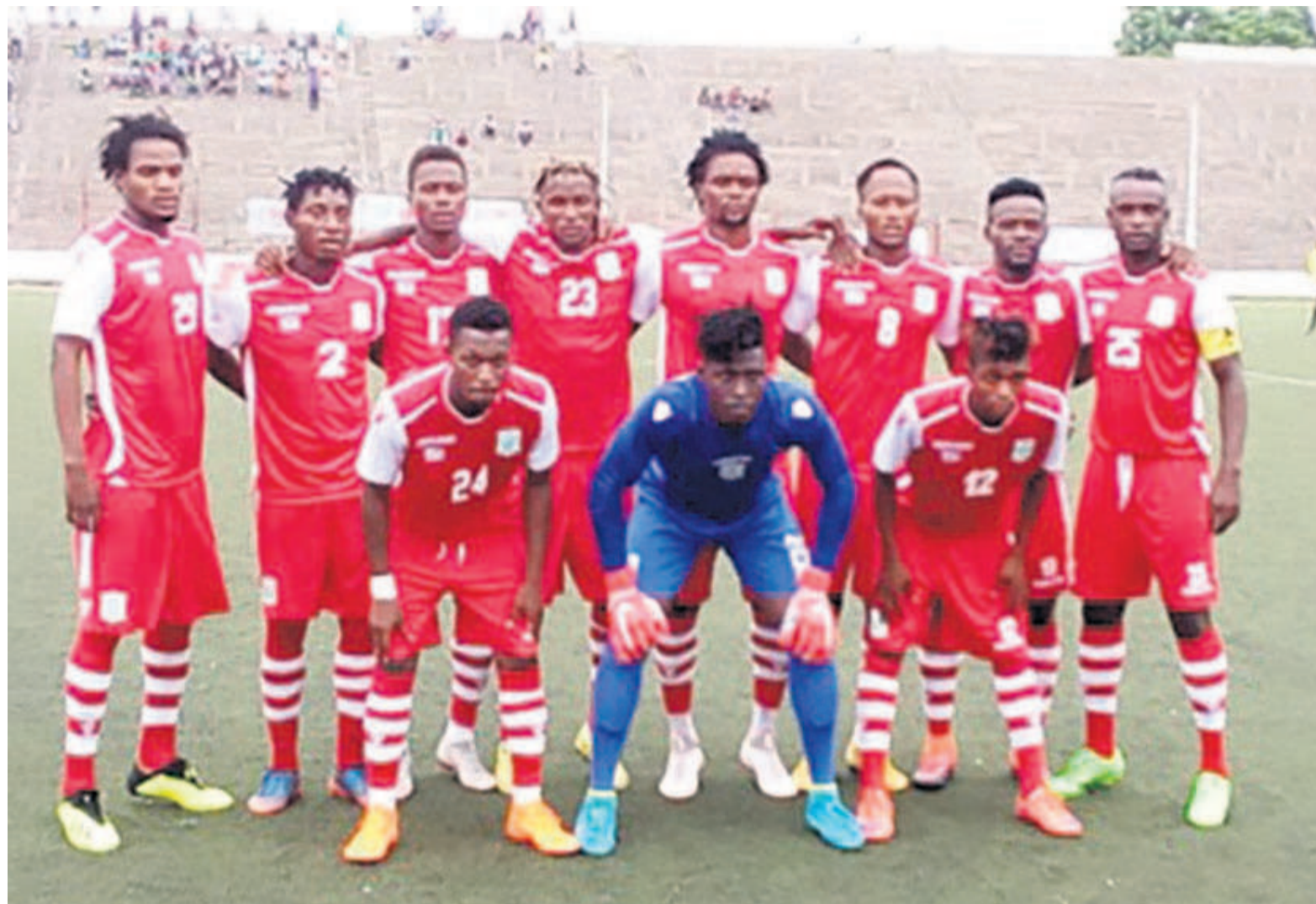
DCMP de Kinshasa

Cette victoire a servi de baume aux Immaculés, après la précédente défaite d'un but à deux subie à Lubumbashi devant le CS Don Bosco. Avec ce succès, DCMP se replace à la troisième place au classement avec trente points, juste devant le CS Don Bosco qui en compte vingt-sept. Maniema Union, pour sa part, occupe la quatrième place avec