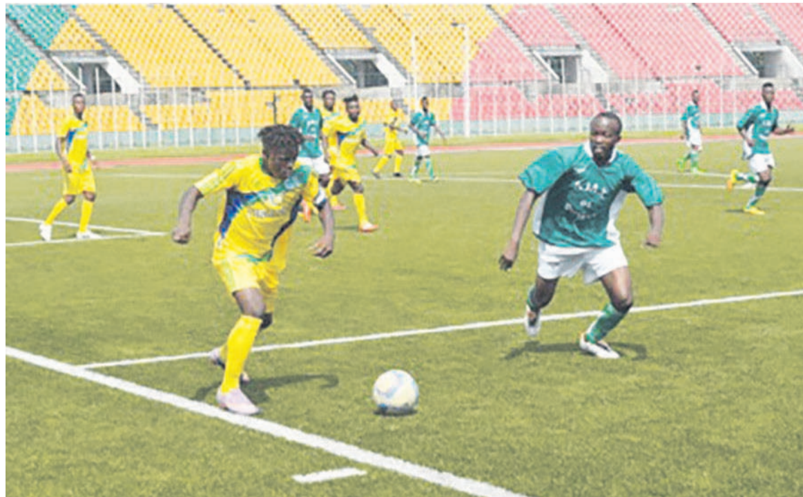
Une rencontre de ligue 2

Le coup d'envoi du championnat national ligue 2 sera donné le 4 février. La compétition se disputera en cinq zones. La zone A, Brazzaville-Pool, va regrouper vingt clubs. La zone B, Pointe-Noire/Kouilou, aura douze équipes. Les départements du Niari constituent la zone C avec huit équipes. Les Plateaux et les deux Cuvette (zone D) auront six équipes. La Sangha et la Likouala présenteront quatre équipes.