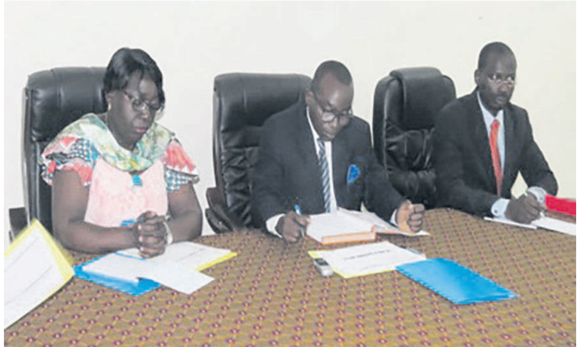
Le présidium des travaux