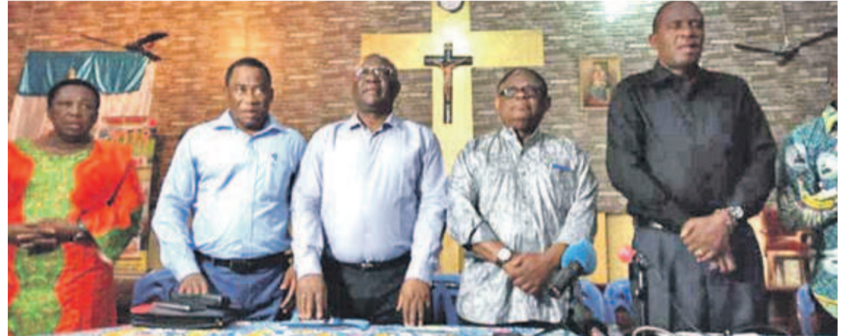
Les responsables du CLC pendant la messe

Les principaux membres de l'organisation ont tous pris part, le 29 janvier, à la messe de suffrage dite en mémoire des victimes de la répression des marches organisées le 31 décembre 2017 et le 25 janvier 2018 en protestation contre un troisième mandat de Joseph Kabila.