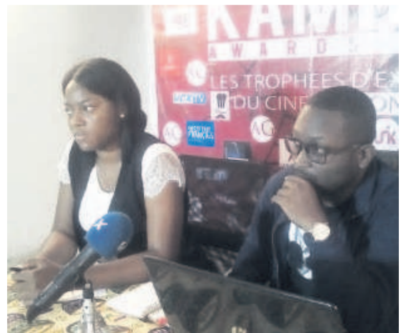
Une vue des organisateurs lors de la conférence de presse

Le comité d'organisation des Kamba's vise à mettre en valeur les différents acteurs œuvrant dans le domaine du cinéma congolais tout en stimulant la