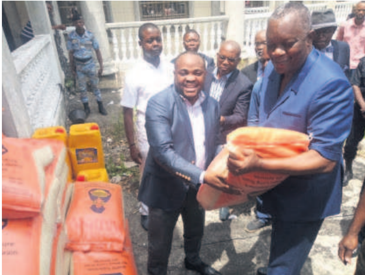
Remise d'un échantillon de don de vivres au préfet (Adiac)

Quant aux groupes traditionnels, dans chaque district du Pool, il y en a au moins cinq par district. Dès lors, a-t-il dit, il revient aux organi-