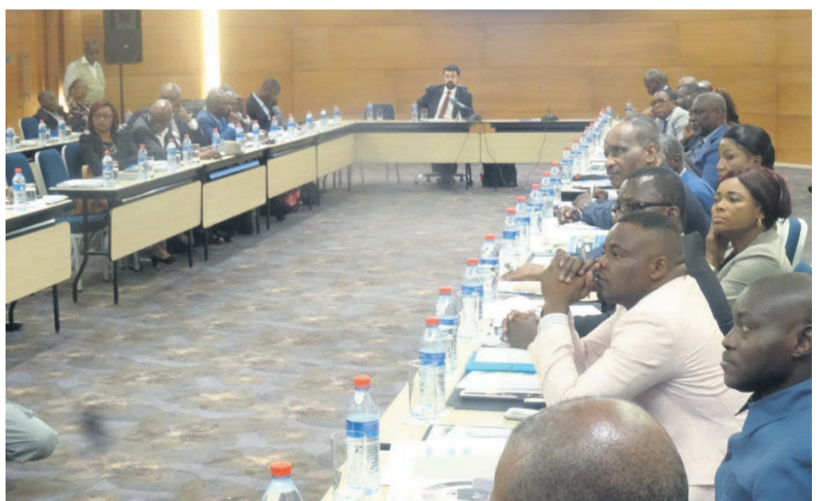
Les participants à la séance d'échange

« Le gouvernement devrait jouer un rôle actif dans l'élimination des obstacles à l'investissement