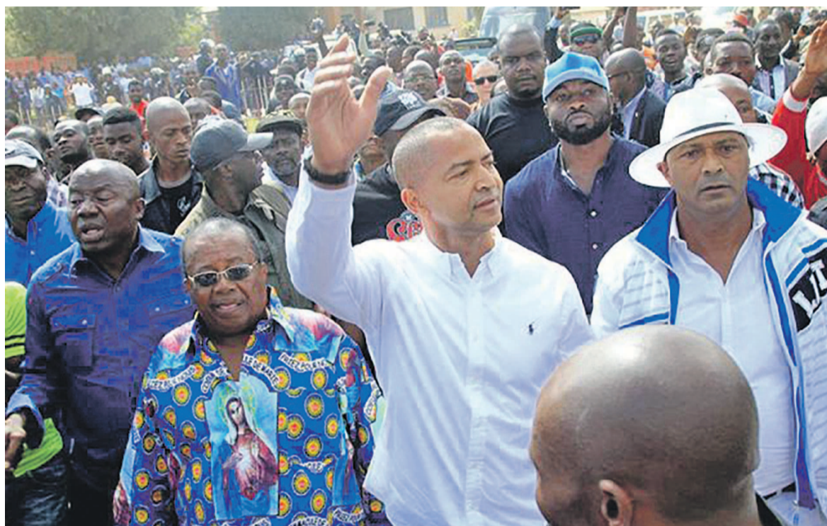
Moïse Katumbi au milieu de ses partisans