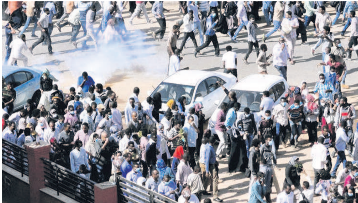
Des manifestants lors d'une manifestation, à Khartoum, le 25 décembre 2018

L'information émane du porte-parole du Kremlin, Dmitri Peskov, qui a confirmé, le 28 janvier, que « des instructeurs travaillent effectivement là-bas (...) depuis un certain temps ».