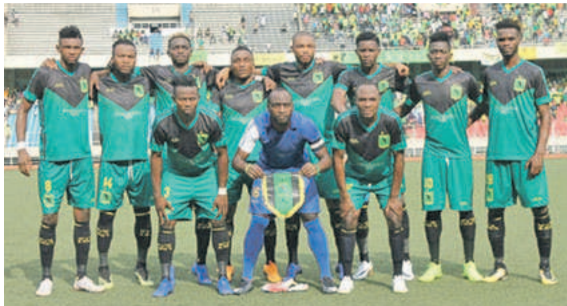
L'AS V.Club de Kinshasa