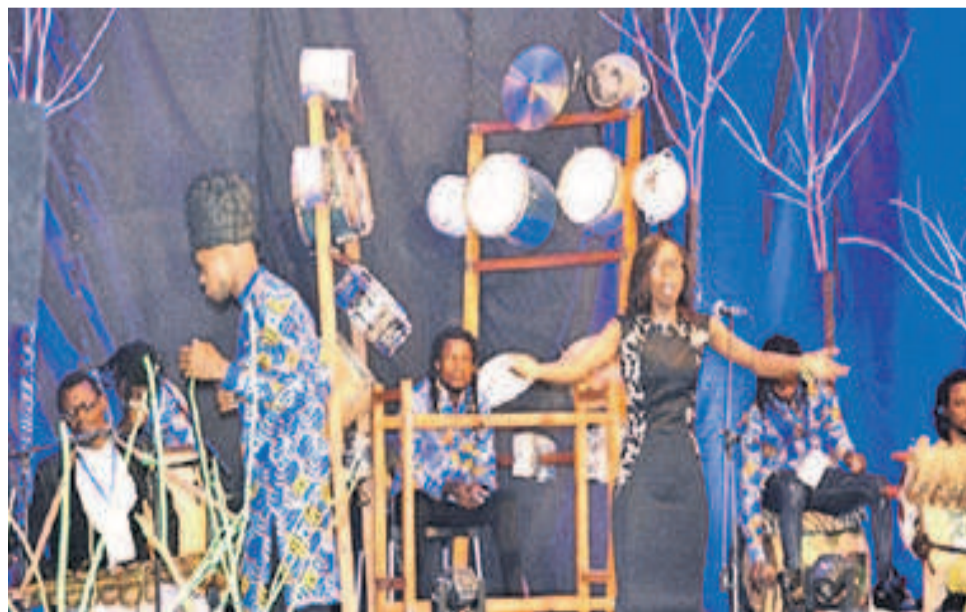
La première Nuit de l'Opéra au CWB

Festival itinérant, Opéra rumba se tiendra les 11 et 12 avril entre l'Institut français, la Halle de la Gombe et le Centre Wallonie-Bruxelles. L'événement précédé par la Nuit d'Opéra annonce déjà la couleur et, comme l'on peut bien s'en douter, sera de plus grande envergure. Du bref aperçu de la programmation livré au Courrier de Kinshasa par Clovis Makabu, il faut retenir qu'Opéra rumba mettra en vedette plus de deux cents artistes. « Seuls le piano et l'orchestre de chambre accompagneront les