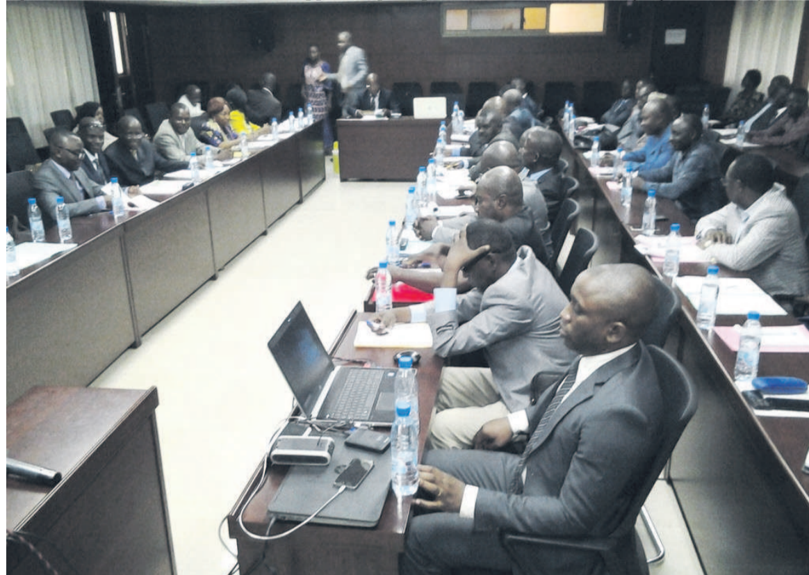
Une vue de la réunion préparatoire

Lancé en juillet dernier, le Pdac a pour objectifs d'améliorer la productivité des agriculteurs et l'accès aux marchés des groupes de producteurs et des micro, petites et moyennes entreprises agroindustrielles dans les zones sélectionnées, et d'apporter une assistance au gouvernement en cas de crise ou de situation d'urgence répondant aux critères d'admissibilité.