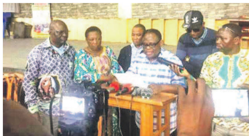
Lecture d'une déclaration par les membres du CLC à Kinshasa.

Les chefs laïcs catholiques étaient au centre des attentions au cours de la messe dite le 29 janvier, à Kinshasa, en mémoire des victimes de la répression des marches organisées le 31 décembre 2017 et le 25 janvier 2018. Treize mois après le lancement des actions initiées pour exiger l'alternance politique dans le pays, ils peuvent désormais s'afficher en public sans peur