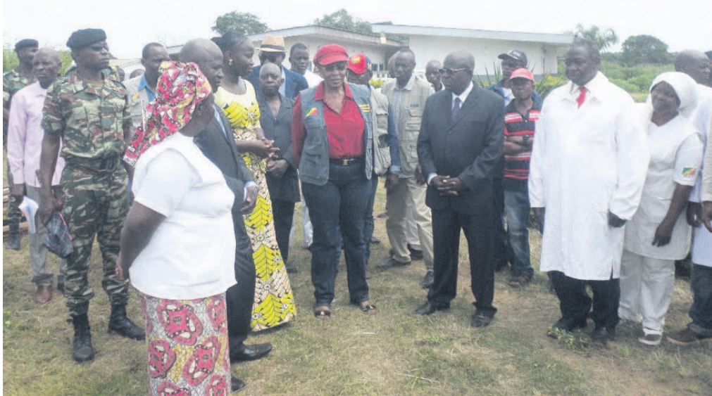
La ministre Antoinette Dinga-Dzondo présentant les matériaux de construction aux autorités locales/Adiac