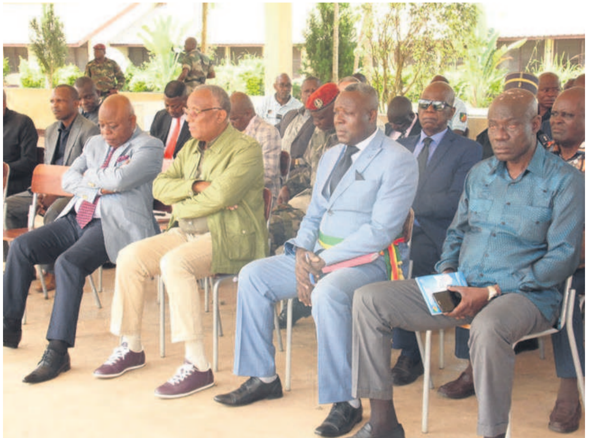
Le ministre et les autorités administratives pendant la réunion