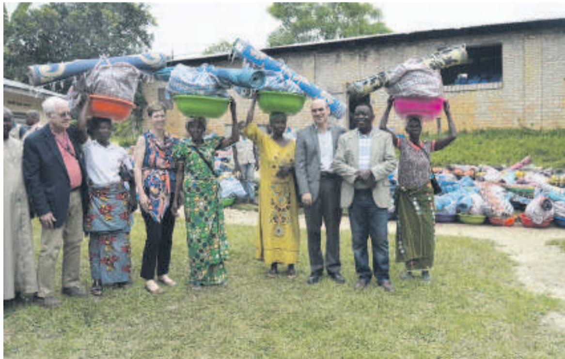
Les bénéficiaires et les donateurs (Adiac)