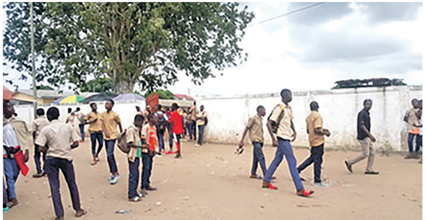
Une vue du collège Mbota Raffinerie.

Ces bandits opèrent souvent en l'absence du surveillant général dont ils suivent régulièrement les mouvements. Ils menacent les élèves avec des machettes et autres armes blanches et ravissent tout ce qui les intéresse (téléphones, sacs, etc.) et provoquent aussi des bagarres pour mieux les intimider. D'après les informations recueillies sur place, ces jeunes viennent généralement des quartiers Songolo et Tchiali. «Il y a des élèves de cette école qui habitent aussi ces quartiers. Et lorsqu'ils ont des conflits avec un membre de ce gang, les fameux champions les suivent jusqu'à leur école et sèment la terreur avec des machettes. Mais les élèves n'arrivent pas à les dénoncer de peur des représailles»,