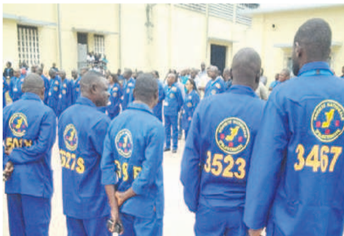
Des agents de la société E2C avec des tenues imprégnées du logo SNE/DR