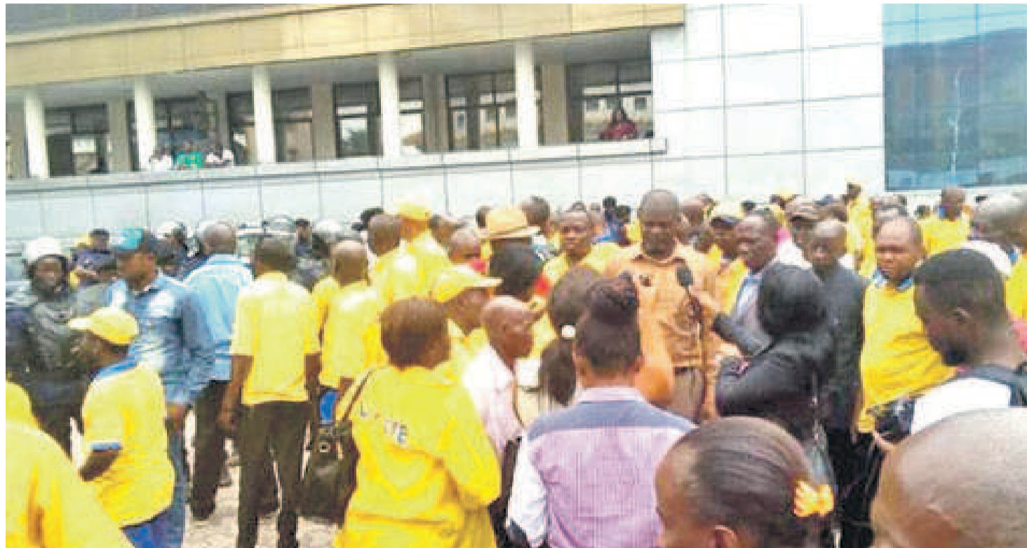
Des travailleurs manifestant devant le siège de l'entreprise

Cette fois-ci, la direction de l'entreprise entend se dédouaner vis-à-vis des travailleurs, en donnant progressivement satisfaction à leurs revendications. La paie sera lancée lundi à la banque où environ quatre cents agents se sont déjà faits enregistrés. Représentant le gouvernement à cette réunion, l'Inspection générale du travail a voulu que cette paie qui concerne uniquement le mois de novembre 2018 se fasse la