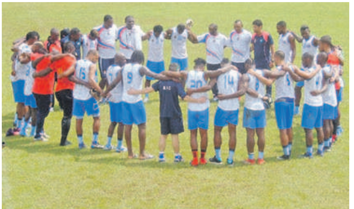
Les Léopards de la RDC

Selon la Fifa, la Coupe d'Asie des nations qui vient de s'achever avec le sacre du Qatar explique l'absence des pays africains dans le top 50 en février 2019. « La Coupe d'Asie est à l'origine de la très grande majorité des mouvements constatés dans cette première édition de 2019, tandis que le