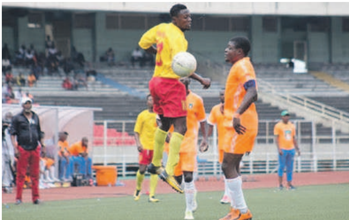
Phase de jeu du match entre Renaissance du Congo et Dragons/Bilima le 7 février 2019

Maniema Union a tué le match dès la première période, avec les trois buts. Cette victoire permet au club vert et noir de Kindu de grappiller un total de trente-deux points, confortant sa quatrième