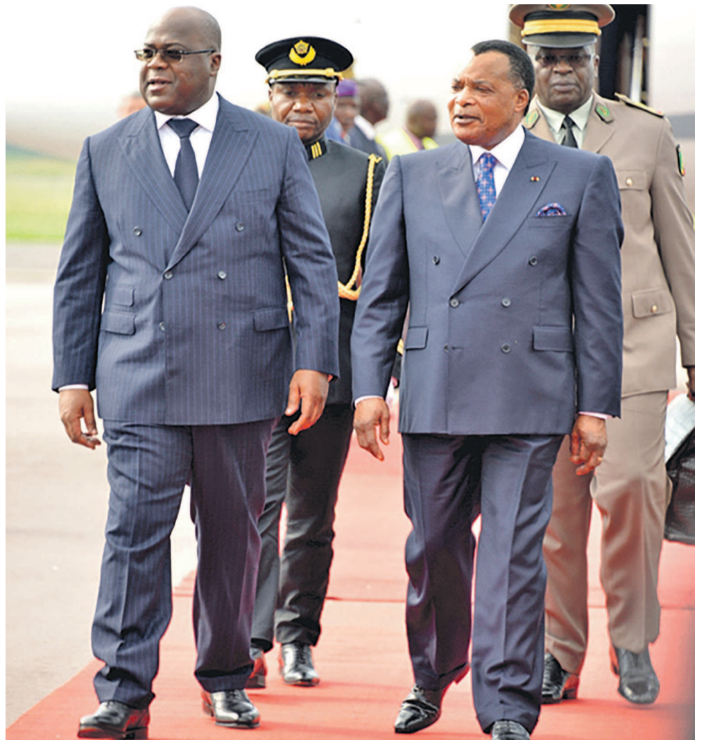
Les présidents Félix Tshisekedi et Denis Sassou N'Guesso, le 7 février à Maya-Maya

Les ressortissants de la RDC vivant à Brazzaville étaient venus en masse rendre hommage à celui qui, les cinq prochaines années, va conduire les destinées de leur pays.