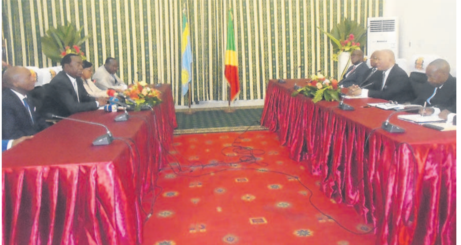
Isidore Mvouba et ses collaborateurs (à droite) s'entretenant avec la délégation rwandaise, le 7 février

Faisant le bilan de cette coopération régie par l'accord du 17 août 1982, le président de l'Assemblée nationale a indiqué qu'en trente-sept ans, les deux pays ont tenu au total quatre commissions mixtes de coopération, dont la dernière a été organisée en 2016 au Rwanda.