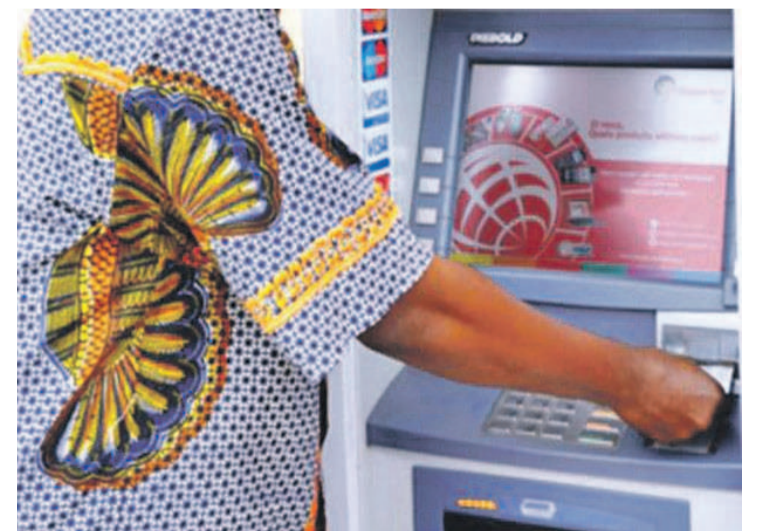
Les pratiques financières ont nettement évolué en RDC

La prolifération des fournisseurs n'a pas boosté l'accès et l'usage du digital dans le monde de la finance. Le défi à relever concerne la consolidation effective des réseaux d'agents de services financiers digitaux (mobile money, etc.) pour promouvoir une offre de qualité et adaptée aux besoins des acteurs économiques qui restent