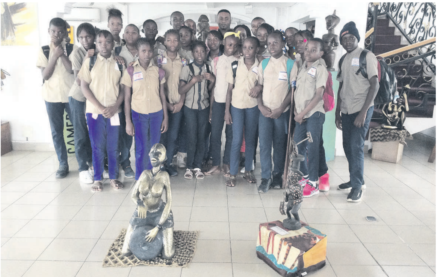
Les élèves du complexe scolaire Joseph-Perfection visitant le Musée Galerie du Bassin du Congo