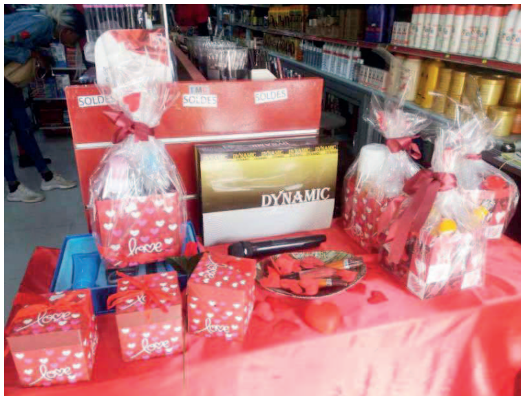
Timides achats de la Saint-Valentin dans les commerces

Au-delà de la crise, l'autre prétexte utilisé par les Congolais est la prière. Oui, il faut rendre gloire à Dieu. Donc pas de sortie ni de cadeaux. Les gens consacrent une partie de leur