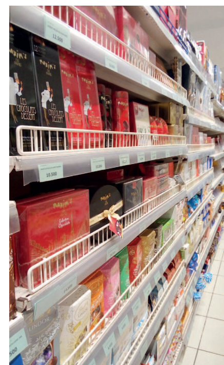
Quelques produits dans un super marché de la place

Consciente de l'euphorie des Congolais durant cette période, les marchands migrent vers des objets qui ont trait à Cupidon. Aussi