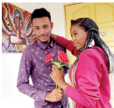
Un jeune couple exhibant une rose rouge/ Adiac

Pour terminer, nous voulons cette année vous faire découvrir le myosotis, plante peu connue mais nous espérons qu'elle vous incitera à la mettre sur votre liste de cadeau dorénavant, convaincue qu'elle vous séduira. Découvrons ensemble cette magnifique plante à l'histoire touchante. Nommé aussi « vergiss mich nicht » (ne m'oublie pas en allemand), l'histoire du myosotis est celle de deux amants qui se promènent le long du Danube (Allemagne) et qui ont été séduits par cette fleur d'un bleu éclatant. L'homme voulu en offrir à sa dulcinée et