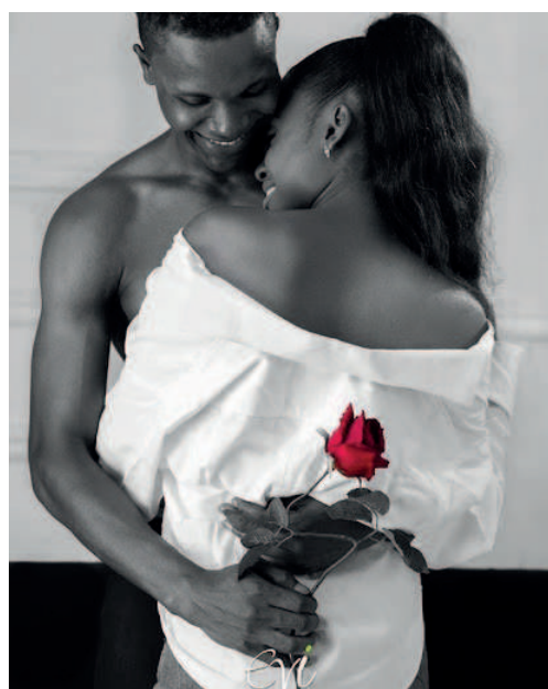
Protéger les ados contre les dérives

Il est donc nécessaire pour les parents de conscientiser leurs enfants de tous ces dangers qui les guettent. Il ne s'agit pas de mener la guerre aux ados mais plutôt de les mettre en garde et de les protéger sans pourtant s'immiscer dans leur vie sentimentale. L'idéal serait de se faire ami de son propre enfant dans le but d'aborder les questions de sexualité de façon responsable pour éviter les dérives dans