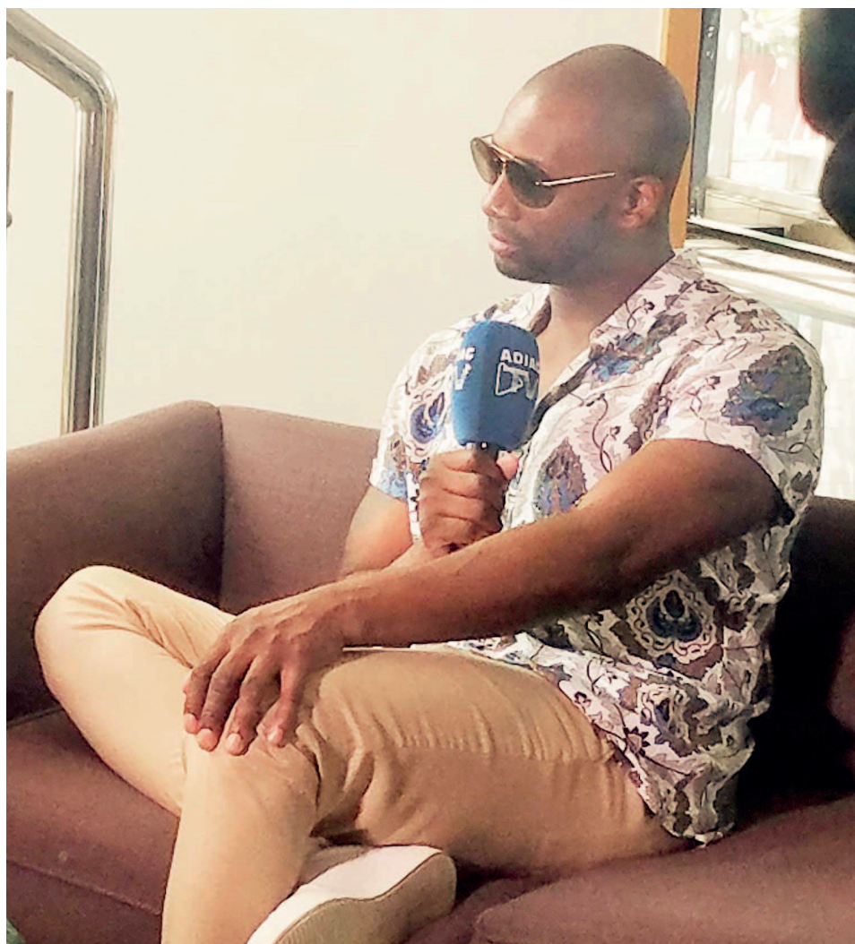
L'artiste Singuila lors de l'interview

Singuila : Cela dépend du moment, parce qu'au début quand on a aucun candidat. Il suffit que la voix soit vraiment belle pour se retourner, puis au bout d'un moment on a plusieurs belles voix. Et à partir de ce moment, c'est plus difficile pour les candidats, car ils doivent faire plus d'efforts. On a entre 10 et 12 candidats par équipe et il faut de la diversité parce que ces dix vont devoir concourir avec les dix candidats des autres coaches. Parfois, on tourne le fauteuil juste pour un coup de cœur, et parfois certains candidats choisissent la bonne chanson et suscitent le déclin.