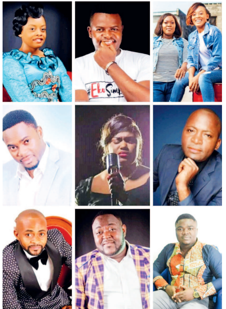
Les artistes gospel du Congo

Qu'elles soient en français, lingala, Kitumba, anglais ou diverses langues maternelles du Congo, les chants de ces artistes rencontrent du succès sur la toile et dans les salles. Ils chantent l'Évangile sous diverses thématiques : l'amour, l'espoir, la tolérance, la persévérance..., en partageant leur expérience personnelle avec Dieu mais aussi du vécu quotidien et des faits de sociétés que connaissent les chrétiens du pays. Enthousiastes, ils véhiculent les valeurs universelles