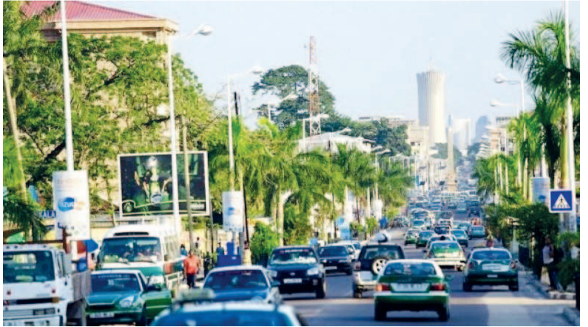
Une vue de l'avenue de la Paix

habitué des lieux. Comme dans une foire, à « Matongué » les buvettes et restaurants en plein air se succèdent. Autour des tables, des amis se retrouvent et discutent des sujets qui les passionnent. « Après le travail, je passe par Matongué afin de prendre une bière et discuter un peu et cela me permet d'évacuer mon stress de la journée », témoigne Cyr. « Nous offrons les meilleurs services et veillons à ce que nos clients consomment ce qui est frais », affirme Mari, actionnaire d'une terrasse. Entre ces retrouvailles, l'alcool coule à flots et la