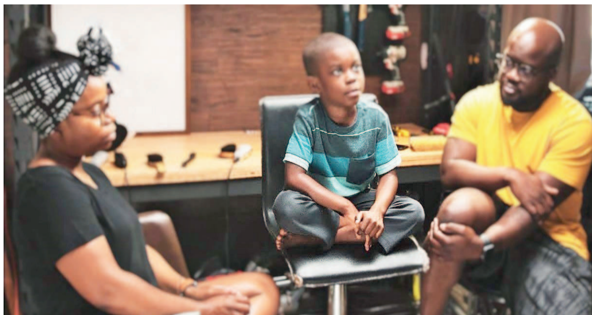
Une famille illustrant la discorde

Si vous vous y prenez à temps, vous aurez plus de chances de trouver une solution susceptible de convenir à tous. Oubliez vos envies de vengeance, ce n'est vraiment pas le moment pour faire payer à l'autre ses frasques. L'idéal, si vous êtes proches géographiquement, est de permettre à vos enfants de célébrer Noël chez l'un et le nouvel An chez l'autre. Sinon, de passer la veille des fêtes chez l'un avant que