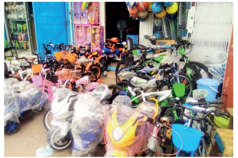
Devanture d'une boutique de jouets pour enfants

Patrick, l'un des commerçants interrogés au marché Total, révèle qu'avec le coronavirus tout le monde devient