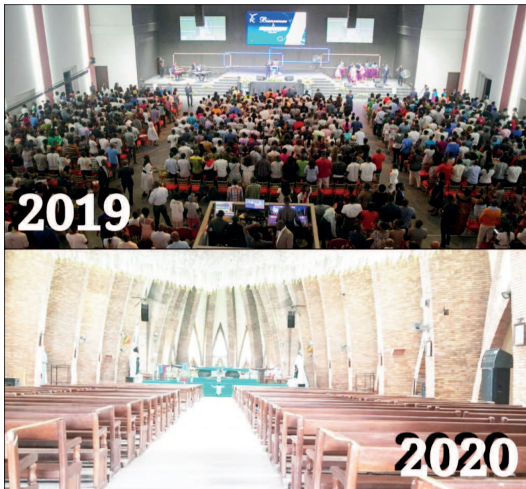
La nuit de prière du 31 décembre 2019 face à ce qu'il en sera cette année

Du côté des autres courants chrétiens, il n'est pas non plus évident de se réunir la nuit du 24 ou du 31 décembre parce que cela est passible de sanction. En attendant que le gouvernement se prononce sur la conduite à tenir durant cette période, certaines congrégations sont à pied d'œuvre pour préparer des nuits de prières en ligne le 31 décembre. Cultes auxquels chaque croyant pourra s'y associer depuis son domicile. « Vue la crise sanitaire que le pays traverse actuellement, c'est plutôt sage de procéder de la sorte. Bien évidemment que ça sera un peu triste et bizarre cette première fois mais nous n'avons pas le choix que de