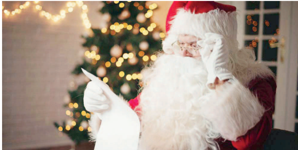
Un Père Noël consultant la liste des cadeaux

La célébration de la fête de Noël de cette année 2020 marquée par la pandémie de coronavirus (Covid-19) promet d'être différente, au regard des restrictions imposées par les pouvoirs publics interdisant les rassemblements de plus de cinquante personnes et la fermeture des lieux de jouissance tels que les bars dancing souvent pris d'assaut par des gamins.