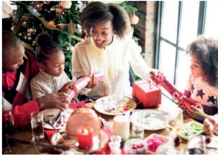
Noël en famille

Le 25 décembre est une fête familiale où les enfants sont rois. Alors pour fêter dignement la naissance de Jésus, vous pouvez commencer par déterminer un jour dans la semaine où vous et toute votre famille serez totalement disponibles. Décorez la maison à l'extérieur tout comme à l'intérieur, décorez le sapin avec des guirlandes, boules de Noël, nœud de Carla, Etoile de Noël, bougies, installez une crèche de Noël (pour les chrétiens) ... afin que les festivités soient en couleur. Mettez vos enfants, les plus âgés, à contribution pour que cette fête ne soit pas seulement un