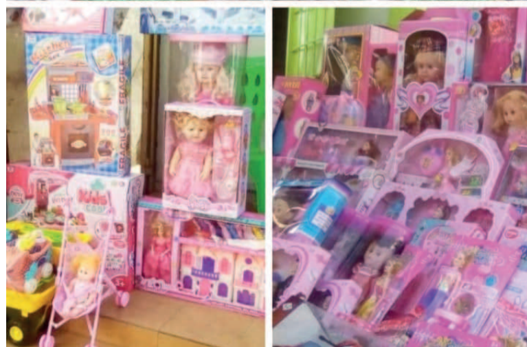
Jouets pour enfants et sapin de Noël en solde