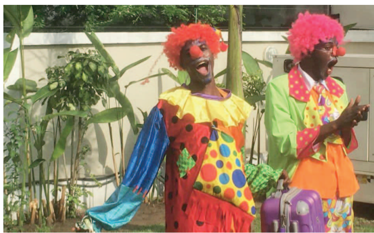
Les comédiens clownesques lors du spectacle

Noël est en approche pour redonner de la fraîcheur au regard de notre propre enfance. C'est une parenthèse du quotidien où chacun cherche son éclat de joie. On voyage sur le traîneau de nos envies, comme poussés par mille rennes, à se faufiler tantôt entre rayons de magasins, arts de la table, grand-messes ou vers un autre ailleurs. Dans l'empressement de cet autre ailleurs, il y a toujours cette voix qui nous dit : « Les enfants d'abord ! » Noël est leur moment sacré. A l'heure de nos folies douces, on se pose la question de savoir comment émerveiller leurs yeux. Et pour