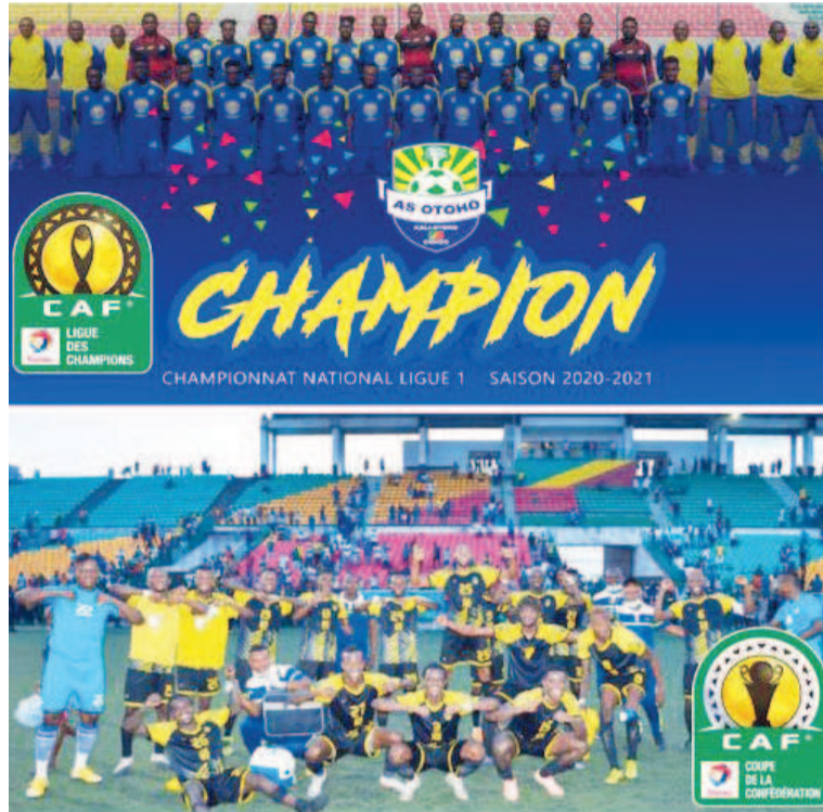
AS Otohô et Diables noirs représenteront le Congo aux compétitions continentales

En attendant le coup d'envoi de ces deux compétitions qui mettent aux prises les meilleurs clubs du continent, la Fédération congolaise de Football (Fécofoot) et les états-majors de ces deux équipes devraient déjà tout mettre en œuvre pour éviter les éliminations prématurées dont sont souvent victimes les