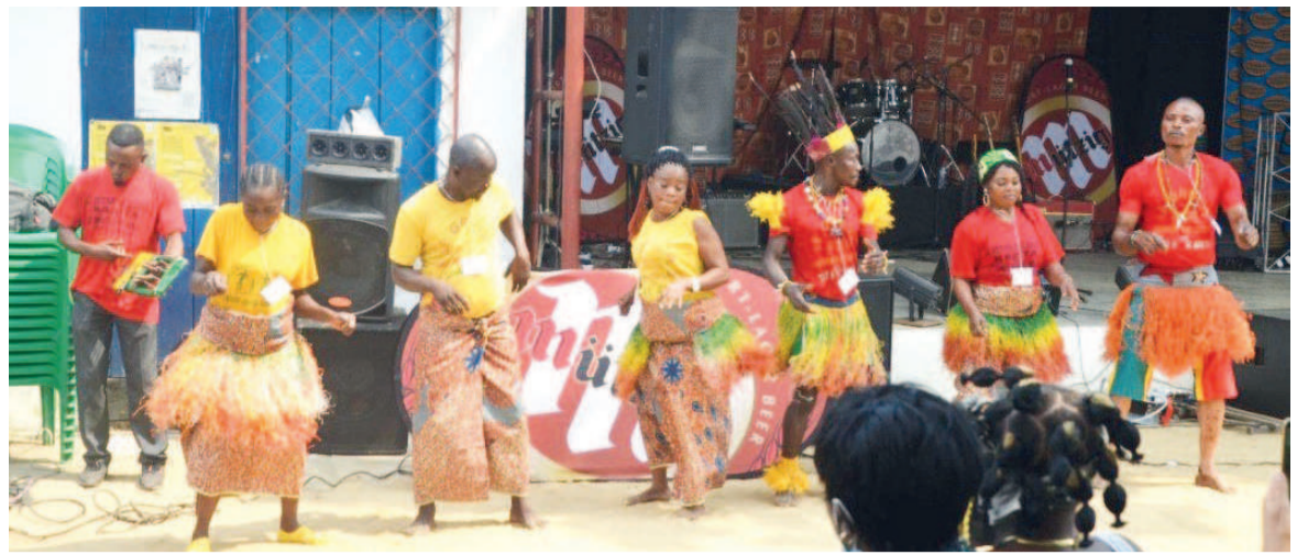
Fête de la musique à Pointe-Noire

ouverte à toutes les musiques, sans hiérarchie de genres ou de pratiques, et ouverte à la France entière ». Quarante années plus tard, la fête de la musique, célébrée dorénavant dans plus de 120 pays dans le monde, poursuit toujours sa route sur les cinq continents. Après un break musical en 2020 sur un air de coronavirus en manque de décibels, la fête de la musique organisée ce lundi 21 juin par l'Institut français du Congo (IFC) de Pointe-Noire, faisait donc son come back à Ponton La Belle. Entre mesures barrières et liberté retrouvée de pouvoir s'exprimer sur la scène, c'est à l'Espace culturel Yaro, dans le quartier de Loandjili, qu'artistes et groupes se sont succédé face à un