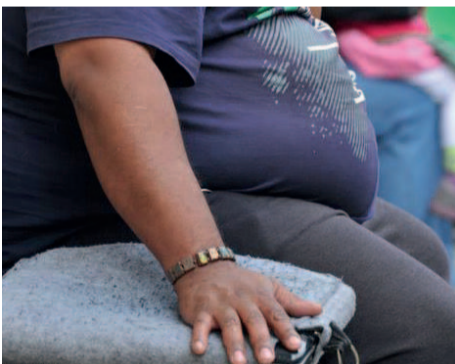
Une personne obèse