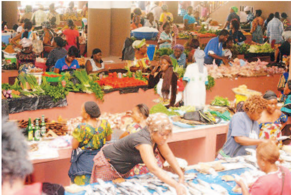
Une vue du marché Total

Le flux du trafic entre le Cameroun et Brazzaville, qui appro-