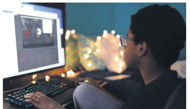
Vidéo en streaming

En quelques années, la consommation de la vidéo a totalement changé. L'accélération d'Internet et l'arrivée de géants comme Amazon, Apple ou Google ont transformé la manière de consommer les contenus. Par exemple, pour la première fois cette année, on ne regarde plus la Ligue 1 Uber Eats à la télévision, mais sur Internet depuis la plateforme Amazon