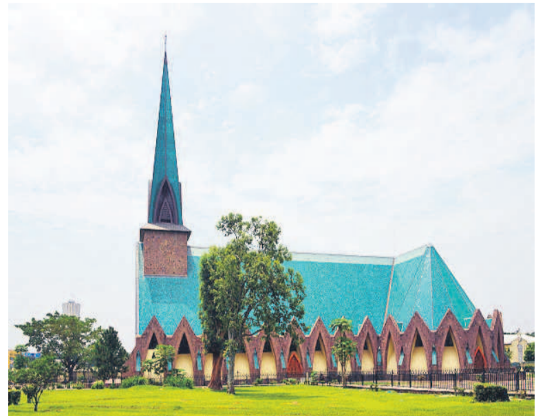
Une façade de la basilique Sainte-Anne

après les tragiques événements qu'a connus la capitale, Sainte-Anne aujourd'hui reste un endroit d'un charme fou qui séduit tout le monde, quelle que soit la nationalité. Le cœur de l'église est un endroit d'une quiétude incroyable, d'autant plus en plein cœur de la ville. Cette quiétude apaise et est le signe qu'au-delà des travaux des hommes, la providence a posé son sceau et initié cette volonté dans le cœur