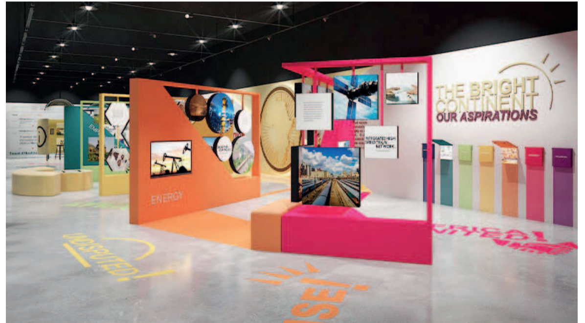
Une vue du pavillon

L'exposition Dubaï 2020 est un grand rendez-vous qui réunit les gouvernements, les acteurs du secteur privé, de la société civile, les organisations internationales et le grand public, pour partager les nouvelles idées, promouvoir le progrès et favoriser la coopération. Cette exposition universelle ouvre donc de nouveaux marchés, offrant aux pays africains