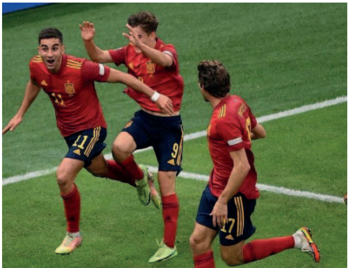
L'équipe espagnole célébrant l'ouverture du score